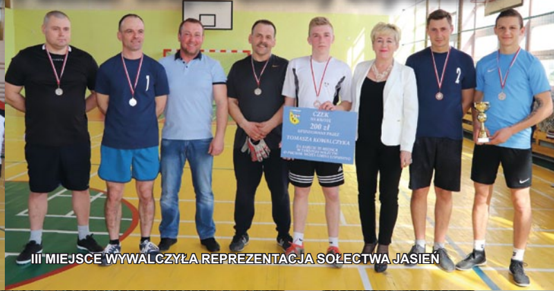
III MIEJSCE WYWALCZYŁA REPREZENTACJA SOŁECTWA JASIEN