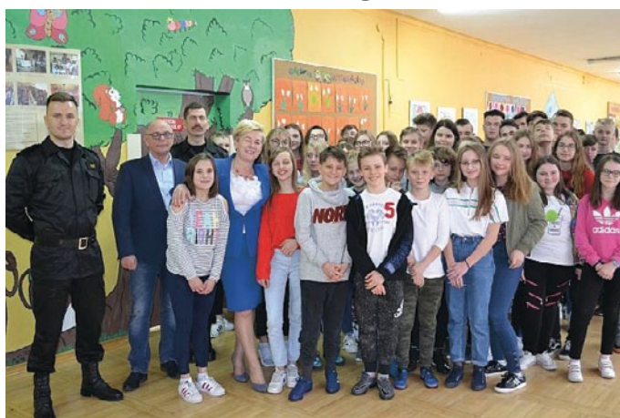
GMINNE ELIMINACJE TURNIEJU WIEDZY POŻARNICZEJ

uczniowie klas I-VI szkół podstawowych, uczniowie klas VII-VIII szkół podstawowych i gimnazjum oraz uczniowie szkół ponadgimnazjalnych.