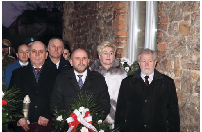
PRZYBYŁE NA UROCZYSTOŚĆ DELEGACJE ZŁOŻYŁY WIĄZANKI I ZNICZE PRZY PAMIĄTKOWEJ TABLICY NA ŚCIANIE ŁOPUSZAŃSKIEGO INTERNATU

Kolejne spotkania już wkrótce. W planach warsztaty kulinarne, z aromaterapii, tworzenia naturalnych kosmetyków i perfum, spotkania z dietetykiem i wiele innych.