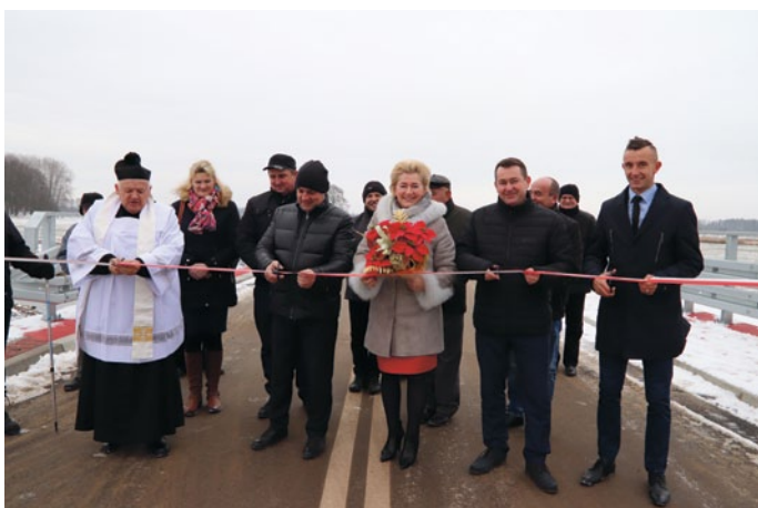
UROCZYSTE OTWARCIE NOWEGO MOSTU W SKAŁCE POLSKIEJ