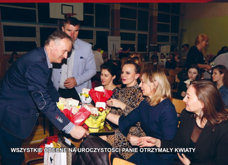
WSZYSTKIE OBECNE NA UROCZYSTOŚCI PANIE OTRZYMAŁY KWIATY