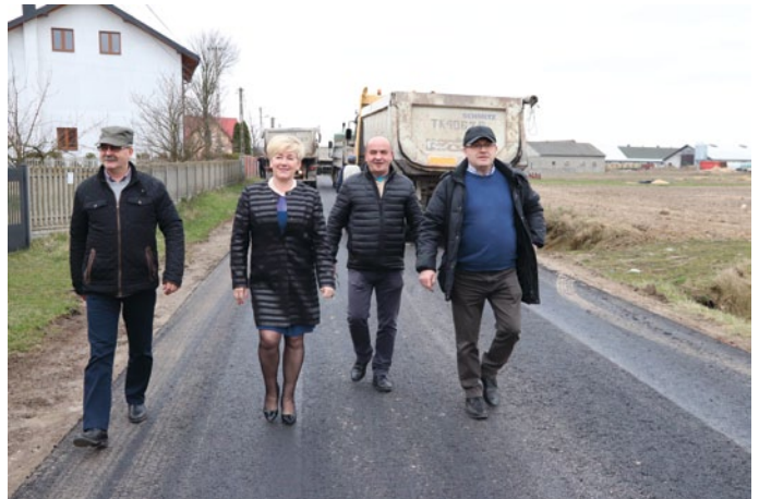
MIESZKAŃCY SARBIC DRUGICH KORZYSTAJĄ JUŻ Z NOWEJ DROGI. WYREMONTOWANO ODCINEK MIERZĄCY 1600 M.B.