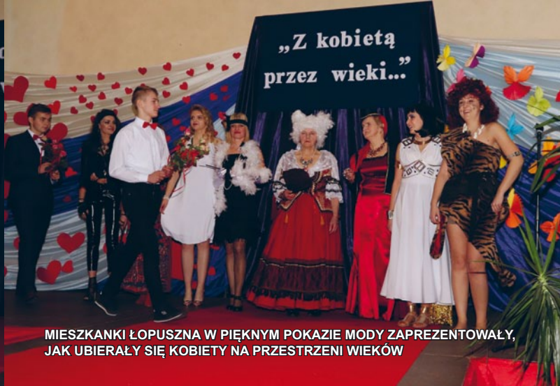
MIESZKANKI ŁOPUSZNA W PIĘKNYM POKAZIE MODY ZAPREZENTOWAŁY, JAK UBIERAŁY SIĘ KOBIETY NA PRZESTRZENI WIEKÓW