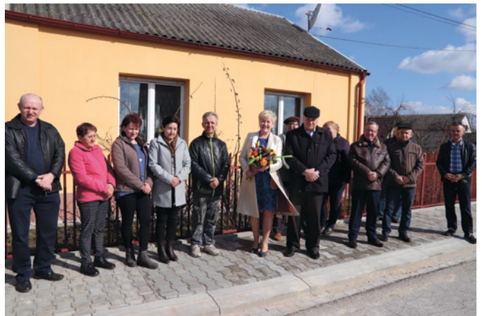
ODBIÓR CHODNIKA W FANISŁAWICZKACH