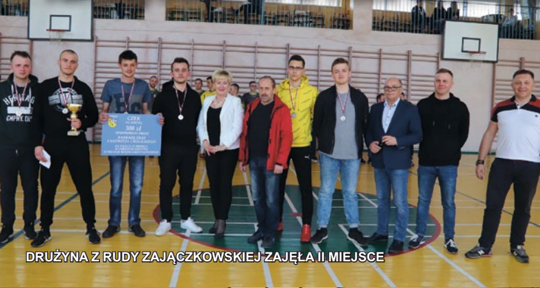
DRUŻYNA Z RUDY ZA JĘCZKOWSKIEJ ZAJĘŁA II MIEJSCE