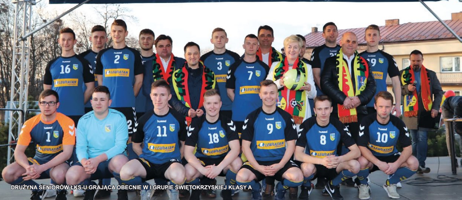
DRUŻYNA SENIORÓW ŁKS-U GRAJĄCA OBECNIE W I GRUPIE ŚWIĘTOKRZYSKIEJ KLASY A