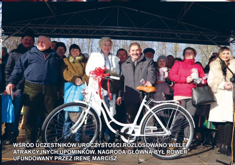
WŚRÓD UCZESTNIKÓW UROCZYSTOŚCI ROZŁOSOWANO WIELE ATRAKCYJNYCH UPOMINKÓW. NAGRODĄ GŁÓWNA BYŁ ROWER UFUNDOWANY PRZEZ IRENĘ MARCISZ