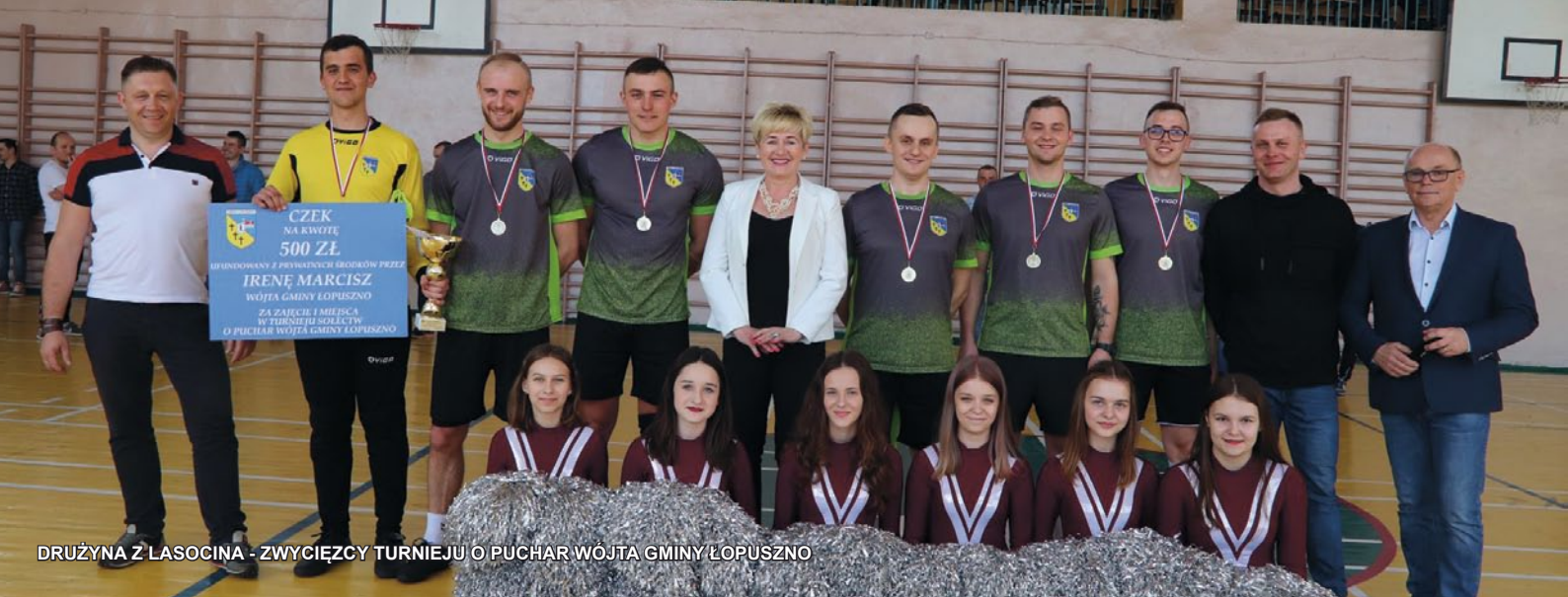
DRUŻYNA Z LASOCINA - ZWYCIĘZCY TURNIEJU O PUCHAR WÓJTA GMINY ŁOPUSZNO