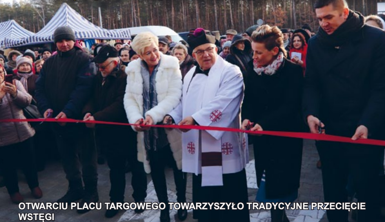
OTWARCIU PLACU TARGOWEGO TOWARZYSZYŁO TRADYCYJNE PRZECIĘCIE WSTĘGI