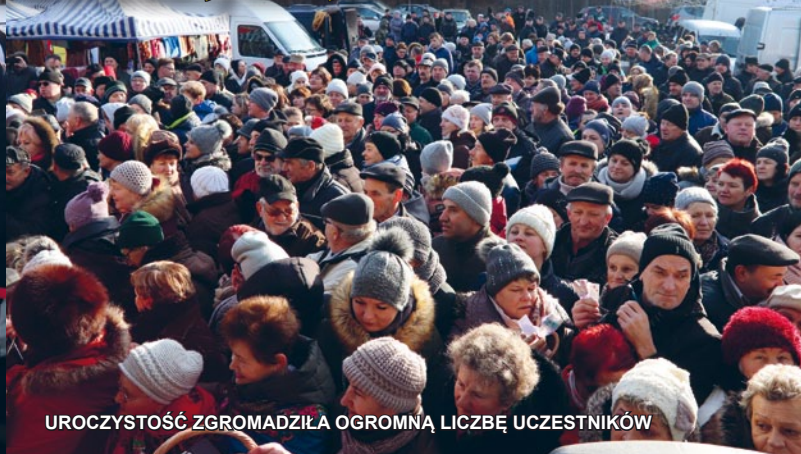
UROCZYSTOŚĆ ZGROMADZIŁA OGROMNĄ LICZBĘ UCZESTNIKÓW