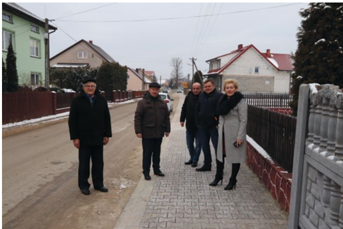
ODBIÓR CHODNIKA W JEDLU