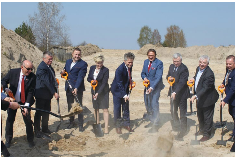
PIERWSZE WBICIE ŁOPAT NA BUDOWIE DROGI WOJEWÓDZKIEJ NR 728. WYREMONTOWANY ODCIOSEK POŁĄCZY GMINY ŁOPUSZNO I RADOSZYCE

9 kwietnia 2019 roku odbyła się uroczysta inauguracja prac przy budowie drogi wojewódzkiej nr 728 biegnącej od Łopuszna przez gminę Radoszyce do skrzyżowania z drogą krajową nr 74. To niezwykle ważna inwestycja z punktu widzenia mieszkańców Łopuszna. Dlatego władze gminy zabiegały o nią od lat . Wspomniany odcinek jezdni jest w opłakanym stanie. Nawierzchnia jest dziurawa, wykruszona i pełna kolein. Zagrozała bezpieczeństwu podróżnych i stwarzała uciążliwość wszystkim mieszkającym w sąsiedztwie. W najbliższym czasie to się jednak zmieni. Za sprawą starań gmin Łopuszno i Radoszyce, które zdecydowały się na własny koszt przygotować dokumentację koncepcyjną przebudowy tej drogi wartą blisko 500 tys. zł, oraz przychylności władz wojewódzkich, remont stał się faktem.