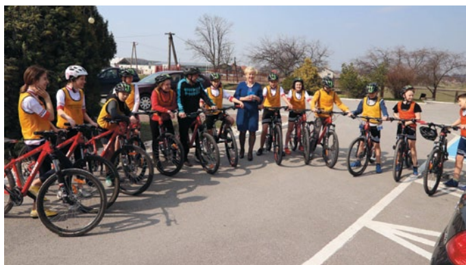
ZAWODNICY SZKÓŁKI KOLARSKIEJ ODWIEDZILI PANIĄ WÓJT