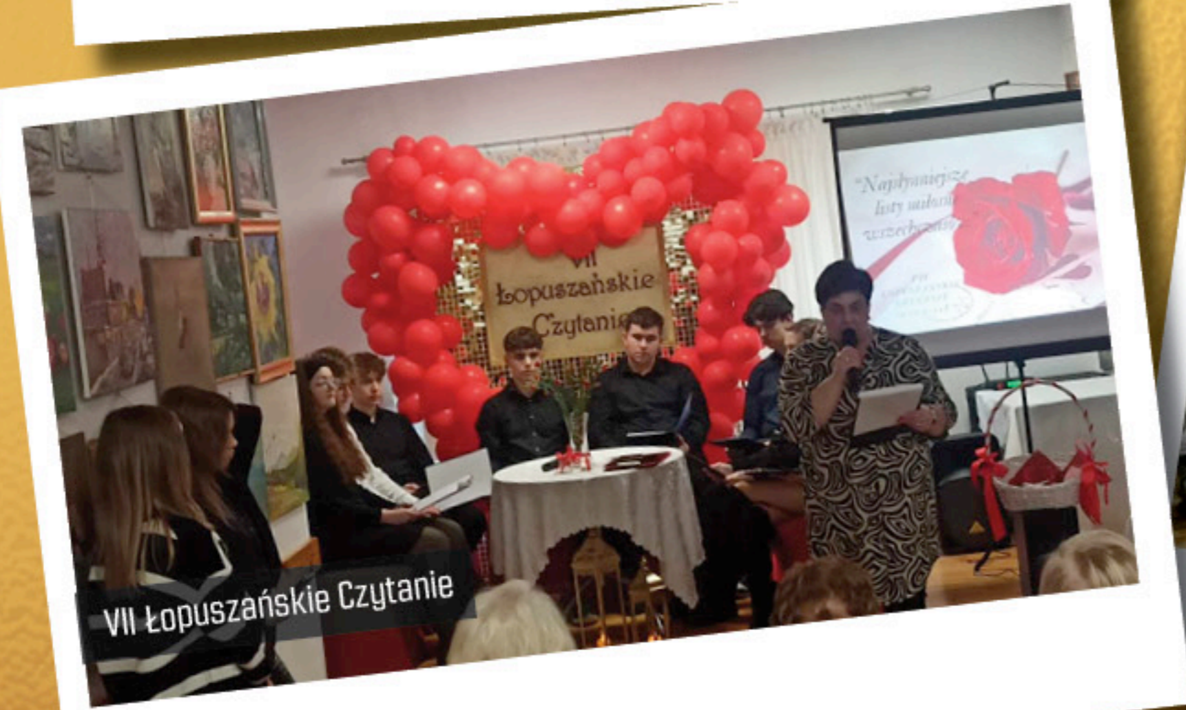
VII Łopuszańskie Czytanie