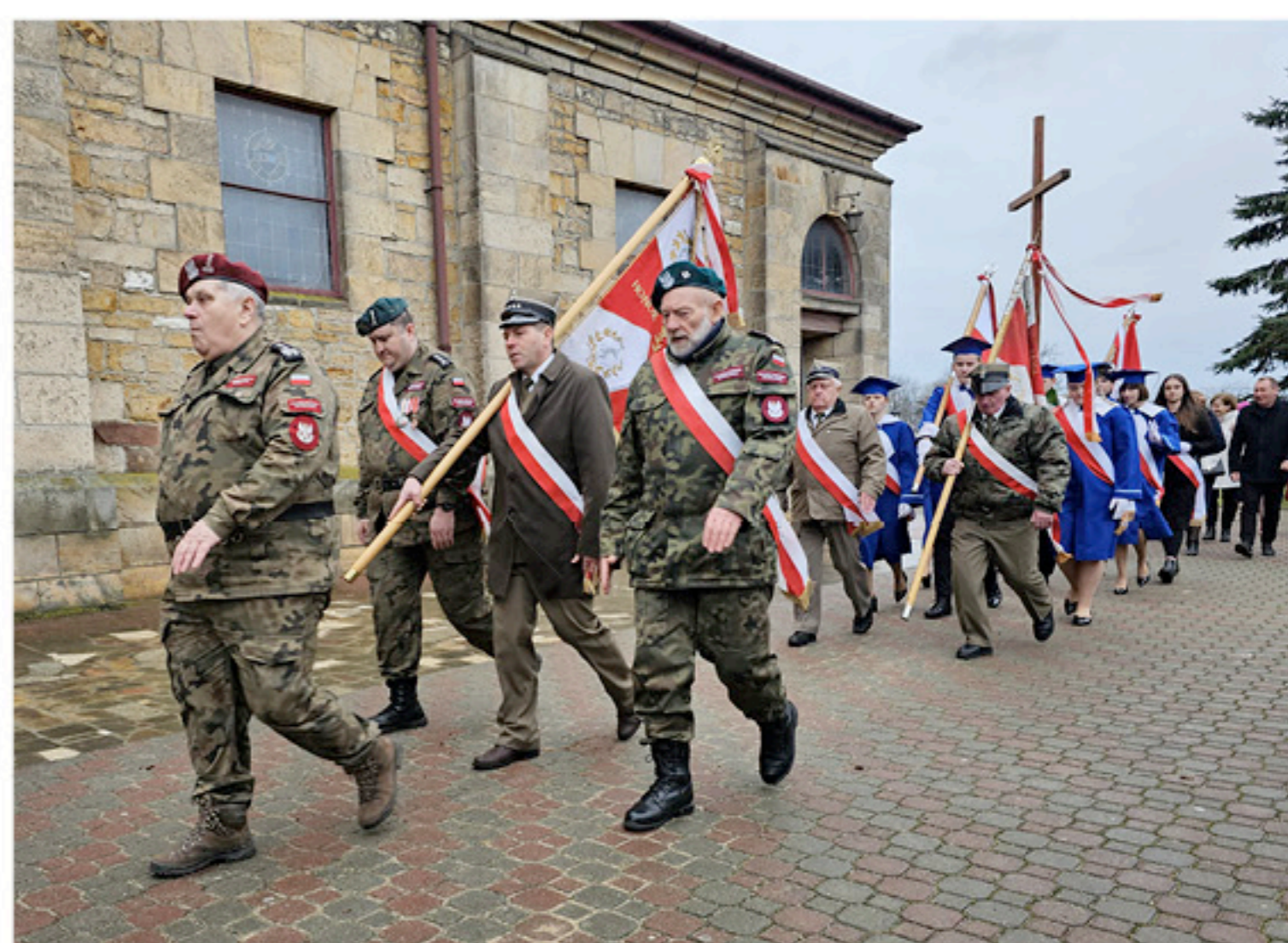
Poczty sztandarowe i przedstawiciele młodzieży z aktywnym udziałem

W niedzielę 11.02.2024 r. obchodzono 82. rocznicę utworzenia Armii Krajowej.