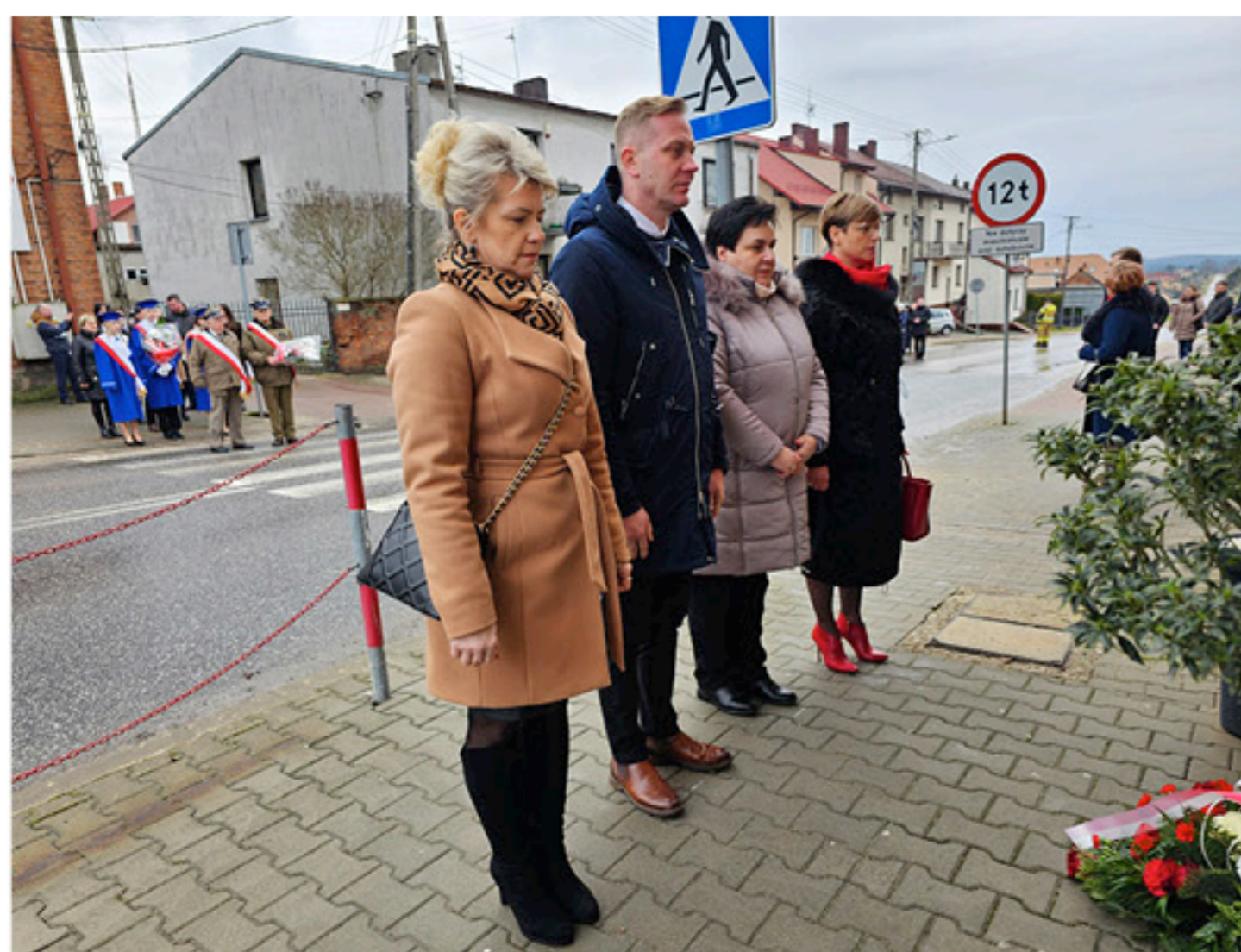
Dyrektorzy i kierownicy miejsko - gminnych jednostek organizacyjnych składają okolicznościowe wiązanki