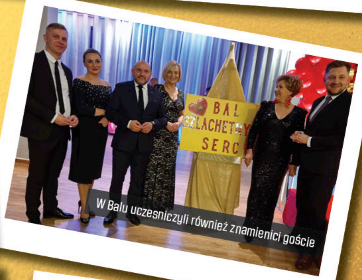
W Balu uczestniczyli również znamienici goście