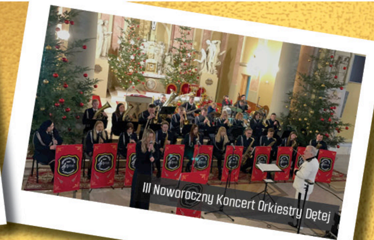
III Noworoczny Koncert Orkiestry Dętej