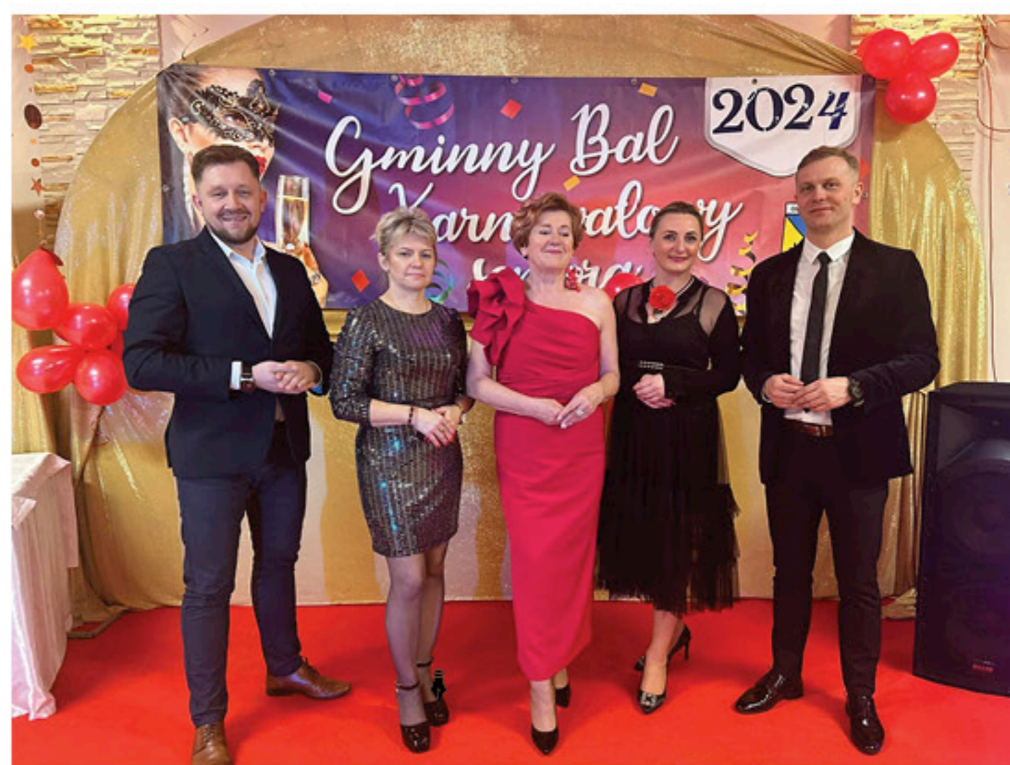
Organizatorzy Gminnego Balu Karnawałowego