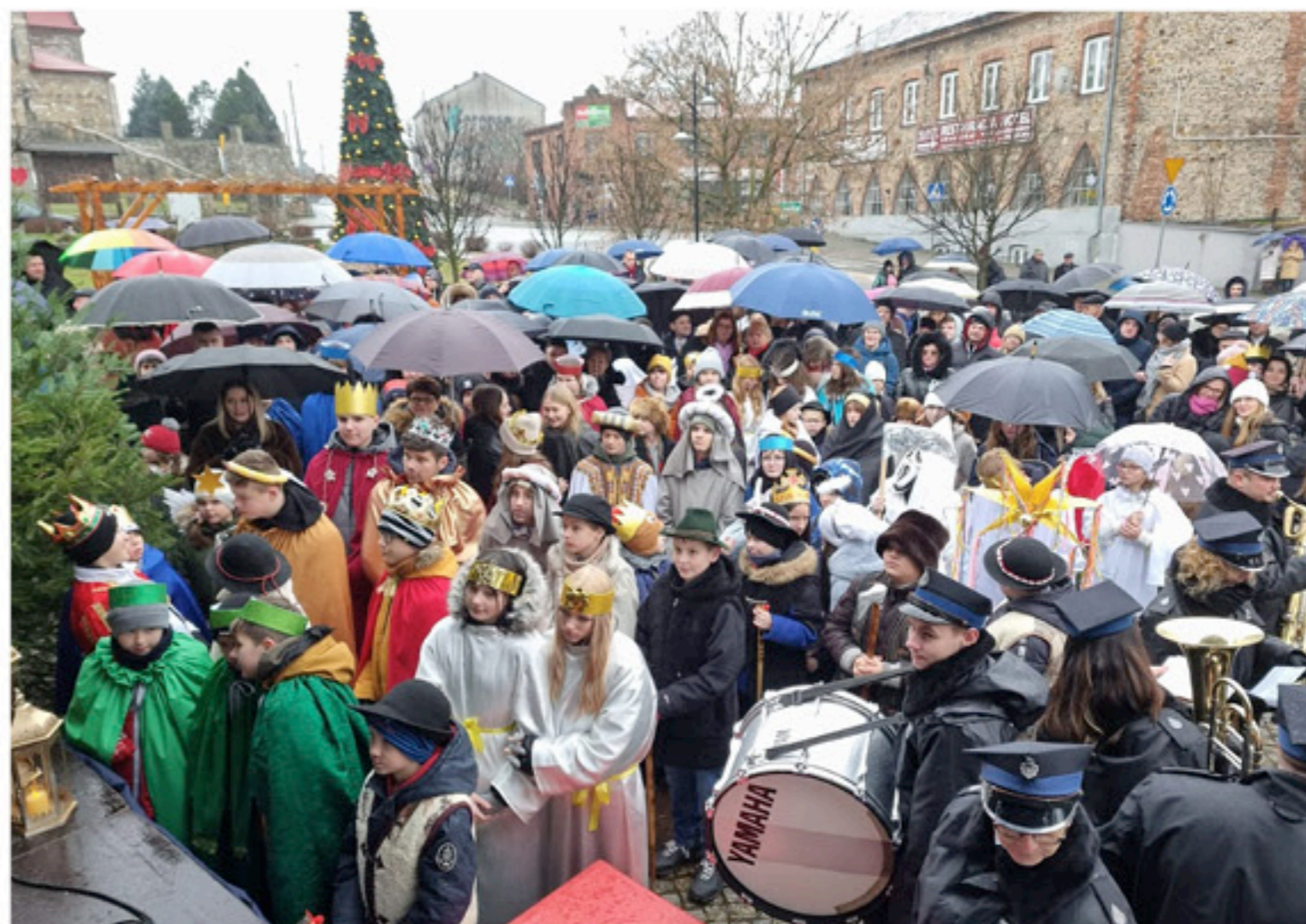
Pomimo niekorzystnej aury wydarzenie cieszyło się licznym udziałem