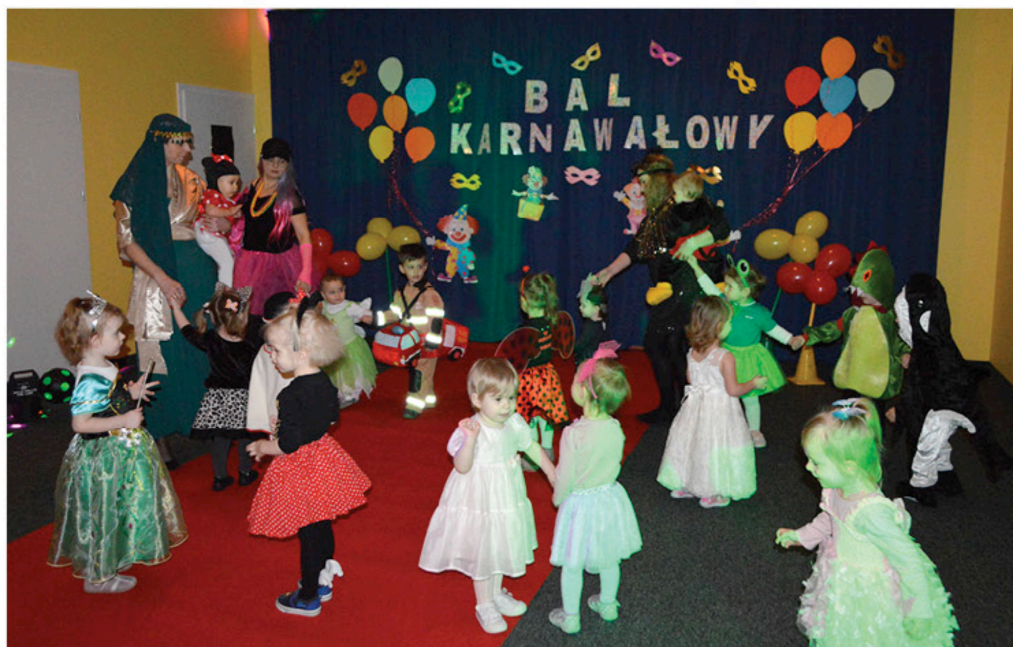
Bajkowe postacie odwiedziły Żłobek

B al karnawałowy dla żłobkowiczów to dzień niezwykły i bardzo wyczekiwany. Jest atrakcją uwielbianą przez dzieci, dostarczającą