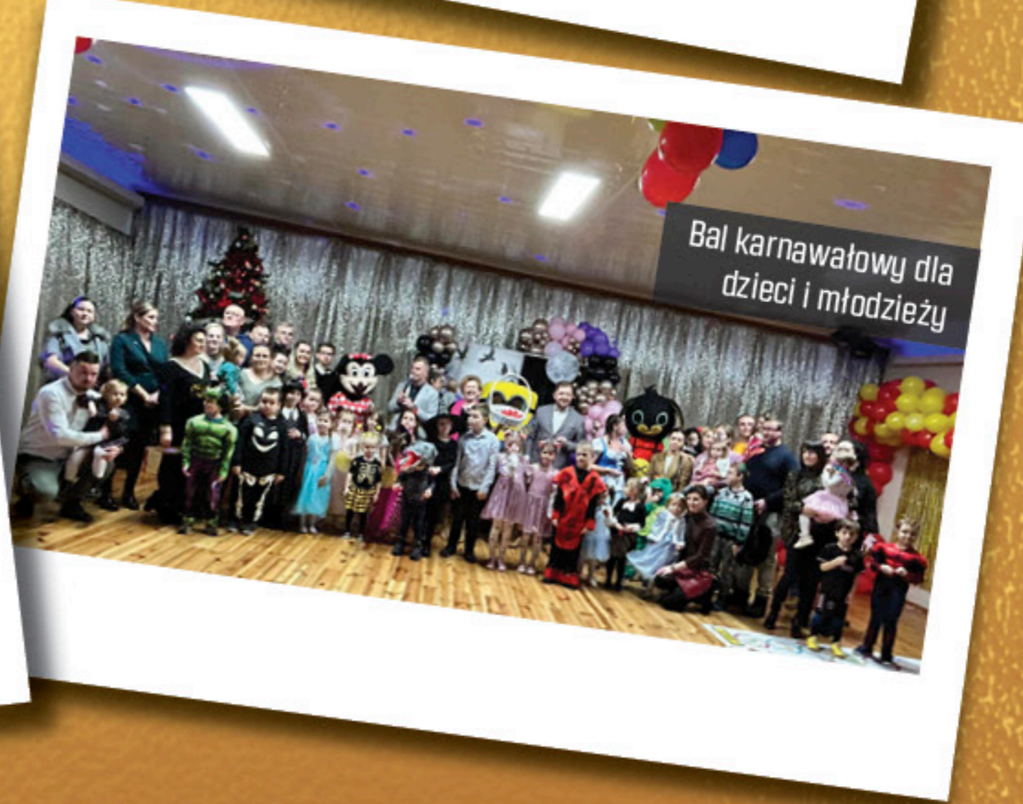
Bal karnawałowy dla dzieci i młodzieży