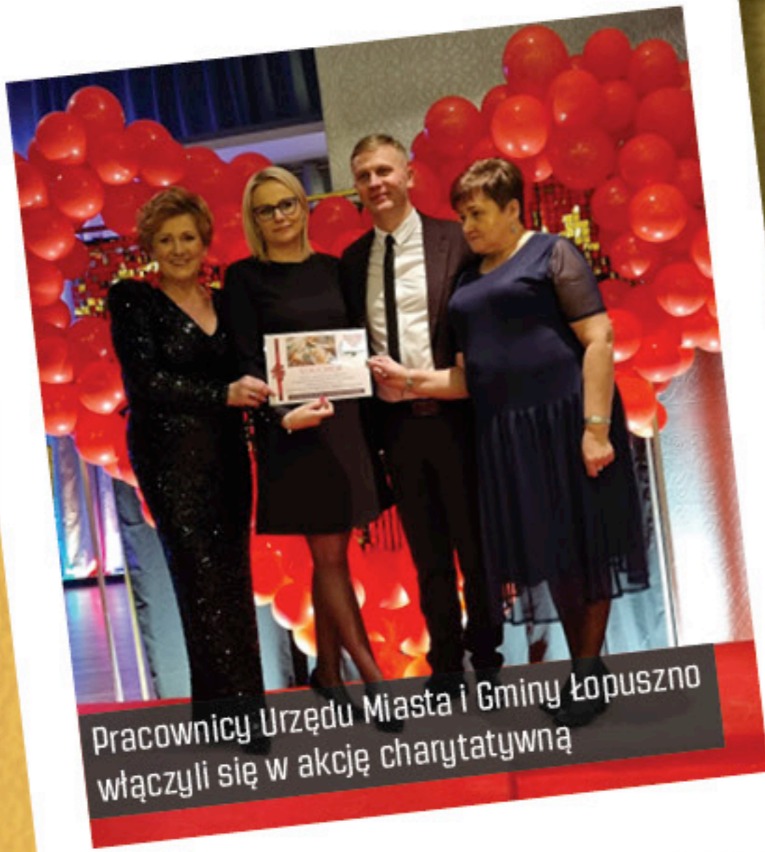
Pracownicy Urzędu Miasta i Gminy Łopuszno włączyli się w akcję charytatywną