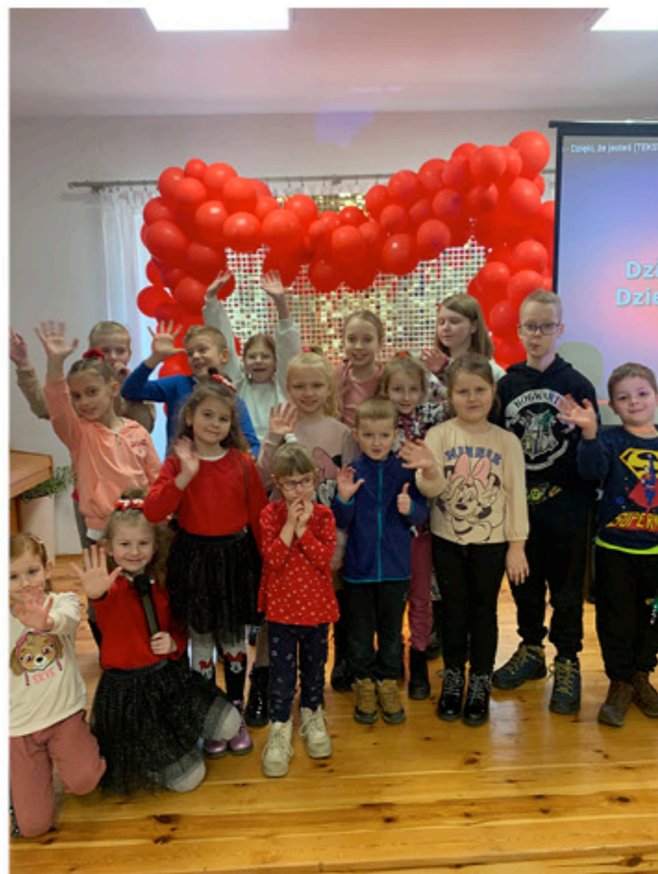
Wszechobecna radość na twarzach uczestników ferii