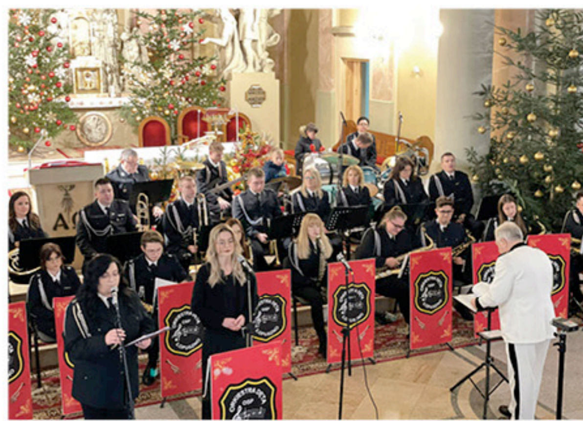
Członkowie Orkiestry Dętej kultywują tradycję