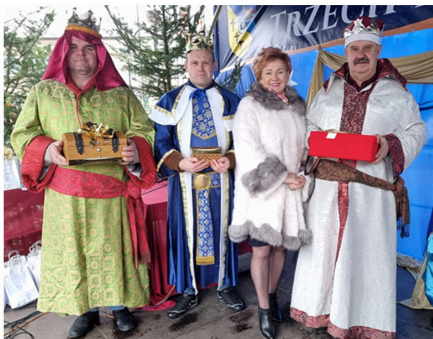
Sołtysi wystąpili w roli Trzech Króli