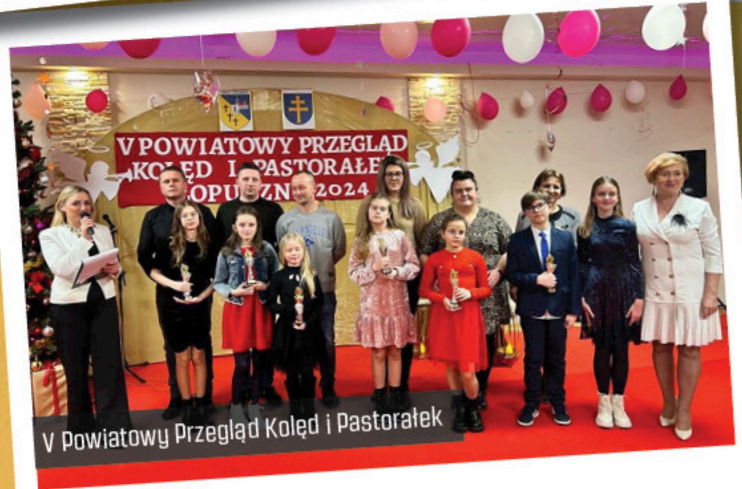
V Powiatowy Przegląd Kolęd i Pastoralek