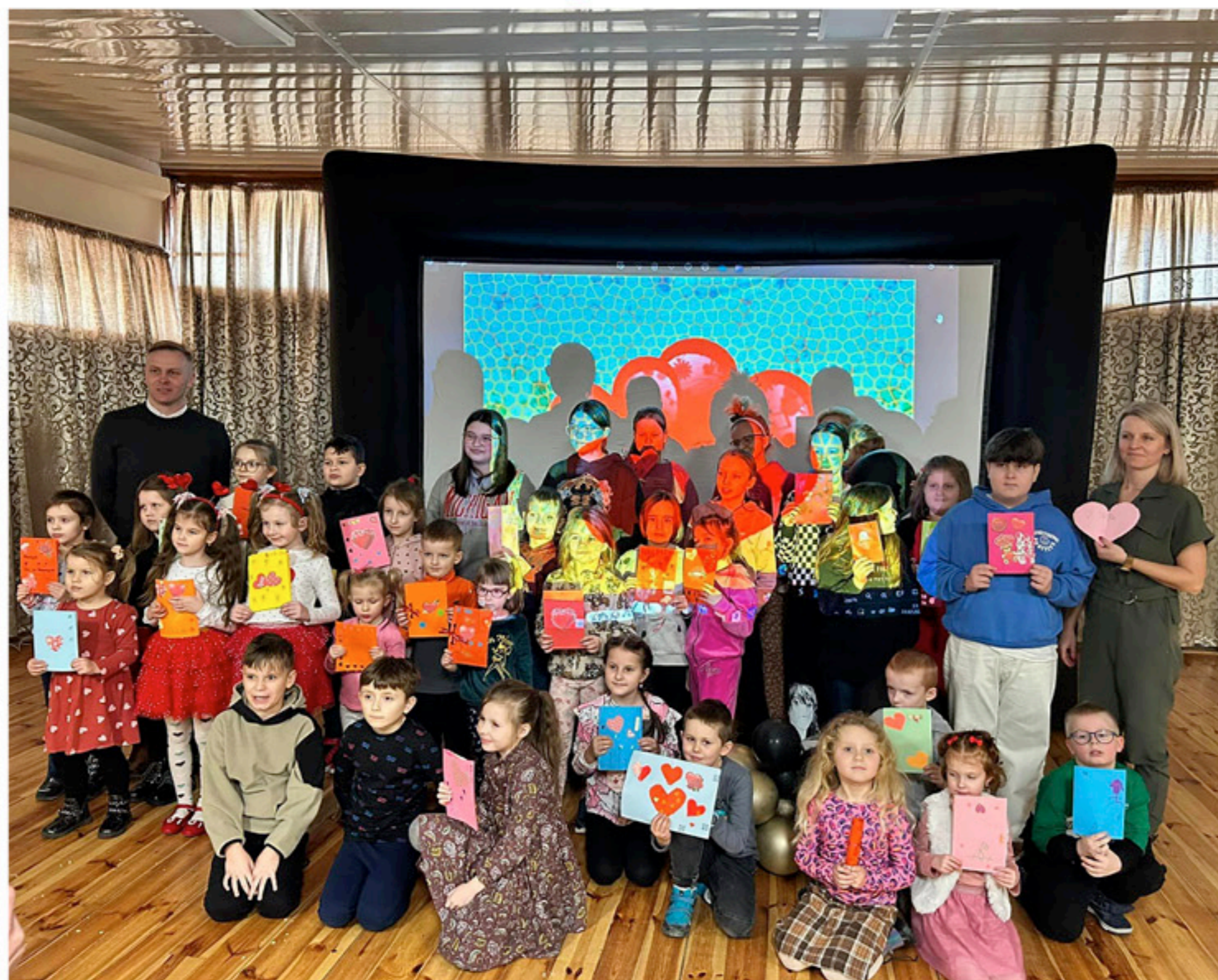
Akcja Ferie 2024 cieszyła się zainteresowaniem najmłodszych

K ino, warsztaty walentynkowe, dobra zabawa, popcorn, pizza, słodki poczęstunek to wszystko w ramach Akcji Ferie 2024 zapewnił Miejsko Gminny Ośrodek Sportu i rekreacji w Łopusznie.