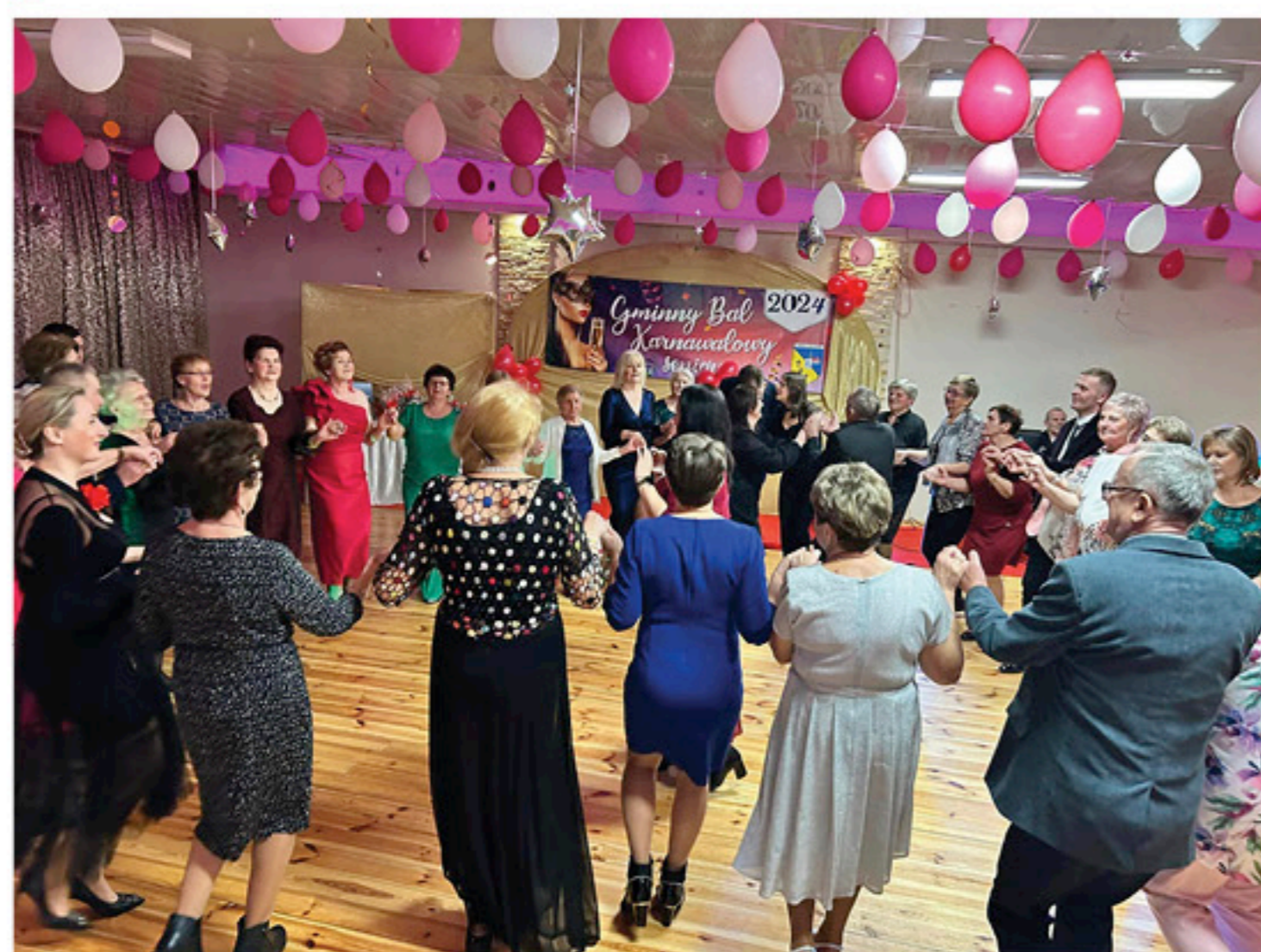
Zabawa trwała w najlepsze