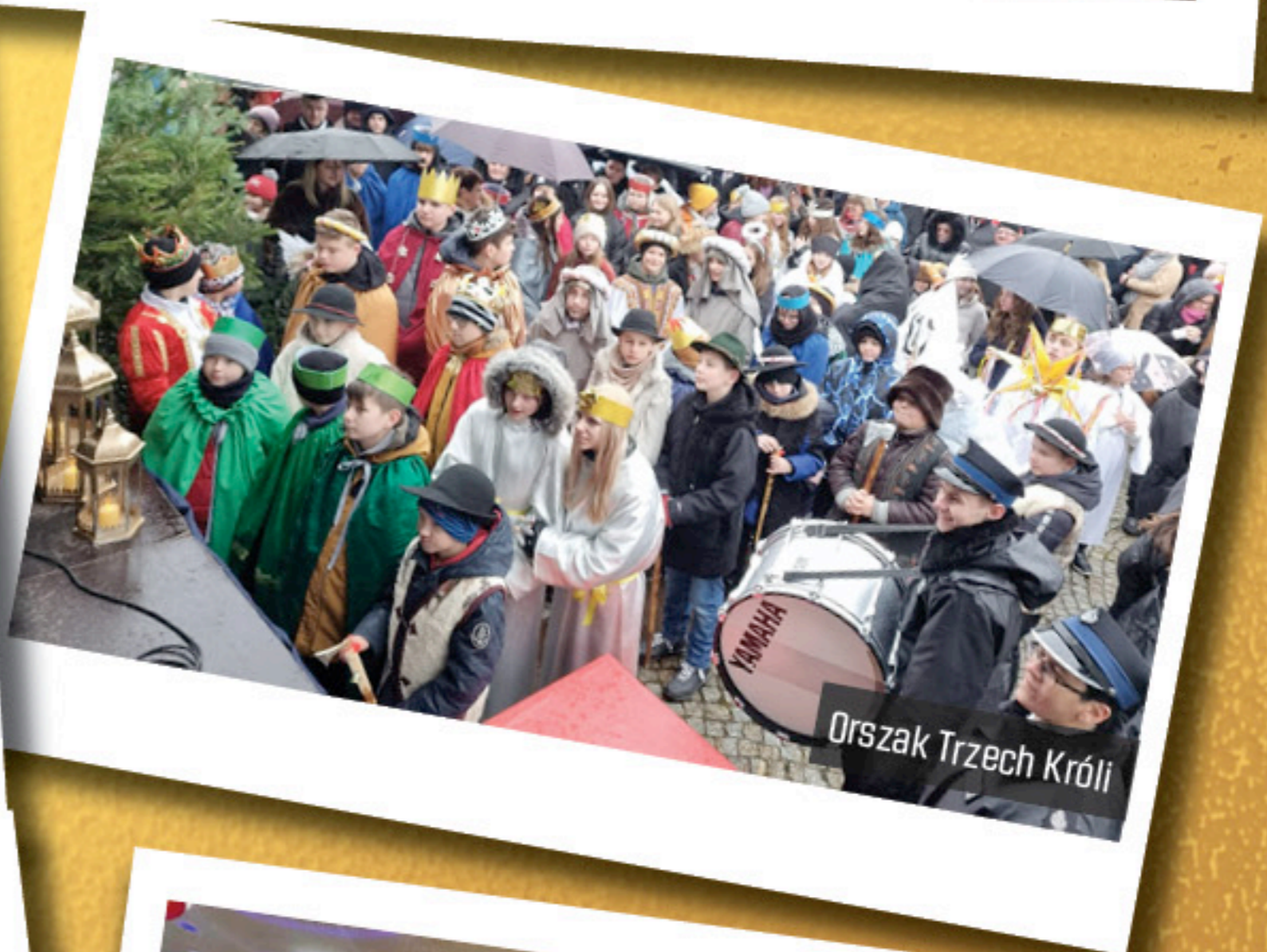
Orszak Trzech Króli