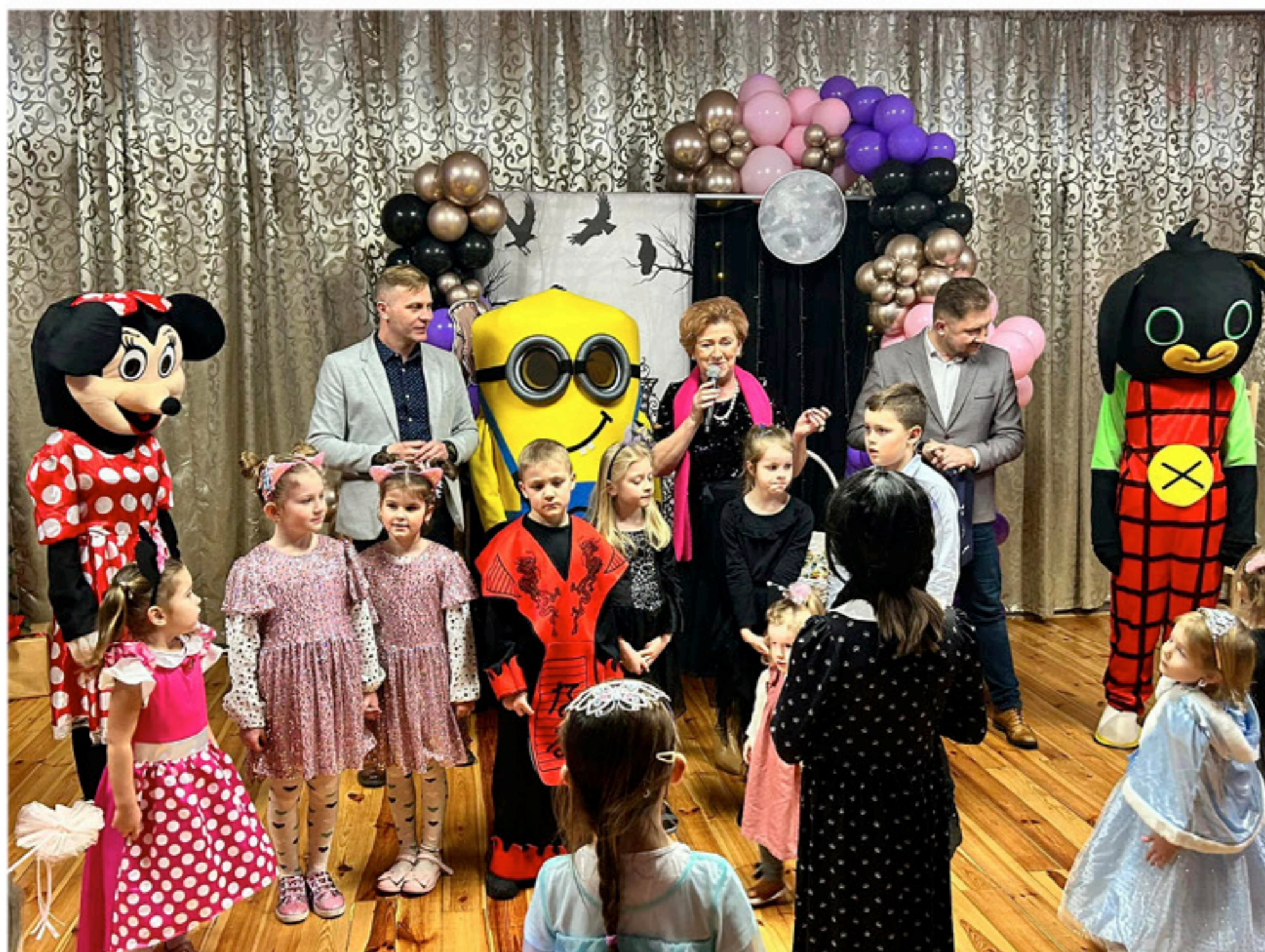
Wydarzeniu towarzyszyło wiele atrakcji przygotowanych przez organizatorów

B stycznia 2024 roku na terenie Miejsko-Gminnego Ośrodka Sportu i Rekreacji w Łopusznie odbył się zorganizowany przez Burmistrza Miasta i Gminy Łopuszno, w ścisłej współpracy z MGOSIR i MGOK, w wyjątkowo pozytywnej atmosferze, bal karnawałowy dla dzieci z terenu miasta i gminy Łopuszno.