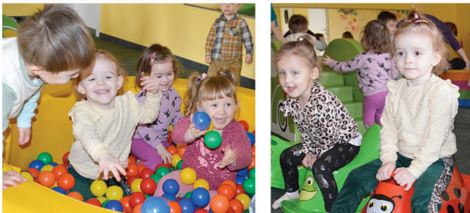
Uśmiech na twarzach naszych milusińskich

"Kiedy śmieje się dziecko, śmieje się cały świat"