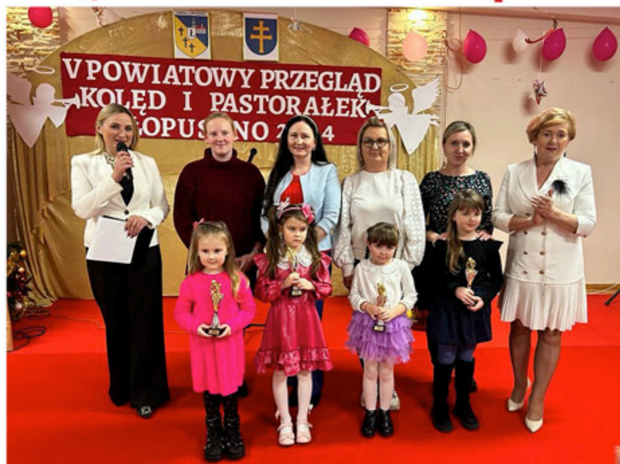
Zwycięzcy kategorii soliści do lat 6