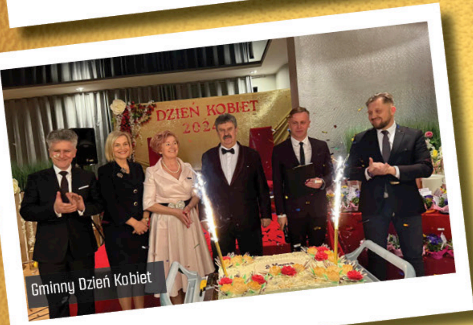
Gminny Dzień Kobiet