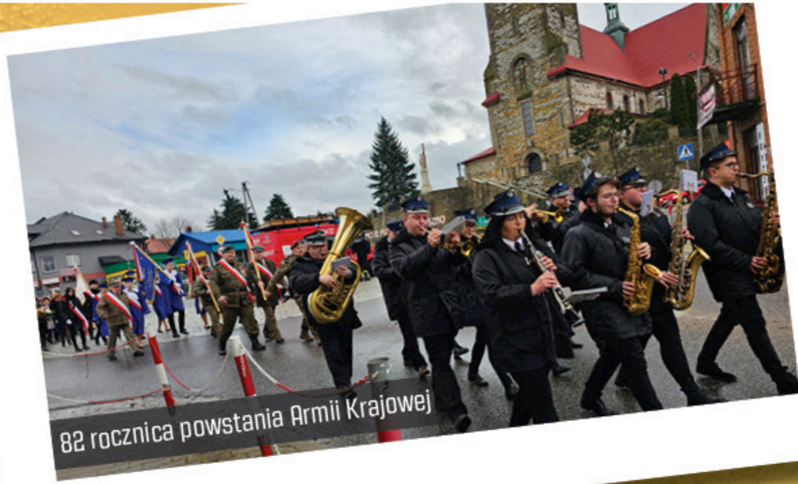
82 rocznica powstania Armii Krajowej