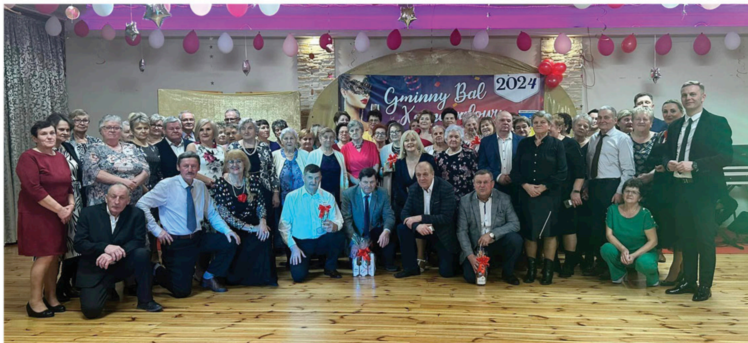
Prawdziwe święto seniorów miasta i gminy Łopuszno