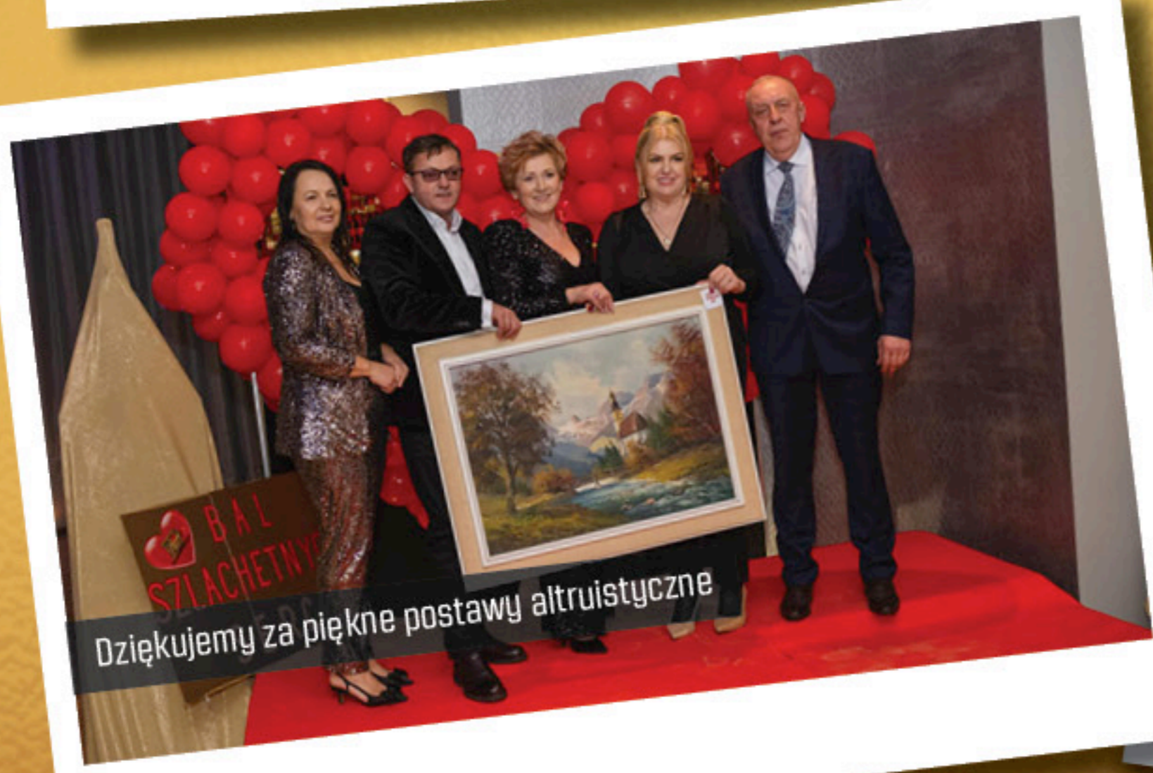
Dziękujemy za piękne postawy altruistyczne