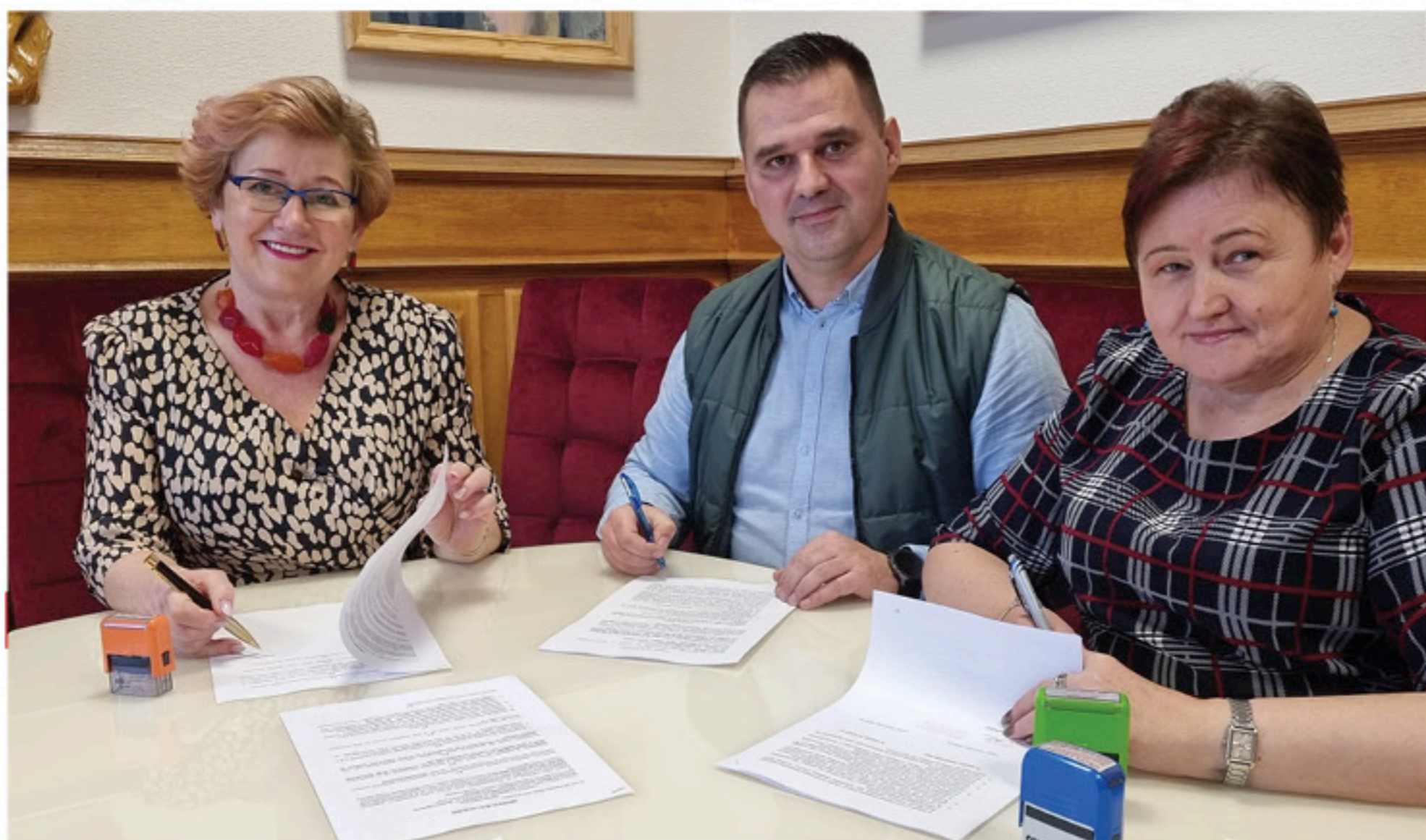
Oficjalne podpisanie umowy z Przedsiębiorstwem Robót Inżynieryjnych