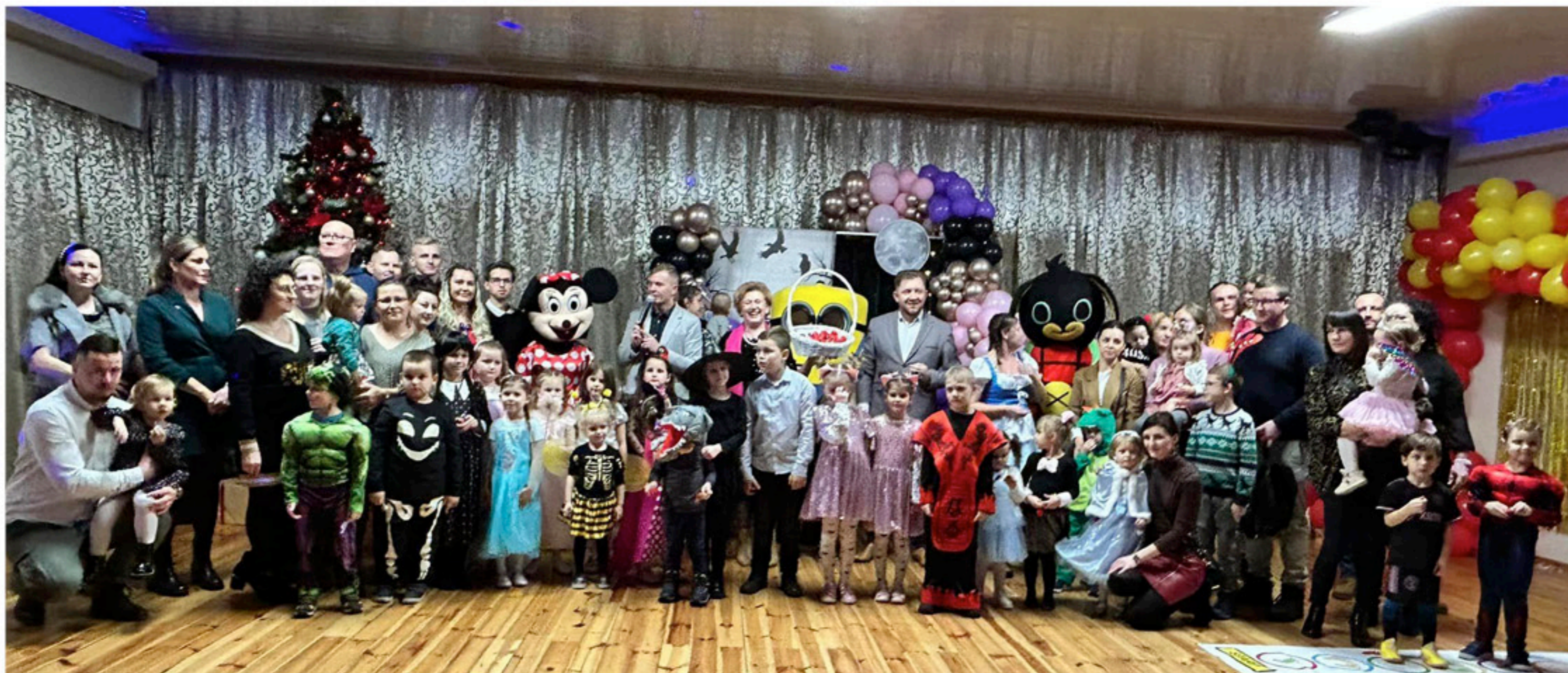
Bal karnawałowy dla dzieci i młodzieży