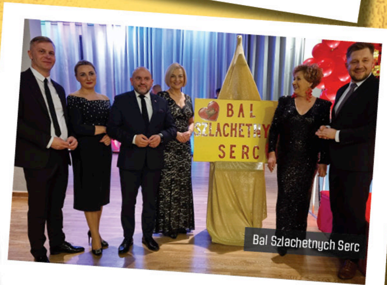
Bal Szlachtetnych Serc