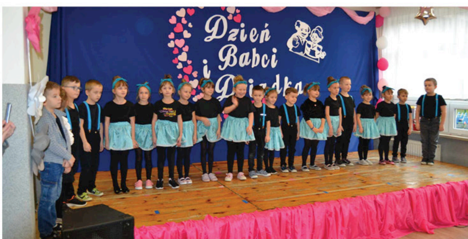
Uczniowie przygotowali wspaniałe występy artystyczne

Kocha Babcię i Dziadusia każdy wnuczek, każda wnusia...". Te wzruszające słowa piosenki rozbrzmiewały podczas Dnia Babci i Dziadka w Szkole Podstawowej im. Stefana Żeromskiego w Gnieździskach.