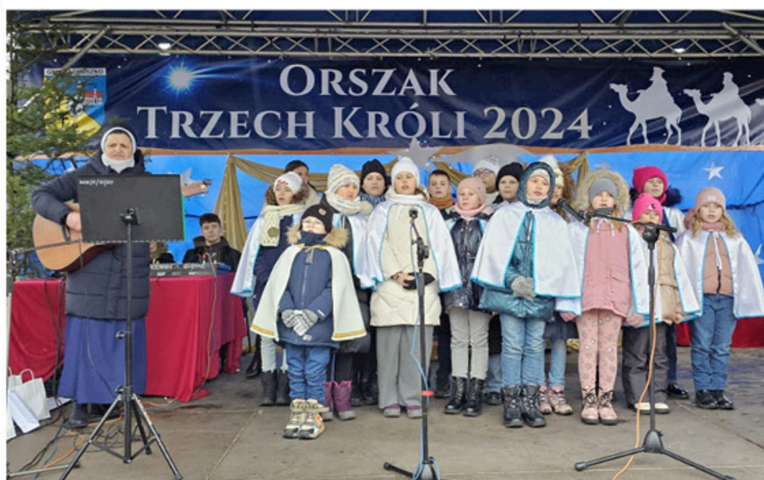
Młodzi artyści zaprezentowali swoje talenty wokalne