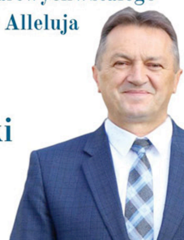
Mirosław Gębski Starosta Kielecki