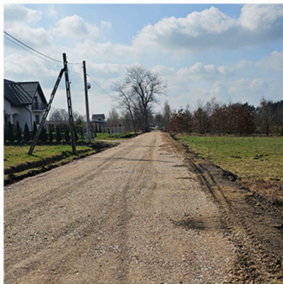
Przebudowa drogi poprawi komfort i bezpieczeństwo

W lutym br. zostały podpisane umowy na wykonanie dwóch dróg gminnych, które otrzymały wsparcie w ramach rządowego funduszu rozwoju dróg. Wsparciem zostały objęte zadania dotyczące remontu drogi gminnej w msc. Fanisławice oraz przebudowy drogi wewnętrznej w msc. Marianów.