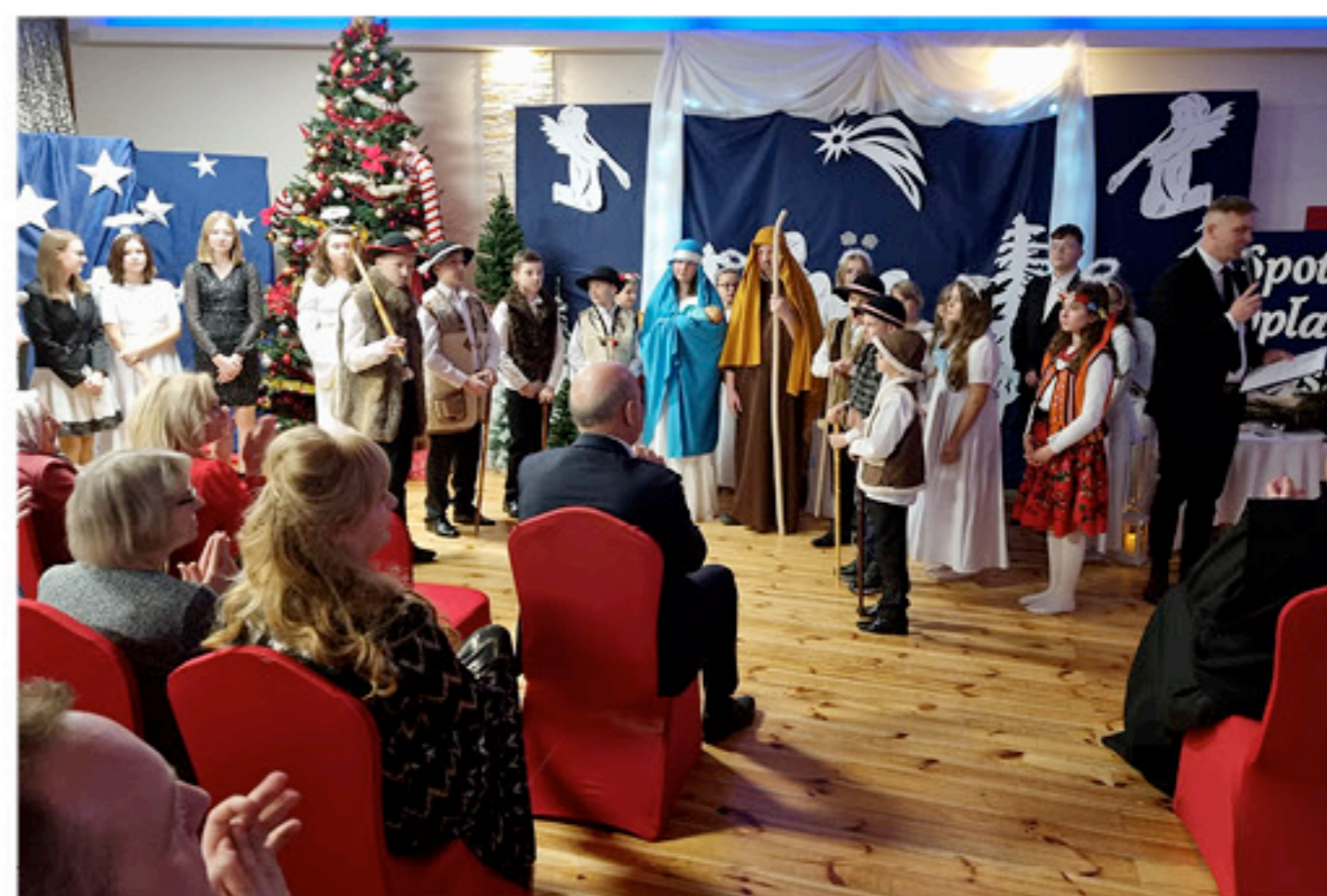
Występ dzieci ze Szkoły Podstawowej w Dobreszowie