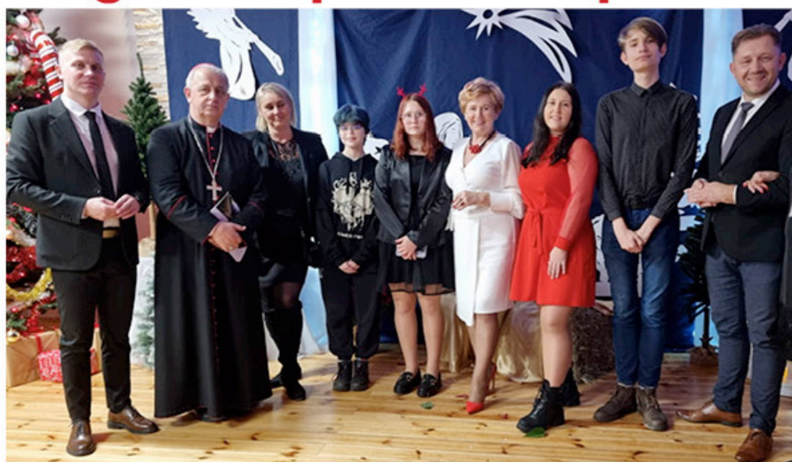
Młodzieżowa Rada Miejska zaszczyliła swoją obecnością podczas wydarzenia