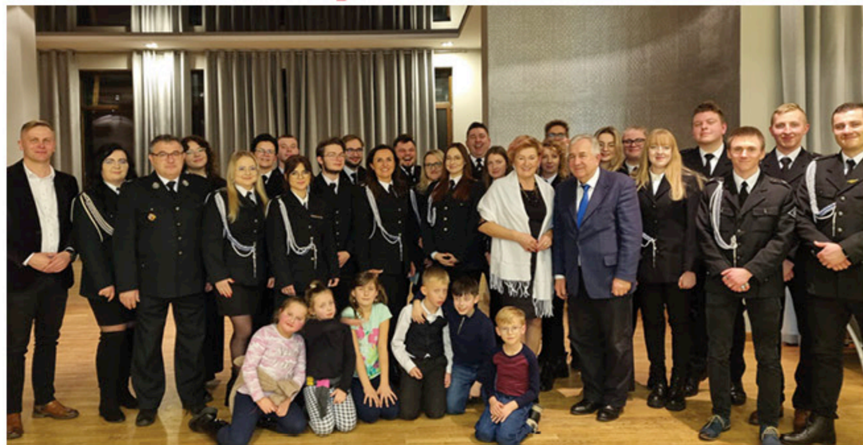
Orkiestra Dęta chlubą miasta i gminy Łopuszno