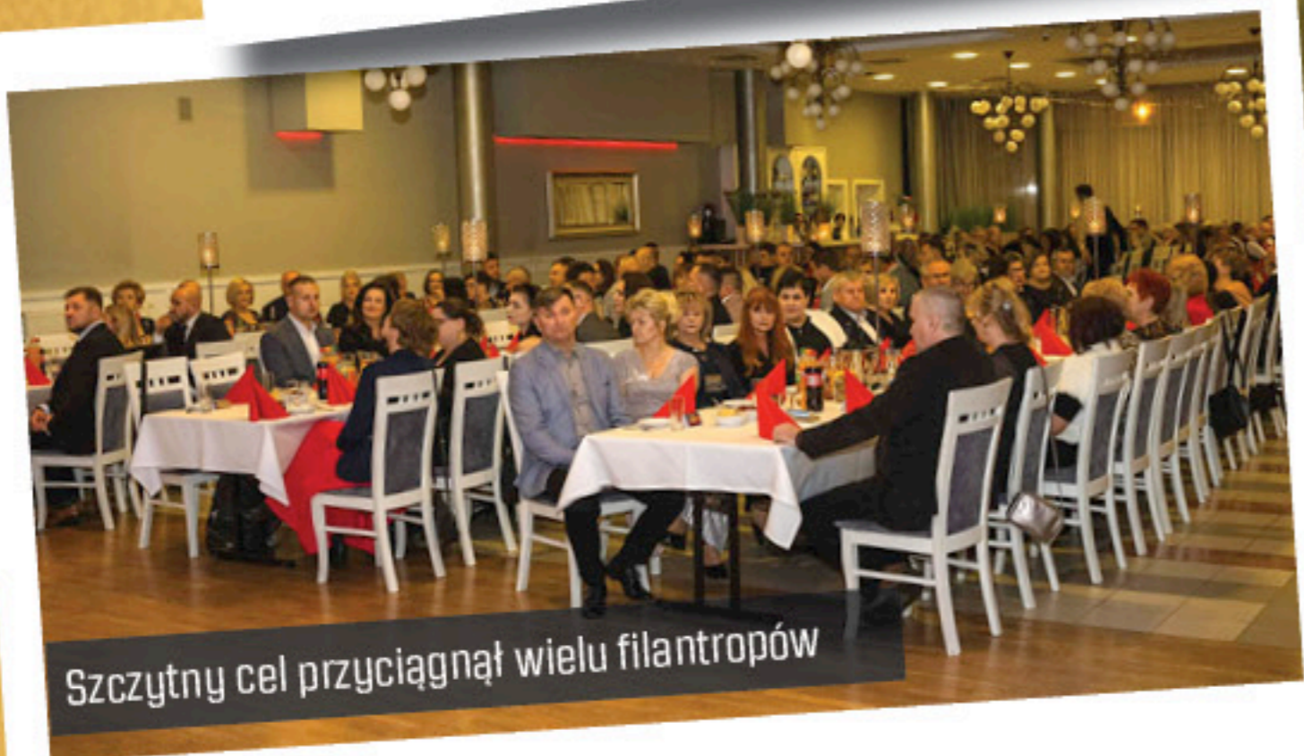
Szczytny cel przyciągnął wielu filantropów