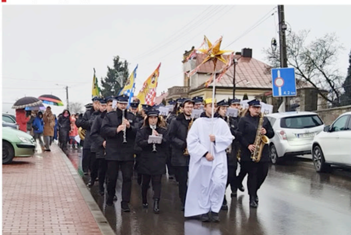
Orkiestra Dęta uświetniła uroczystość swoim występem