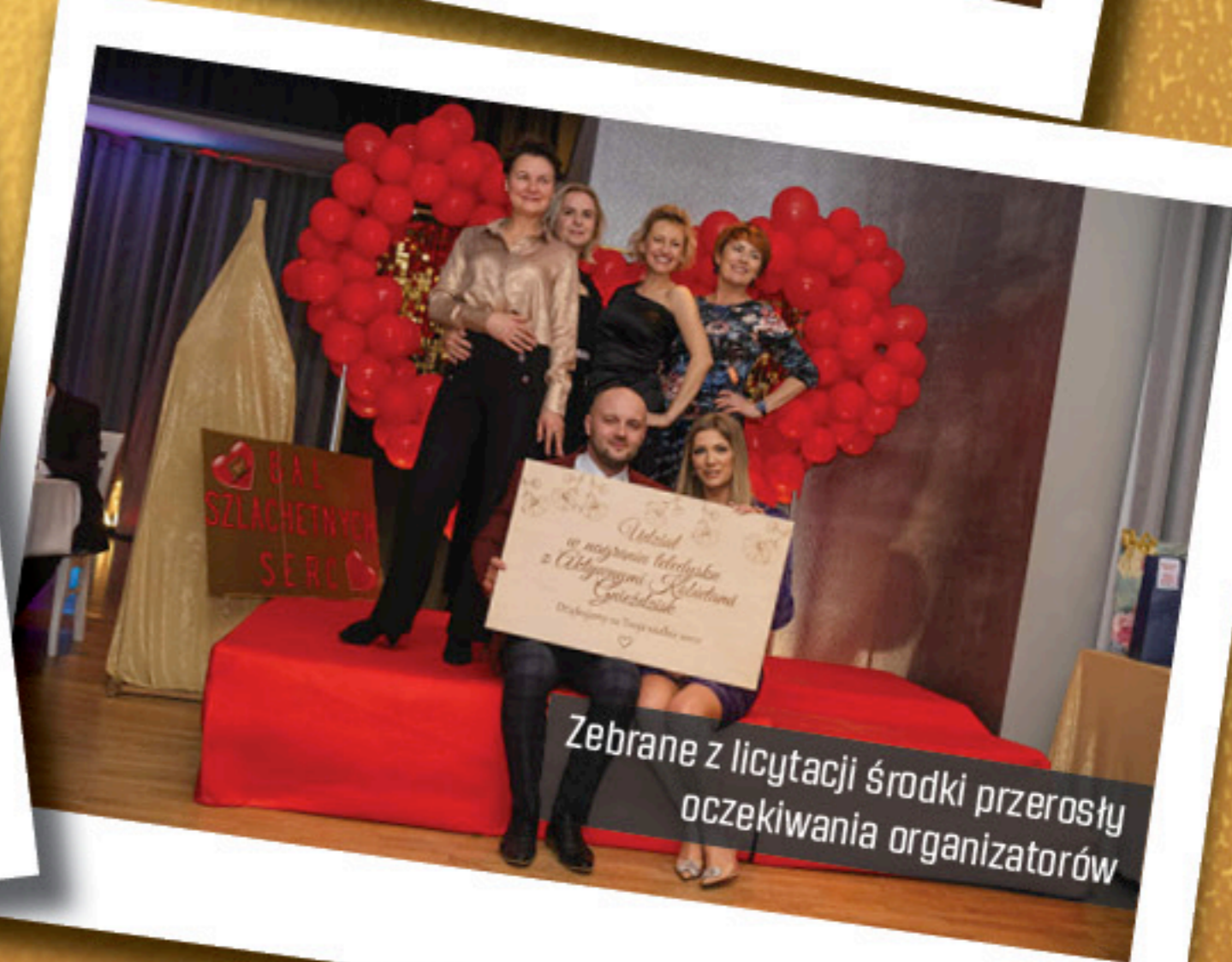
Zbrane z licytacji środki przerosły oczekiwania organizatorów