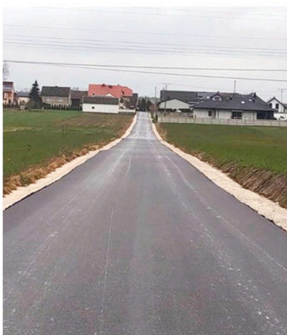
Nieustające inwestycje w infrastrukturę drogową na terenie Miasta i Gminy Łopuszno

W grudniu ubiegłego roku Gmina Łopuszno podpisała umowę z wykonawcą - Zakładem Robót Drogowych „DUKT” z Nowin na przebudowę drogi gminnej wewnętrznej w Gnieździskach o długości 619 mb, stanowiącej łącznik pomiędzy drogą wojewódzką nr 786 oraz drogą powiatową biegnącą przez miejscowość. Przedmiotowy odcinek pozwoli na odciążenie ruchu na najbardziej newralgicznym skrzyżowaniu w Gnieździskach, a tym samym przyczyni się do poprawy płynności ruchu samochodowego i zwiększy bezpieczeństwo użytkowników dróg. Koszt zadania to blisko 300 tysięcy złotych.