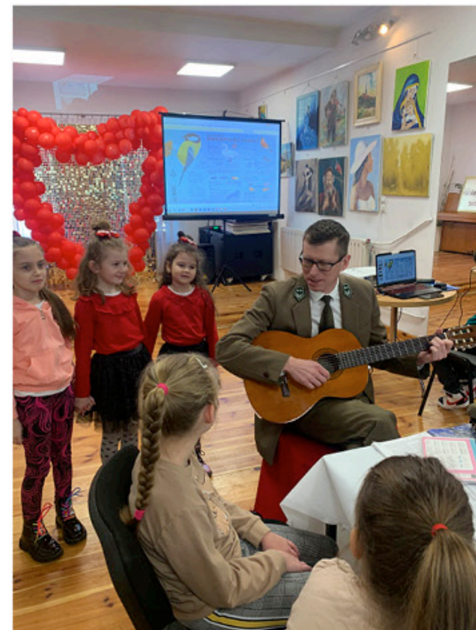
Leśniczy zaprezentował również swoje talenty artystyczne

Ferie to długo wyczekiwany czas odpoczynku i beztrudnej zabawy. 15 i 16 lutego bieżącego roku w Miejsko-Gminnej Bibliotece Publicznej w Łopusznie odbyły się zajęcia dla najmłodszych, które obfitowały w wiele atrakcji edukacyjno-animacyjnych.