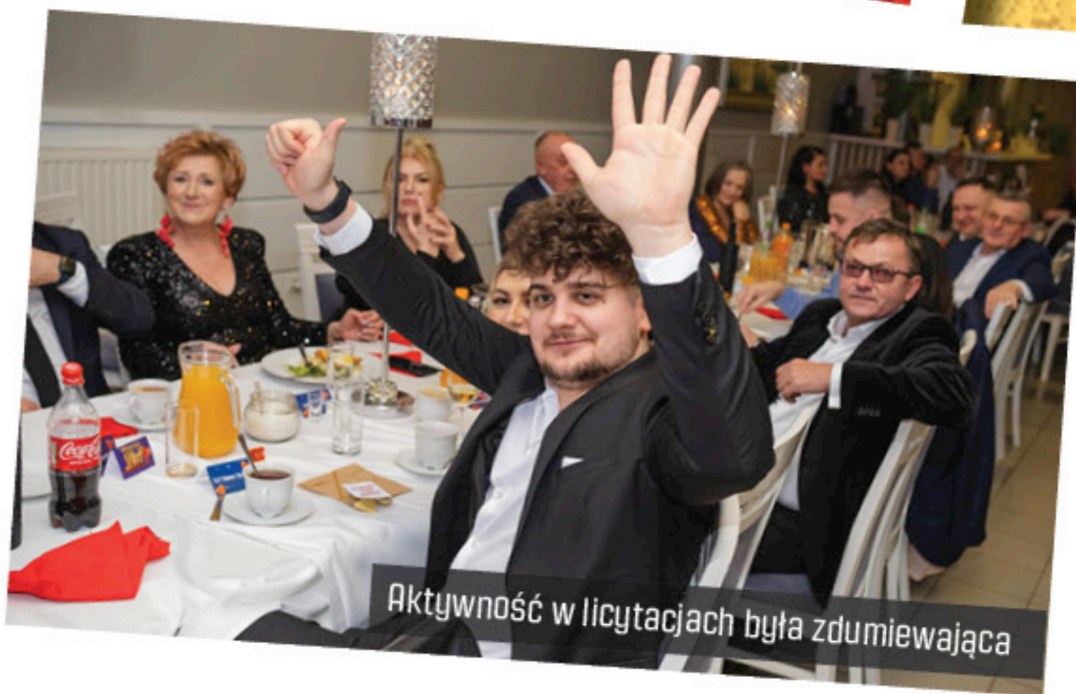
Aktywność w licytacjach była zdumiewająca