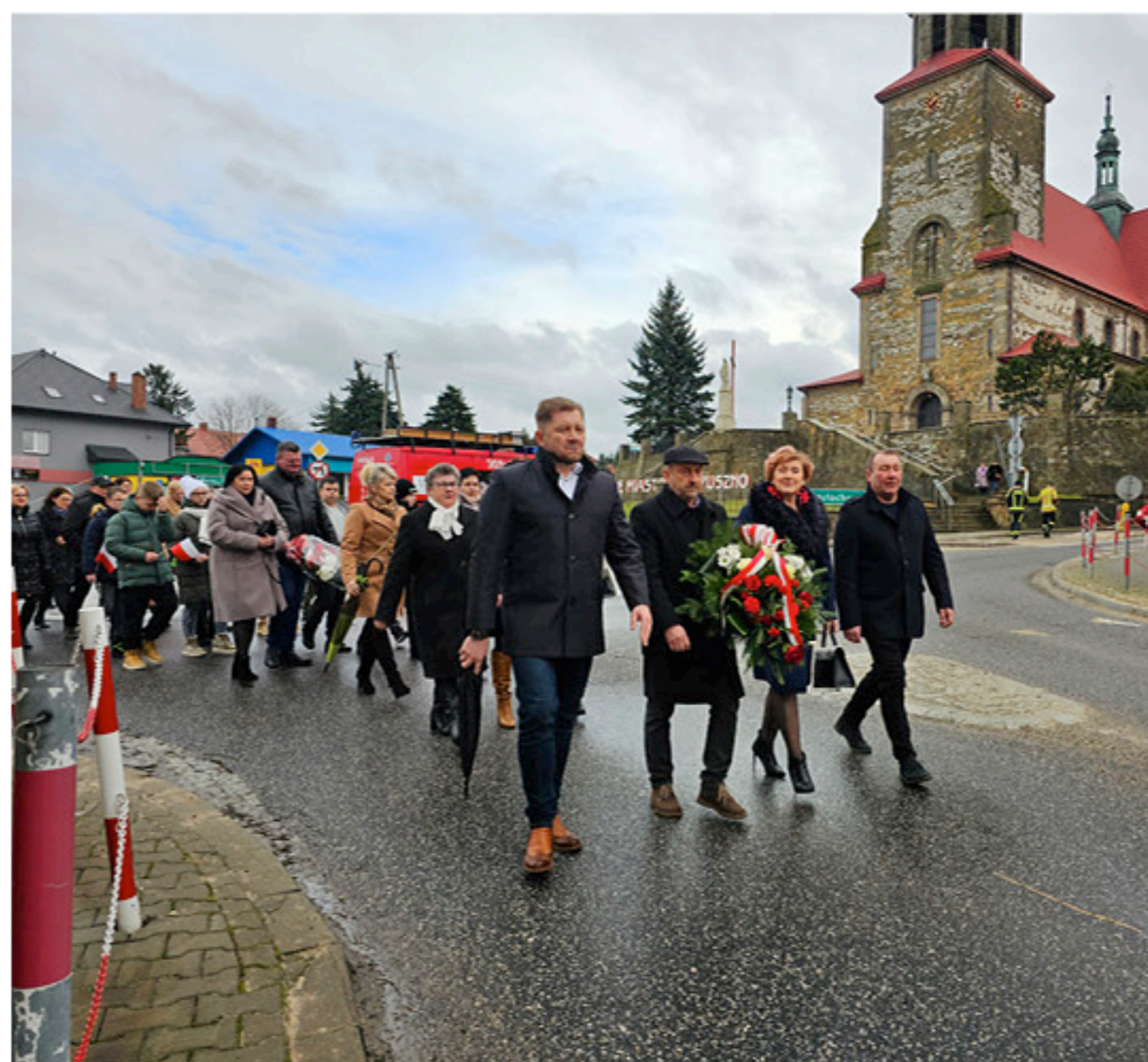
Przedstawiciele władz samorządowych Miasta i Gminy Łopuszno kultywują pamięć narodową