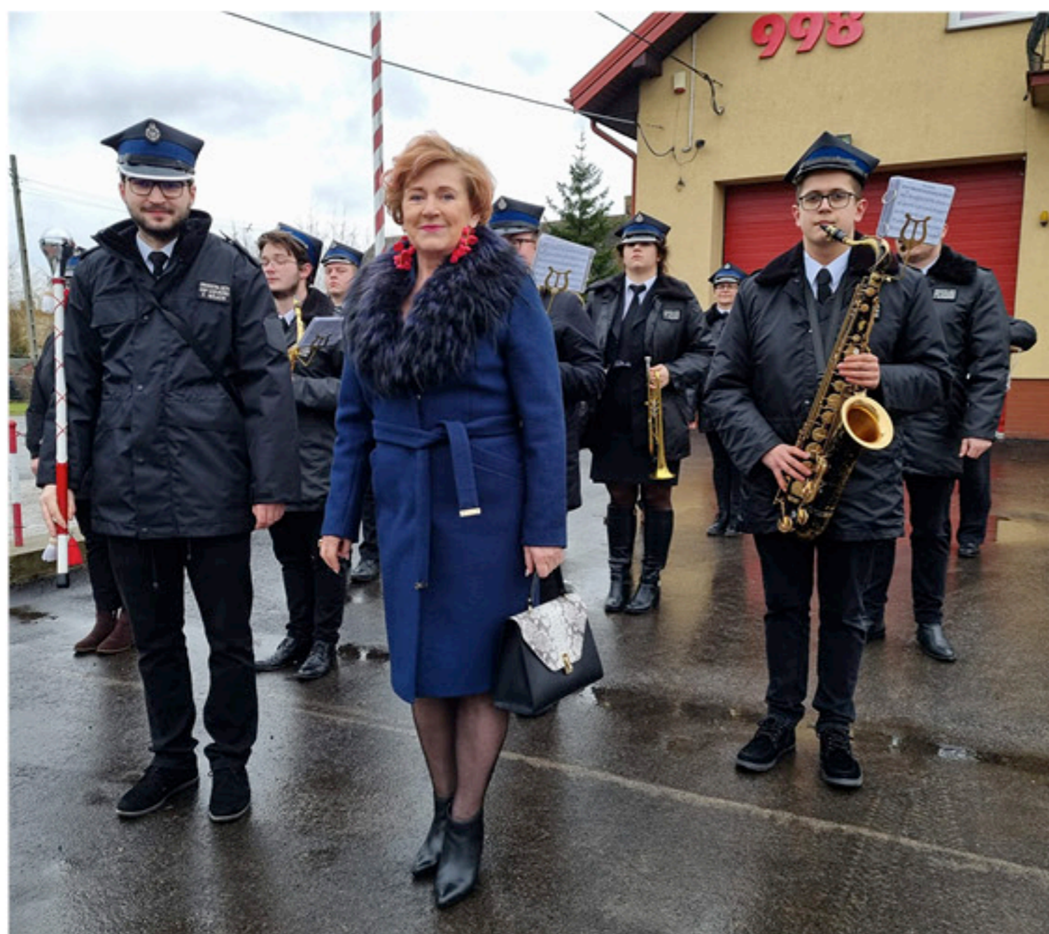
Orkiestra Dęta z Łopusznie uświetniająca swoją obecnością najważniejsze wydarzenia