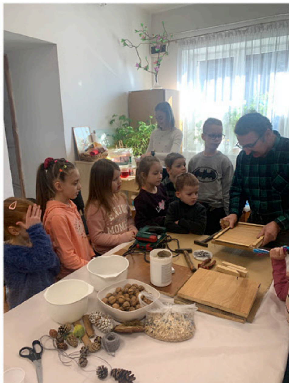
Dzieci nauczyły się jak zbudować karmnik dla ptaków