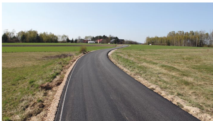
PRZEBUDOWA DROGI GMINNEJ NA ODCINKU 400 MB W M. PIOTROWIEC