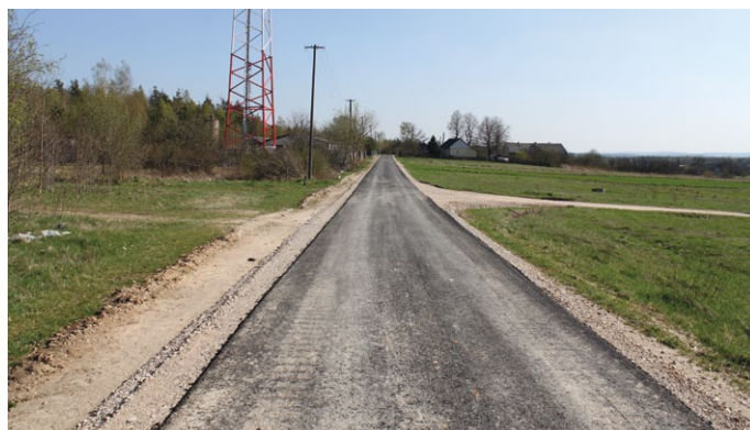
PRZEBUDOWA DROGI GMINNEJ NA ODCINKU 915 MB W M. ŁOPUSZNO, UL. ŻWIROWA