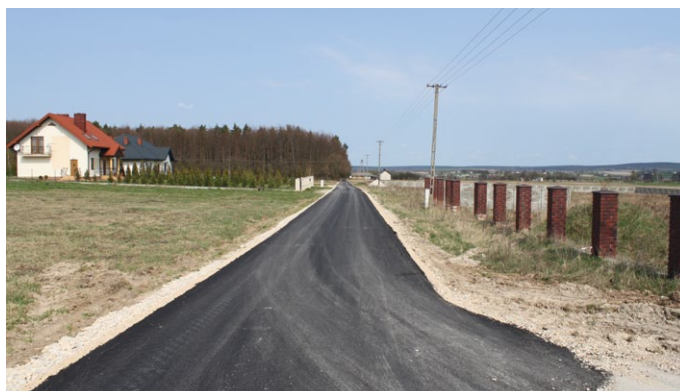
PRZEBUDOWA DROGI GMINNEJ NA ODCINKU 998 MB W M. JASIEŃ

W ramach realizacji inwestycji infrastrukturalnej zostanie przebudowanych blisko 10km dróg gminnych i wewnętrznych. Poprzez zmianę nawierzchni z szutrowych, żwirowych na