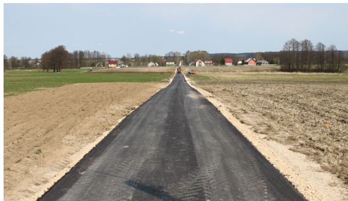
PRZEBUDOWA DROGI GMINNEJ NA ODCINKU 600 MB W M. JÓZEFINA