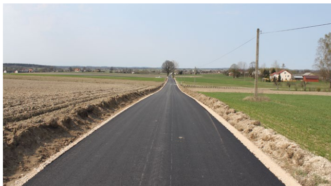
PRZEBUDOWA DROGI GMINNEJ NA ODCINKU 1249 MB CZAŁCZYN - OLSZÓWKA

Ponadto cały czas trwają prace przy przebudowie dróg gminnych współfinansowanych z Programu Rozwoju Obszarów Wiejskich na lata 2014 – 2020. Kwota, jaką pozyskała Gmina Łopuszno z Programu Rozwoju Obszarów Wiejskich na lata 2014 – 2020 sięga blisko 1 mln zł, zaś pozostałą kwotę w wysokości 500 tys. zł pokryje z własnego budżetu