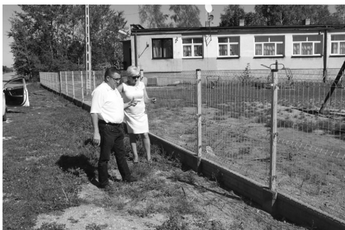
W Piotrowcu wykonano ogrodzenie działki wokół świetlicy wiejskiej. W ramach zadania zamontowano bramę wjazdową wraz z furtką wejściową oraz 90mb odrodzenia panelowego wraz z podmurówką betonową. Koszt zadania wyniósł 17.466,00 zł.