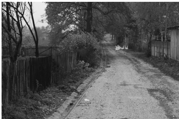
W sołectwie Fanisławiczki wykonano rów odwadniający wzdłuż drogi gminnej. Prace wykonał Zakład Gospodarki Komunalnej w Łopusznie. Koszt wykonania robót wyniósł 14.288,36 zł.