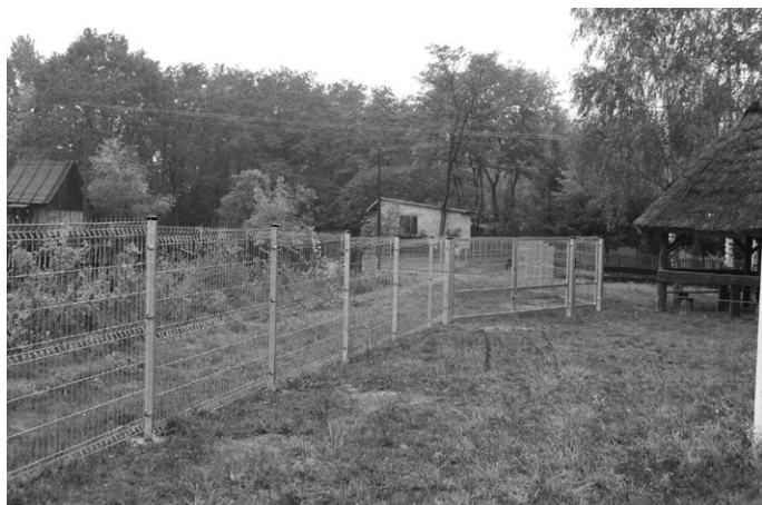
W Grabownicy w ramach funduszu sołeckiego wykonano ogrodzenie działki nr 240. W ramach zadania wykonano blisko 60 mb ogrodzenia z paneli oraz bramę wjazdową.