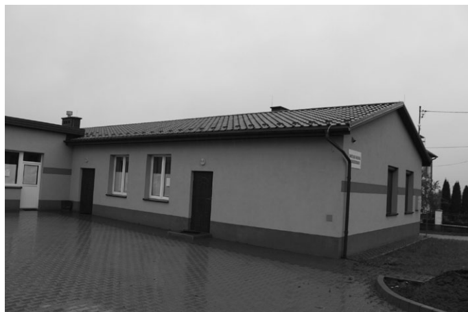
W sołectwie Gnieździska kompleksowo wyposażono świetlicę wiejską za łączną kwotę 26.840,00 zł. W ramach zadania zakupiono stoły, krzesła, szafę chłodniczą, regał ze stali nierdzewnej, sztucze oraz zastawę stołową.