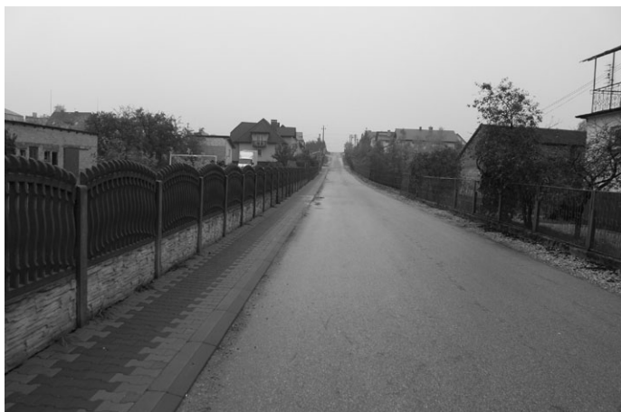
W ramach funduszu sołeckiego za kwotę 19.500,00 wykonano utwardzenie pobocza ul. Spacerowej w Łopusznie. Wykonano także ciąg pieszo-jezdny oraz oznakowanie drogowe.