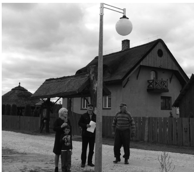
W Jedlu zamontowano 5 lamp solarnych. Koszt całego zamierzenia to 21.600,00zł.