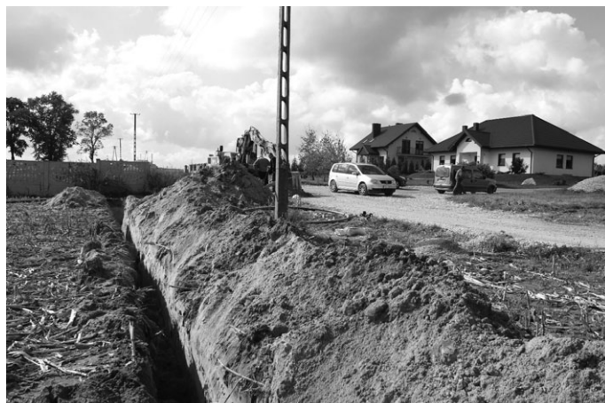
Sołectwo Jasień zyskało nowe przyłącze wodociągowe