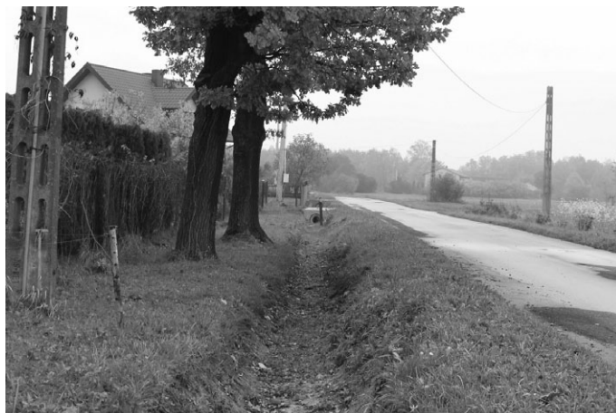
W Olszówce kompleksowo wykonano czyszczenie rowów wzdłuż drogi gminnej. Wykonano także przepusty i przyczółki. Koszt zadania wyniósł 9923,90 zł.