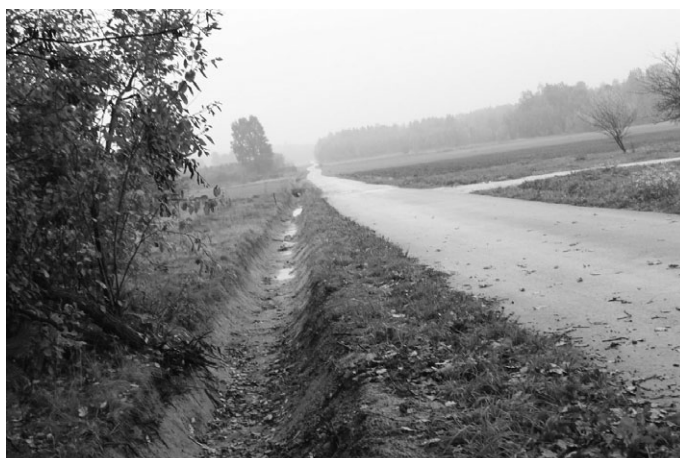
W Wielebnowie Zastońcu Zakład Gospodarki Komunalnej w Łopusznie wykonał rowy odwadniające wraz z przyczółkami betonowymi. Koszt zadania wyniósł 18.465,20 zł.