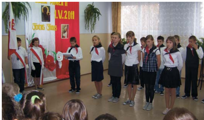
Akademia z okazji Święta Niepodległości w Szkole Podstawowej w Dobrzeszowie

Akademii z okazji Dnia Niepodległości tradycyjnie przygotowali cenobici, czyli członkowie Bractwa Świętokrzyskiego. Przygotowali oni montaż słowno-muzyczny przedstawiający drogę Polaków do przywrócenia Polsce miejsca na mapie Europy. Całość zamykały wiersze apelujące do młodych ludzi o darzenie szacunkiem Ojczyzny i ludzi, którzy dla niej pracowali i – jeśli zaszła taka potrzeba – tracili życie.