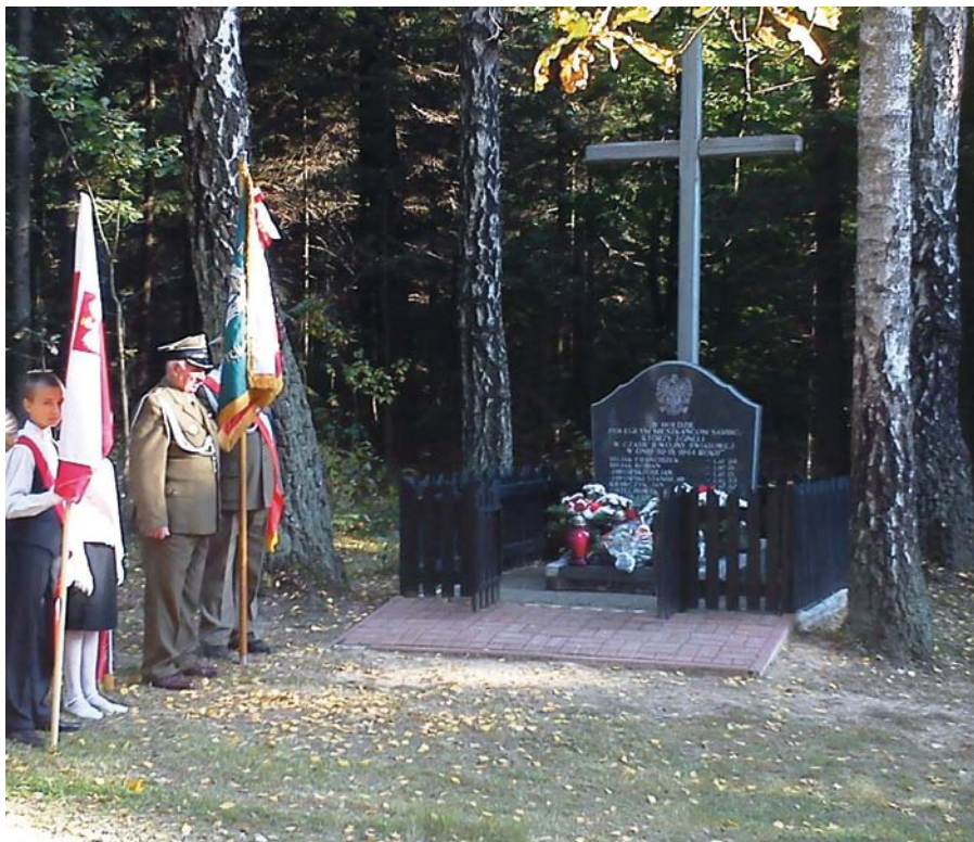
Poczet sztandarowy i poczet flagowy przy grobie pomordowanych przez hitlerowców mieszkańców Sarbic