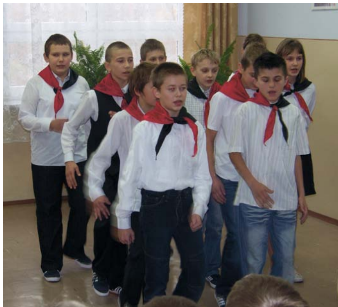
Bractwo Świętokrzyskie w Szkole Podstawowej w Dobrzeszowie na akademii z okazji Święta Niepodległości