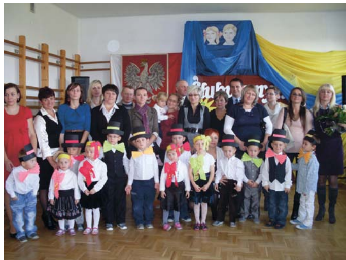
Przedшкоlacy wraz z rodzicami i zaproszonymi gośćmi