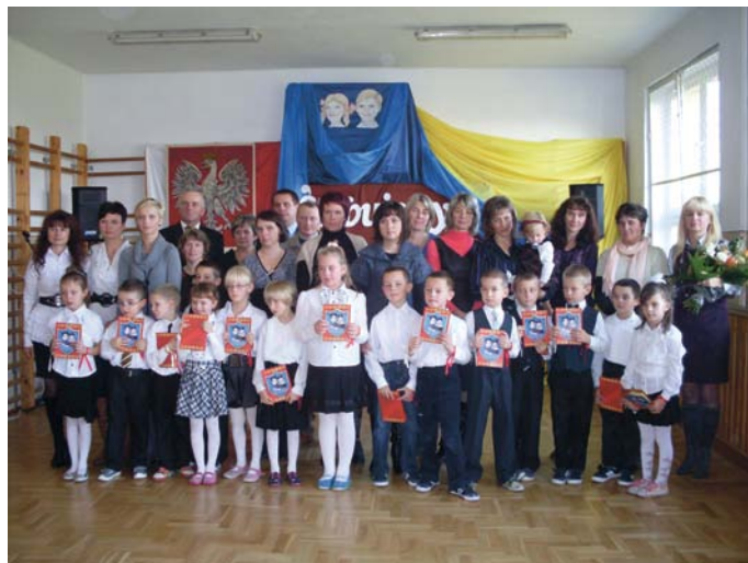
Pierwszoklasiści wraz z rodzicami i zaproszonymi gośćmi