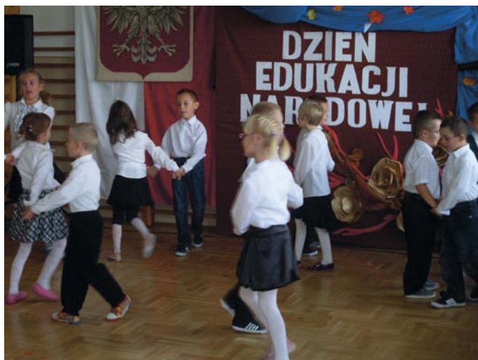
Obchody Dnia Nauczyciela w Szkole Podstawowej w Dobrzeszowie