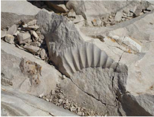
Amonit z rodzaju Perisphinctes występujący w Gnieździskach

Do surowców skalnych znajdujących się na terenie gminy należą wapienie, gliny zwałowe, iły, piaski, piaskowce i żwiry. Wapienie występuje głównie w południowej części gminy, w okolicach Gnieździsk. Znajduje się tam 5 kamieniołomów, w tym aktualnie tylko jeden czynny, Gnieździska - Góra Maćkowa, natomiast w Gnieździskach - Góra Lipia, Góra Poddańska, Wrzosówka i Dybkowa Góra wapienie nie jest już eksploatowane. Ciekawostką jest to, że w wapieniu zachowało się wiele skamieniałości, przykładem może być amonit z rodzaju Perisphinctes .