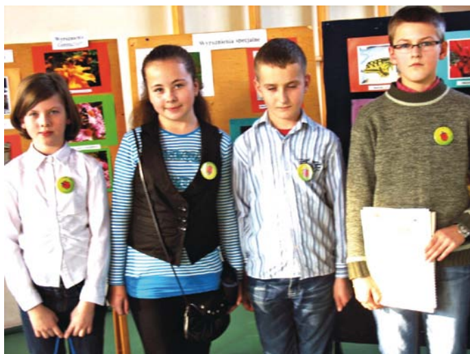
Uczestnicy konkursu „Mój przyjaciel - owad” w Szkole Podstawowej w Nowinach

nych, drapieżnych, roślinożernych, leśnych, społecznych), wykonane indywidualnie przez członka klubu 4H. Zdjęcia miały być wykonane w formacie 15x20 cm, także w wersji elektronicznej. Format plików JPG. Z każdego klubu przystępującego do konkursu można było przesłać 5-10 zdjęć. Głównymi celami, które przyświecały organizatorom konkursu było poznawanie przyrody poprzez fotografowanie jej elementów, zwrócenie uwagi na niezastąpioną rolę różnych gatunków owadów w biologicznej ochronie sadów, pól, pastwisk, ukazanie wielkiej roli owadów w ekologicznej gospodarce, promowanie swoistego piękna owadów i uroku ich przyrodniczych siedlisk, a także zwracanie uwagi na rolę owadów w ochronie światowego i polskiego dziedzictwa przyrodniczego. Efektem działań było nadesłanie fotografii owadów wykonanych indywidualnie przez klubowiczów, które oceniła komisja konkursowa kie-