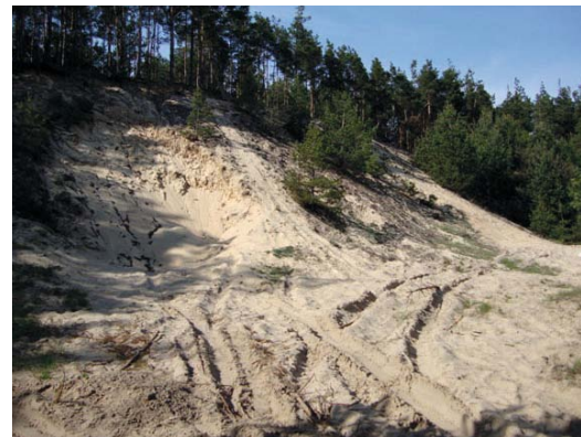
Wydma w Gnieździskach

Na obszarze gminy Łopuszno występuje wiele form pochodzenia lodowcowego, wodnolodowcowego, eolicznego, rzeczynego i denudacyjnego. Znajdują się także formy utworzone przez roślinność oraz pochodzenia antropogenicznego. Na uwagę zasługują formy pochodzenia eolicznego, czyli wydmy powstałe dzięki obecności pokrywy piaszczystych przy udziale wiatrów wiejących w plejstocenie, jak również w holocenie. Znajdują się one w pobliżu dolin rzecznych na całym terenie gminy, z niewielką przewagą w południowej części i osiągające miejscami 10 - 15 m wysokości.