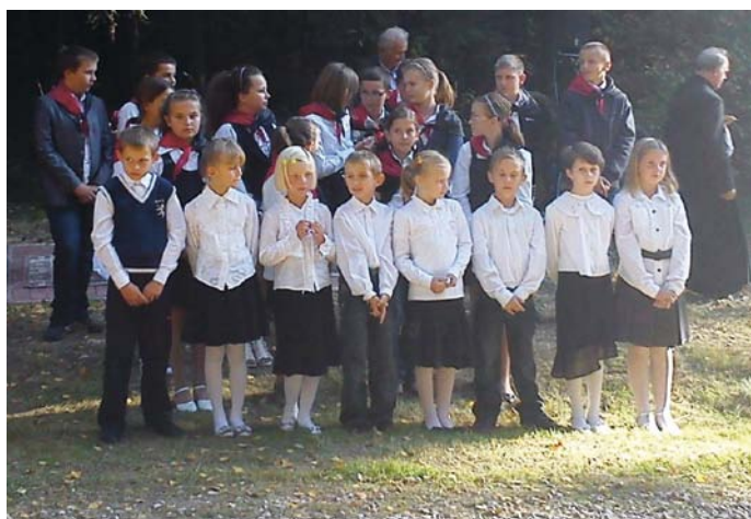
Uczniowie Szkoły Podstawowej w Dobrzeszowie i Filii podczas akademii w Sarbicach