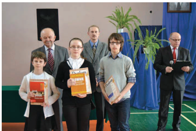
Zwycięcy w kategorii klas IV - VI szkoły podstawowej

wiatry”. Oprócz utworów poetyckich wysłuchano szlagierów z lat trzydziestych XX wieku, piosenek „Miłość ci wszystko wybaczy” i „Na pierwszy znak”. Autorem słów do tych przebojów sprzed wieku był właśnie Julian Tuwim, ukrywający się pod pseudonimem Oldlen.