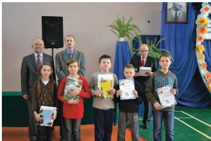
Uczniowie nagrodzeni w konkursie czytelniczym na temat Juliana Tuwima