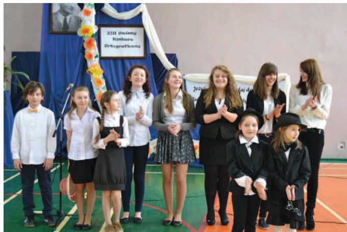
Młodzi artyści, którzy lubią Tuwima

Po ogłoszeniu wyników pan dyrektor zaprosił do obejrzenia programu artystycznego. Nieprzypadkowo jego bohaterem stał się autor „Lokomotywy” i „Kwiatów polskich”, bowiem rok 2013 Sejm RP ogłosił Rokiem Juliana Tuwima. Młodzi recytatorzy prezentowali nieśmiertelne wiersze tego bodaj najpopularniejszego poety dwudziestolecia międzywojennego, takie jak „Pan Tralaliński”, „Spóźniony słownik” czy „Dwa