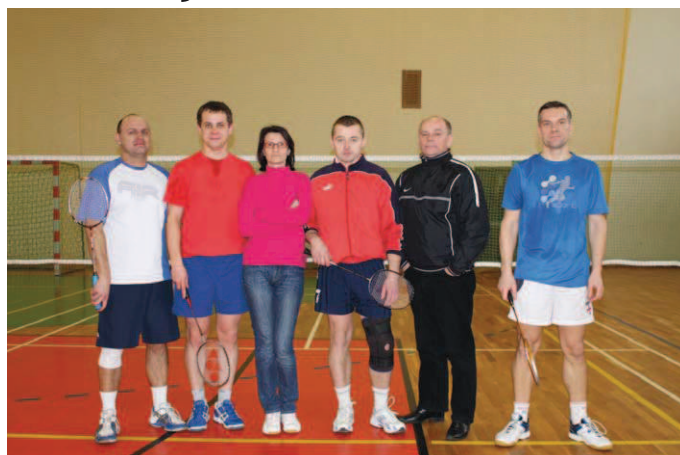
Zawodnicy uczestniczący w meczu ligowym w Suchedniowie

W sezonie 2012/2013 „Feniks” zgłosił się do Świętokrzyskiej Ligi Amatorów Dorosłych Badmintonu, której celem jest popularyzacja badmintonu w różnych środowiskach na terenie województwa świętokrzyskiego. W lidze przyjdzie się zmierzyć z takimi zespołami jak: „Wolant Kielce”, UKS Ćmińsk, Team Suchedniów, UKS Mechanik Kielce, „Clear” Busko Zdrój, „Tomcar” Połaniec, Morawica, Zagnańsk czy „Fresh Team” Ostojów.