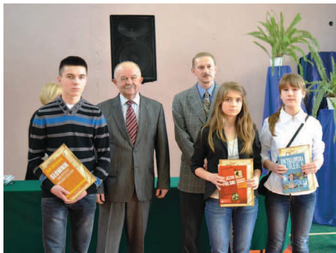
Najlepsi z ortografii wśród gimnazjalistów