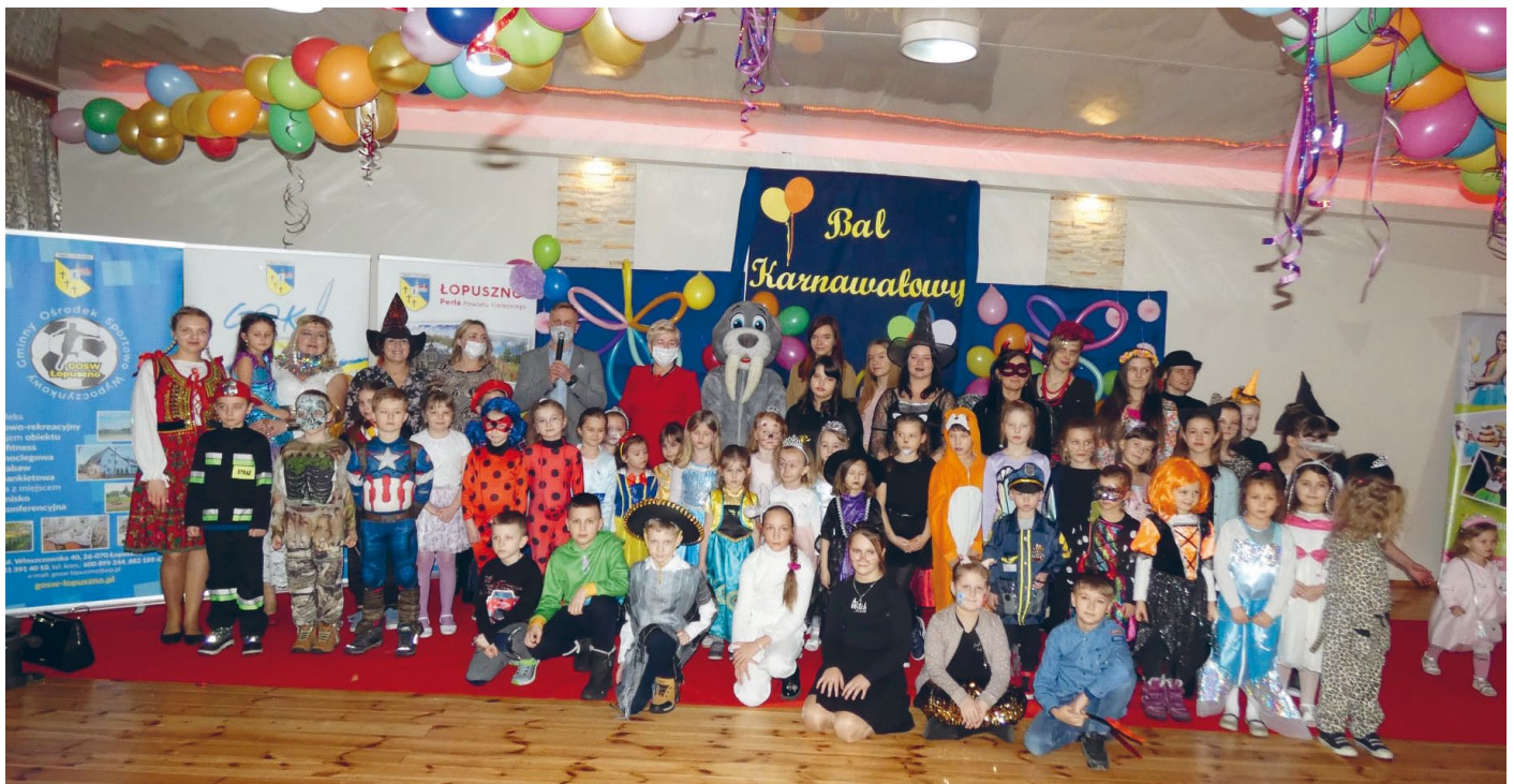
BAL KARNAWAŁOWY DLA DZIECI NA TERENIE GOSW W ŁOPUSZNIE