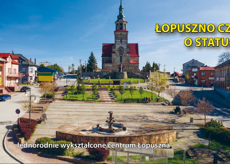
Jednorodnie wykształcone centrum Łopuszna