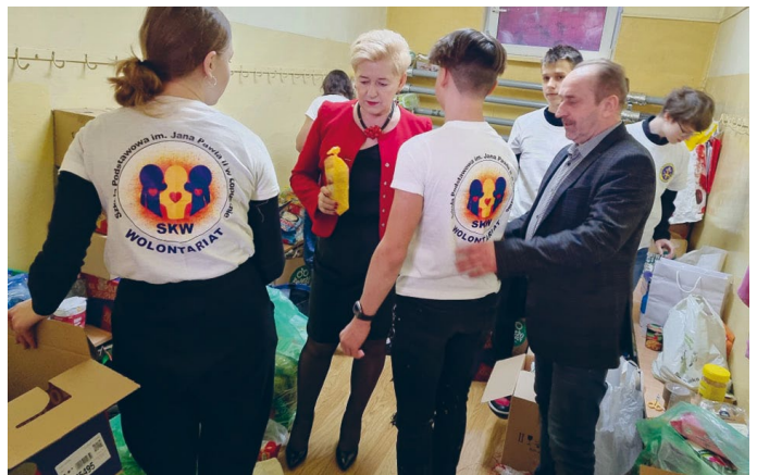
DZIECI I MŁODZIEŻ AKTYWNI WŁĄCZAJĄ SIĘ W AKCJĘ NIESIENIA POMOCY