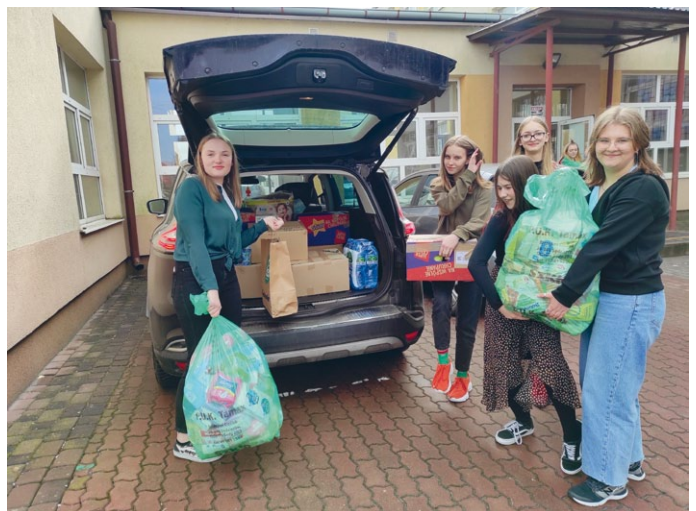
SPOŁECZNOŚĆ SZKOŁY PODSTAWOWEJ IM. JANA PAWŁA II WSPIERA DONIOSŁĄ INICJATYWĘ