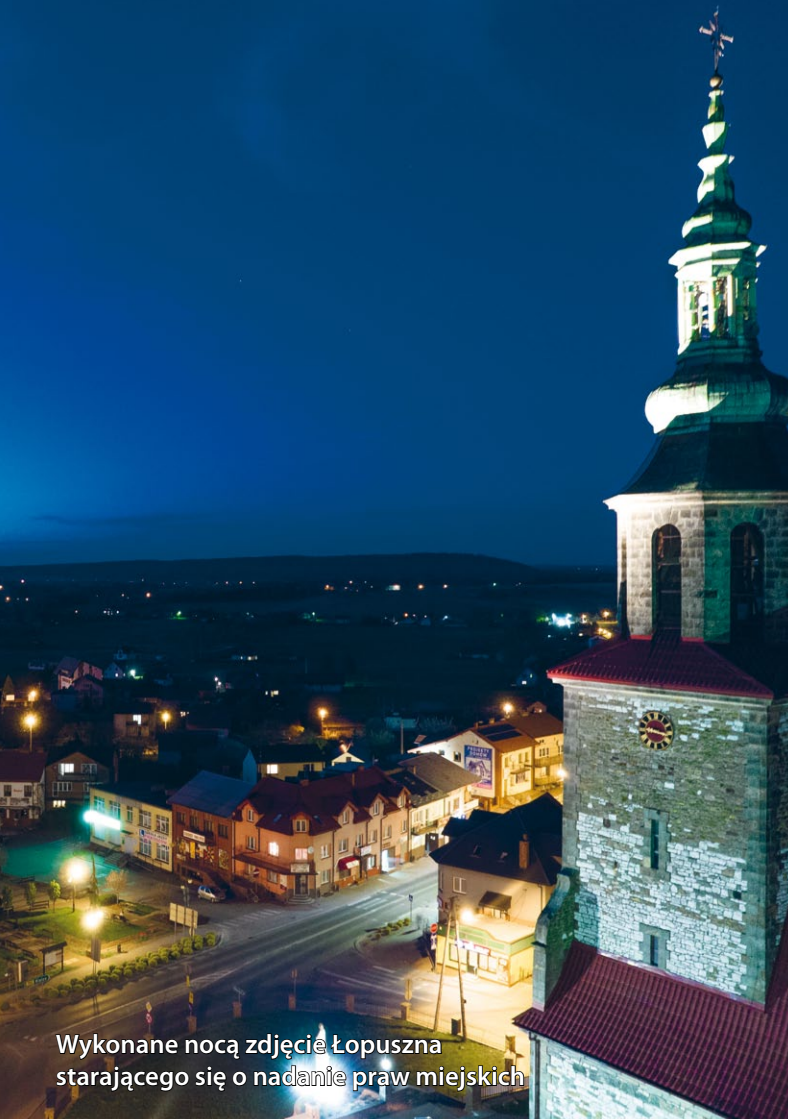
Wykonane nocą zdjęcie Łopuszna starającego się o nadanie praw miejskich