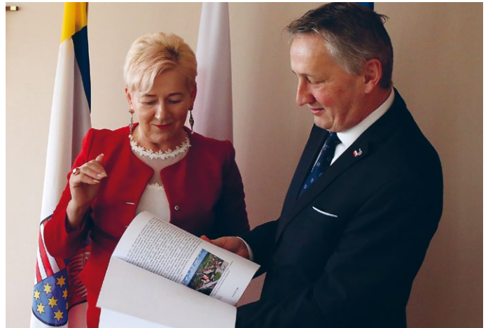
PRZEKAZANIE WNIOSKU WŁAŚCIWYM ORGANOM ZWIĘNCZYŁO DOTYCHCZASOWE STARANIA WŁADZ SAMORZĄDOWYCH GMINY ŁOPUSZNO W PROCEDURZE FORMALNOPRAWNEJ DOTYCZĄCEJ NADANIA STATUSU MIASTA MIEJSCOWOŚCI ŁOPUSZNO

Do udziału w konsultacjach uprawnieni byli wszyscy pełnoletni mieszkańcy gminy Łopuszno. W poszczególnych obwodach konsultacyjnych – sołectwach powołane zostały trzyosobowe komisje, których zadaniem było czuwanie nad sprawnym i prawidłowym przebiegiem konsultacji oraz sporządzenie wyników konsultacji w danym obwodzie konsultacyjnym. W składzie komisji występował: