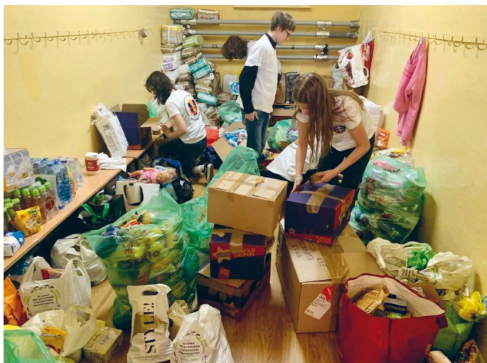
PRZYKŁAD SZLACHETNEGO GESTU POMOCY POTRZEBUJĄCYM