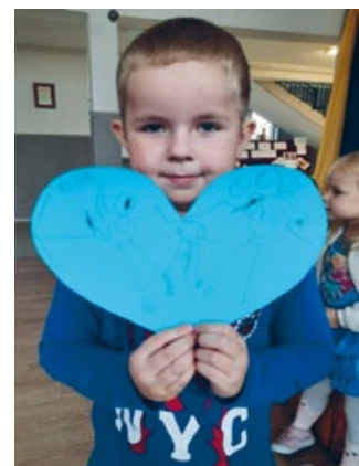
GRUPY PRZEDSZKOLNE OBCHODZIŁY ŚWIATOWY DZIEŃ ŻYCZLIWOŚCI I POZDROWIEŃ. PRZEDSZKOLACZKI WYKONAŁY TEGO DNIA KARTKI Z POZDROWIENIAMI DLA SENIORÓW