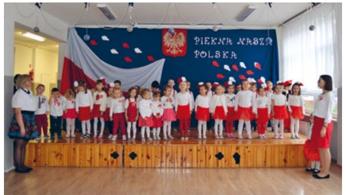
UROCZYSTE ODŚPIEWANIE NASZEGO HYMNU NARODOWEGO