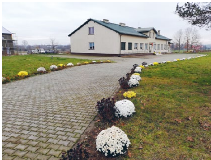
ŚWIELICA W SNOCHOWICACH