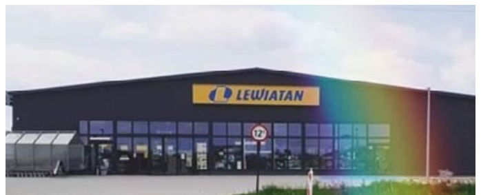
SKLEP LEWIATAN Z SIEDZIBĄ W ŁOPUSZNIE WSPÓLDARCZYŃCĄ SZLACHETNEJ PACZKI 2020