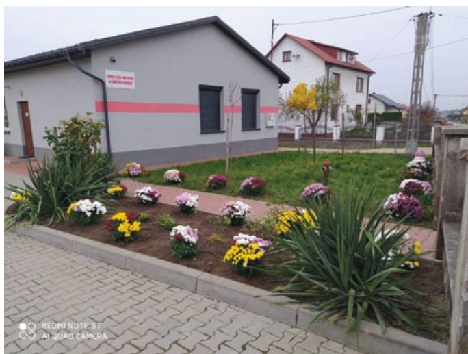
ŚWIELICA W GNIEŹDZISKACH