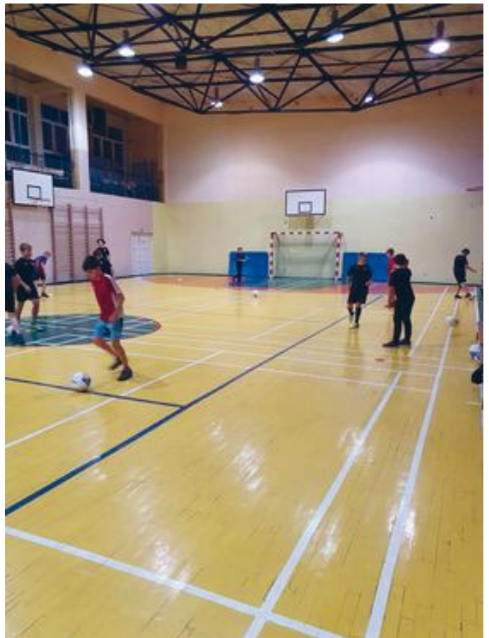
ZAJĘCIA AKTYWIZUJĄ ŻE DZIECI I MŁODZIEŻ