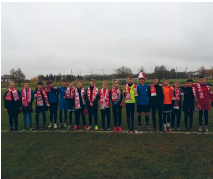
TRENING PRZEPROWADZONY W NAWIĄZANIU DO NARODOWEGO ŚWIĘTA NIEPODLEGŁOŚCI