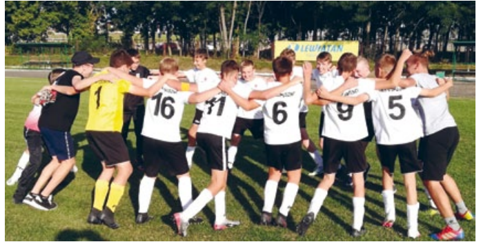
WSZECHOBECNA RADOŚĆ ZAWODNIKÓW PO PIERWSZYM ZWYCIĘSTWIE