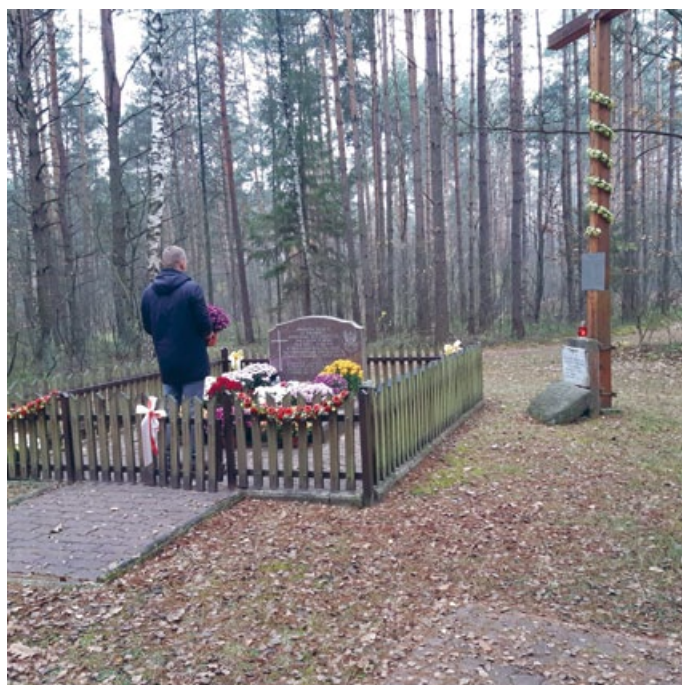
SYMBOLICZNE WIĄZANKI ZŁOŻONE W HOŁDZIE ZASŁUŻONYM