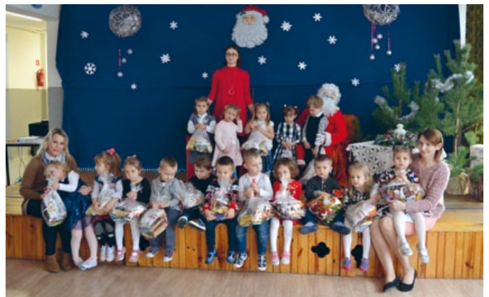
ŚWIĘTY MIKOŁAJ STWIERDZIŁ, ŻE W TYM ROKU WSZYSCY BYLI GRZECZNI I OBSYPĄ PREZENTAMI KAŻDEGO

Mikołaj wzruszony tak wspaniałymi występami obdarował dzieci pięknymi prezentami. Oczywiście nie obyło się bez pamiątkowych zdjęć z tak ważną osobą. Dzieci pełne radości opuściły progi szkoły, dźwigając swoje prezenty.