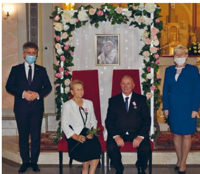
WYRAZY NAJWYŻSZEGO UZNANIA I ŻYCZENIA DAJSZYCH SZCZĘŚLIWYCH LAT ŻYCIA W ZDROWIU I MIŁOŚCI DLA SZANOWNYCH JUBILATÓW