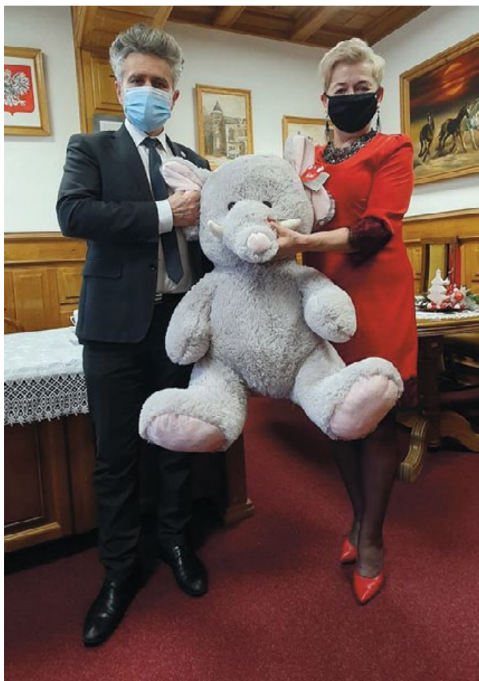
SENATOR RP PAN KRZYSZTOF SŁOŃ RÓWNIŻ WYKAZAŁ GEST DZIELENIA SIĘ Z DRUGIM CZŁOWIEKIEM PRZEKAZUJĄC W RAMACH TEGOROCZNEJ AKCJI PIĘKNEGO PLUSZOWEGO SŁONIA