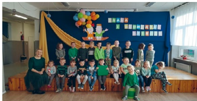
CZWARTEK TO DZIEŃ MAGICZNYCH WSPOMNIEŃ I AMBITNYCH PLANÓW, TEGO DNIA PREZENTOWALIŚMY WSZYSTKIE ODCIENIE ZIELENI