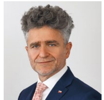
Senator RP Krzysztof Słoń