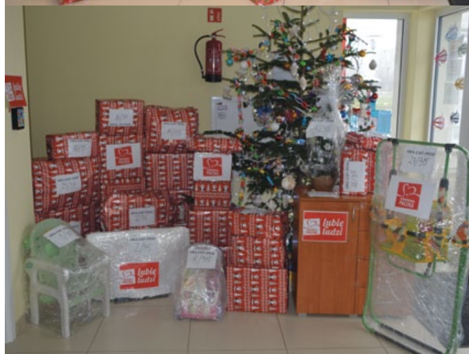
PRACOWNIKOM ŻŁOBKA GMINNEGO W ŁOPUSZNI WRAZ Z RODZICAMI MALUCHÓW I KONSORCJUM ADMA ZE STASZOWA UDAŁO SIĘ SKIEROWAĆ ZNACZĄCĄ SZLACHETNĄ POMOC