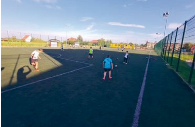
GOSW W ŁOPUSZNI DOSKONALE SŁUŻY DOSKONALENIU UMIEJĘTNOŚCI SPORTOWYCH