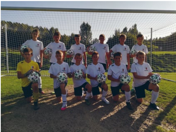
MŁODZI ADEPCI PIŁKI NOŻNEJ MOGĄ TRENOWAĆ NOWYMI PIŁKAMI ZAKUPIONYMI PRZEZ ŁOPUSZAŃSKI KLUB SPORTOWY ZE ŚRODKÓW DOTACJI PRZEKAZANEJ PRZEZ GMINĘ ŁOPUSZNO