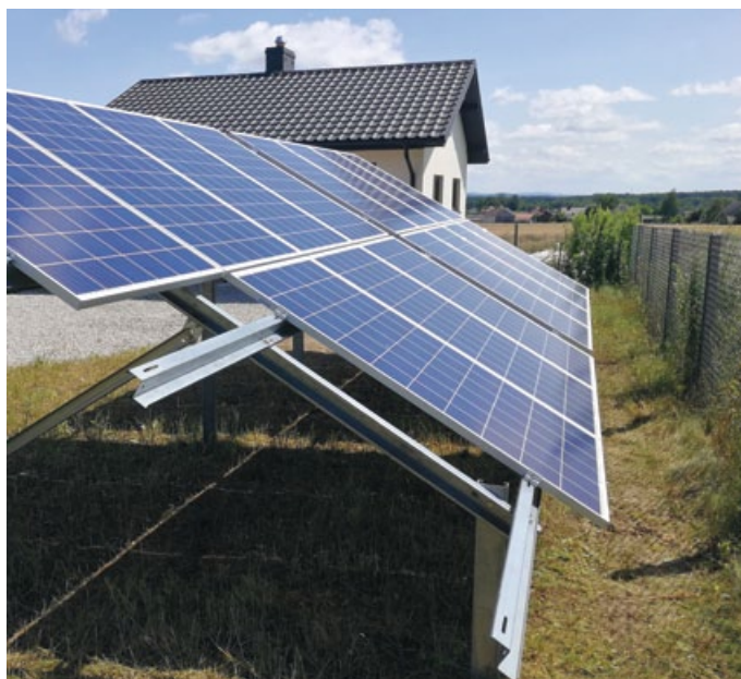
PRZYKŁADOWA INSTALACJA OZE NA TERENIE GMINY ŁOPUSZNO SŁUŻĄCA MIESZKAŃCOM I ŚRODOWISKU