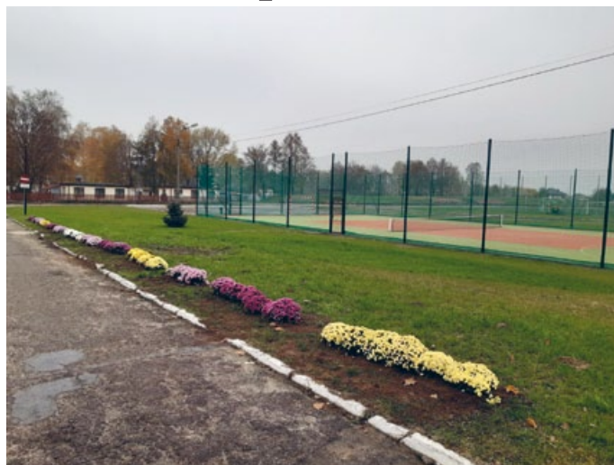
UPIĘKSZONY GOSW W ŁOPUSZNIE