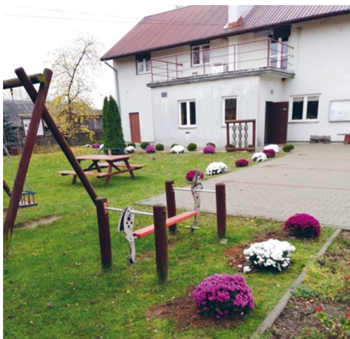
ŚWIELICA W LASOCINIE