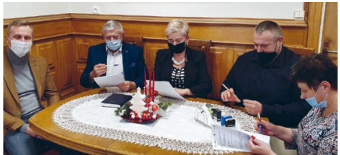
PODPISANIE UMOWY Z WYKONAWCĄ KONSORCJUM ADMA W DNIU 9 GRUDNIA 2020 R.