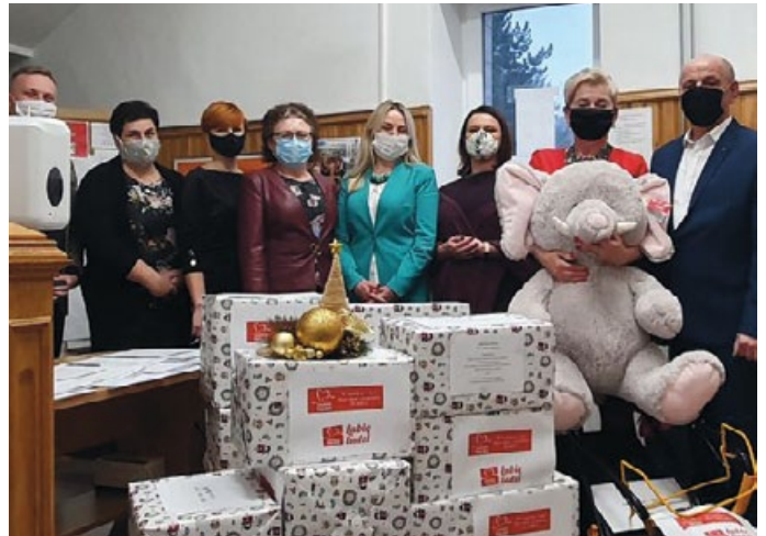
Z ODRUCHU SERCA I POTRZEBY ALTRUIZMU KIEROWNICY JEDNOSTEK ORGANIZACYJNYCH GMINY, DYREKTORZY SZKÓŁ I PRACOWNICY URZĘDU GMINY W ŁOPUSZNIE WŁĄCZYLI SIĘ W AKCJĘ DOBROCZYNNĄ