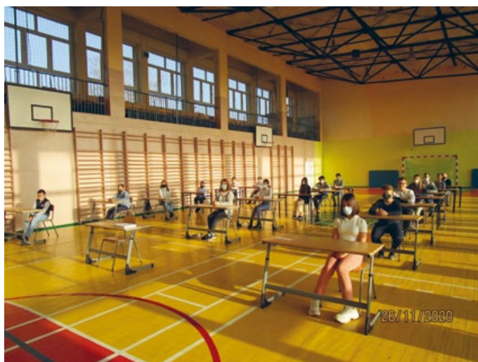
SZKOLNE ELIMINACJE II WOJEWÓDZKIEGO KONKURSU Z HISTORII