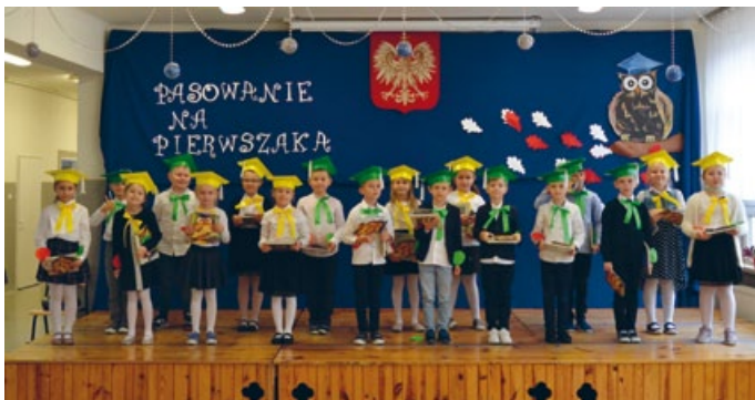
PEŁNOPRAWNI UCZNIOWIE NASZEJ SZKOŁY PIERWSZAKI