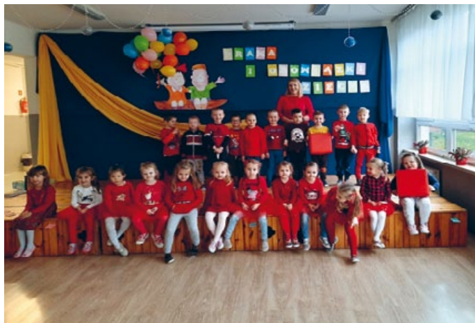
ŚRODA TO DZIEŃ PRZYJAŹNI, TEGO DNIA DOMINOWAŁ KOLOR CZERWONY