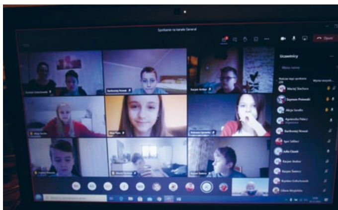
KLASA IV B UCZY SIĘ ZDALNIE JĘZYKA POLSKIEGO