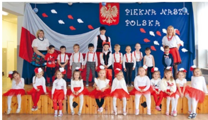
PIĘKNA NASZA POLSKA, CO WIDAĆ PO UCZESTNIKACH PROJEKTU

Głównym celem projektu jest rozwijanie i promowanie wszelkich postaw patriotycznych. W ramach realizacji projektu zorganizowaliśmy kącik o tematyce folkowej i patriotycznej, odbył się pokaz biało-czerwonej mody, turniej wiedzy o małej ojczyźnie, warsztaty biżuterii „Czerwone korale”, powstał plakat przedstawiający herb naszej gminy. Dzieci zapoznały się i dumnie zaśpiewały hymn Polski podczas uroczystego apelu z okazji 11 listopada.