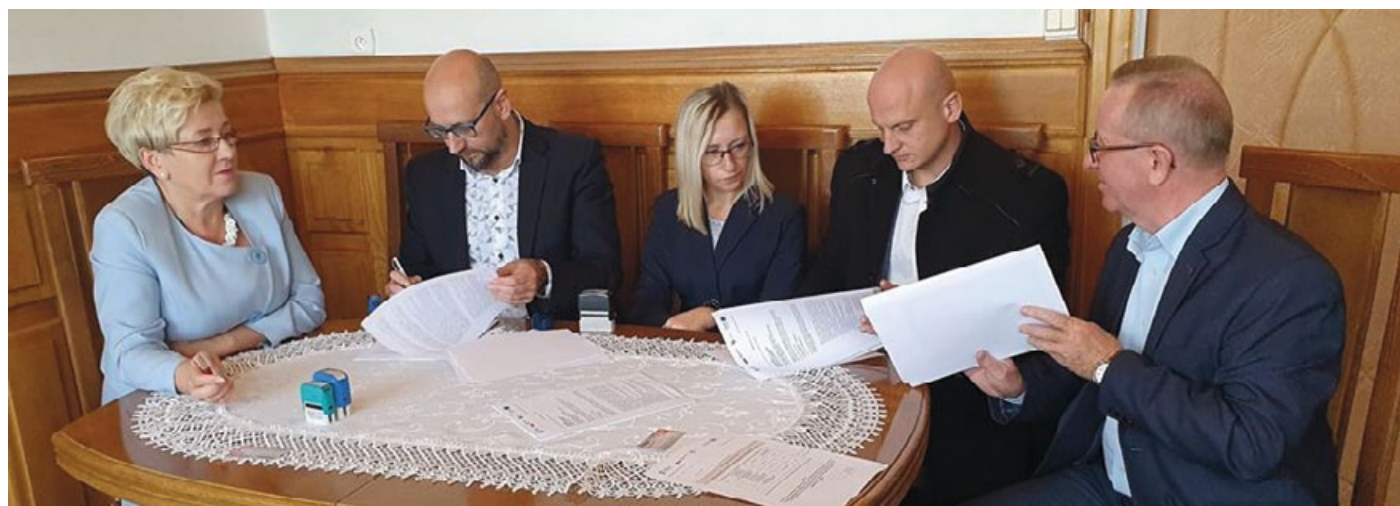
PODPISANIE UMOWY Z WYKONAWCĄ PROJEKTU NA OZE W DNIU 7 PAŹDZIERNIKA 2019 R.