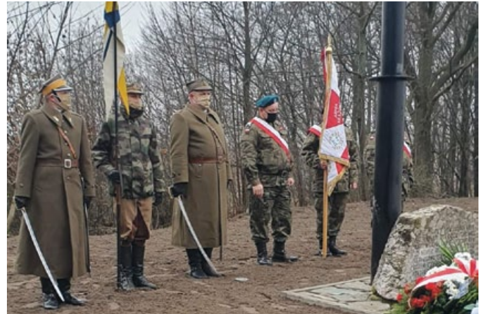
HOŁD ODDANY NA ŁOPUSZAŃSKIM KOŚCIOŁKU POMORDOWANYM DNIA 13 GRUDNIA 1943 R.