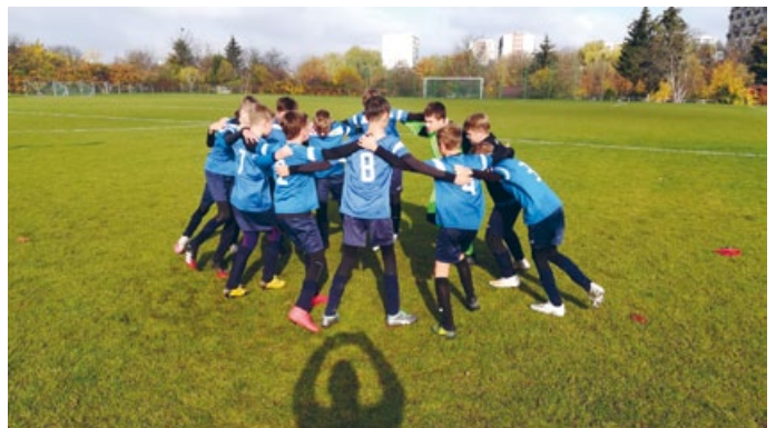
ŁKS MOBILIZACJA PRZED MECZEM