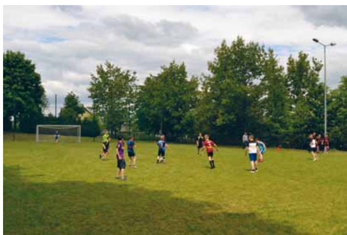
MŁODZI ENTUZJAŃCI PIŁKI NOŻNEJ!