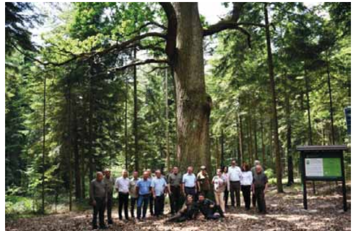
LEŚNICZY I SAMORZĄDOWCY PODCZAS UROCZYSTOŚCI NADANIA IMIENIA POMNIKOWI PRZYRODY DĄB SYLWAN

Pomnik zlokalizowany jest około 200 m od drogi powiatowej prowadzącej od Dobrzeszowa do Sarbic Pierwszych – przy ścieżce prowadzącej na Górę Dobrzeszowską.