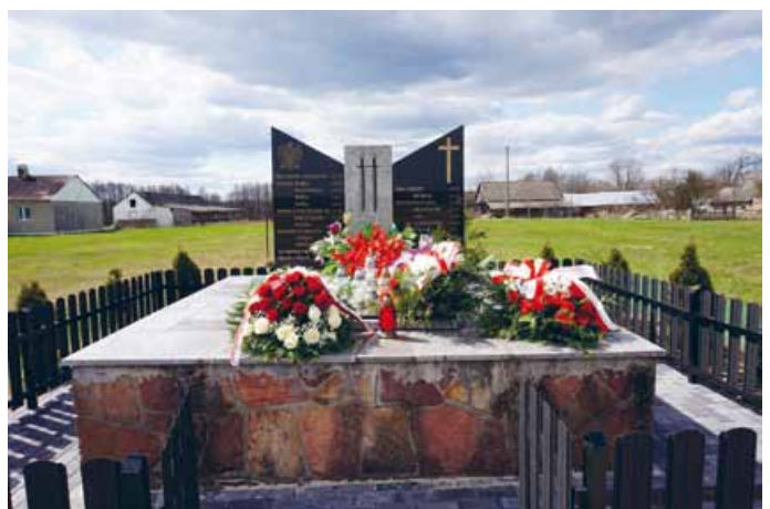
POMNIK UPAMIĘTNIAJĄCY PACYFIKACJĘ WSI NARAMÓW