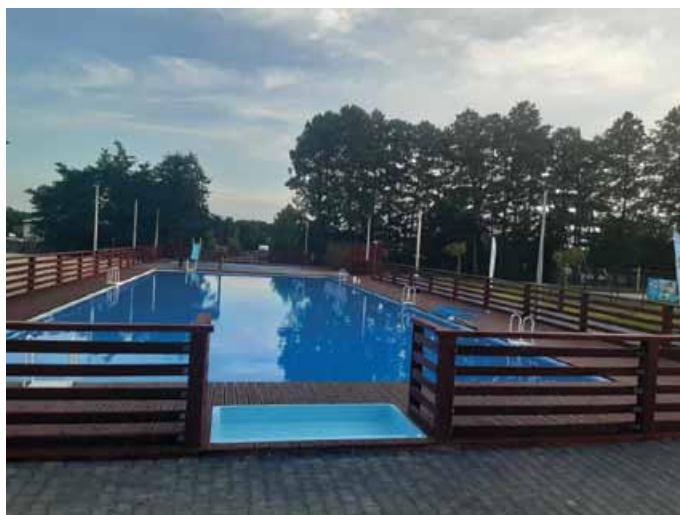
WYKONANIE NOWOCZESNEGO KOMPLEKSU BASENOWEGO

Warto podkreślić, że kompleks został dostosowany do potrzeb osób z niepełnosprawnościami oraz rodzin z dziećmi.