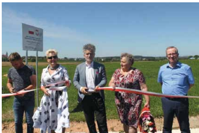
ODBIÓR DROGI W WIELEBNOWIE