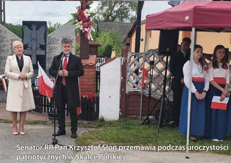
Senator RP Pan Krzysztof Słoń przemawia podczas uroczystości patriotycznych w Skałce Polskiej