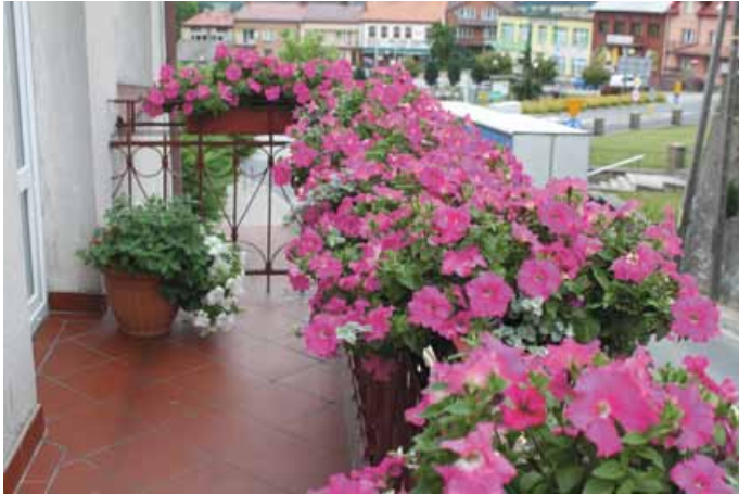
WYRÓŻNIENIE W KAT. NAJPIĘKNIJSZY BALKON DLA GBP W ŁOPUSZNI