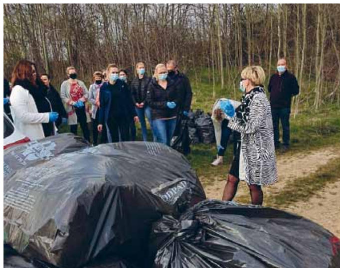
PRACOWNICY URZĘDU GMINY W ŁOPUSZNIE ZAANGAŻOWANI W AKCJĘ PROEKOLOGICZNĄ