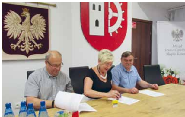
UROCZYSTE PODPISANIE POROZUMIENIA GMIN ŁOPUSZNO, KRASOCIN I SŁUPIA KONECKA