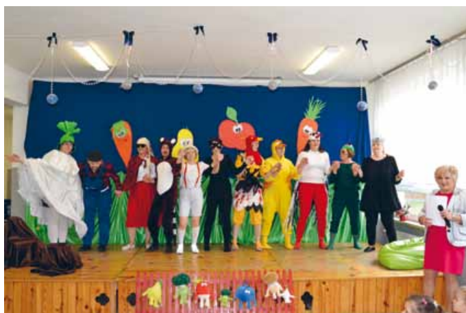
W KOŃCU WSPÓLNymi SIŁAMI RZEPKĘ UDAŁO SIĘ WYRWAĆ