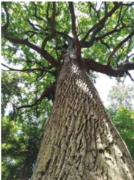
OKAZAŁY DĄB SZYPUŁKOWY O NAZWIE SYLWAN

Dąb rośnie na terenie Nadleśnictwa Kielce, leśnictwa Dobrzeszów, w oddziale leśnym 28 c, w Gminie Łopuszno. Pomnik przyrody znajduje się w urokliwym miejscu, w pobliżu rezerwatu przyrody Góra Dobrzeszowska, wśród jodeł, buków oraz innych dębów.