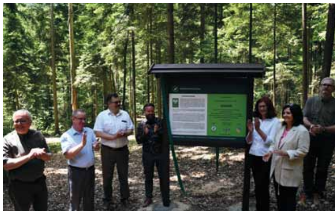
ODSŁONIĘCIE TABLICY INFORMACYJNEJ WSKAZUJĄCEJ IDEĘ POMNIKA PRZYRODY

Dlaczego Sylwan? Proponowane do objęcia ochroną obiekty w ramach akcji Pomniki dla Natury to głównie drzewa odznaczające się wyjątkowymi walorami przyrodniczymi wśród otaczającego je krajobrazu. Drzewa te, z racji swojej długowieczności, często były również „niemymi” świadkami dramatycznych wydarzeń historycznych lub stanowiły ważne dla lokalnych społeczności symbole trwania Natury w zmieniającym się świecie. Z tego też powodu leśnicy postanowili nadać niektórym pomnikom imiona, które mają upamiętnić, zarówno znaczące daty z naszych dziejów, jak też osoby związane lokalną historią i lasami. Zgodnie z przekazem mitologii rzymskiej Sylwan to bóg lasów i dzikiej przyrody, który był przedstawiany jako krzepki starzec w wieńcu z bluszczu. Imię Sylwan od 200 lat jest także nierozdzielnie związane z leśnictwem na ziemiach polskich. Taki tytuł nosi bowiem, najstarsze w Polsce i jedno z pierwszych na świecie, leśne czasopismo naukowe, które ukazuje się od 1820 roku. To niezwykle cennie wydawnictwo przyczyniło się do rozwoju polskiego leśnictwa, służąc postępowi, upowszechnieniu wiedzy leśnej oraz rozwojowi nauki. Dla uczczenia przypadającej w 2020 roku okrągłej