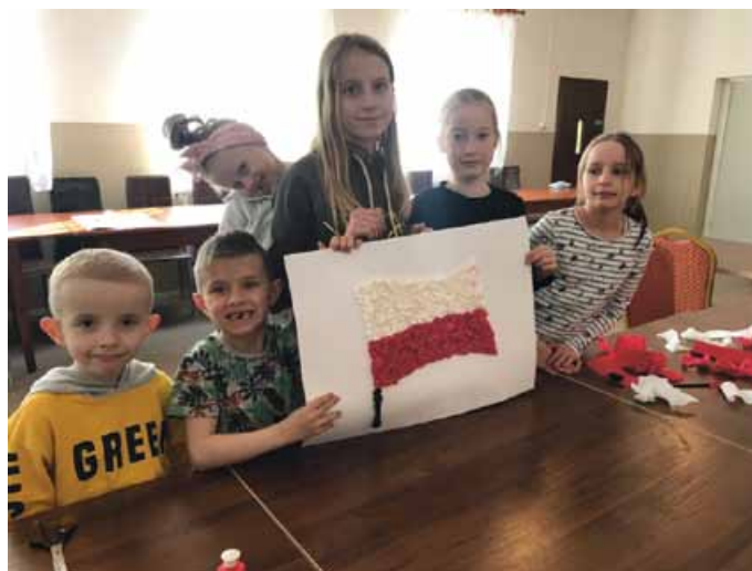
ZAJĘCIA W ŚWIETLICACH POZWALAJĄ DOSKONALIĆ UMIEJĘTNOŚCI UCZESTNIKÓW

W pierwszym etapie realizacji projektu wszystkie placówki zostały kompleksowo wyposażone w nowe, certyfikowane meble (regaly, stoły, krzesła, tablice suchościeralne i korkowe). Następnie do każdej ze świetlic zakupiono sprzęt ICT i RTV: podłogi interaktywne (komputery i gry do nich), laptopy z oprogramowaniami, kserokopiarki mono laser, urządzenia wielofunkcyjne kolor atrament, routery LTE, projekto-