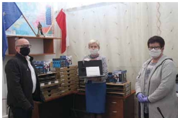
NA ZDJĘCIU WÓJT GMINY ŁOPUSZNO Z DYREKCJĄ SZKOŁY PODSTAWOWEJ IM. JANA PAWŁA II W ŁOPUSZNIE

Nadto, w dniu 4 sierpnia 2020 r. Wójt Gminy Łopuszno przekazała również 20 sztuk laptopów i 20 sztuk tabletów wraz z oprogramowaniami zakupionych dla szkół podstawowych, których organem prowadzącym jest Gmina Łopuszno w ramach dofinansowania w kwocie 95.000,00 zł pozyskanego z Centrum Projektów Polska Cyfrowa w ramach Programu Operacyjnego