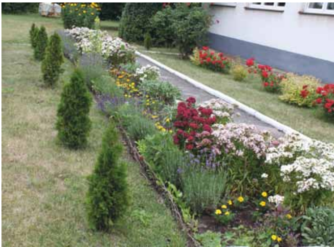
WYRÓŻNIENIE W KAT. RÓŻNORODNOŚĆ GATUNKOWA ROŚLIN DLA SP W ŁOPUSZNI FILIA W GRABOWNICY

Komisja przyznała trzy równorzędne wyróżnienia w różnych kategoriach dla: