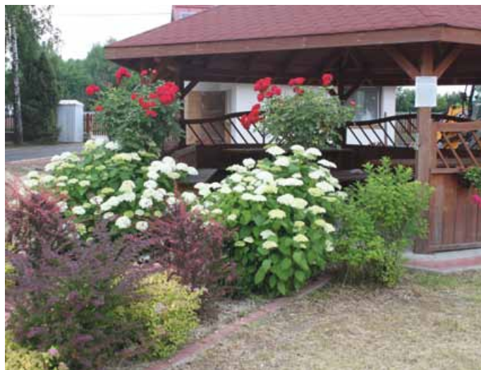
GOSW W ŁOPUSZNIE LAUREATEM II MIEJSCA