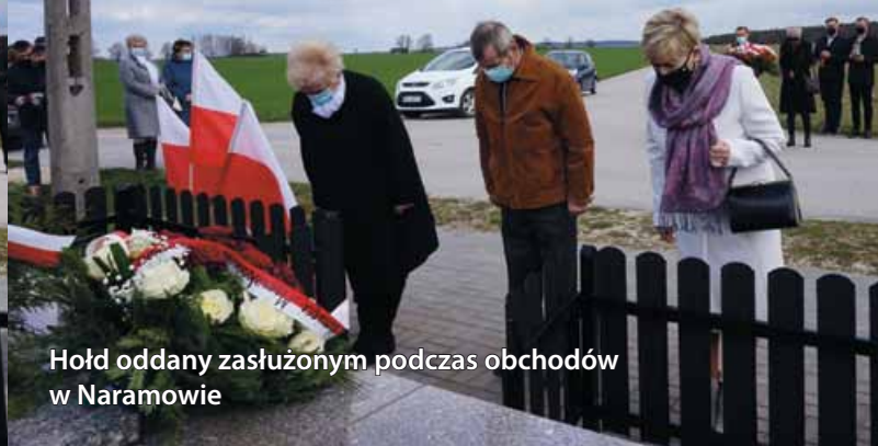
Hołd oddany zasłużonym podczas obchodów w Naramowie