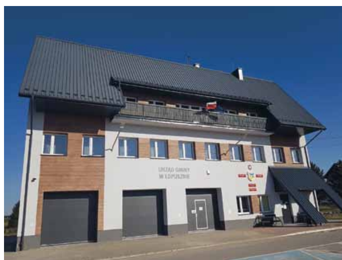
BUDYNEK URZĘDU GMINY W ŁOPUSZNIE PO TERMOMODERNIZACJI

Budynek Urzędu Gminy w Łopusznie zmienił się przede wszystkim pod kątem termomodernizacyjnym. Zostały wymienione: piec C.O., instalacja grzewcza, okna i drzwi wejściowe, została zamontowana instalacja fotowoltaiczna w ilości 26 sztuk o łącznej mocy 7kW do produkcji prądu (co znacząco obniży koszty zużycia prądu dla całego budynku), oświetlenie wewnętrzne LED. Wykonano docieplenie budynku wraz z nową elewacją oraz dodatkowe przejście, które łączy część garażową z biurami LGD, Policji oraz obsługi prawnej dla mieszkańców.