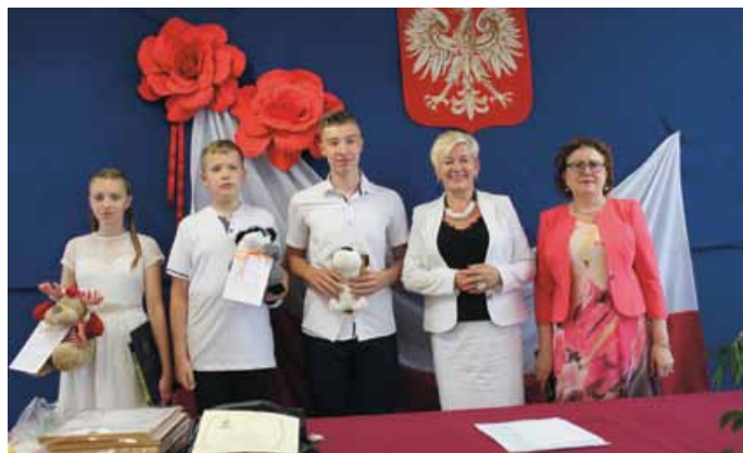
ZAKOŃCZENIE ROKU SZKOLNEGO W SP W GNIEŹDZISKACH