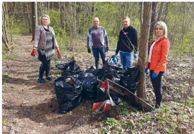
PRACOWNICY GOSW W ŁOPUSZNIE RÓWNIEŻ AKTYWNI WŁĄCZYLI SIĘ W INICJATYWĘ