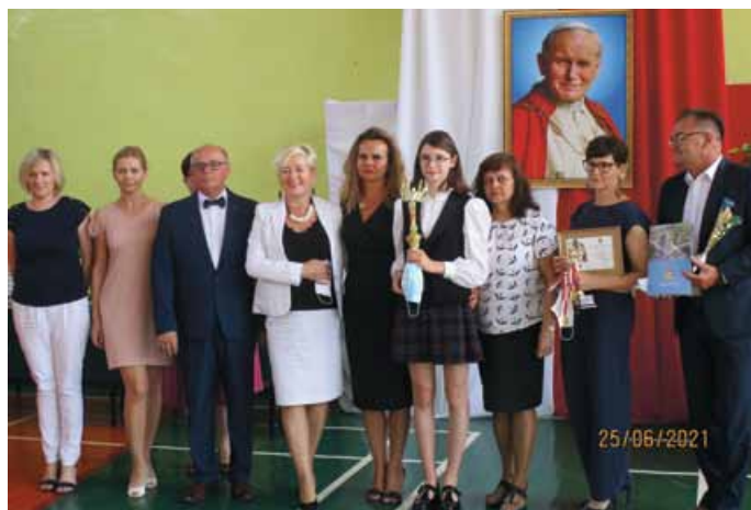
ZAKOŃCZENIE ROKU SZKOLNEGO W SP W ŁOPUSZNI