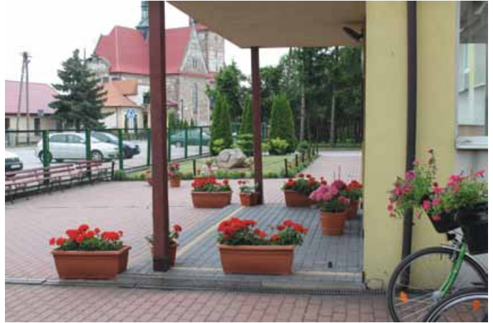
WYRÓŻNIENIE W KAT. CZYSTOŚĆ I ESTETYKA DLA SP W ŁOPUSZNI