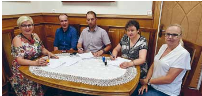
PODPISANIE UMOWY NA MODERNIZACJĘ OŚWIETLENIA ULICZNEGO NA TERENIE GMINY ŁOPUSZNO

Zakres niniejszego projektu obejmuje wymianę opraw oświetleniowych, w celu spełnienia wymagań oświetleniowych dla modernizowanych odcinków dróg (gminnych, powiatowych, wojewódzkich).