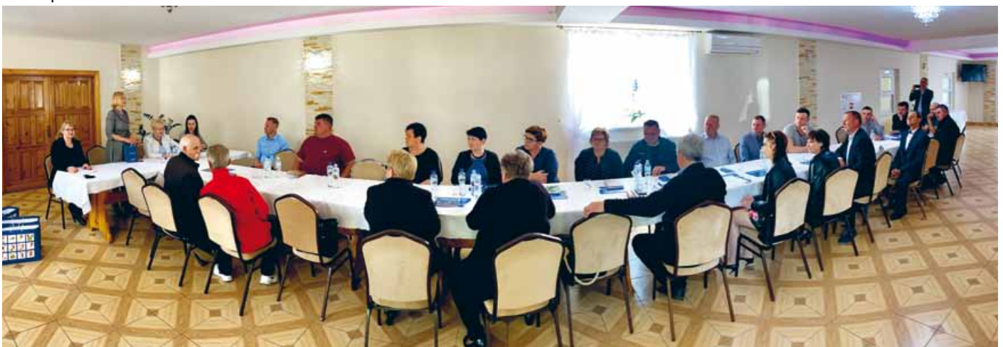
KONSTRUKTYWNA NARADA Z SOŁTYSAMI GMINY ŁOPUSZNO W DNIU 28 MAJA 2021 R.