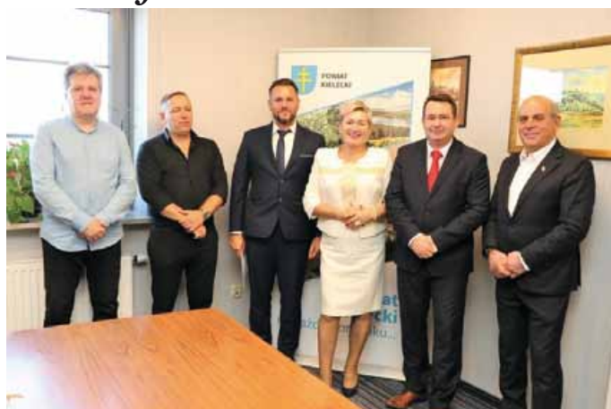
ZDJĘCIE Z PODPISANIA UMOWY NA PRZEBUDOWĘ DROGI POWIATOWEJ NR 0396T