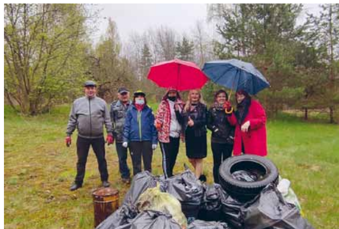
PRACOWNICY GOK W ŁOPUSZNIE ZBIERALI ŚMIECI W OKOLICACH LUDWIKOWA