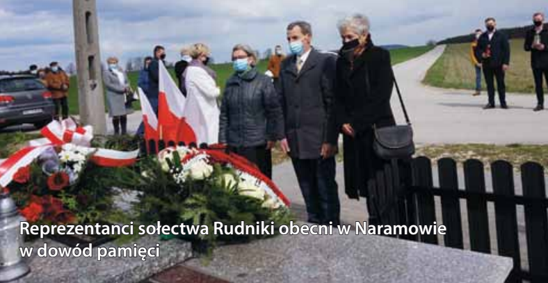
Reprezentanci sołectwa Rudniki obecni w Naramowie w dowód pamięci