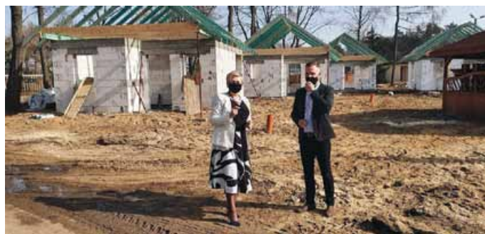
KOLEJNY ETAP REWITALIZACJI GMINY ŁOPUSZNO – GMINNY OŚRODEK SPORTOWO - WYPOCZYNKOWY