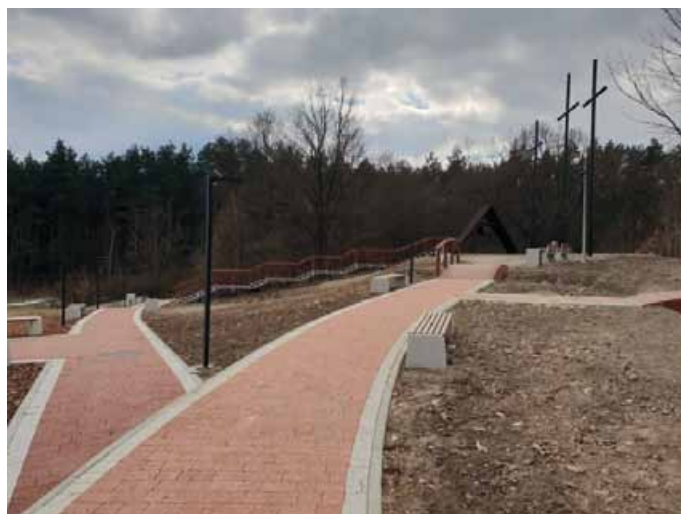
„WZGÓRZE TRZECH KRZYŻY” O ZNACZENIU SYMBOLICZNYM UZYSKAŁO IMPONUJĄCY WYGLĄD