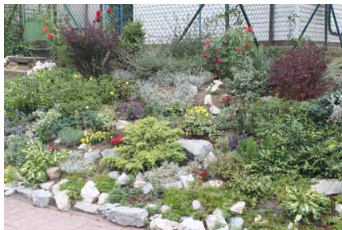
II MIEJSCE DLA SP W GNIEŹDZISKACH

III miejsce : świetlica wiejska w Gnieździskach.