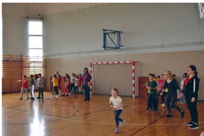
RYWALIZACJA KLAS I-III