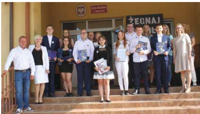
ZAKOŃCZENIE ROKU SZKOLNEGO W SP W DOBRZESZOWIE