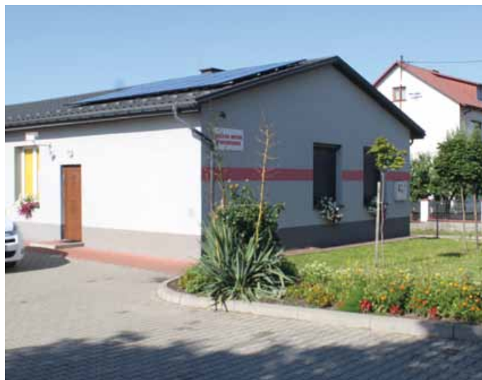
III MIEJSCE DLA ŚWIETLICY WIEJSKIEJ W GNIEŹDZISKACH