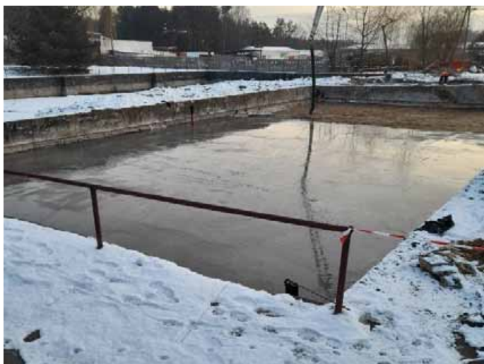
ZDJĘCIE SPRZED ROZPOCZĘCIA INWESTYCJI