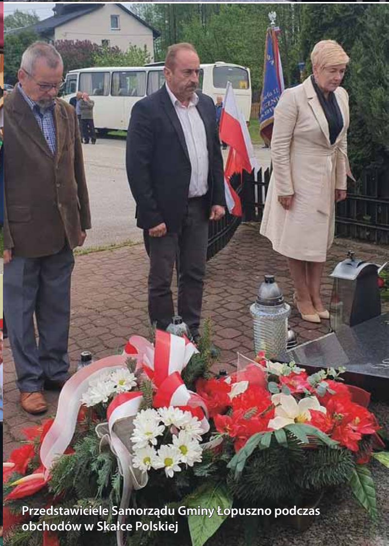
Przedstawiciele Samorządu Gminy Łopuszno podczas obchodów w Skałce Polskiej