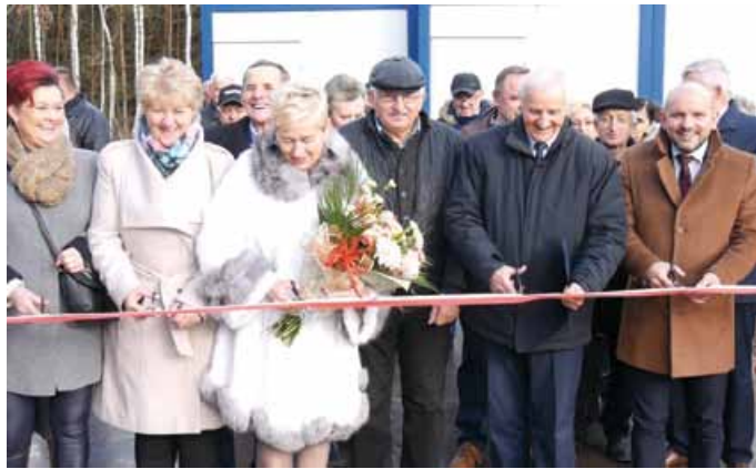
UROCZYSTE ZAKOŃCZENIE BUDOWY OCZYSZCZALNI ŚCIEKÓW W EUSTACHOWIE