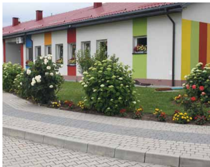
ŻŁOBEK GMINNY NAJPIĘKNIEJ UKWIECONĄ JEDNOSTKĄ GMINY ŁOPUSZNO