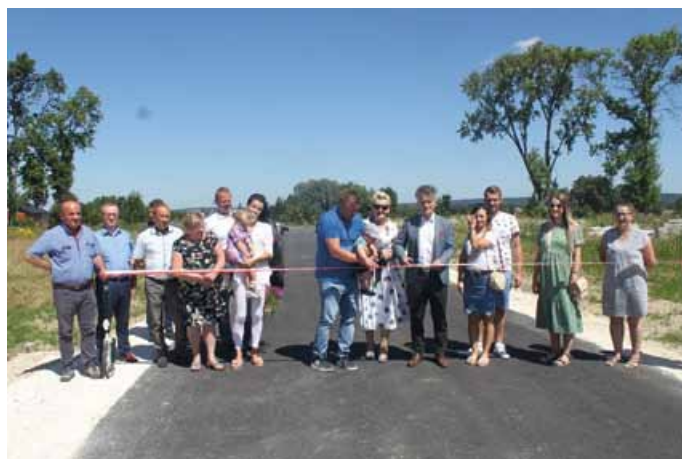
ODBIÓR DROGI W ŁOPUSZNI PRZY UL. KLONOWEJ Z UDZIAŁEM WDZIĘCZNYCH MIESZKAŃCÓW

doszu Dróg Samorządowych wynosząca: 75.744,12 zł), okres udzielonej gwarancji: 72 miesiące;