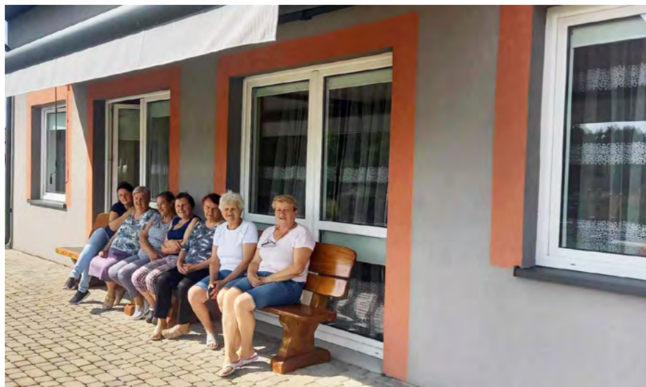
Nowa markiza tarasowa w sołectwie Eustachów