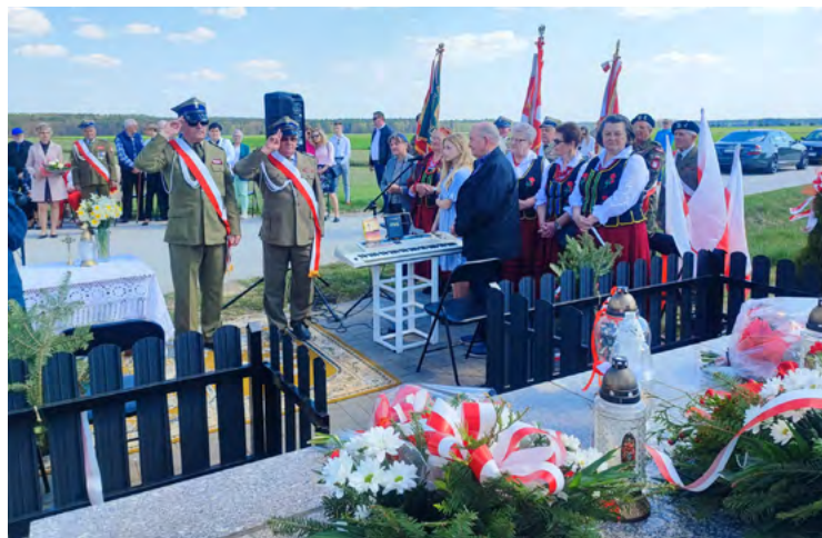
Delegacje uroczystie złożyły okolicznościowe wieńce