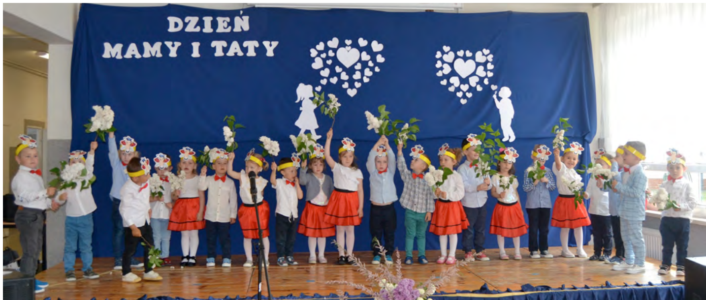
Mamusiom, Tatusiom najpiękniej śpiewamy

W piątek 26 maja 2023 r. odbyła się uroczystość z okazji Dnia Mamy i Taty, podczas której dzieci z oddziałów przedszkolnych zaprezentowały swój program taneczno-wokalno-recytatorski. Za swoje popisy dzieci zostały nagrodzone burzą braw. Po występie były życzenia, całusy, prezenty oraz wiele uśmiechów i radości. Dzieci poprzez akademię wyraziły swoim rodzicom miłość i wdzięczność za trud wychowania. Takie uroczystości w gronie rodzinnym pozwalają umacniać rodzinne więzi, uczyć miłości,