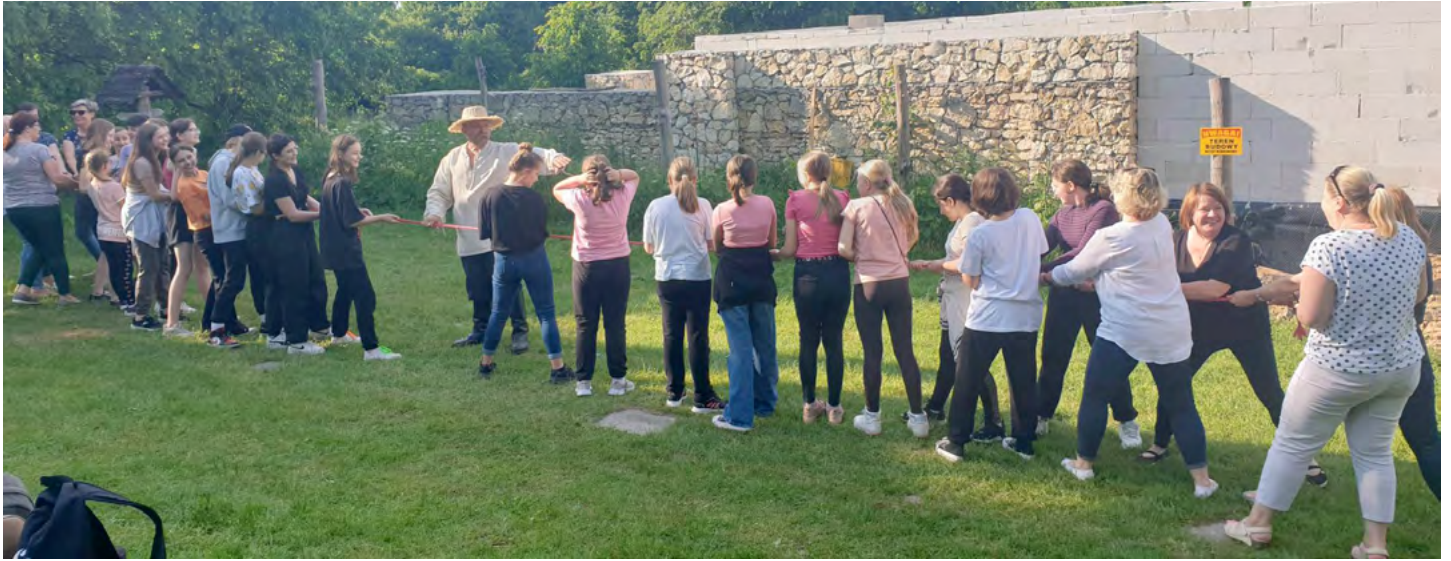
Rywalizacja w duch fair play

07 czerwca Chór Nauczycielsko – Uczniowski ze Szkoły Podstawowej im. S. Żeromskiego w Gnieździskach „zrealizował” nagrodę w postaci wycieczki do Ostoi Dworskiej ufundowaną podczas IV Powiatowego Przeglądu Kolęd i Pa-