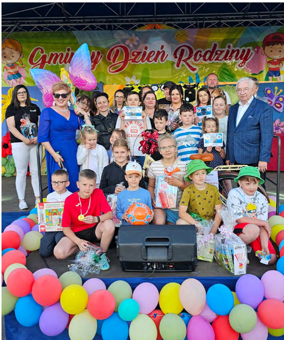
Szczęśliwi zwycięzcy loterii przeprowadzonej z okazji Gminnego Dnia Rodziny