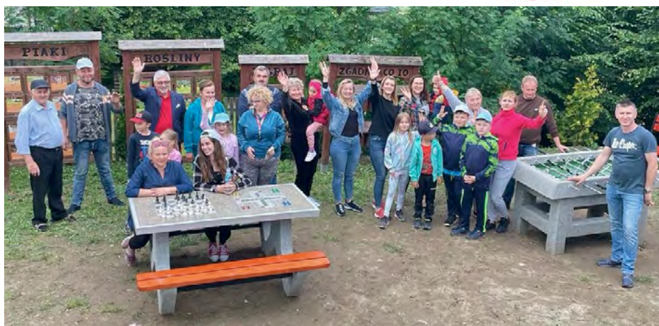
Wspaniała strefa wypoczynku efektem pracy mieszkańców

W drugim kwartale bieżącego roku Stowarzyszenie Nasze Czartoszowy realizowało projekt „Zielony zakątek - miejsce wypoczynku i rekreacji”. Zadanie to zostało dofinansowane, kwotą 20 660,00 zł przez Fundację Banku Gospodarstwa Krajowego im. J.K. Steczkowskiego w ramach programu „Moja