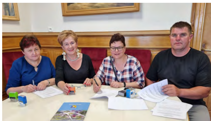
Koło Gospodyń i Gospodarzy Wiejskich „Józefianki” z dofinansowaniem na zakup tradycyjnych strojów ludowych