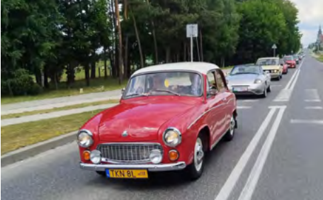
Przejazd ulicami Łopuszna w trakcie zlotu

W piękną słoneczną niedzielę 18 czerwca 2023 na terenie Miejsko - Gminnego Ośrodka Sportu i Rekreacji w Łopusznie odbyła się III edycja MOTO - SPOT Łopuszno 2023 . Wychodząc na przeciw oczekiwaniom osób fascynujących się motoryzacją, po raz kolejny zorganizowano wydarzenie, na którym można było zaprezentować swoje pojazdy takie, jak: - zabytkowe motocykle, - zabytkowe samochody, - motocykle współczesne, - auta terenowe, - auta sportowe, - pokaz car audio.