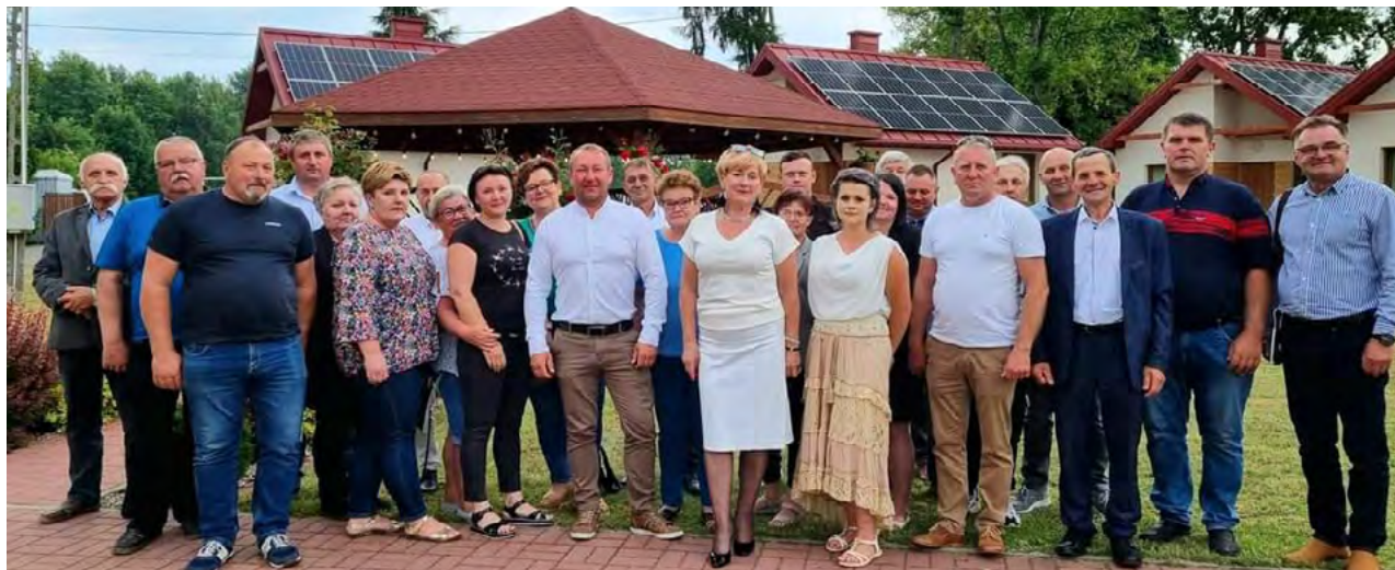
Grono aktywnie działających sołtysów z terenu Miasta i Gminy Łopuszno