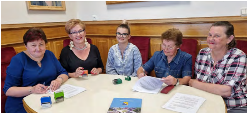
Koło Gospodyń Wiejskich w Lasocinie otrzymało środki na realizację zadania „Noc Kupały w poszukiwaniu kwiatu paproci”