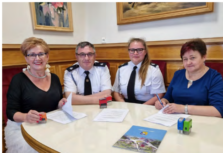
Stowarzyszenie Ochotnicza Straż Pożarna w Łopusznie otrzymała środki na zakup i naprawę instrumentów muzycznych dla Orkiestry Dętej w Łopusznie