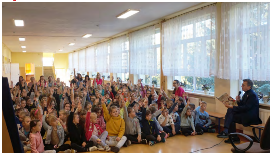
Znamienity gość zaaktywizował uczniów do żywej dyskusji

10 -tego maja br., w ramach ogólnopolskich obchodów „Dni bibliotek i bibliotekarza”, w Szkole Podstawowej im. Jana Pawła II w Łopusznie odbyło się wyjątkowe spotkanie autorskie .