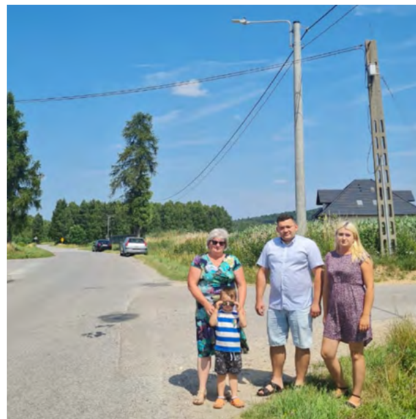
Dobudowane oświetlenie uliczne w sołectwie Podewsie