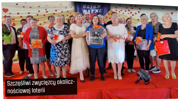
Szczęśliwi zwycięzcy okolicznościowej loterii