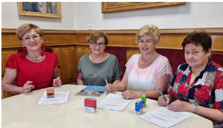
Stowarzyszenie „NASZE ŁOPUSZNO” z dofinansowaniem na realizację projektu pt. „Dbam o bezcenne zdrowie”