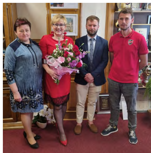
Stowarzyszenie Miejski Klub Sportowy „ZRYW 2021” w Łopusznie z dofinansowaniem na uczestnictwo w rozgrywkach piłkarskich ligi świętokrzyskiej SZPN w Kielcach