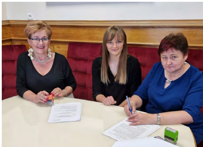
Stowarzyszenie Ludowy Zespół Sportowy Lasocin z dofinansowaniem na realizację „Wakacyjnego Turnieju Piłki Siatkowej OPEN”