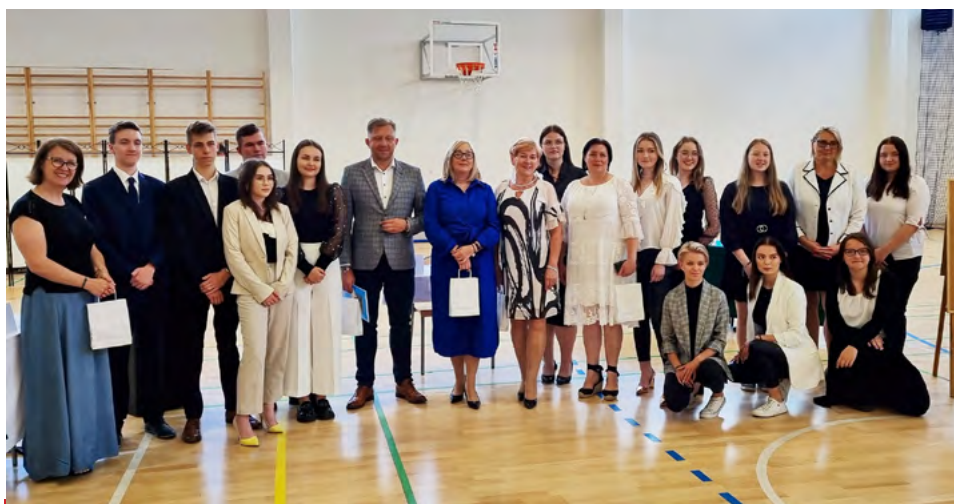
Współorganizatorzy konferencji poświęconej ochronie zdrowia psychicznego