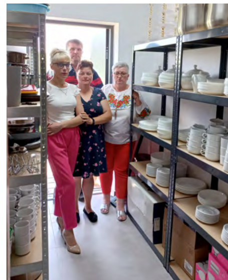
Nowe wyposażenie zakupione do świetlicy w Józefinie