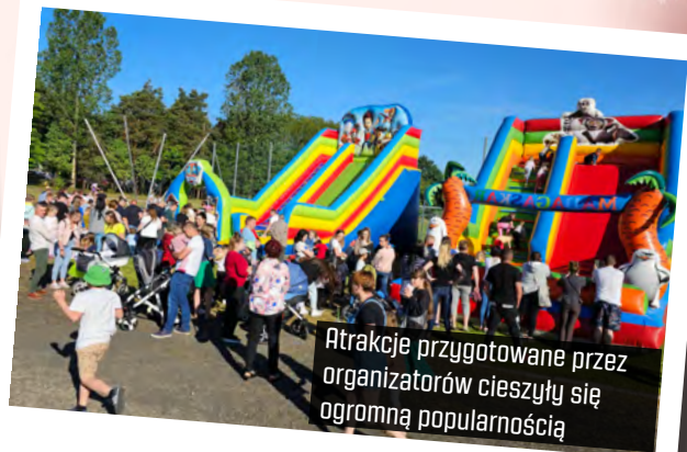
Atrakcje przygotowane przez organizatorów cieszyły się ogromną popularnością