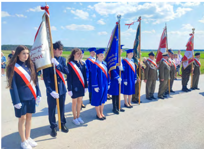
Okoliczności uświetniły poczty sztandarowe oraz występy wokalne