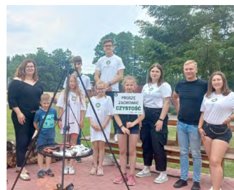
Ważne proekologiczne przedstawiciele młodego pokolenia