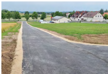
Wzorowo przeprowadzona inwestycja

06 lipca 2023 r. uroczyście została odebrana droga wewnętrzna prowadząca do Wzgórza Trzech Krzyży w Łopusznie. Wykonany odcinek do drogi wojewódzkiej 786 wynosi 250 mb. Dodatkowo powstał pas utwardzony, który w przyszłości może być wykorzystywany jako miejsca postojowe dla samochodów osobowych. Roboty budowlane przy przebudowie