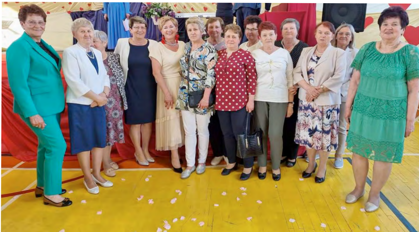
Prawdziwe święto licznie zgromadzonych mam

D zień Matki to najpiękniejsze święto, które obchodzone jest jako wyraz miłości, uznania i szacunku kierowanego dla wszystkich matek.