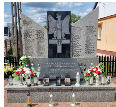
Pomnik pomordowanych w Skałce Polskiej