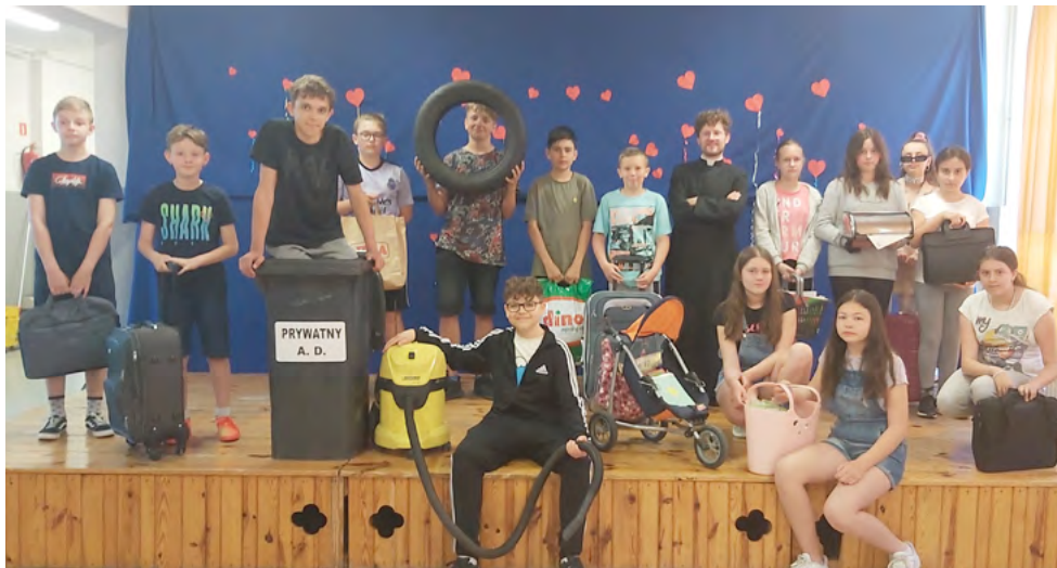
Inaczej - alternatywne plecaki

W dniach od 29 maja do 2 czerwca 2023 roku obchodziliśmy już po raz XV w naszej szkole Tydzień Profilaktyki i Promocji Zdrowia. W tym roku pod hasłem: