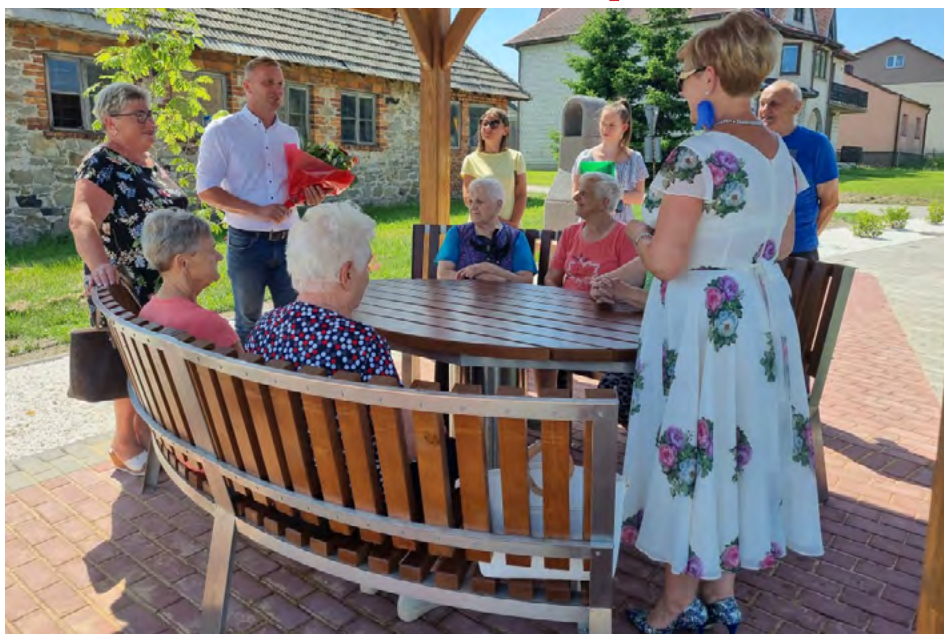
Nowy punkt na turystycznej mapie Miasta i Gminy Łopuszno

W śród 5 lipca 2023 r. dokonano odbioru technicznego wykonanych robót budowlanych przy punkcie obsługi rowerzystów w Łopusznie przy ulicy Koneckiej. Zadanie o wartości blisko 200 tys. zł wykonała fir-