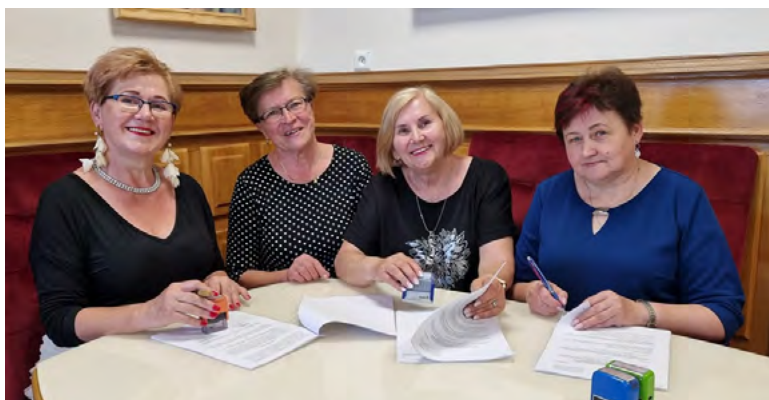
Stowarzyszenie „Kobiety Łopuszna” z dofinansowaniem na realizację widowiska obrzędowego pt. „Kiszenie kapusty” i organizację IX edycji Konferencji Senioralnej