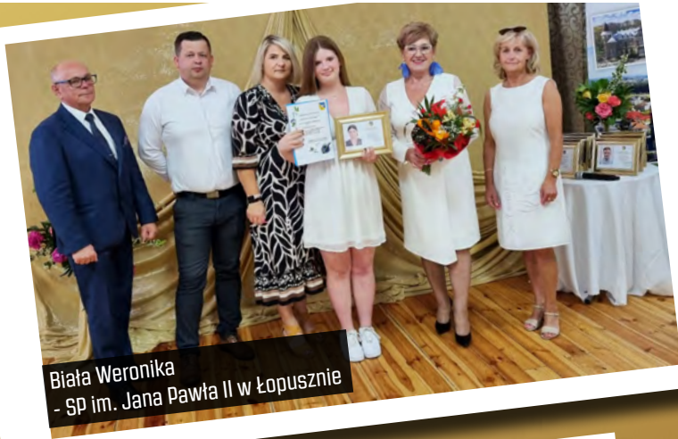
Biała Weronika - SP im. Jana Pawła II w Łopusznie