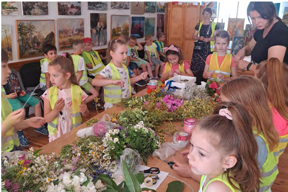
Warsztaty florystyczne przeprowadzone z myślą o najmłodszych

Obchody świętojańskie były niegdyś wielkim świętem powitania lata, obchodzonym w porze letniego przesilenia słońca, w najkrótszą noc w rok - z 23 na 24 czerwca i najdłuższy dzień - 24 czerwca.