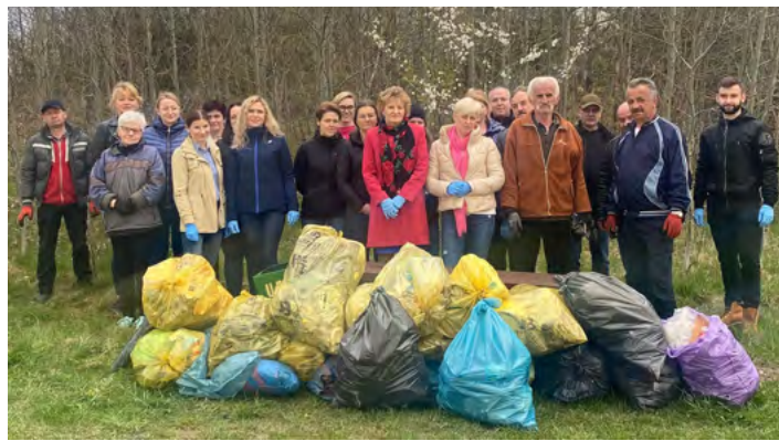
Zbiórka śmieci pracowników Urzędu Miasta i Gminy Łopuszno zakończona sukcesem