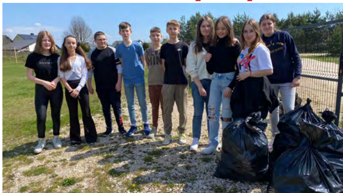
Uczniowie SP w Gnieździskach aktywnie wzięli udział w akcji