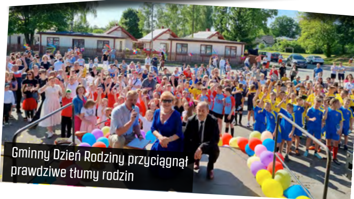
Gminny Dzień Rodziny przyciągnął prawdziwe tłumy rodzin