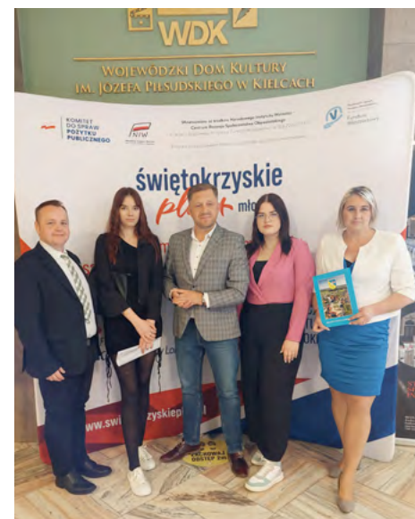
Młodzi przy współpracy ze swoimi opiekunami pozyskali granty na działania