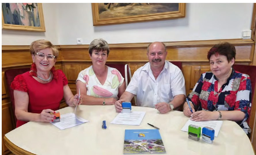
Stowarzyszenie Przyjaciół, Miłośników Muzyki i Tańca Ludowego otrzymało dofinansowanie na „Doposażenie Zespołu Pieśni i Tańca Łopuszno w tradycyjne stroje ludowe”