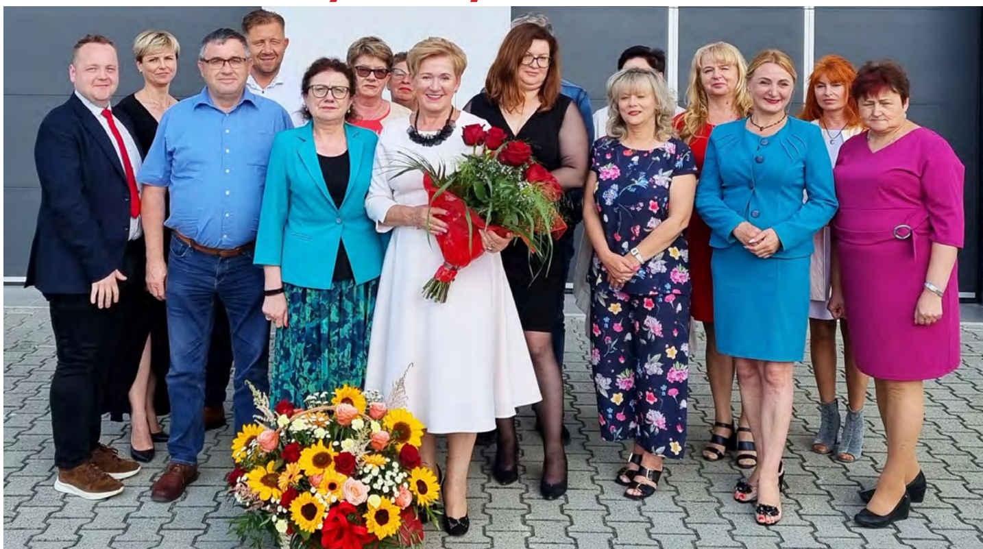
Burmistrz Miasta i Gminy Łopuszno Irena Marcisz w towarzystwie dyrektorów i kierowników jednostek organizacyjnych

29 czerwca 2023 r. podczas XLIX sesji Rady Miejskiej w Łopusznie po przeprowadzeniu debaty nad raportem o stanie Gminy Łopuszno za 2022 rok – prezentującego pełne spektrum obszarów działalności na terenie miasta i gminy Łopuszno – Radni Rady Miejskiej w Łopusznie postanowili udzielić wotum zaufania Burmistrzowi Miasta i Gminy Łopuszno Irenie Marcisz , co zostało wyrażone w uchwale Nr XLIX / 406 / 2023 podjętej na podstawie art. 28 aa ust. 9 ustawy z dnia 8 marca 1990 r. o samorządzie gminnym (t.j. Dz.U. z 2023 r., poz. 40 ze zm.).