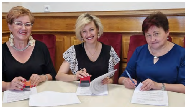
Stowarzyszenie „Aktywne Kobiety Gniezdziak” otrzymało środki na przeprowadzenie warsztatów z wykorzystaniem technik automasażu pod nazwą „Naturalnie – dbajmy o urodę”