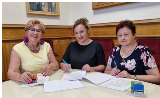
Koło Gospodyń Wiejskich „Antonówki” Antonielów z dofinansowaniem na realizację warsztatów zielarskich i kulinarnych pt. „Zdrowie z natury – zioła mają moc”