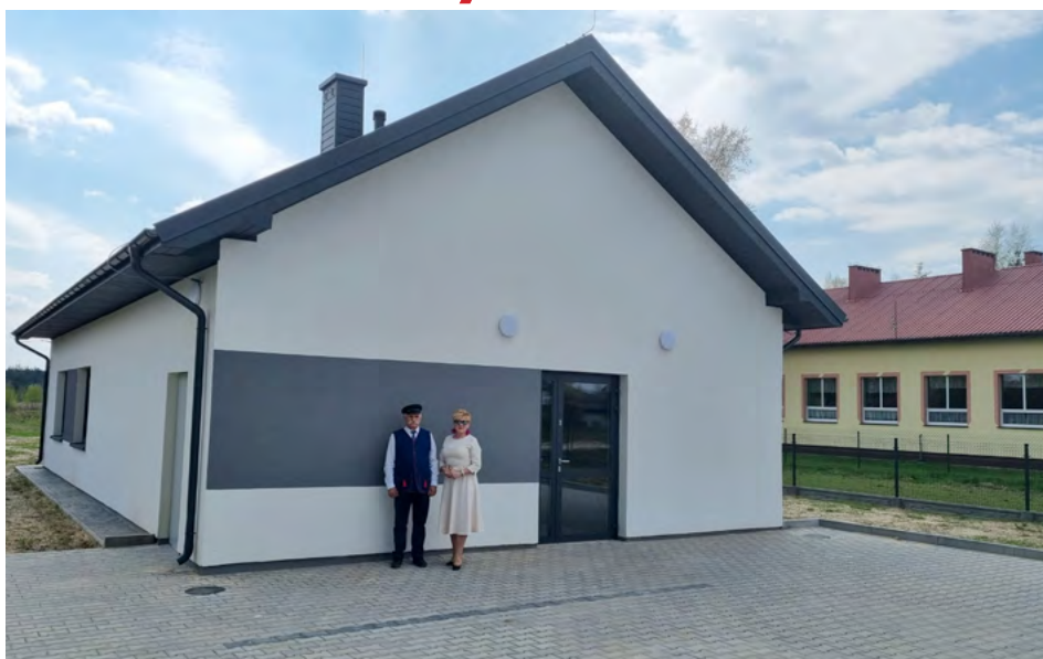
Wybudowana świetlica w Fanisławicach