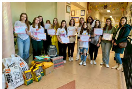
Szkolne Koło Wolontariatu w Łopusznie propaguje aktywność społeczną