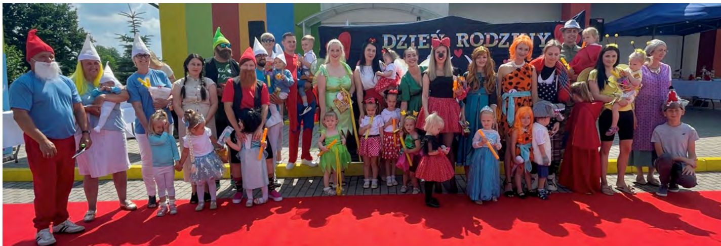
Program artystyczny w wykonaniu naszych milusińskich