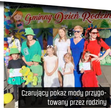
Czarujący pokaz mody przygotowany przez rodziny