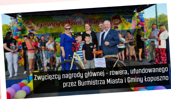
Zwycięzcy nagrody głównej - rowera, ufundowanego przez Burmistrza Miasta i Gminy Łopuszno