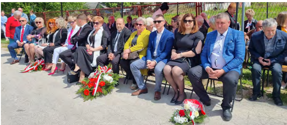
Udział władz samorządowych, znamienitych gości i wdzięcznych mieszkańców w uroczystości patriotycznej