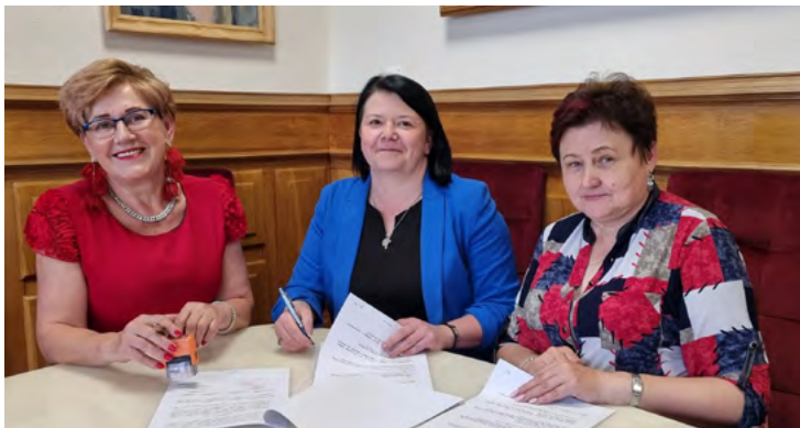
Stowarzyszenie „TKI” z siedzibą w Marianowie otrzymało środki na stworzenie „Vademecum łopuszańskich organizacji pozarządowych”