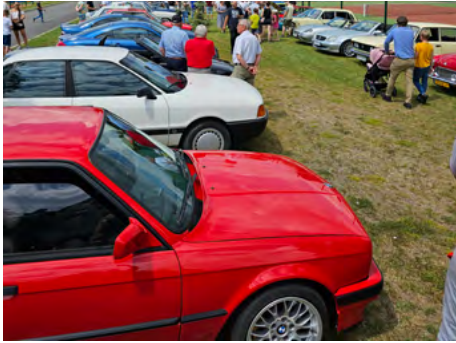
Wiele aut i jeszcze więcej oglądających - MOTO SPOT jak co roku przyciąga pasjonatów motoryzacji