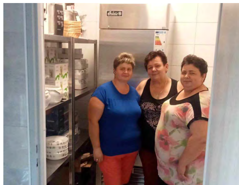
Świetlica w Sarbicach Drugich doposażona w nowy sprzęt