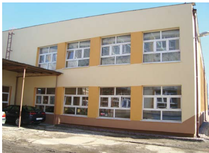
Termoizolacja sali gimnastycznej przy Zespole Szkół im. Jana Pawła II w Łopusznie (data wykonania: grudzień 2009 r., wykonawca: Firma Handlowo – Budowlana ATD)