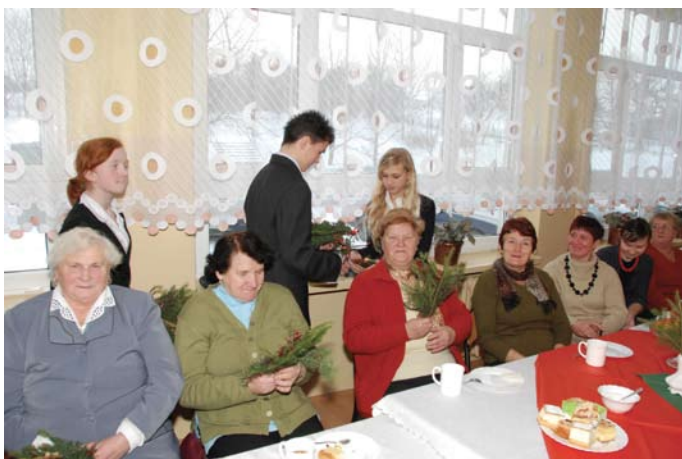
Każdy uczestnik spotkania wigilijnego otrzymał świąteczny stroik

Na dobry początek marzenia trochę inne niż te związane ze swoimi zachciankami i potrzebami. Może ucieszyć zabieganą