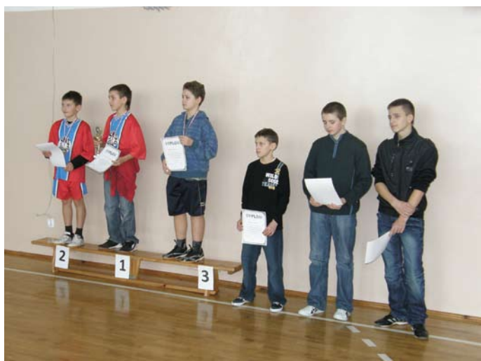
Chłopcy ze szkoły podstawowej z dyplomami