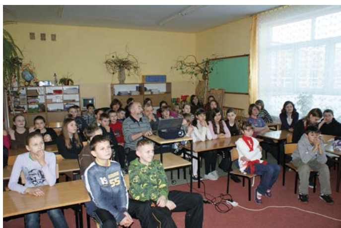
Pokaz slajdów z podróży