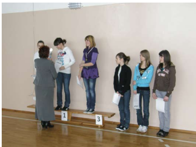
Wręczenie pucharu najlepszej tenisistce w kategorii gimnazjalistek