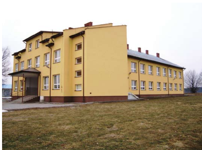
Termoizolacja Szkoły Podstawowej w Dobreszowie (data wykonania: listopad 2009 r., wykonawca: PPHU „SKORPION”).