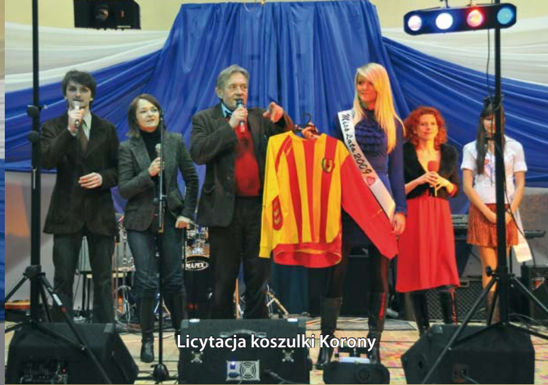
Licytacja koszulki Korony