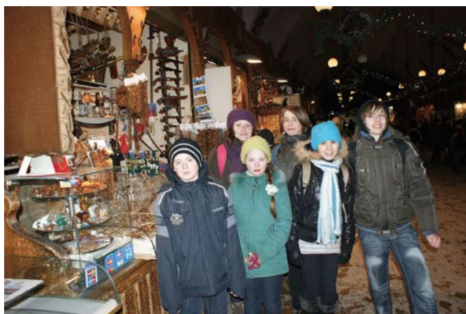
Wieczne zakupy w Sukiennicach