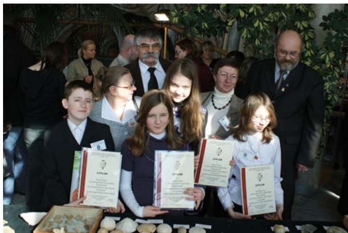
Laureaci Giełdy z władzami ŚTPNG

ła tłumy zwiedzających. Organizatorem było Świętokrzyskie Towarzystwo Przyjaciół Nauk Geologicznych. Wśród wystawców, których było ponad sto, pojawili się kolekcjonerzy minerałów i skamieniałości z całej Polski oraz producenci biżuterii, wśród których prym wiodł Egipcjanin prezentujący ozdoby wykonane m.in. z muszli morskich ślimaków.