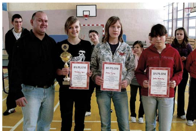
Ze zwycięstwa w turnieju tenisa cieszą się dziewczęta