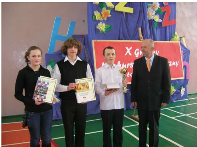
Laureaci w kategorii gimnazjów