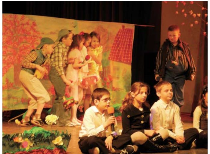
Strach przed właścicielem ogrodu