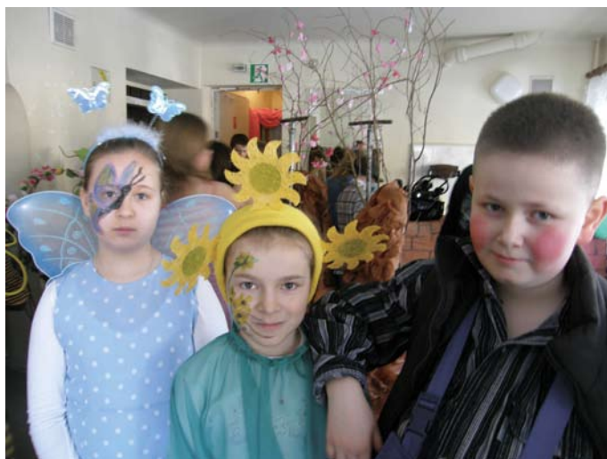
Przed występem ... trema

To fragment bajki O. Willde'a The Selfish Giant (Samolubny Olbrzym) , którą nasi uczniowie zaprezentowali 9 marca na IV Świętokrzyskim Przeglądzie Teatrzyków w języku angielskim organizowanym przez wydawnictwo MM Publications Polska, Świętokrzyskie Centrum Doskonalenia Nauczycieli