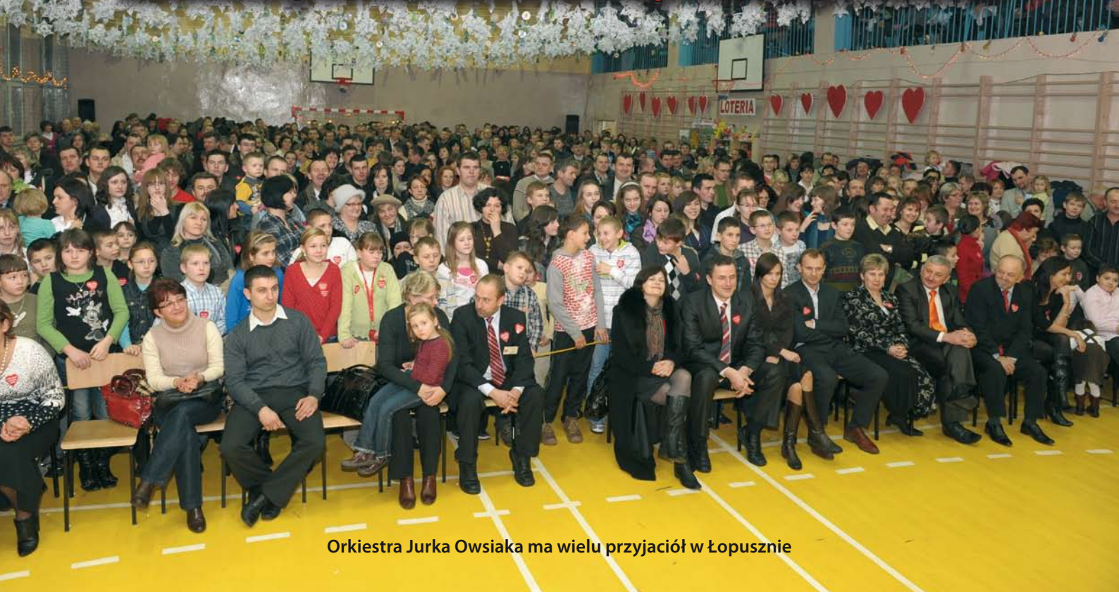
Orkiestra Jurka Owsiaaka ma wielu przyjaciół w Łopusznie