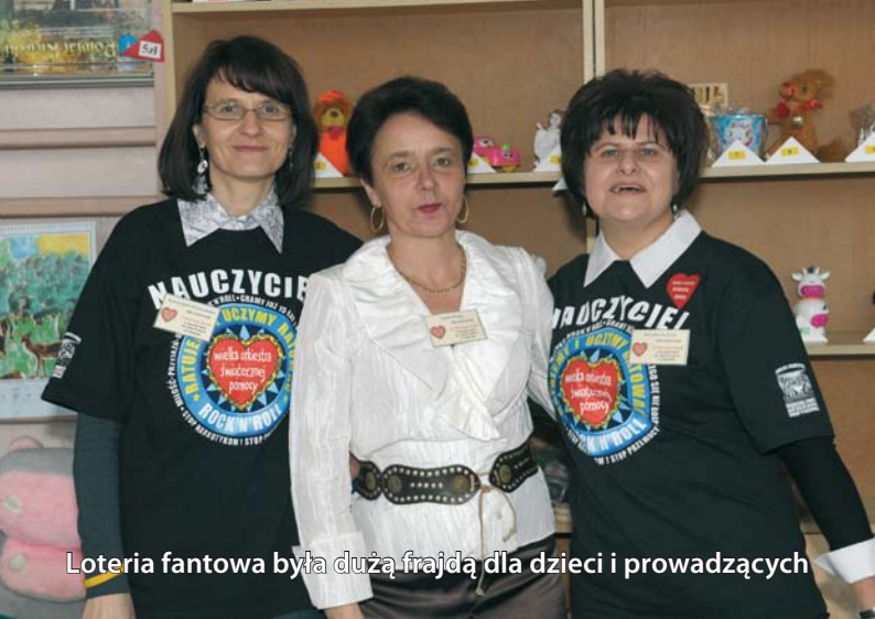
Loteria fantowa była dużą frajdą dla dzieci i prowadzących