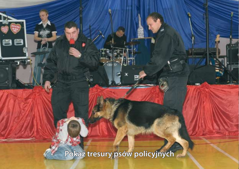
Pokaz tresury psów policyjnych