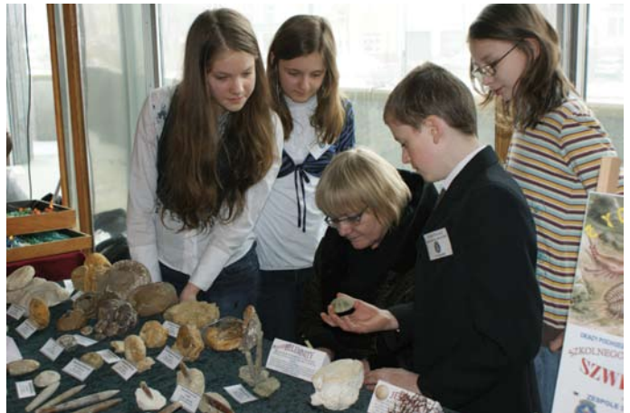
Udzielamy wywiadu pani redaktor z Echa Dnia

Komisja konkursowa złożona ze znanych kieleckich geologów pod przewodnictwem Prezesów Świątokrzyskiego To-