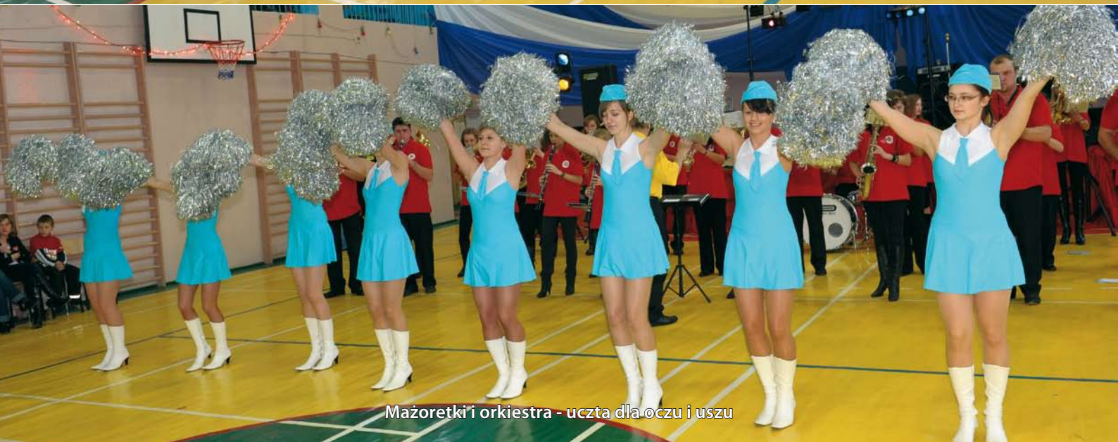
Mażoretki i orkiestra - uczta dla oczu i uszu