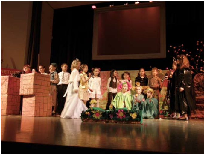
W pięknym ogrodzie Olbrzyma

naszych uczniów w tego typu przeglądzie, zarówno na konkursie wojewódzkim, jak i na prawdziwej scenie teatralnej, to zaprezentowali oni prawdziwy kunszt aktorski i przezwyciężając treść znaleźli się w ścisłej czołówce. Ponadto dzieciaki popisały się doskonałą wymową języka angielskiego oraz świetną interpretacją sztuki, co oczywiście zostało docenione przez jury.