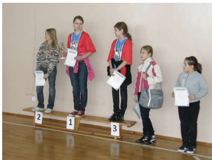
Zwycięskie dziewczęta ze szkoły podstawowej