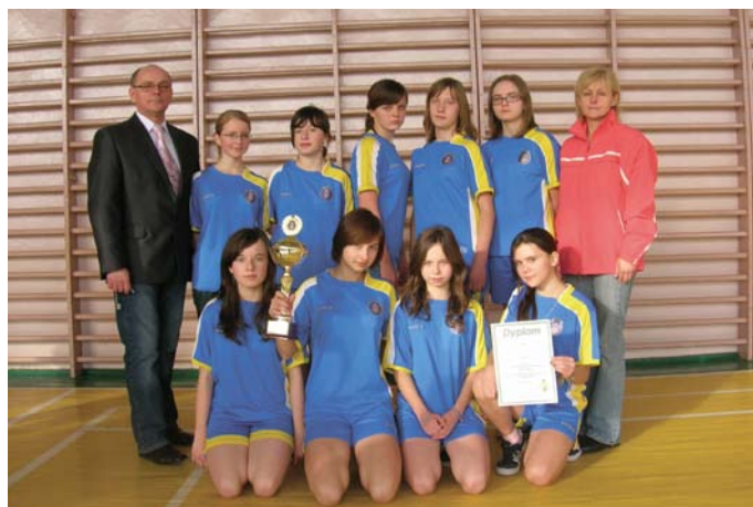
Dziewczęta z Gimnazjum w Łopusznie