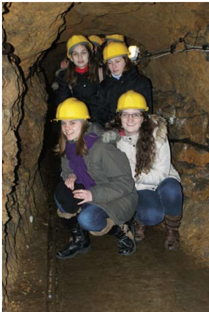
Pośród wąskich korytarzy kopalni

skie i niskie korytarze zmuszały nas do pokonywania większości trasy w pozycji pochylonej. Okazało się, że kaski górnicze ochroniły wiele głów przed guzami. Zazdrościliśmy młodszym i niższym kolegom, którzy wyprostowani kroczyli chodnikami kopalni. W głębi naszym oczom ukazały się zachowane w stanie nie naruszonym komory „Srebrna” i „Zawałowa”, a tam wyrobiska chodnikowe oraz odtworzone miejsca pracy i narzędzia gwarków. Można było również zobaczyć olbrzymie głązy dolomitu oderwane siłą grawitacji ze stropu wyrobisk. Mogliśmy tu cofnąć się w czasie i zobaczyć, jak przy skąpym świetle kaganków, prawie w ciemnościach, używając prymitywnych narzędzi, ciężko pracowali dawni gwarkowie.