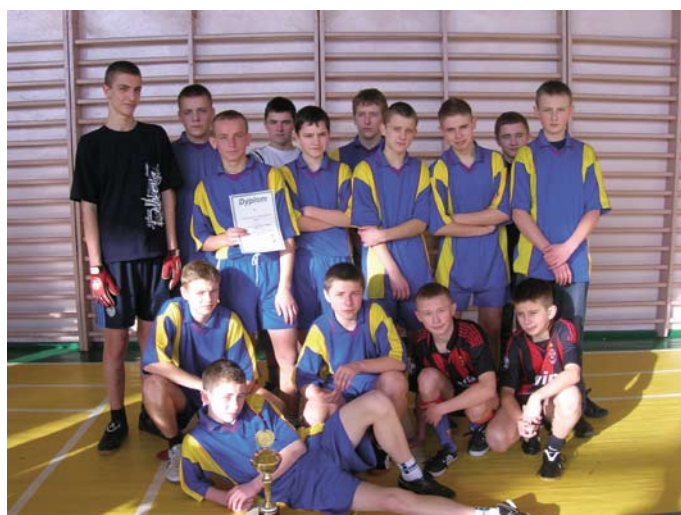
Zawodnicy z Gnieździsk