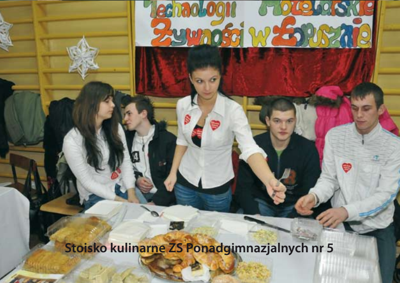
Stoisko kulinarne ZS Ponadgimnazjalnych nr 5