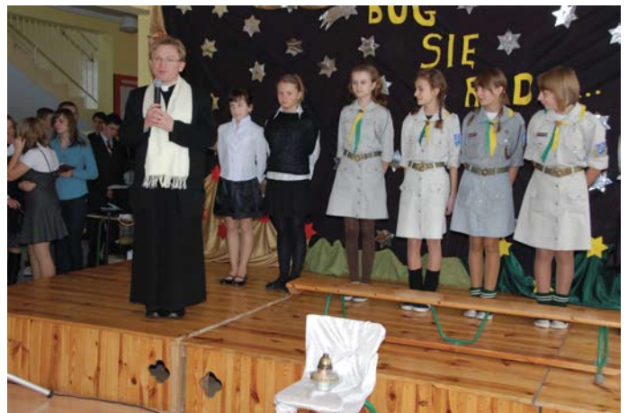
Powitanie zgromadzonych gości przez księdza z Parafii NSJ w Wiernej Rzece

mamę, zmęczonego tatę, może sprawić niespodziankę babci i dziadkowi, a może podarować własny czas i zainteresowanie osobie starszej, samotnej?