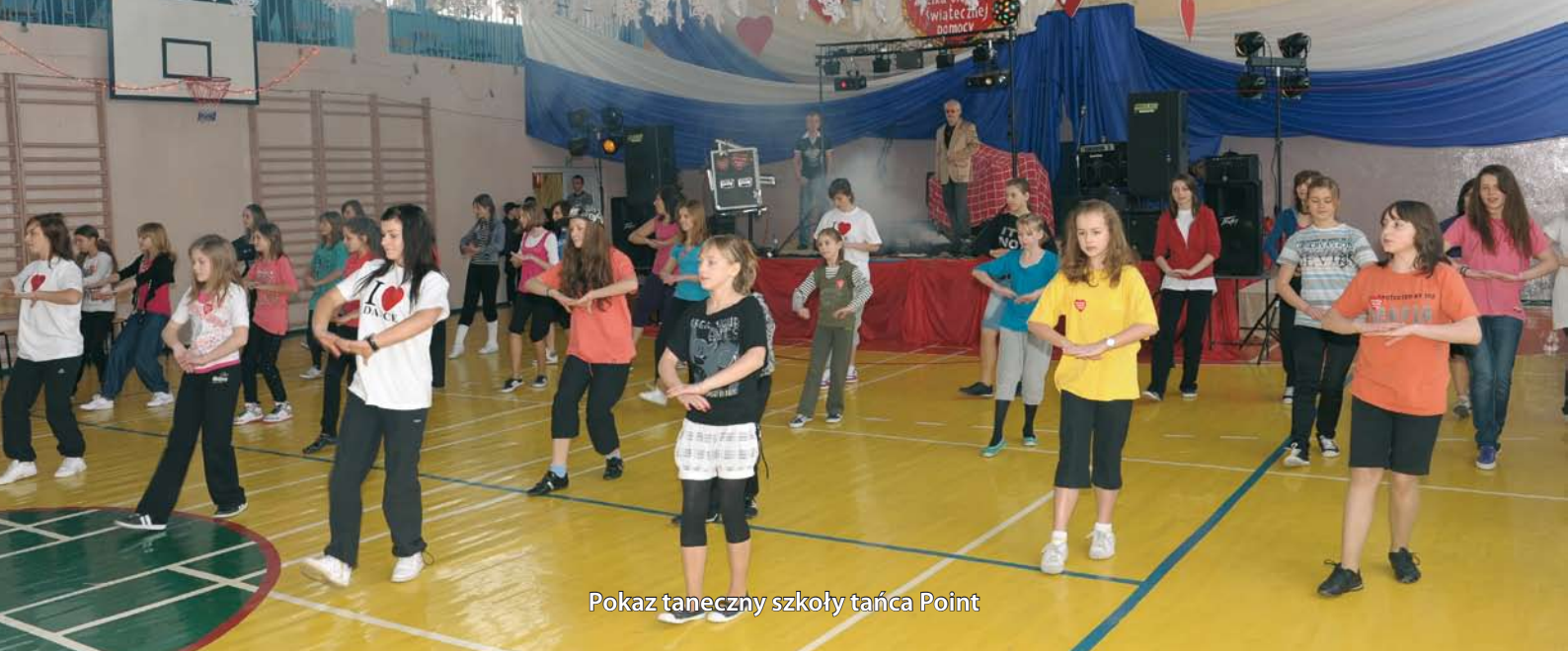
Pokaz taneczny szkoły tańca Point