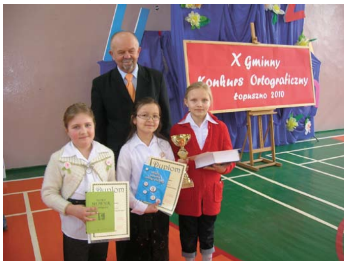
Laureatki w najmłodszej kategorii