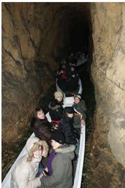
W Sztolni Czarnego Pstrąga

W drugą sobotę marca, choć pogoda nastrajała niezbyt entuzjastycznie, Szwendaczki, jak zwykle w świetnych humorach, wyruszyły do Tarnowskich Gór. W autokarze nie zabrakło wspólnego śpiewania przy akompaniamencie gitary, a także rozmów i wielu okazji do śmiechu.