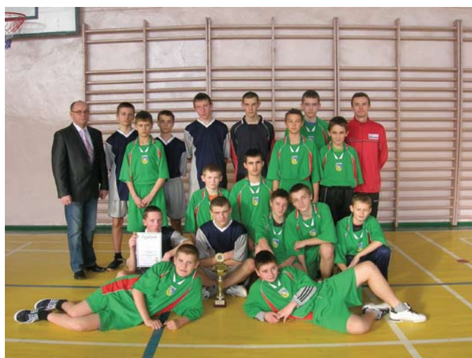
Gimnazjaliści z Łopuszna