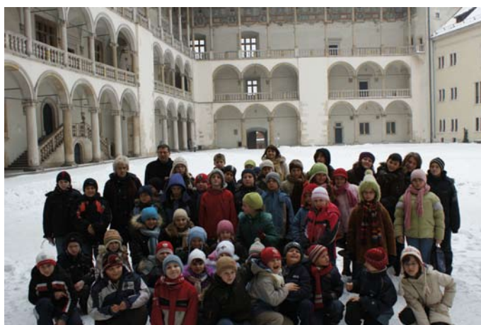
Na dziedzińcu Zamku Królewskiego na Wawelu