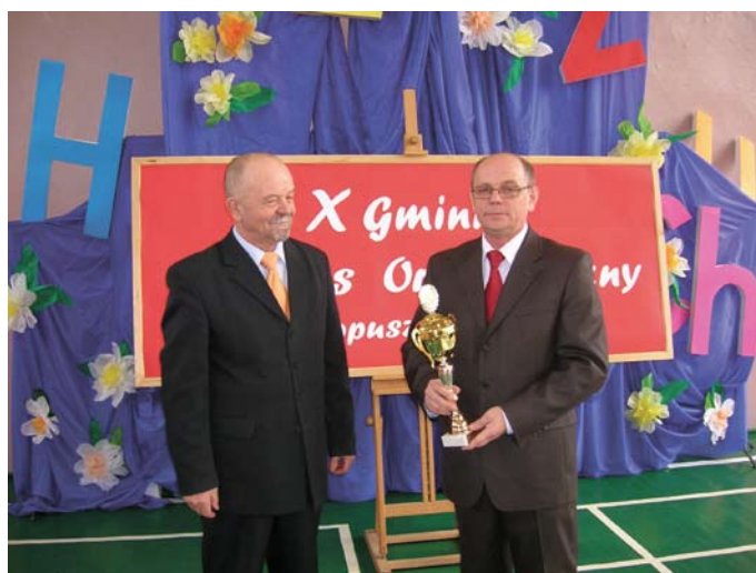
Puchar od wójta dla organizatorów