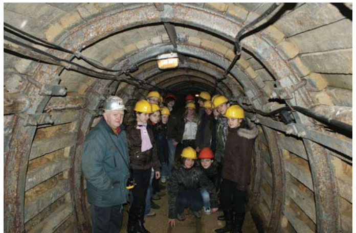
Korytarz Zabytkowej Kopalni Srebra

Po trzech godzinach dotarliśmy na miejsce. Najpierw zwiedzaliśmy Zabytkową Kopalnię Srebra. Jej wyrobiska pochodzą z XVII - XIX wieku. Obiekt ten z inicjatywy Stowarzyszenia Miłośników Ziemi Tarnogórskiej został odrestaurowany i oddany do użytku turystów w 1976 roku. Na nadszybiu kopalni znajduje się małe muzeum poświęcone historii górnictwa. Ciekawe opowiadanie przewodnika wzbudziło nasze