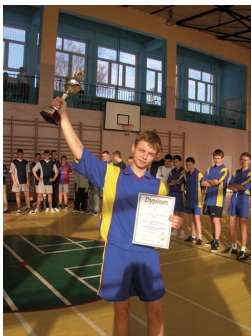
Kapitan gości cieszy się z pucharu