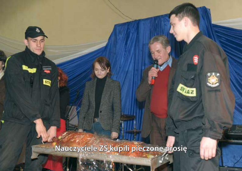
Nauczyciele ZS kupili pieczone prosię