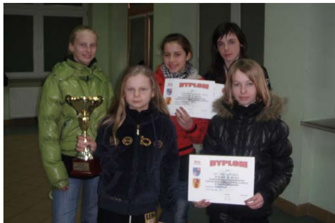
Reprezentacja UKS WiR na zawodach markoregionu