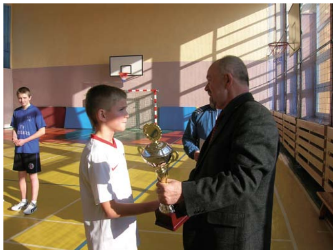
Pan wójt wręczał pamiątkowe puchary