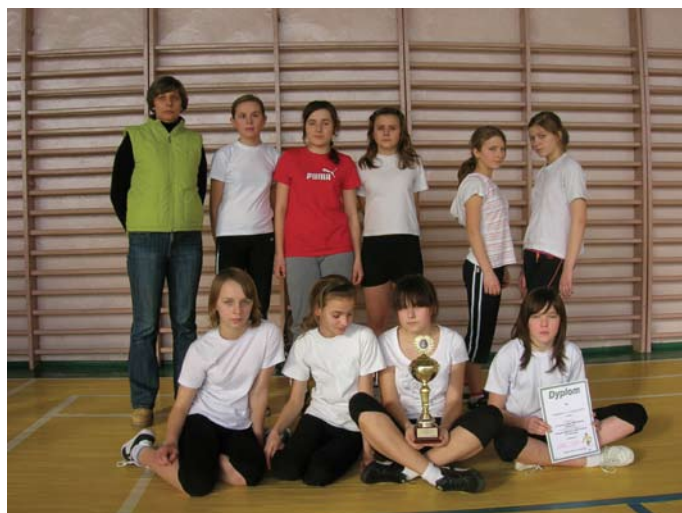
Gimnazjalistki z Gnieździsk

Wśród dziewcząt rozegrano tylko jeden mecz, który zdecydowanie wygrały zawodniczki z Łopuszna.