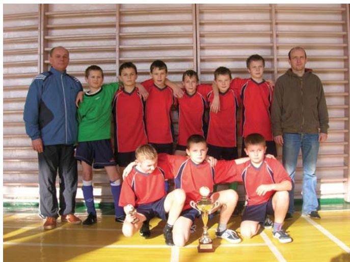
Zwycięska drużyna z Łopuszna