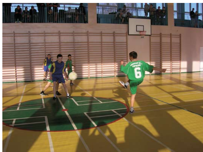
Mecze były zacięte