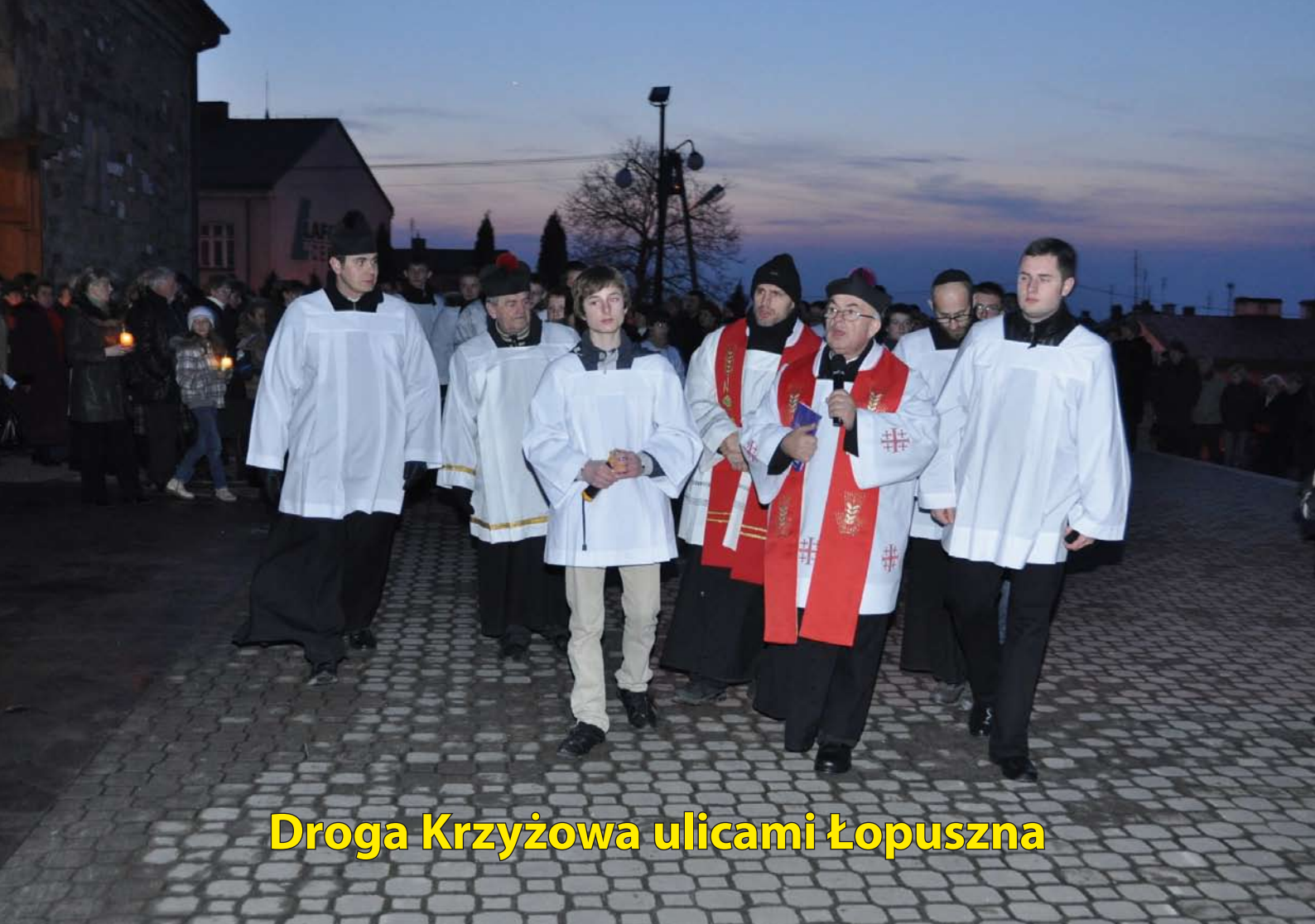
Droga Krzyżowa ulicami Łopuszna