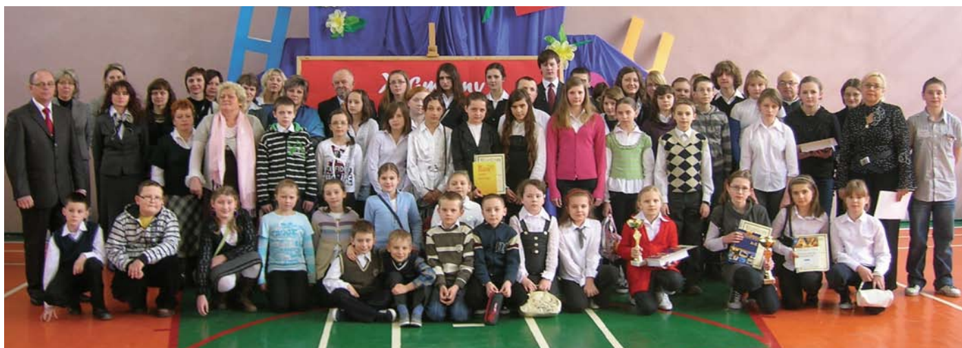
Pamiętkowe zdjęcie wszystkich uczestników konkursu