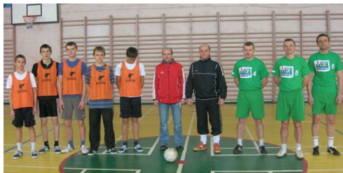
Drużyna z Lasocina oraz zespół nauczycieli przed meczem

Rozgrywki dostarczyły wielu emocji, a poziom spotkań i zaprezentowanych umiejętności był wysoki. Cele turnieju czyli popularyzacja piłki nożnej i organizacja czasu wolnego zostały w pełni zrealizowane. Świadczy o tym liczba uczestników biorących udział w turnieju – 48 oraz liczna rzesza kibiców obserwująca zmagania drużyn.