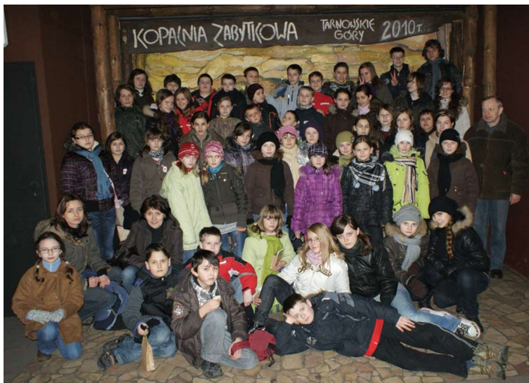
Pamiętkowe zdjęcie wszystkich Szwendaczek