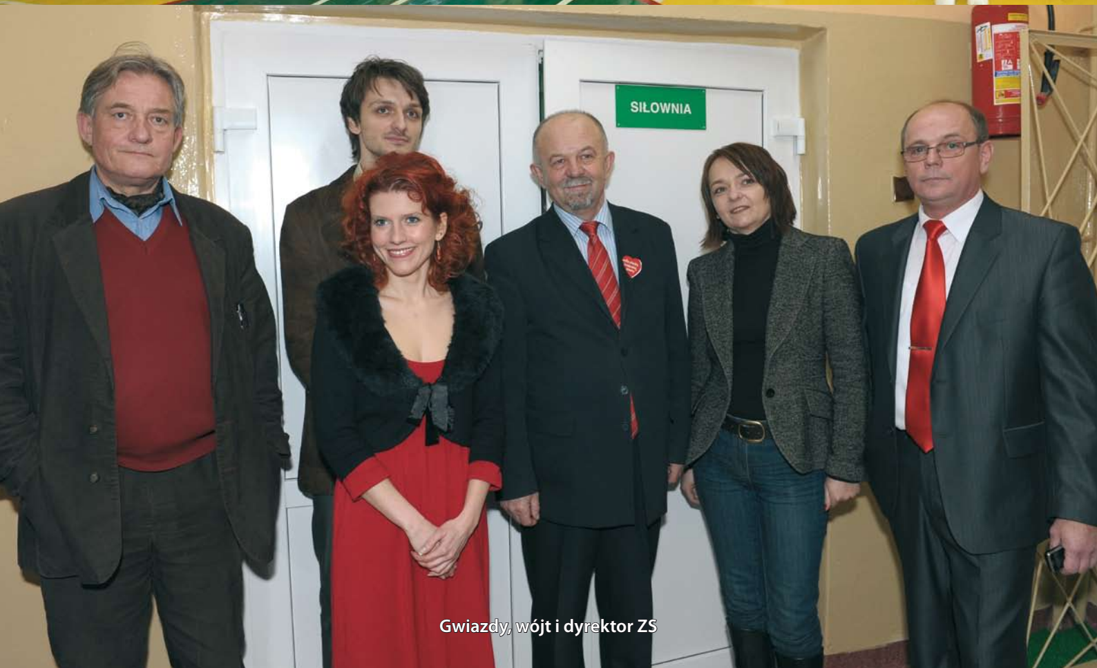
Gwiazdy, wójt i dyrektor ZS