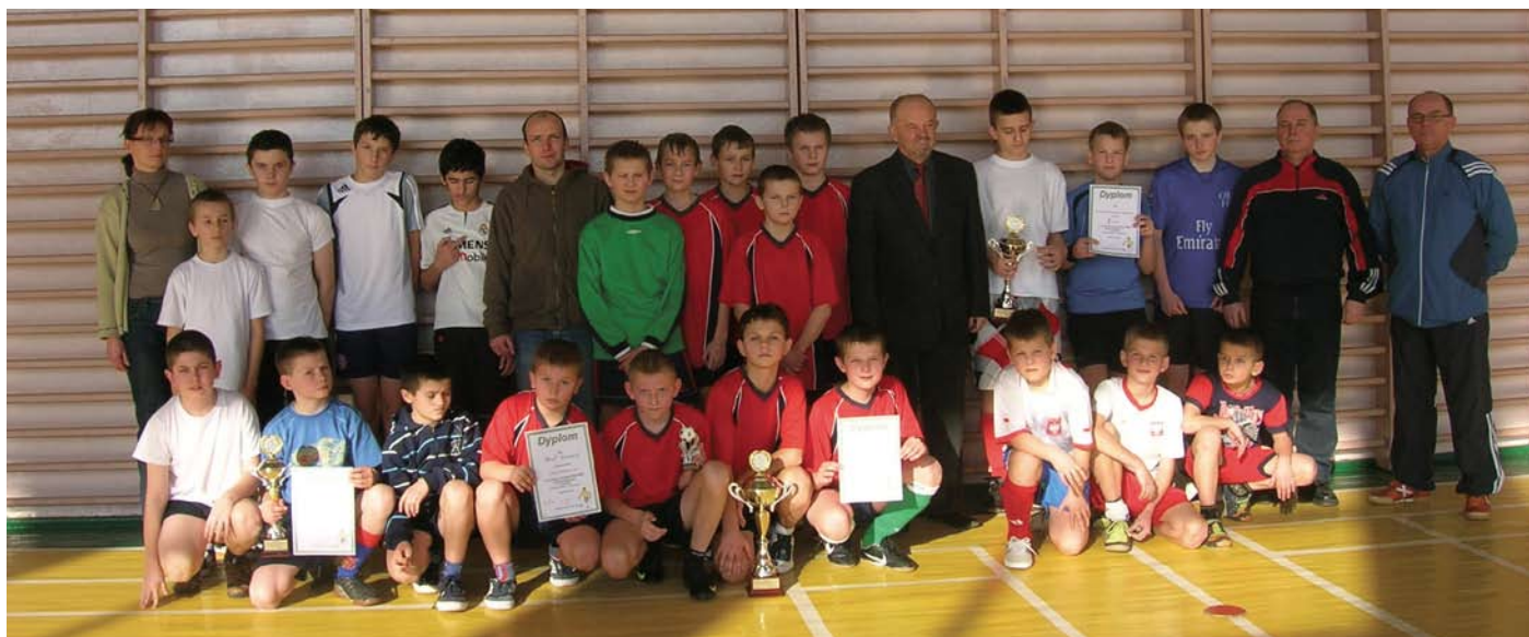
Drużyny chłopców z opiekunami i panem wójtem