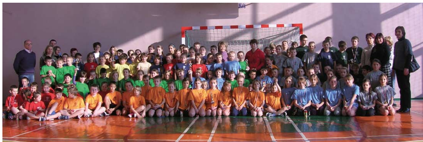
Uczestnicy Turnieju Gier i Zabaw w komplecie