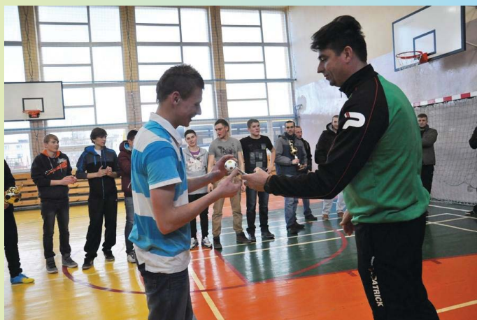
II Turniej Andrzejkowy

Niech te święta Bożego Narodzenia będą jasne, ciepłe, pełne uśmiechu, niech wypełnią Państwa serca radością, a w Nowym Roku życzymy samych szczęśliwych kart od losu.