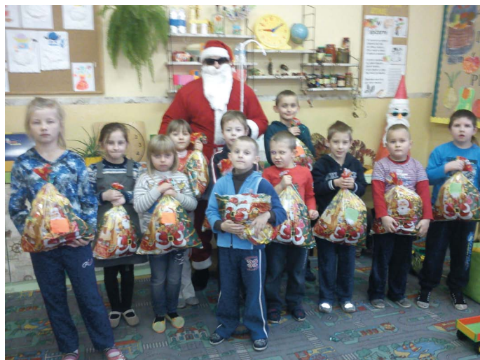
Mikołaj w szkole