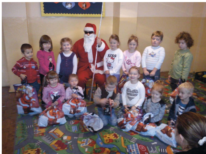
Mikołaj w przedszkolu