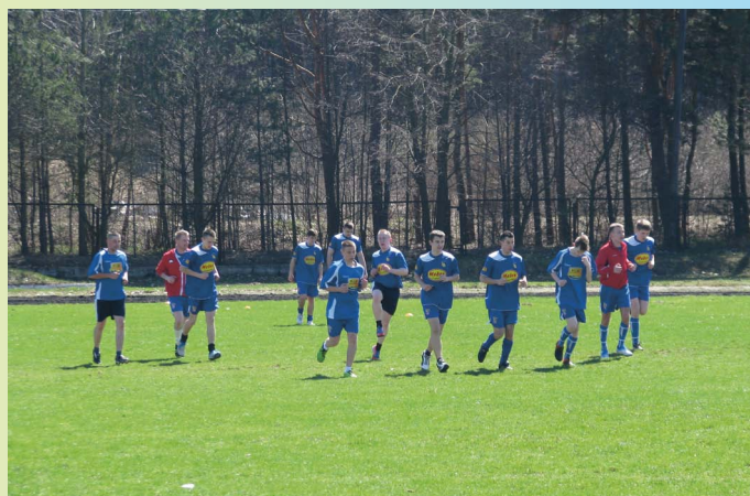
Zawodnicy ŁKS podczas treningu

W związku z nadchodzącymi świętami przekazujemy wszystkim mieszkańcom naszej gminy najserdeczniejsze życzenia.