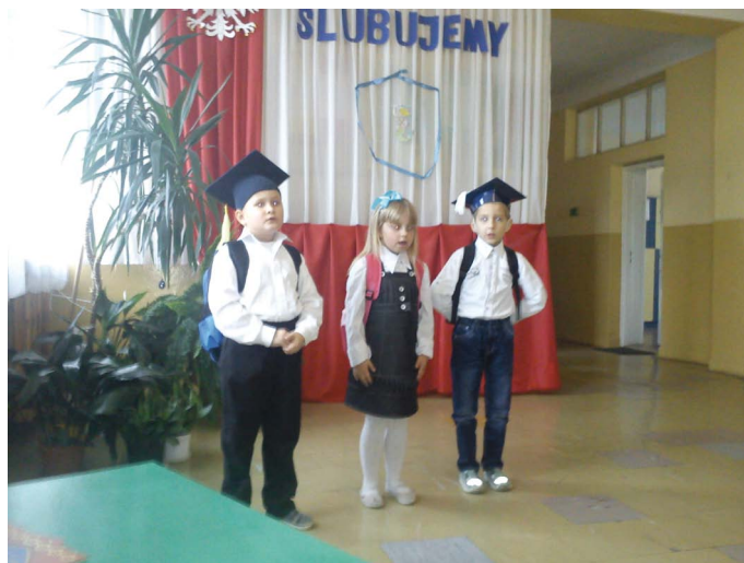
Ślubowanie klasy pierwszej