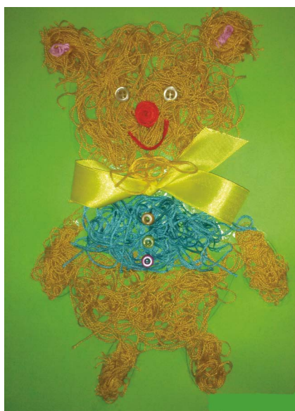
I miejsce - Karolina Puchała kl. I b