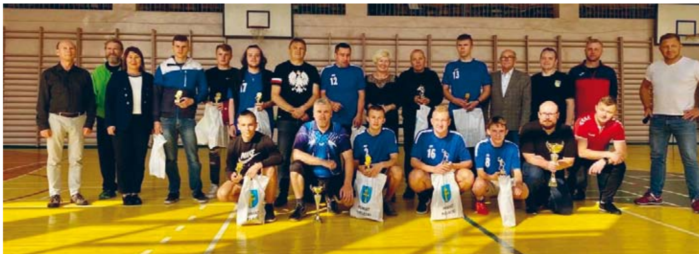
RADOŚNI UCZESTNICY TURNIEJU