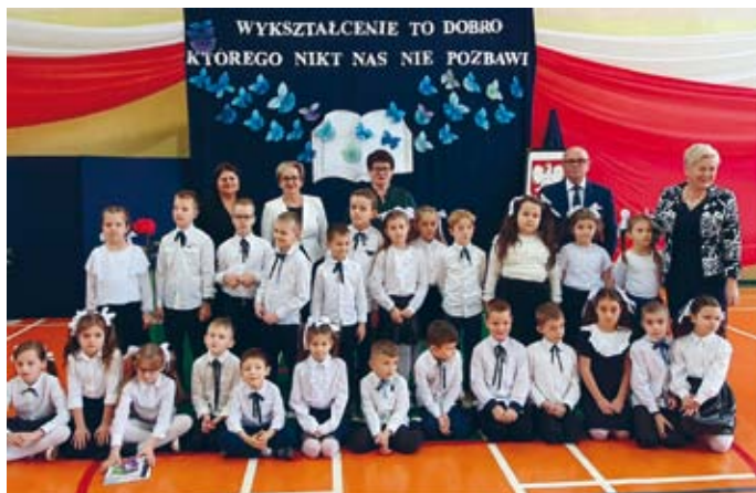
UROCZYSTE ŚLUBOWANIE PIERWSZOKLASISTÓW SZKOŁY PODSTAWOWEJ IM. JANA PAWŁA II W ŁOPUSZNIE

Rodzicom gratulujemy wspaniałych pociech, gościom dziękujemy za przybycie, prezenty i życzenia, a pierwszacom życzymy wielu sukcesów w murach naszej szkoły.