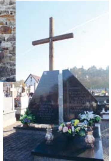
ZBIOROWA MOGIŁA ŻOŁNIERZY NA CMENTARZU PARAFIALNYM W ŁOPUSZNI