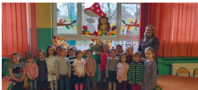
W ŚRODĘ BYŁO KOLOROWO I WZOR(K)OWO...