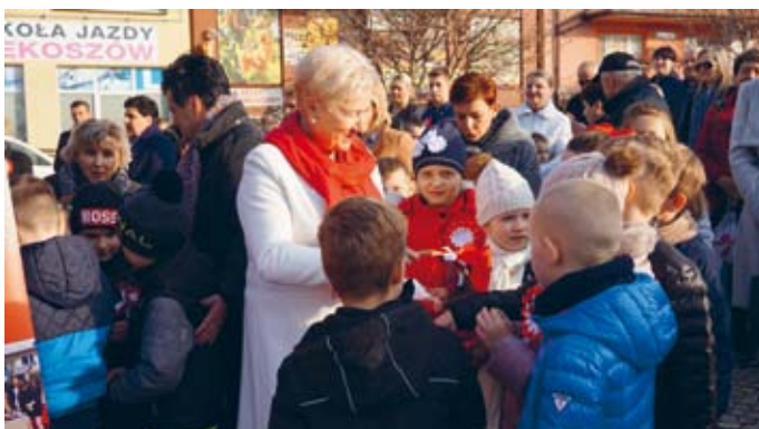
RODZINNY CHARAKTER OBCHODÓW