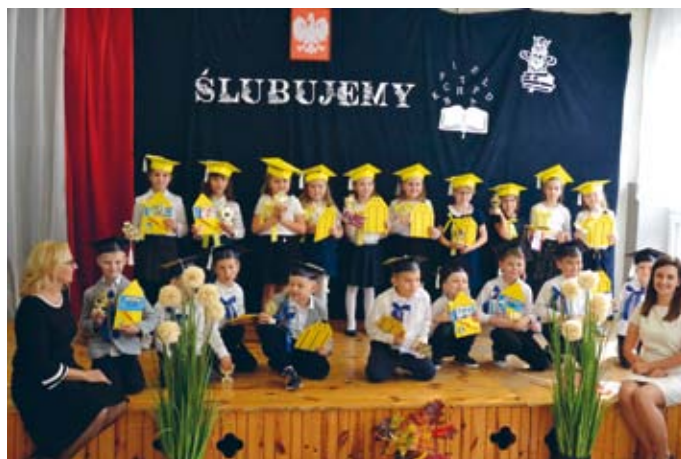
GRONO SZKOLNE POWIĘKSZYŁO SIĘ O DWUDZIESTU PIERWSZAKÓW