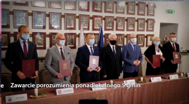
Zawarcie porozumienia ponadlokalnego 5 gmin