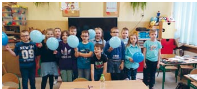
DZIEŃ PRAW DZIECKA BYŁ NIEZWYKLE BŁĘKITNY

Dla najmłodszych milusińskich naszej szkoły z oddziałów przedszkolnych zostały zorganizowane różnorodne aktywno-