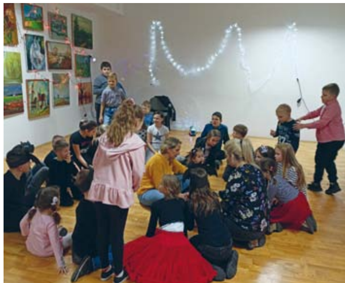
WRÓŻBY ANDRZEJKOWE SNOCHOWICE