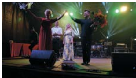
GWIAZDĄ „IMPRESJI ŁOPUSZAŃSKICH” 2021 BYŁ ZENON MARTYNIUK Z ZESPOŁEM „AKCENT”

Mieszkańcy Gminy Łopuszno, jak i przyjezdni goście biorą udział w licznych wydarzeniach o charakterze historyczno – patriotycznym, religijnym, folklorystycznym oraz rozrywkowym. O każdej porze roku mogą trafić na wydarzenia, które z pewnością pozwolą odkryć łopuszański zakątek kraju i dowiedzieć się więcej o panujących lokalnie zwyczajach i obyczajach. Największą imprezą przyciągającą corocznie tysiące widzów są dwudniowe „Impresje Łopuszańskie”. Wydarze-