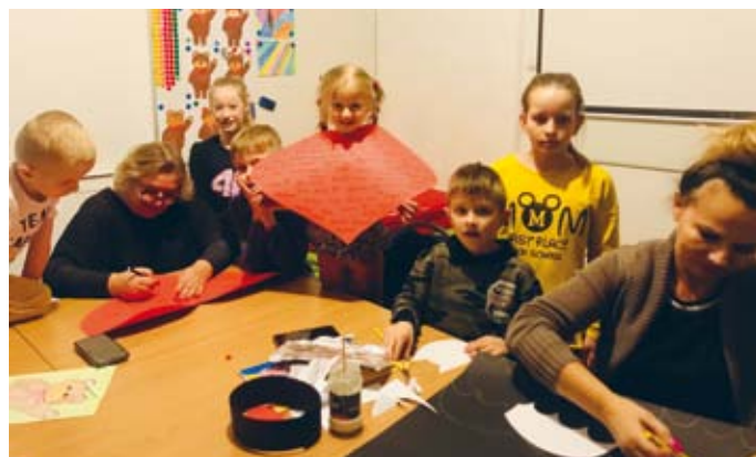
CZALCZYŃ - ZAJĘCIA PLASTYCZNE