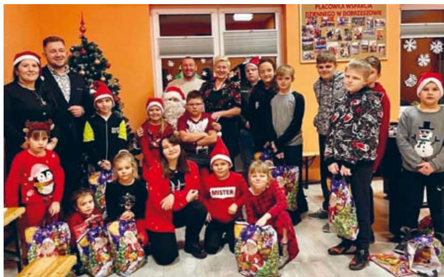
ŚWIĄTECZNY KLIMAT W ŚWIETLICY W DOBRZESZOWIE