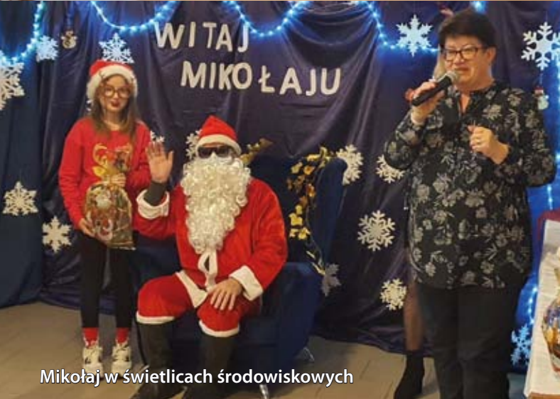
Mikołaj w świetlicach środowiskowych