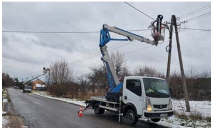
POSTĘPUJE ISTOTNA MODERNIZACJA OŚWIETLENIA ULICZNEGO NA TERENIE GMINY ŁOPUSZNO