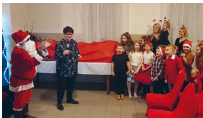
ŚW. MIKOŁAJ W CZALCZYŃ