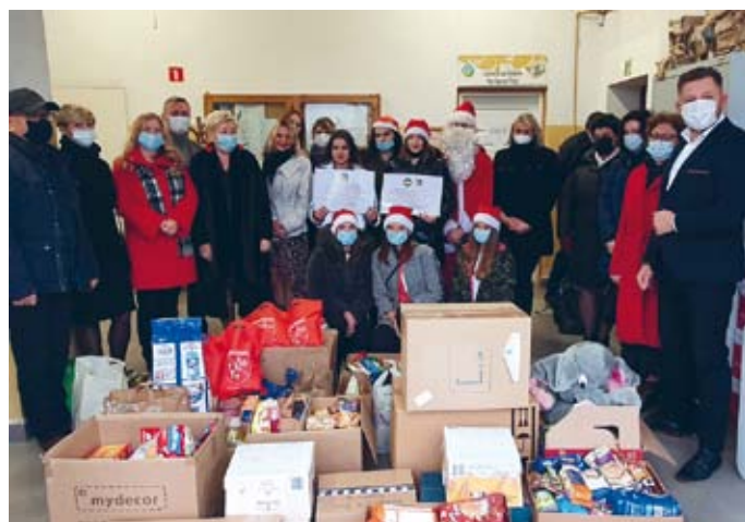
ŁOPUSZAŃSKIE DOBRE SERCA PRZEPEŁNIONE POCZUCIEM WRAŻLIWOŚCI SPOŁECZNEJ