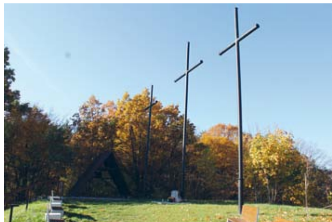
WZGÓRZE TRZECH KRZYŻY O ZNACZENIU SYMBOLICZNYM