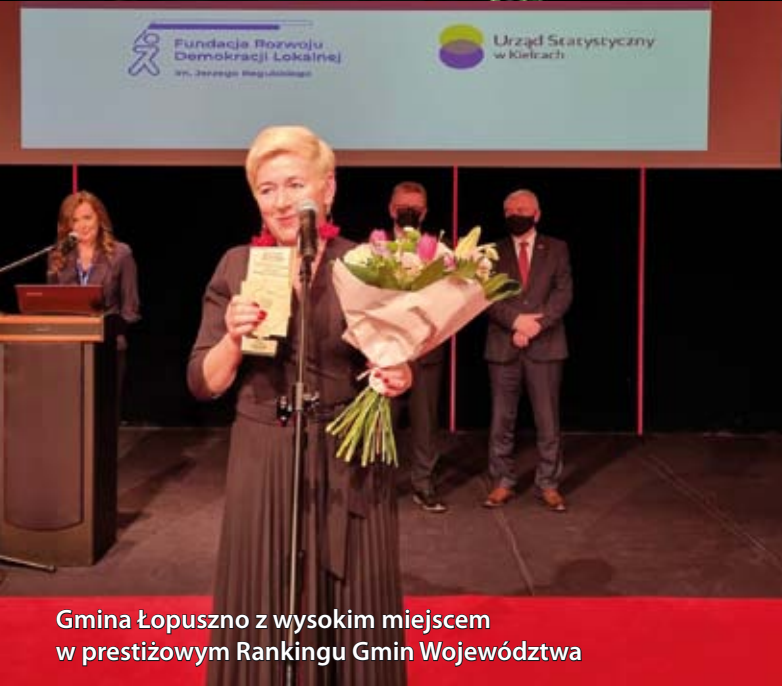
Gmina Łopuszno z wysokim miejscem w prestiżowym Rankingu Gmin Województwa