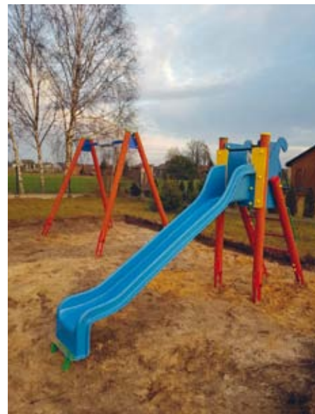
Ewelina Obarzanek PLAC ZABAW W JEDLU