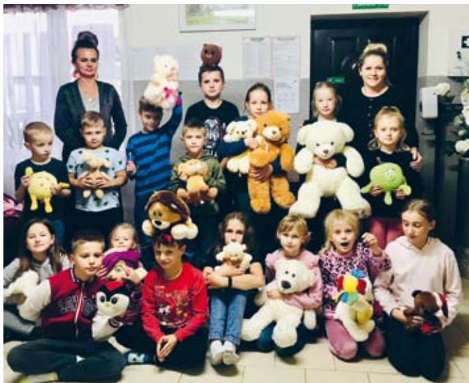
DZIECI ZE ŚWIETLICY W CZĄLCZYNI ODPOWIADAJĄ NA AKCJĘ - PRZYNIĘŚ MISIA