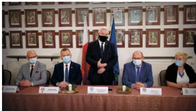
SPOTKANIE POD PRZEWONICTWEM MARSZAŁKA WOJ. ŚWIĘTOKRZYSKIEGO

Marszałek Województwa Świętokrzyskiego Andrzej Bętkowski zaakcentował podczas spotkania, że podejmowane przez gminy wspólne inicjatywy wynikają w dużej mierze z polityki Unii Europejskiej, ponieważ w nowej perspektywie