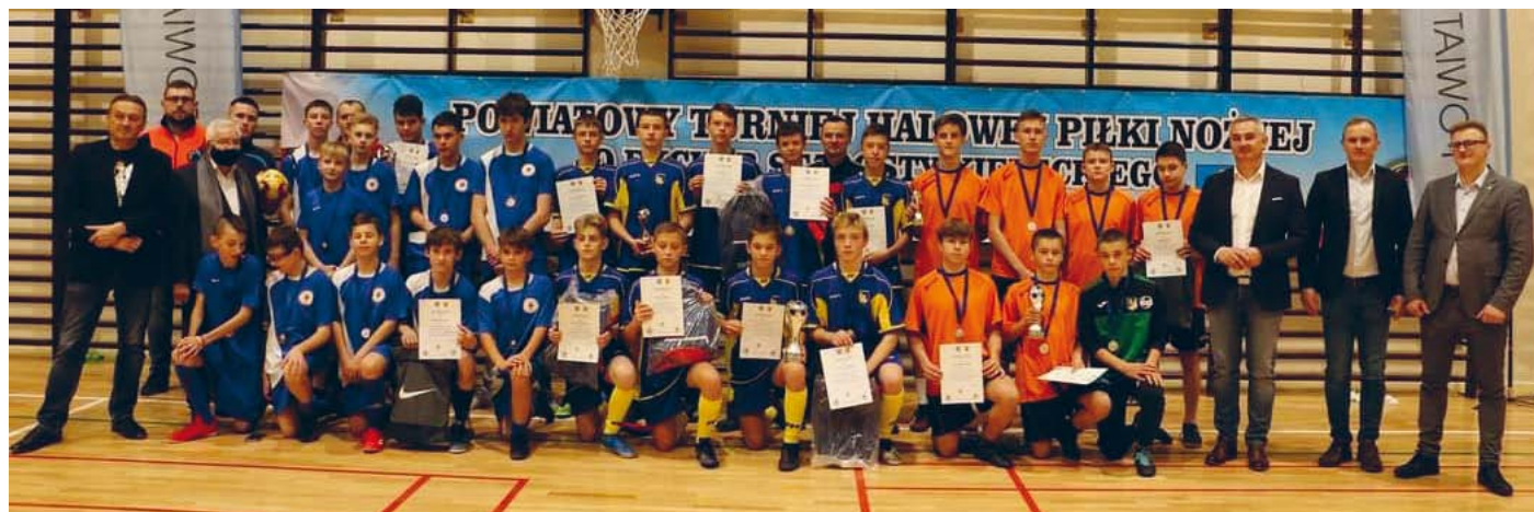
I POWIATOWY TURNIEJ W PIŁCE NOŻNEJ O PUCHAR STAROSTY KIELECKIEGO