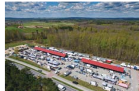
WSPÓŁCZESNE TARGOWISKO W ŁOPUSZNIE

wych. W 2022 r. nastąpi dalsza rozbudowa targowicy o: blisko 100 nowych miejsc parkingowych, estradę oraz bazę gastronomiczną.