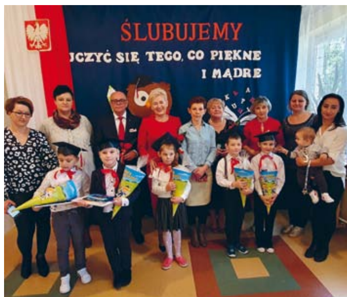
RODZINNA ATMOSFERA TOWARZYSZYŁA UROCZYŚCIE ŚLUBOWANIA KLAS I W SZKOLE PODSTAWOWEJ W GRABOWNICY (FILIA SP W ŁOPUSZNIE)