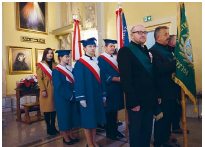
POCZTY SZTANDAROWE NIEZAWODNE PODCZAS WSZYSTKICH UROCZYSTOŚCI