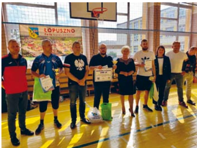
SZCZĘŚLIWI LAUREACI MIEJSC 1-3 PODCZAS TURNIEJU TENISA STOŁOWEGO