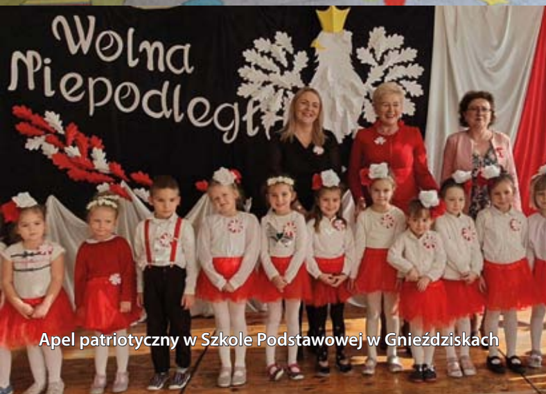
Apel patriotyczny w Szkole Podstawowej w Gnieździskach