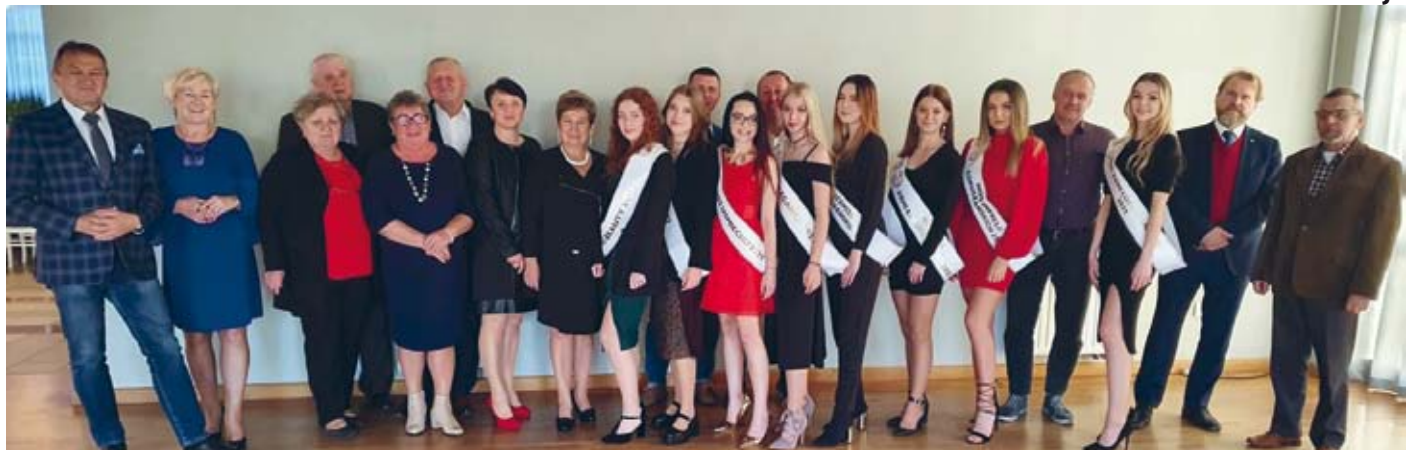
WIECZÓR WŁOSKI ODBYŁ SIĘ W MIŁEJ ATMOSFERZE