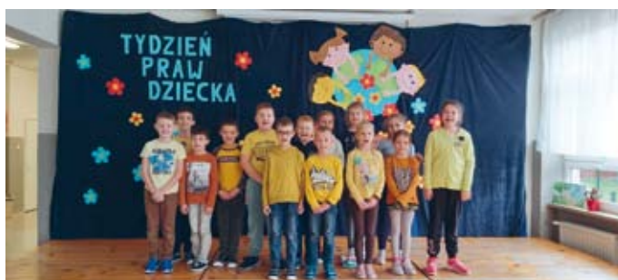
RADOŚNIE ŻÓŁTA KLASA IIIA