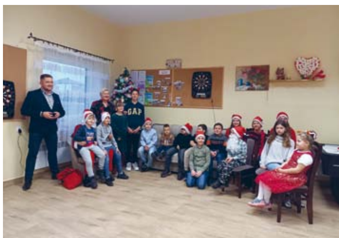
ŚW. MIKOŁAJ OBDAROWUJE PREZENTAMI W ŚWIETLICY EUSTACHOWIE