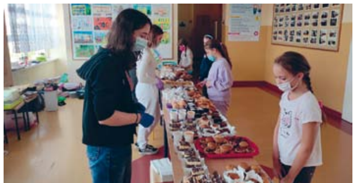
EFEKTY PRZEPROWADZONEGO KIERMASZU W SP W ŁOPUSZNIE PRZEROSŁY NAJŚMIELSZE OCZEKIWANIA