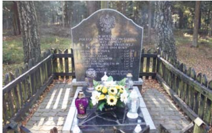
MIEJSCE PAMIĘCI ZAMORDOWANYCH MIESZKAŃCÓW WSI SARBICE