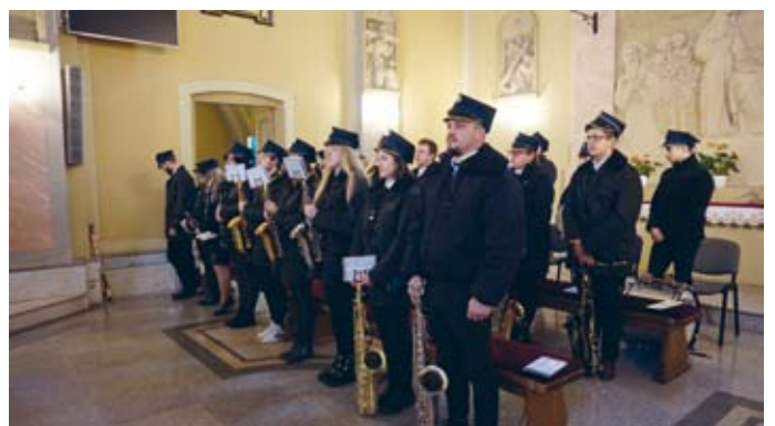
GMINNA ORKIESTRA DĘTA UŚWIETNIŁA SWOIMI WYSTĘPAMI UROCZYSTOŚĆ