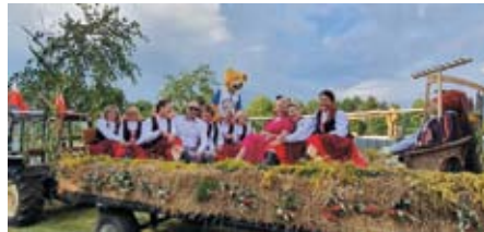
DOŻYNKI GMINNE 2021

Przykładem wspólnej organizacji wydarzeń jest Święto Plonów – Dożynki, które stwarza niepowtarzalną okazję do integracji społeczności lokalnej . Wyróżnia się bogactwem prezentowanych tradycyjnych potraw, pysznych wypieków i napojów serwowanych na licznych stoiskach sołeckich.