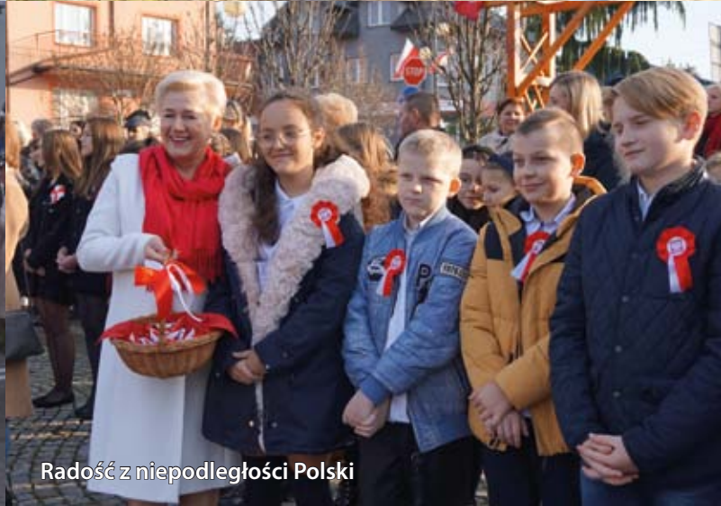
Radość z niepodległości Polski