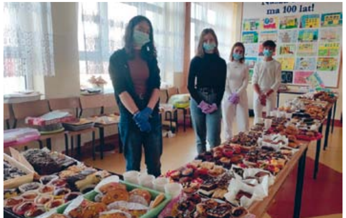
SAMORZĄD UCZNIOWSKI SZKOŁY PODSTAWOWEJ W ŁOPUSZNIE ZORGANIZOWAŁ SŁODKI KIERMASZ