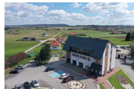
BUDYNEK URZĘDU GMINY W ŁOPUSZNIE PO TERMOMODERNIZACJI

Gmina Łopuszno dbając o zrównoważony rozwój zrealizowała zadanie polegające na montażu odnawialnych źródeł energii w gospodarstwach domowych. W wyniku realizacji projektu powstało m.in. 227 instalacji fotowoltaicznych PV; 82 instalacji pomp ciepła do c.w.u. 2 kW oraz 14 insta-