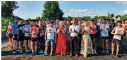
BLISKO 200 UCZESTNIKÓW WZIĘŁO UDZIAŁ W „IMPRESJACH BIEGOWYCH” 2021

nie łączy w sobie dbałość o rozrywkę i sprawność fizyczną w ramach wspólorganizowanych „Impresji Biegowych” – ogólnopolskich zawodów biegowych.