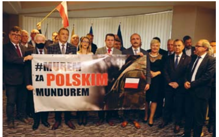
SAMORZĄDOWCY POWIATU KIELECKIEGO „MUREM ZA POLSKIM MUNDUREM”

Licznie zebrani samorządowcy jednoznacznie podkreślili, że szacunek dla przedstawicieli służb mundurowych jest czymś niepodważalnym. Wyrazili zdanie, iż wsparcie dla żołnierzy jest przejawem szacunku i wdzięczności za pełnioną przez nich służbę, zaś poświęcenie służb mundurowych nie może być marginalizowane.