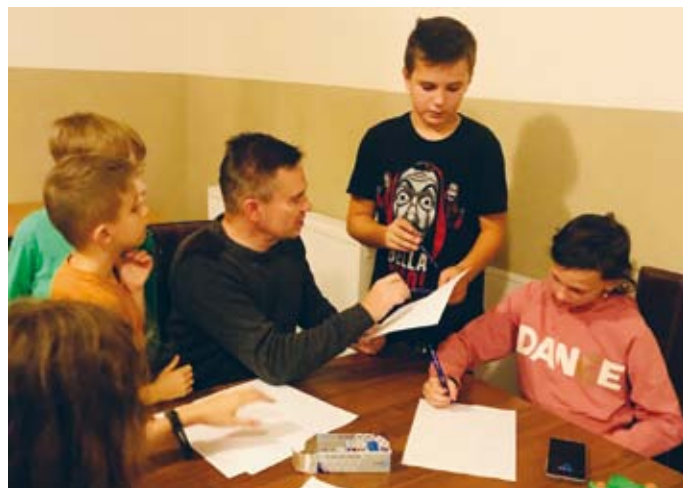
CZALCZYŃ - MATEMATYKA