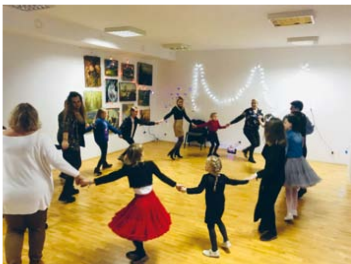
ZABAWA ANDRZEJKOWA W SNOCHOWICACH