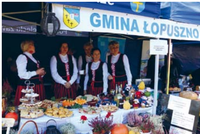
OKAZAŁE STANOWISKO GMINY ŁOPUSZNO