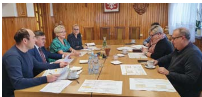
SPOTKANIE SAMORZĄDOWCÓW W RAMACH STRATEGII ROZWOJU PONADLOKALNEGO DO 2030 R.

Zasadność opracowania „Strategii Rozwoju Ponadlokalnego Gmin Łopuszno, Krasocin i Słupia Konecka do roku 2030” wynika ze zmian wprowadzonych ustawą o zmianie ustawy o zasadach prowadzenia polityki rozwoju oraz niektórych in-