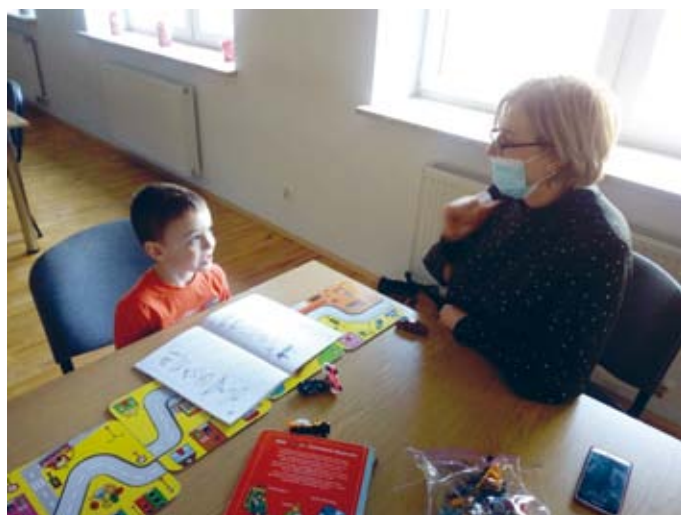
ZAJĘCIA LOGOPEDYCZNE W SNOCHOWICACH