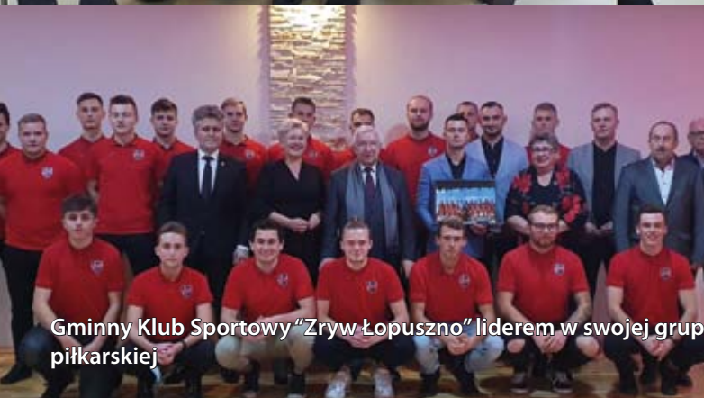
Gminny Klub Sportowy "Zryw Łopuszno" liderem w swojej grupie piłkarskiej