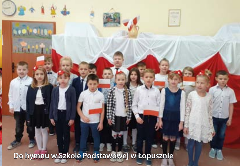
Do hymnu w Szkole Podstawowej w Łopusznie