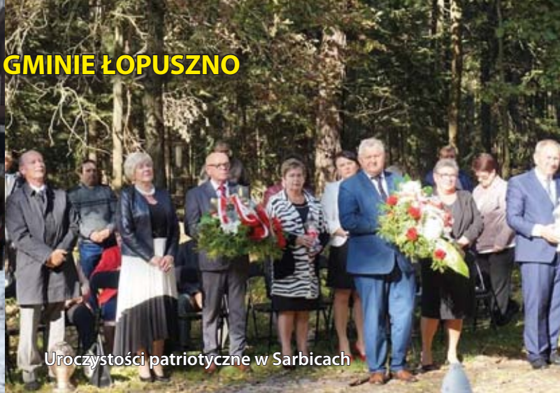
Uroczystości patriotyczne w Sarbicach