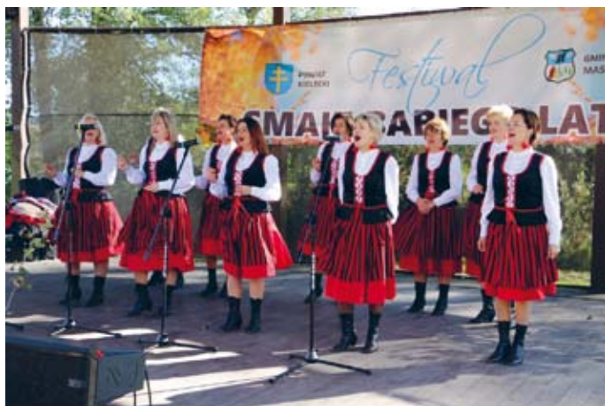
AKTYWNE KOBIETY GNIEŹDZISK PORWAŁY PUBLICZNOŚĆ DO WSPÓLNEJ ZABAWY