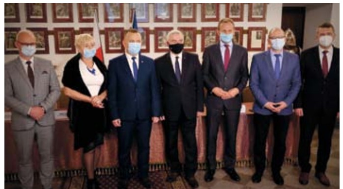
SAMORZĄDOWCY ZAWIERAJĄCY POROZUMIENIE LOKALNE KU PRZYSZŁOŚCI