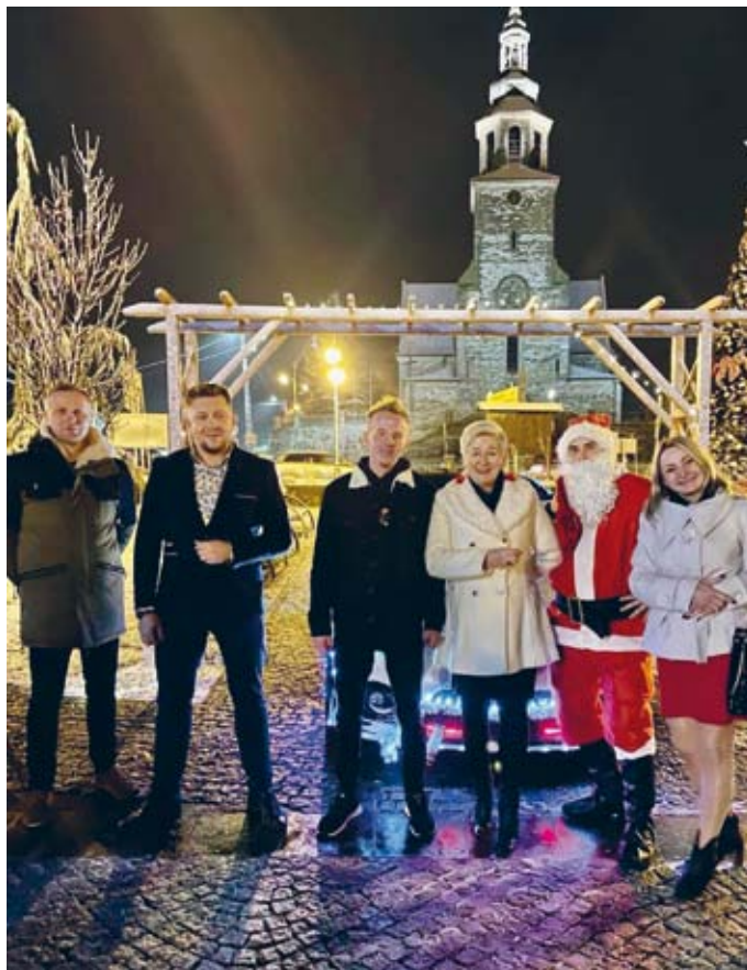
ORGANIZATORZY ŚWIĄTECZNEGO ZLOTU NA ŁOPUSZAŃSKIM RYNKU