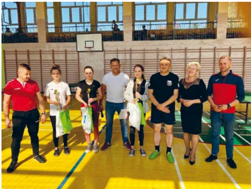
ZWYCIĘSKIE PANIE W RYWALIZACJI TURNIEJOWEJ