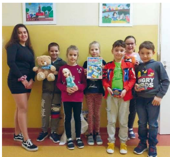
AKCJA ODBYWAŁA SIĘ M.IN. W SZKOŁACH PODSTAWOWYCH, DLA KTÓRYCH ORGANEM PROWADZĄCYM JEST GMINA ŁOPUSZNO