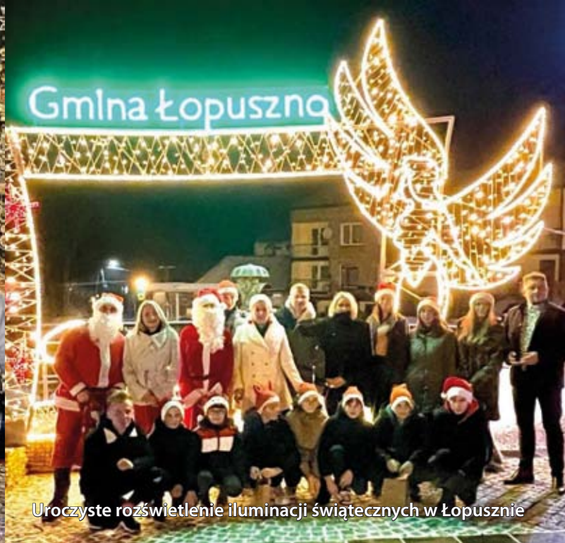
Uroczyste rozświetlenie iluminacji świątecznych w Łopusznie