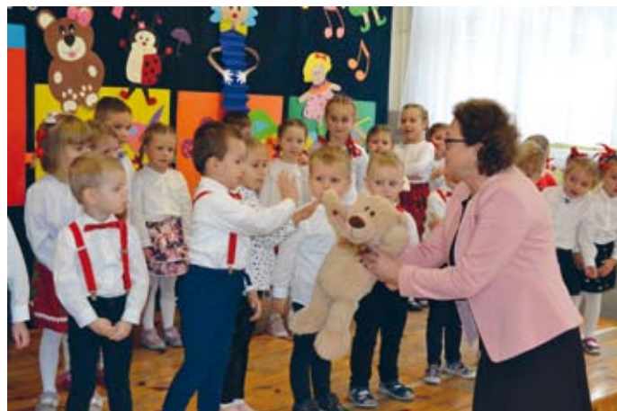
PIĄTKA Z MISIEM I JUŻ MOŻNA NAZYWAĆ SIĘ PRZEDSZKOLAKIEM