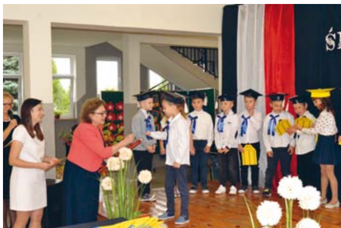
DO PIERWSZAKA JEDEN KROK...