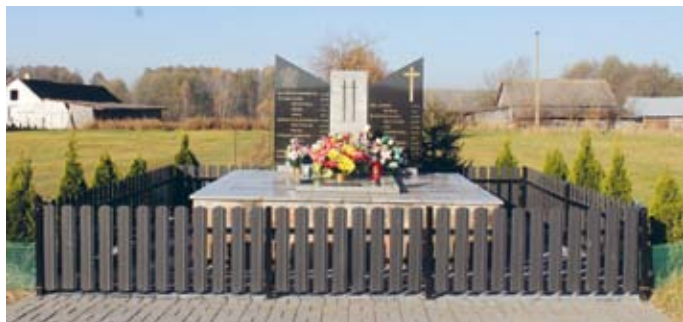
MIEJSCE PACYFIKACJI WE WSI NARAMÓW