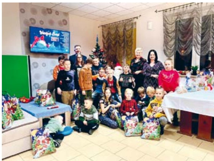
ŚW. MIKOŁAJ W ŚWIETLICY W GNIEZDZISKACH Z PREZENTAMI