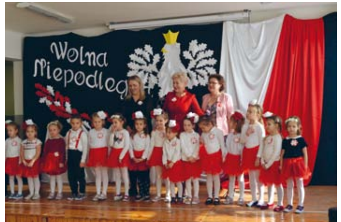
ŻYWE DOWODY NA TO, ŻE POLSKA ODZYSKAŁA NIEPODLEGŁOŚĆ