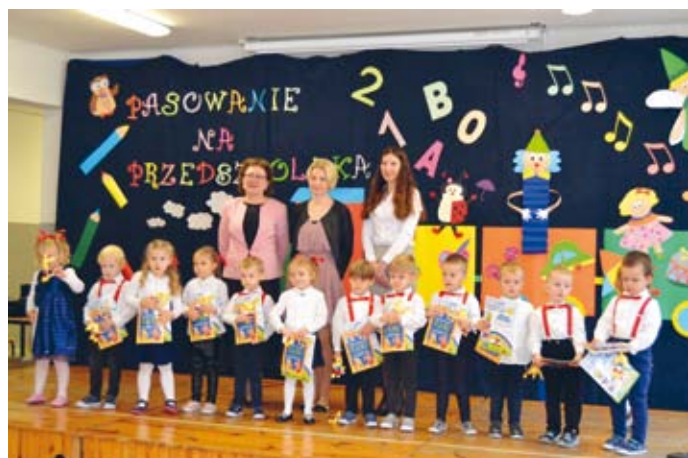
BIEDRONECZKI JUŻ JAKO PEŁNOPRAWNE PRZEDSZKOLACZKI