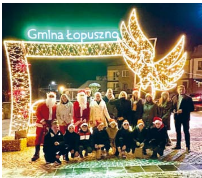
UROCZYSTE ROZŚWIETLENIE ILUMINACJI ŚWIĄTECZNYCH NA RYNKU ŁOPUSZAŃSKIM