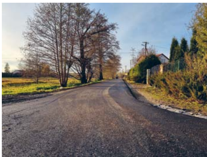
DROGA W RUDZIE ZAJĄCZKOWSKIEJ PO PRZEBUDOWIE

Budowa linii oświetlenia ulicznego w msc. Piotrowiec ul. Spacerowa etap I