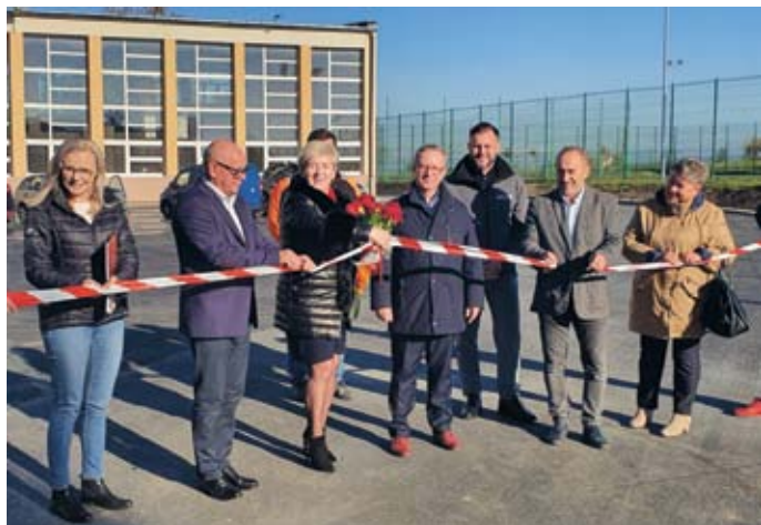
ODBIÓR UTWARDZONEJ POWIERZCHNI DZIAŁKI PRZY SZKOLE PODSTAWOWEJ W ŁOPUSZNIE