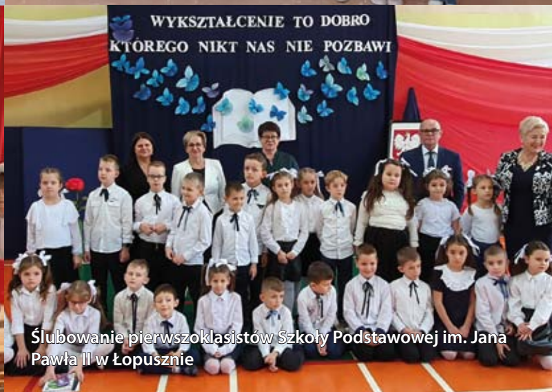
Ślubowanie pierwszoklasistów Szkoły Podstawowej im. Jana Pawła II w Łopusznie