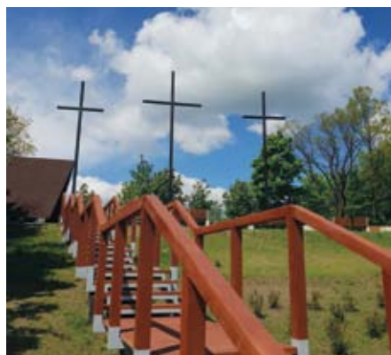
„WZGÓRZE TRZECH KRZYŻY”

Realizowana jest rewitalizacja Łopuszna, w tym „Wzgórza Trzech Krzyży”, które ma dla mieszkańców znaczenie symboliczne. Dzięki wykonanym pracom powstało wspaniałe miejsce do wypoczynku i rekreacji z pięknym widokiem na panoramę Łopuszna.