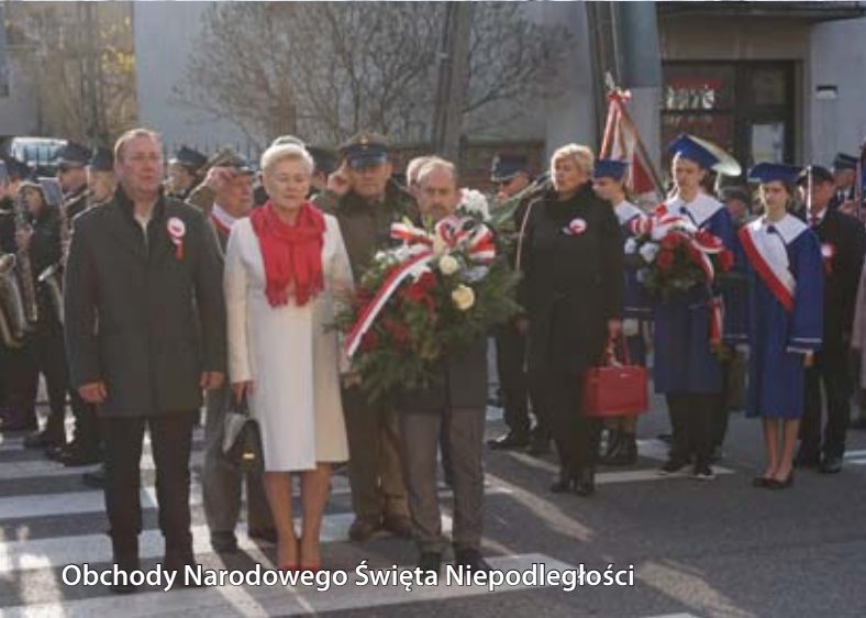
Obchody Narodowego Święta Niepodległości