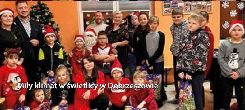
Miły klimat w świetlicy w Dobrzeszowie