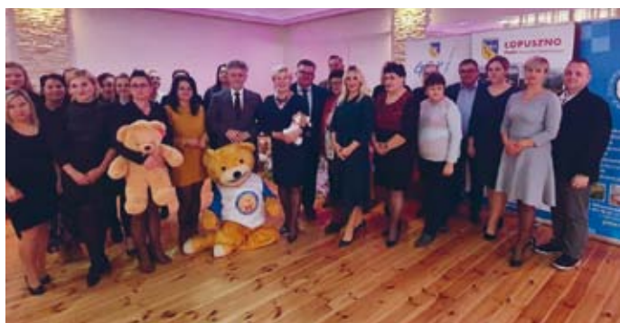
UROCZYSTE PODSUMOWANIE AKCJI NA TERENIE GMINY ŁOPUSZNO Z UDZIAŁEM DYREKTORÓW ORAZ KIEROWNIKÓW JEDNOSTEK I REFERATÓW