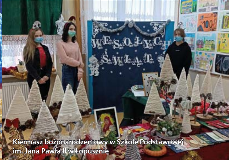
Kiermasz bożonarodzeniowy w Szkole Podstawowej im. Jana Pawła II w Łopusznie