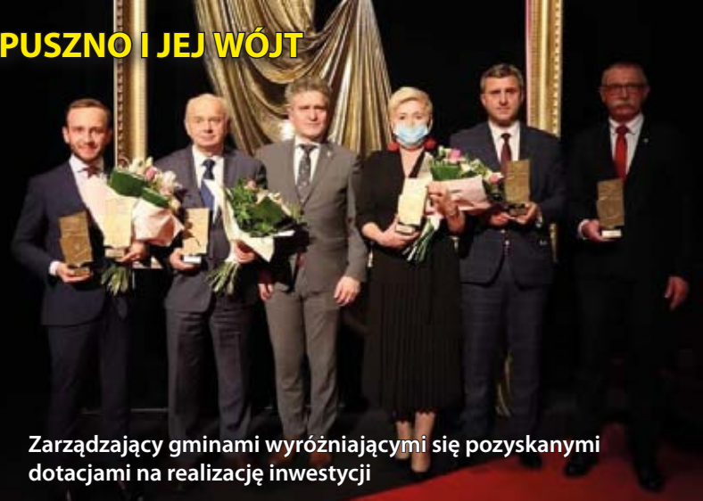
Zarządzający gminami wyróżniający się pozyskanymi dotacjami na realizację inwestycji