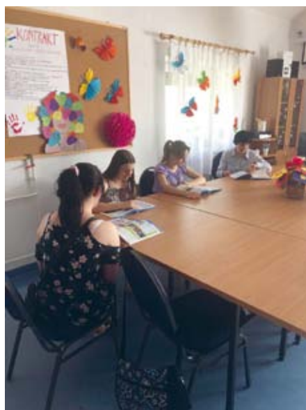
JĘZYK ANGIELSKI W LASOCINIE