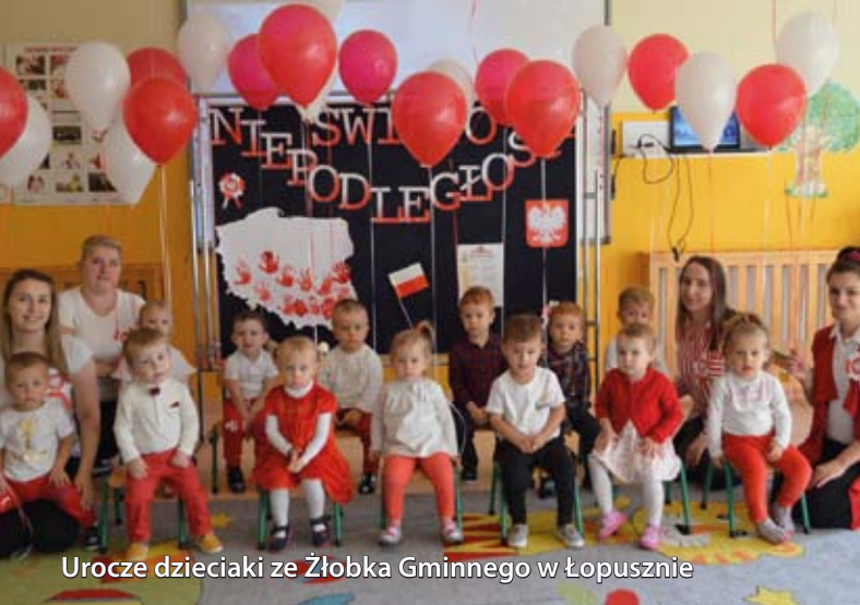
Urocz. dzieciaki ze Żłobka Gminnego w Łopusznie