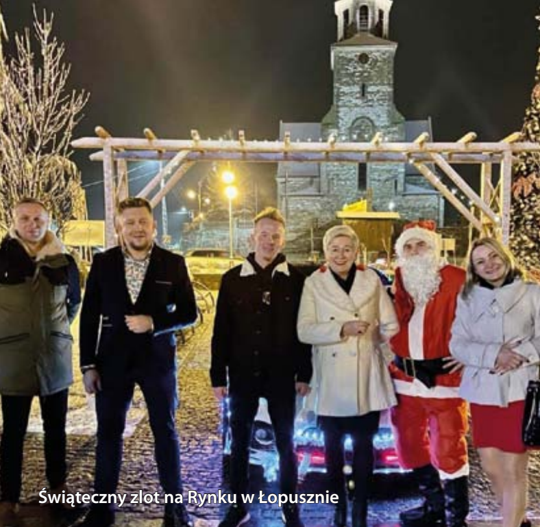
Świąteczny zlot na Rynku w Łopusznie