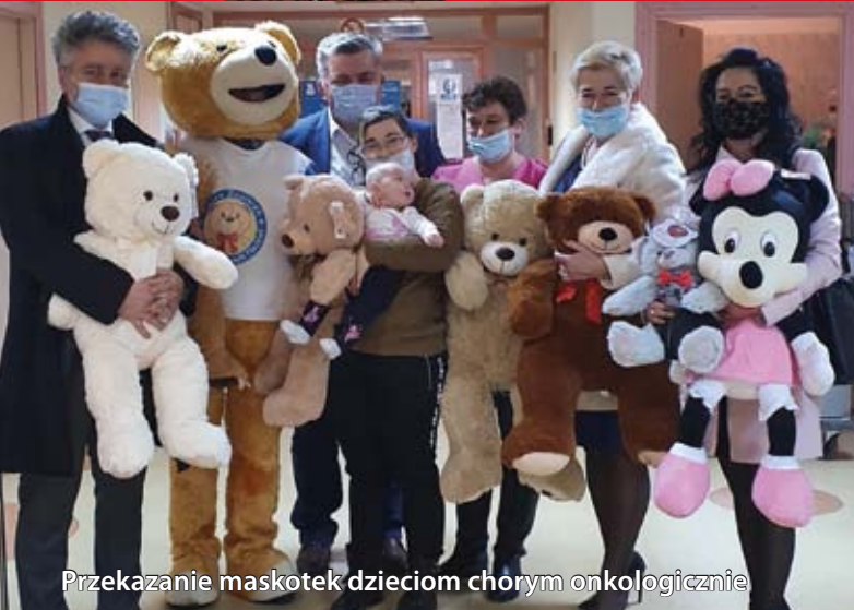
Przekazanie maskotek dzieciom chorym onkologicznie