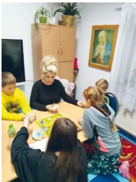
OPIEKA ŚWIETLICOWA W LASOCINIE