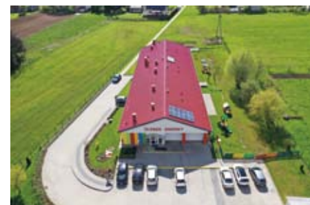
ŻŁOBEK GMINNY W ŁOPUSZNIE NA MIARĘ XXI W.

Gmina Łopuszno stawia również na rozwój dzieci i młodzieży, jako jedna z pierwszych w woj. świętokrzyskim wybudowała nowoczesny żłobek, do którego obecnie uczęszcza 56 dzieci, koszt inwestycji wyniósł 2 mln zł, w tym pozyskane dofinansowanie 1,5 mln zł. Poprzez działania gmina wspiera rodziny, corocznie pozyskując kolejne środki rządowe.