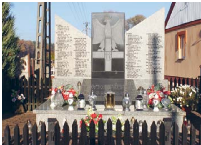
MIEJSCE PACYFIKACJI WSI W SKALCE POLSKIEJ