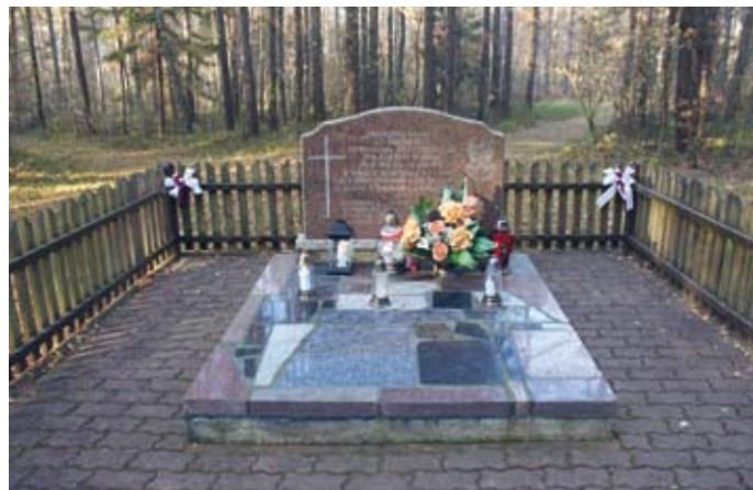
ZBIOROWA MOGIŁA ŻOŁNIERZY POWSTANIA STYCZNIOWEGO 1863 R. W EWELINOWIE