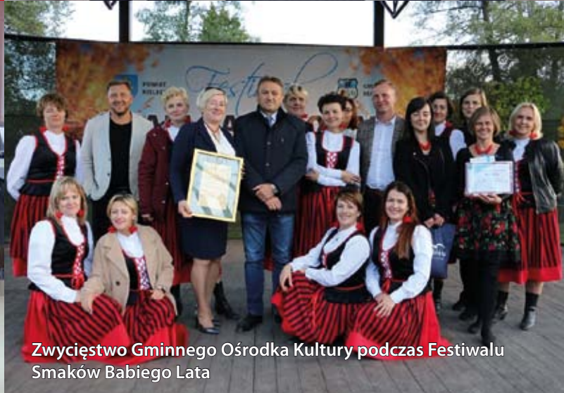
Zwycięstwo Gminnego Ośrodka Kultury podczas Festiwalu Smaków Babiego Łata