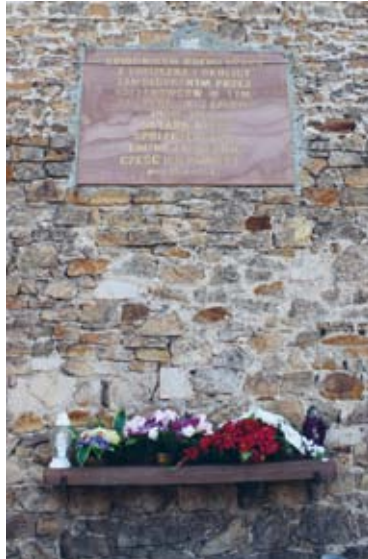
TABLICA PAMIĄTKOWA NA BUDYNKU INTERNATU W ŁOPUSZNI