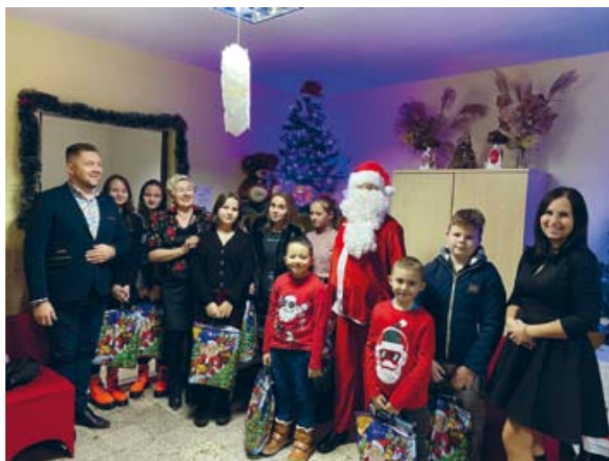
ŚW. MIKOŁAJ Z PREZENTAMI W RUDNIKACH