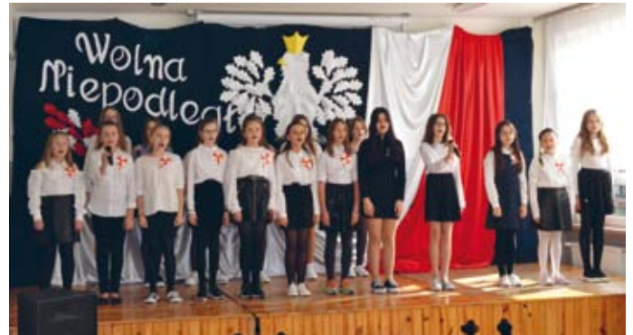
PIEŚNI DLA NIEPODLEGŁEJ