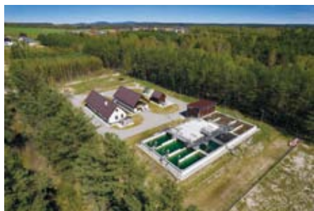
NOWOCZESNA OCZYSZCZALNIA ŚCIEKÓW W EUSTACHOWIE

W latach 2015 – 2021 Gmina Łopuszno wydatkowała 33 mln zł na ochronę środowiska, w tym blisko 27 mln zł na oczyszczalnię i kanalizację aglomeracji Łopuszno. Zakończenie budowy biologiczno – mechanicznej oczyszczalni ścieków w Eustachowie o przepustowości 600 m 3 / dobę, stanowi najdroższą, największą i najdłużej wyczekiwaną inwestycję zrealizowaną dotychczas przez