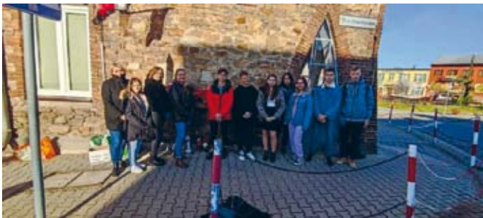
MŁODZIEŻOWI RADNI GM. ŁOPUSZNO W TRAKCIE PRZYGOTOWAŃ DO NARODOWEGO ŚWIĘTA NIEPODLEGŁOŚCI