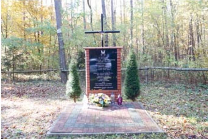
OBELISK W LESIE K. FANISŁAWIC