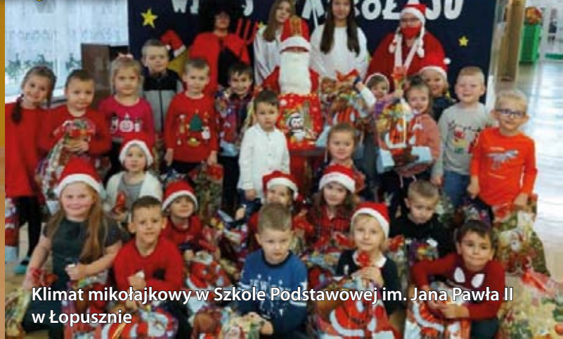
Klimat mikołajkowy w Szkole Podstawowej im. Jana Pawła II w Łopusznie