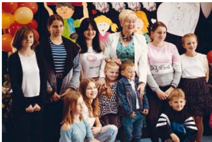
DZIEŃ MATKI W ŚWIETLICY ŚRODOWISKOWEJ W LASOCINIE