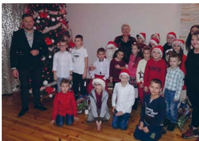
ŚW. MIKOŁAJ Z CUDOWNYMI PREZENTAMI W ŁOPUSZNI