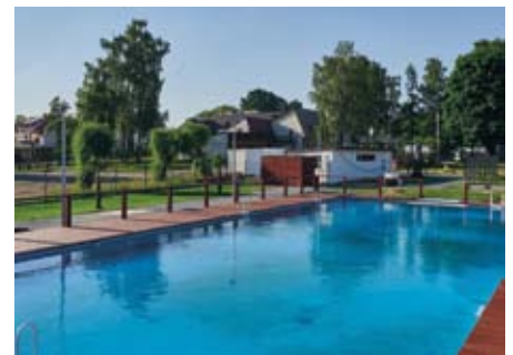
BASENY NA TERENIE GMINNEGO OŚRODKA SPORTOWO – WYPOCZYNKOWEGO W ŁOPUSZNIE

Gmina Łopuszno może pochwalić się Ośrodkiem Sportowo – Wypoczynkowym, który zapewnia doskonałą bazę w zakresie działalności sportowo – rekreacyjnej . Ośrodek obejmuje ponad 5 ha powierzchni , na której zlokalizowane są: boisko do piłki nożnej, piłki ręcznej, siatkówki, kort tenisowy, scena koncertowa, plac zabaw, „Otwarta Strefa Aktywności” oraz baza noclegowa wraz z letnim kompleksem basenowym . Jednostka w swojej ofercie posiada również nowoczesne domki letniskowe, z których można korzystać przez cały rok . W swojej ofercie posiada 50 miejsc noclegowych w pokojach 2,3 i 4 osobowych oraz salę bankietową z nowoczesnym zapleczem kuchennym .