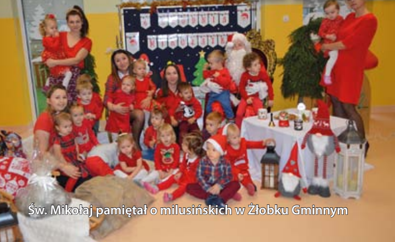
Św. Mikołaj pamiętał o milusińskich w Żłobku Gminnym