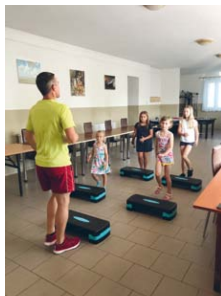
ZAJĘCIA RYTMICZNE W CZĄLCZYNI