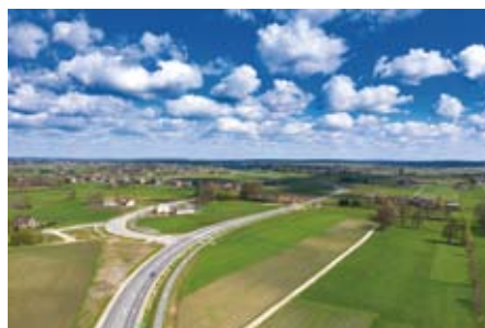
PRZEBUDOWANA DROGA WOJEWÓDZKA NR 728

Samorząd Gminy Łopuszno sukcesywnie udoskonala stan infrastruktury drogowej chcąc zapewnić maksymalny poziom bezpieczeństwa i wygody użytkowników dróg. W latach 2015 – 2021 przebudowano i wyremontowano blisko 65 km dróg gminnych, powiatowych i wojewódzkich na terenie Gminy Łopuszno.