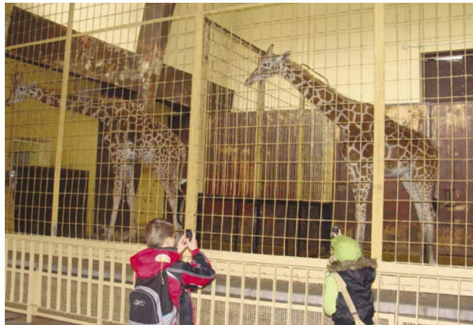
Żyrafy też były ciekawe naszej wycieczki

Deszczycy emocji przysporzył Pałac Strachu, śmiechu do łez można się było spodziewać po wizycie w gabinecie luster czy też w beczce śmiechu.