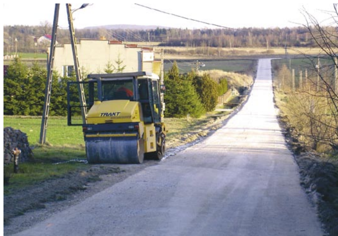
Remont drogi gminnej w Nowku Górnym (data wykonania: grudzień 2008 r., źródło finansowania: gmina 100 %, wykonawca: Świętokrzyskie Przedsiębiorstwo Robót Drogowych „TRAKT” Sp. z o.o.)