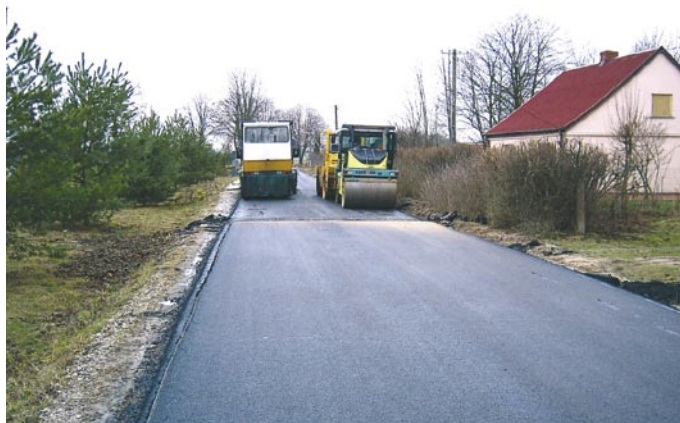
Remont drogi gminnej w Rudnikach (data wykonania: grudzień 2008 r. wykonawca: Kieleckie Przedsiębiorstwo Robót Drogowych Sp. z o.o.)