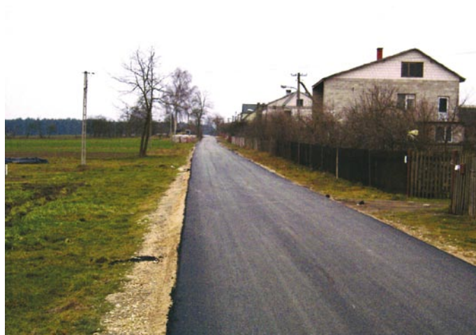
Remont drogi gminnej w Podewsiu (data wykonania: grudzień 2008 r., źródło finansowania: gmina 100 %, wykonawca: Świętokrzyskie Przedsiębiorstwo Robót Drogowych „TRAKT” Sp. z o.o.)