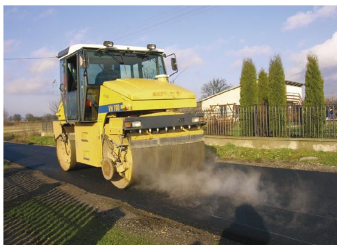
Remont drogi gminnej Wielebnów-Poducie Etap II (data wykonania: grudzień 2008 r., źródło finansowania: gmina 100 %, wykonawca: Świętokrzyskie Przedsiębiorstwo Robót Drogowych „TRAKT” Sp. z o.o.)