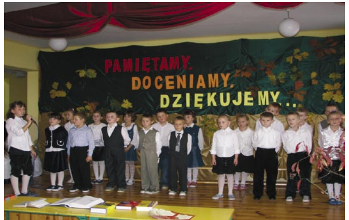
Październikowe święto najbardziej przeżywały pierwszaki