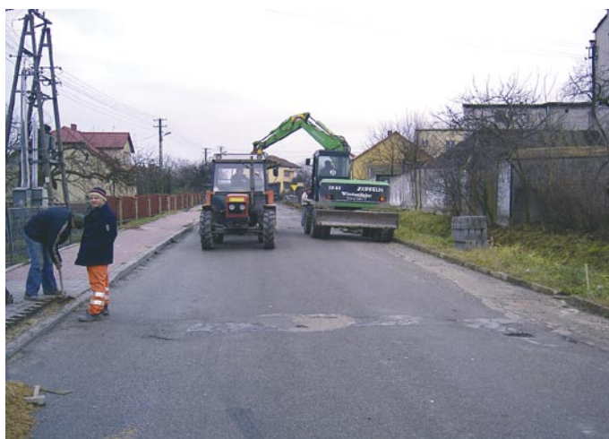
Remont ulicy Szkolnej w Łopusznie (data wykonania: grudzień 2008 r. źródło finansowania: gmina 100 %, wykonawca: Świętokrzyskie Przedsiębiorstwo Robót Drogowych „TRAKT” Sp. z o.o.)