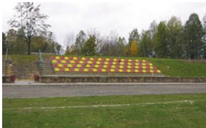
Nowa trybuna dla kibiców

sportowym młodych talentów. Osiągane wyniki w piłce nożnej przyczyniły się do wzrostu zainteresowania tą dyscypliną sportu na terenie gminy wśród kilkuletnich chłopców, którzy chcą iść w ślady starszych kolegów. Wychodząc naprzeciw zainteresowaniom, klub planuje uruchomić szkółkę piłkarską, nie tyle pod kątem pozyskiwania nowych zawodników dla klubu, co popularyzowania wśród dzieci innych form spędzania wolnego czasu niż telewizor czy komputer.