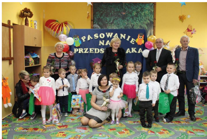
PASOWANIE NA PRZEDSZKOLAKA W SZKOLE W GRABOWNICY