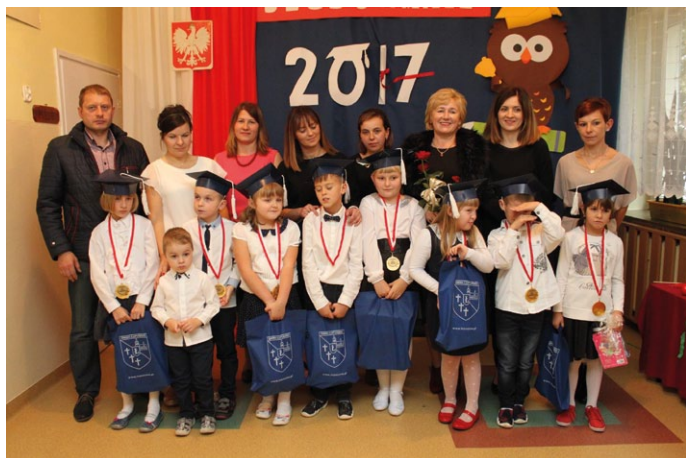
PASOWANIE PIERWSZOKLASISTÓW W SZKOLE W GRABOWNICY