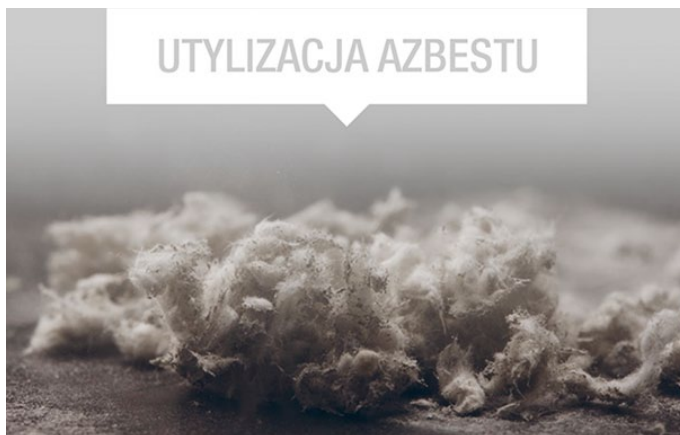
RYCINA PRZEDSTAWIA NIEBEZPIECZNE WŁÓKNA AZBESTU