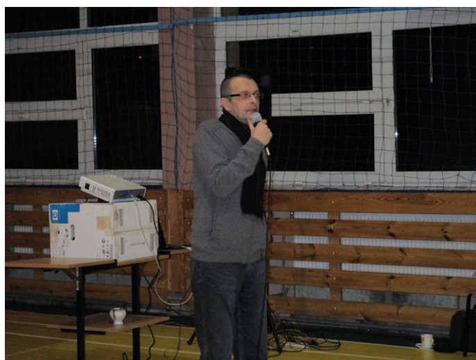
REŻYSER FILMU WILK DIONIZY KRAWCZYŃSKI

Wilk został pośmiertnie awansowany do stopnia podporucznika i odznaczony Krzyżem Srebrnym Orderu Virtuti Militari.