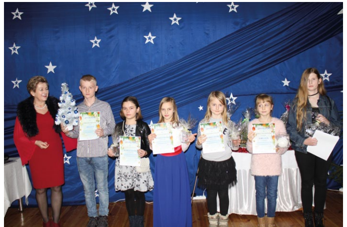
NAGRODZENI W KONKURSE „NAJPIĘKNIEJSZA BOMBKA BOŻONARODZENIOWA”