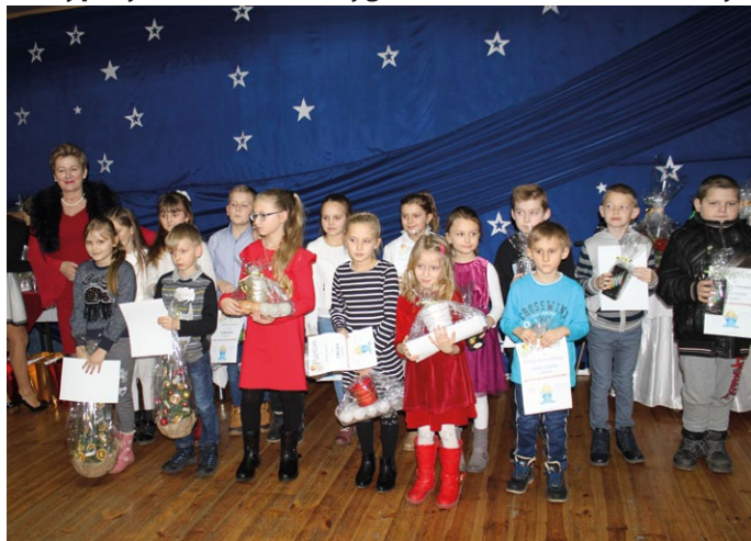
NAGRODZENI W KONKURSE „ANIOŁKI BOŻONARODZENIOWE”