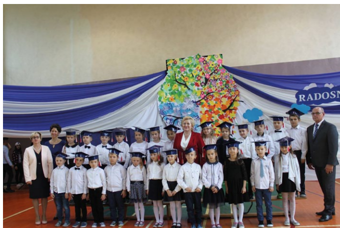
ŚLUBOWANIE UCZNIÓW KLAS PIERWSZYCH SZKOŁY PODSTAWOWEJ IM. JANA PAWŁA II W ŁOPUSZNI.