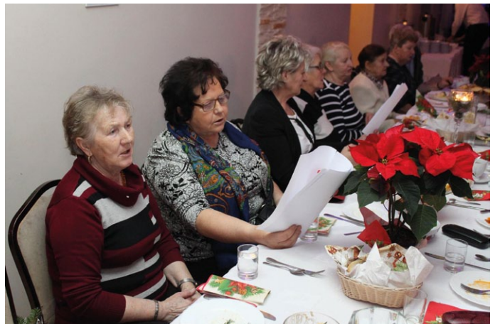
MIESZKAŃCY ŁOPUSZNA WSPÓLNIE KOLEDOWALI