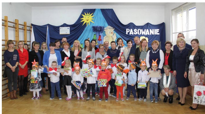
PASOWANIE NA PRZEDSZKOLAKÓW W SZKOLE W DOBRZESZOWIE