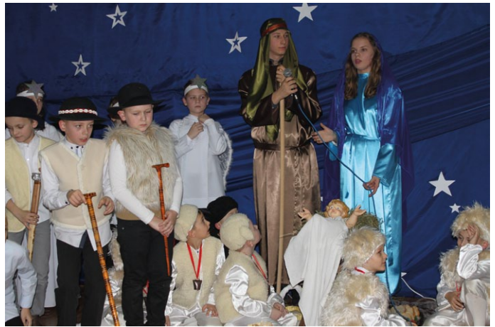
JASEŁKA W WYKONANIU UCZNIÓW SZKOŁY PODSTAWOWEJ IM. JANA PAWŁA II W ŁOPUSZNIE