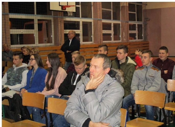
WIDZOWIE FILMU MELI DO REŻYSERA WIELE PYTAŃ

Warto obejrzeć ten film, który pokazuje, że ziemia kielecka była ważnym teatrem II wojny światowej, że wielu młodych ludzi nie wahało się walczyć w obronie Ojczyzny.