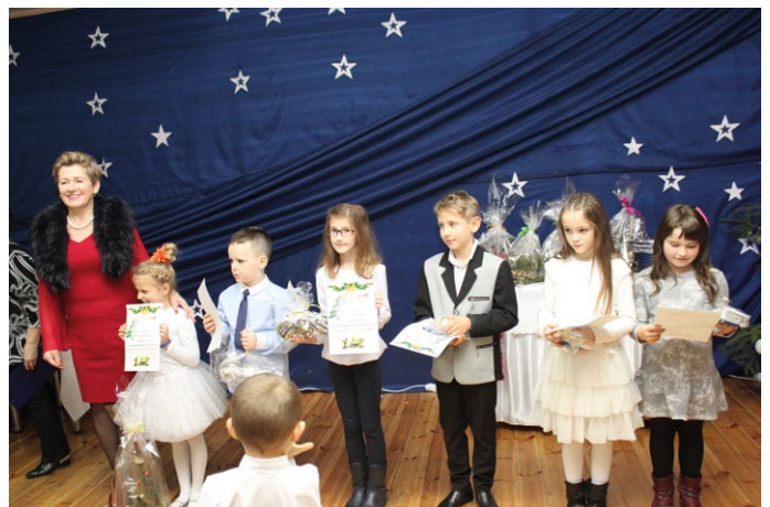
NAGRODZENI W KONKURSE „PRZEGLĄD KOŁĘD I PASTORAŁEK” KLASY 0-3

po długotrwałych obradach zdecydowało nagrodzić następujące osoby: