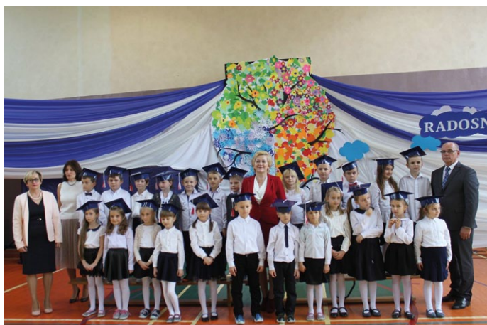
ŚLUBOWANIE UCZNIÓW KLAS PIERWSZYCH SZKOŁY PODSTAWOWEJ IM. JANA PAWŁA II W ŁOPUSZNI.