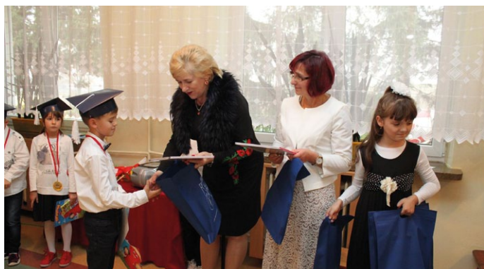
PANI WÓJTA WRECZAŁA PIERWSZAKOM KSIĄŻECZKI