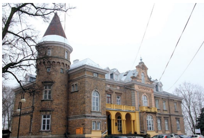
Pałac po remoncie