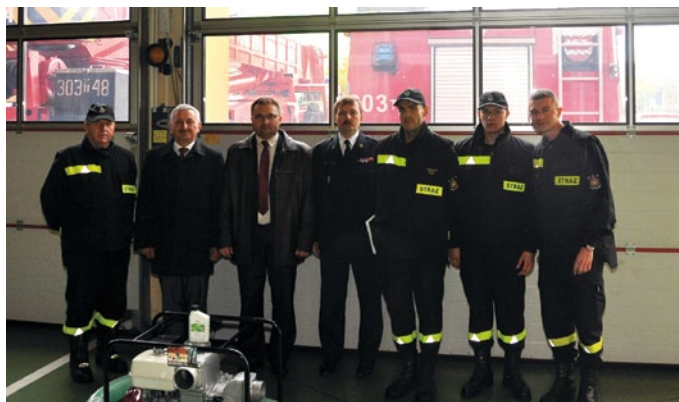
Uroczyste przekazanie pompy

Z okazji zbliżających się Świąt Bożego Narodzenia pragnę przesłać najserdeczniejsze życzenia. Niech nadchodzące Święta będą dla Państwa niezapomnianym czasem spędzonym bez troski i zmartwień. Życzę, aby odbyły się w spokoju, radości wśród Rodziny, Przyjaciół oraz wszystkich Bliskich dla Państwa osób. Wraz z nadchodzącym Nowym Rokiem życzę dużo zdrowia i szczęścia. Niech nie opuszcza Was pomyślność i niech spełnią się Wasze najskrytsze marzenia.