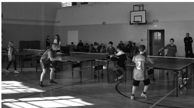
Zawodnicy w ferworze walki

17 lutego po raz dwudziesty pierwszy w Zespole Szkół w Gnieździskach został zorganizowany Turniej Tenisa Stołowego o Puchar Dyrektora Szkoły . Celem imprezy była popularyzacja tenisa stołowego, szerzenie idei wychowania przez sport oraz rozwijanie umiejętności organizowania i czynnego spędzania czasu wolnego. W turnieju wzięło udział 32 zawodników ze szkół w: Górkach Szczukowskich, Jaworzni, Łopusznie, Pilczycy, Słupi Koneckiej, Wólce i Gnieździskach. Jak zawsze zawodnicy prezentowali wysoki poziom umiejętności.