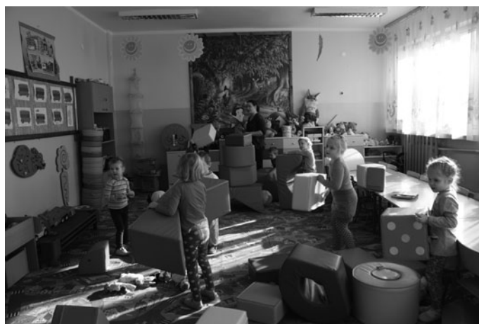
Oddziały przedszkolne z nowym wyposażeniem

płytki na ściany, terakotę na podłogę oraz pomalowano sufit i ściany. Wykonano również drobne prace hydrauliczne. Koszt prac – 13 000,00 zł.