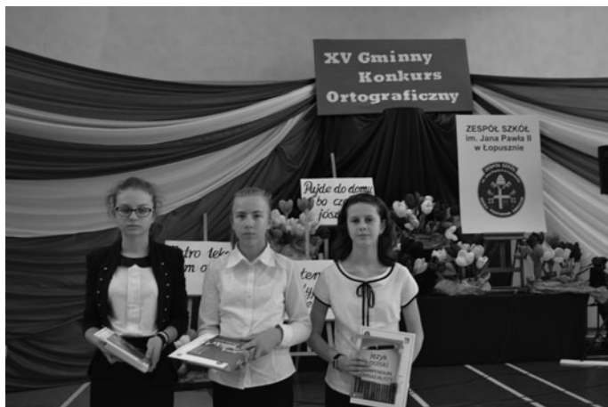
Zwycięzynie w kategorii klas IV - VI