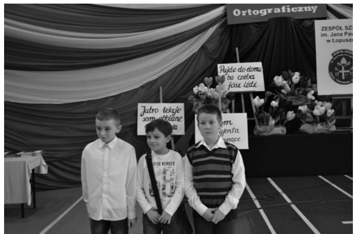
Najmłodszi laureaci konkursu