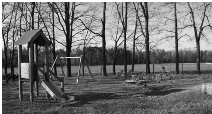
Plac zabaw z nowymi urządzeniami