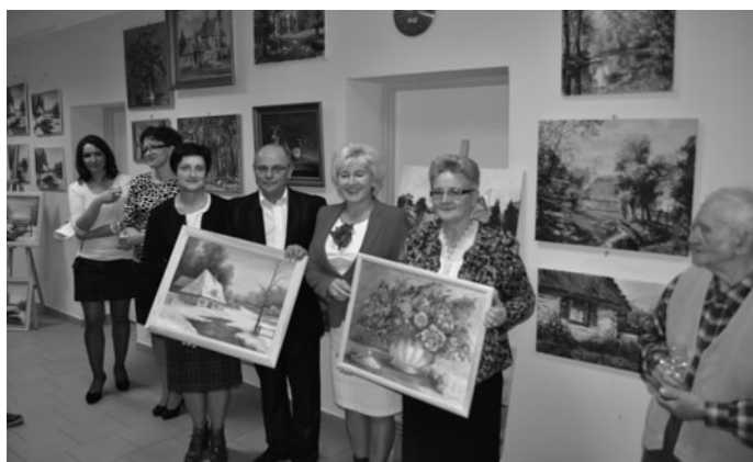
Laureacie w konkursie na Najpiękniejszą Bożonarodzeniową Posesję