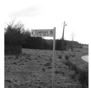
W sołectwie Czałczyn zamontowano tabliczkę informacyjną z numerami nieruchomości

Od lat znane były problemy mieszkańców Dobrzeszowa i okolicznych wsi z dostaniem się do Łopuszna. Brak połączenia znacząco utrudniał ludziom nieposiadającym samochodu lub niemogącym z niego skorzystać dostęp do lekarza czy urzędów. Od 2 marca bieżącego roku mieszkańcy wsi Dobrzeszów, Nowek i Podewsie mają możliwość dojazdu do Łopuszna bussem, który kursuje od poniedziałku do piątku zgodnie z poniższym rozkładem. Mieszkańcy wymienionych wsi są bardzo wdzięczni Wójtowi Gminy Łopuszno Pani Irenie Marcisz za zorganizowanie dojazdu i rozwiązanie jednego z najbardziej palących problemów.