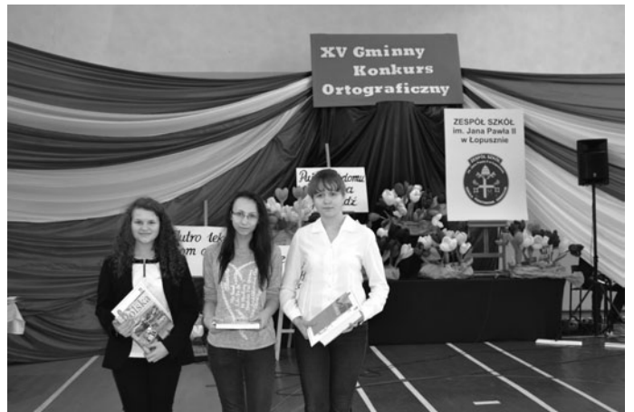
Najlepsze z ortografii gimnazjalistki