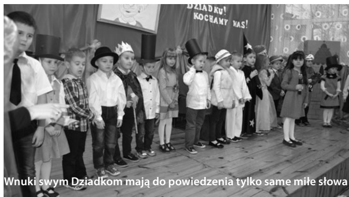
Wnuki swym Dziadkom mają do powiedzenia tylko same miłe słowa