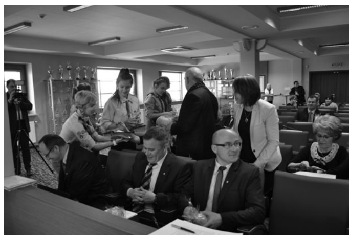
Z wizytą w Starostwie Powiatowym w Kielcach