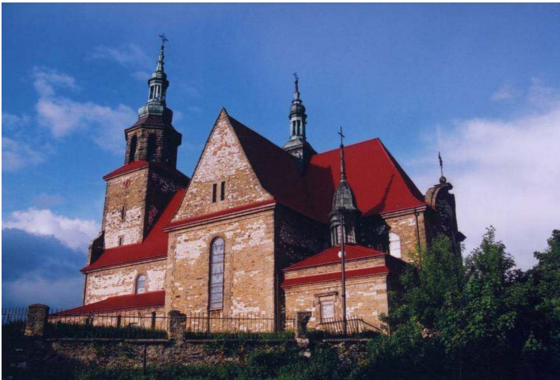
Kościół pod wezwaniem Podwyższenia Krzyża Świętego wybudowany w latach 1926 – 1933.