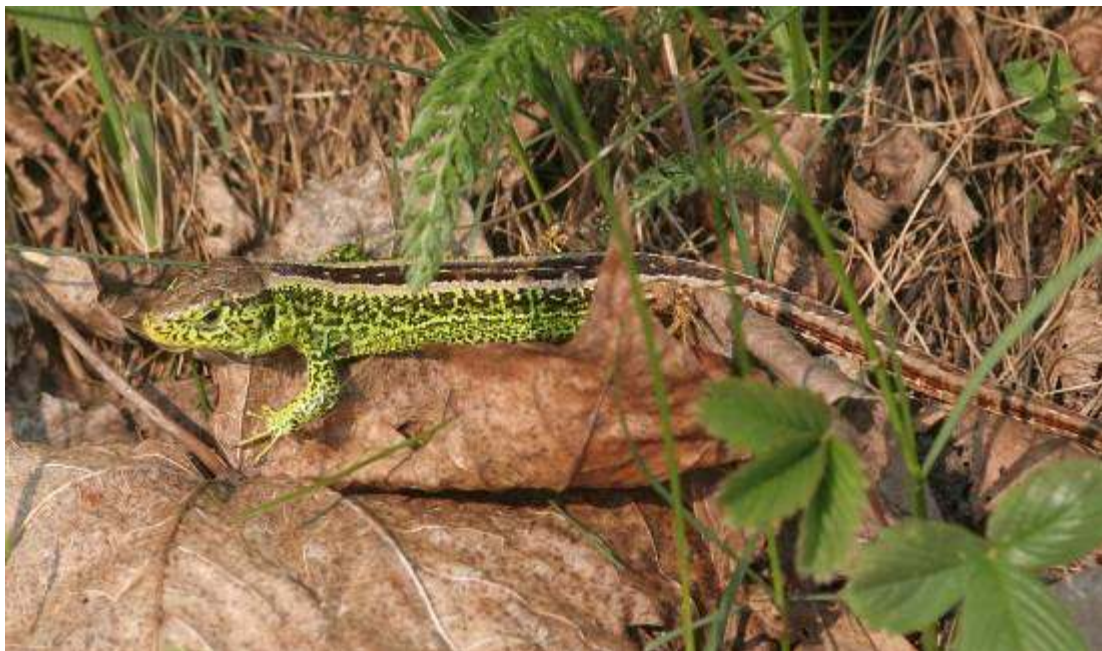
Jaszczurka zwinka, kraśnik sześcioplamek