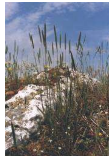
Turzyca sina, drżączka średnia, tymotka Boehmera.