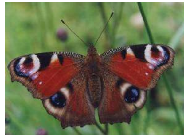
Polowiec szachownica, modraszek, rusałka pawik