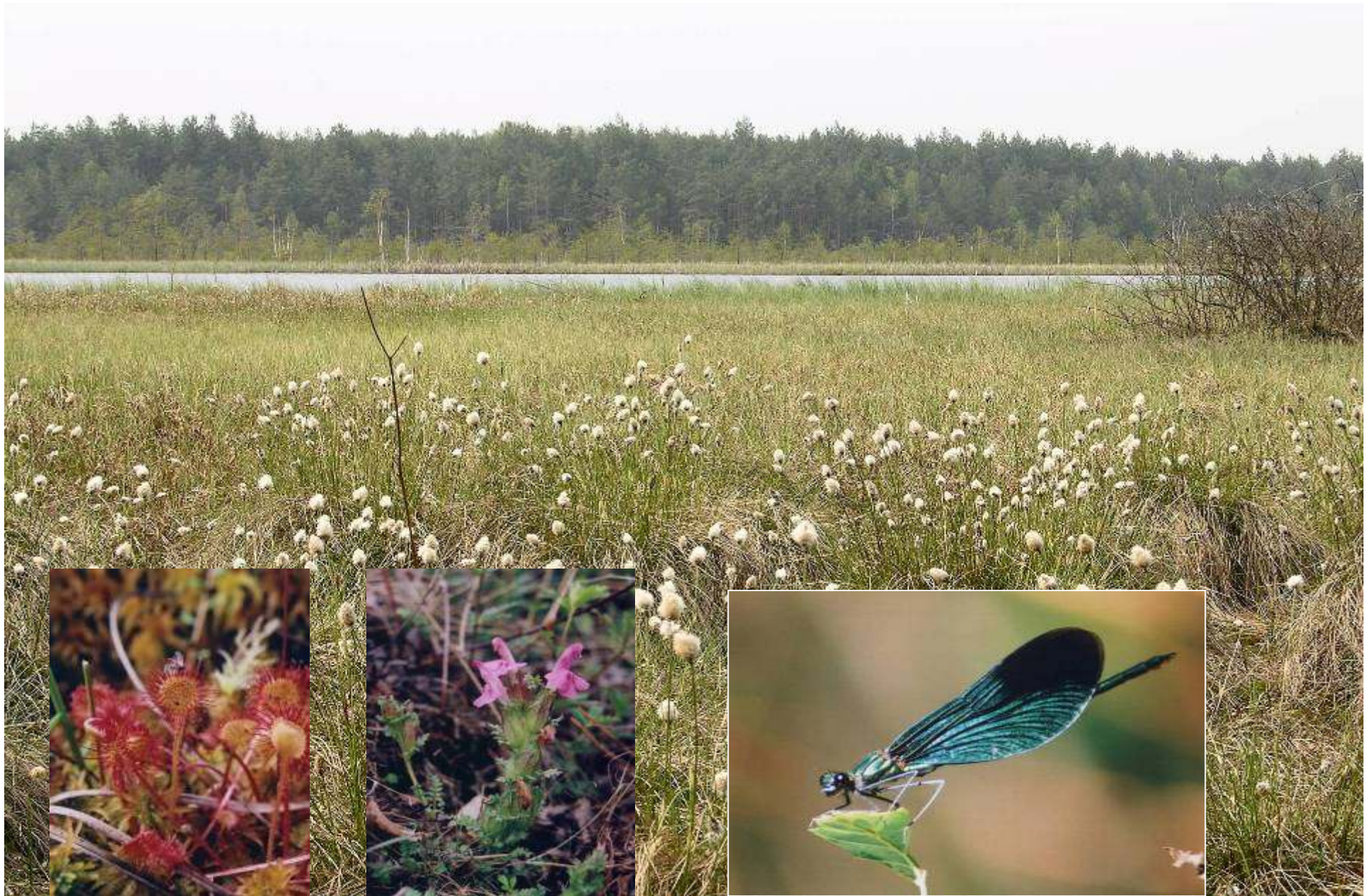
Torfowiska na Żabińcu są siedliskiem wielu rzadkich gatunków roślin i zwierząt rosiczka okrągłolistna, gnidosz rozestany (oba gatunki ściśle chronione), świeżianka