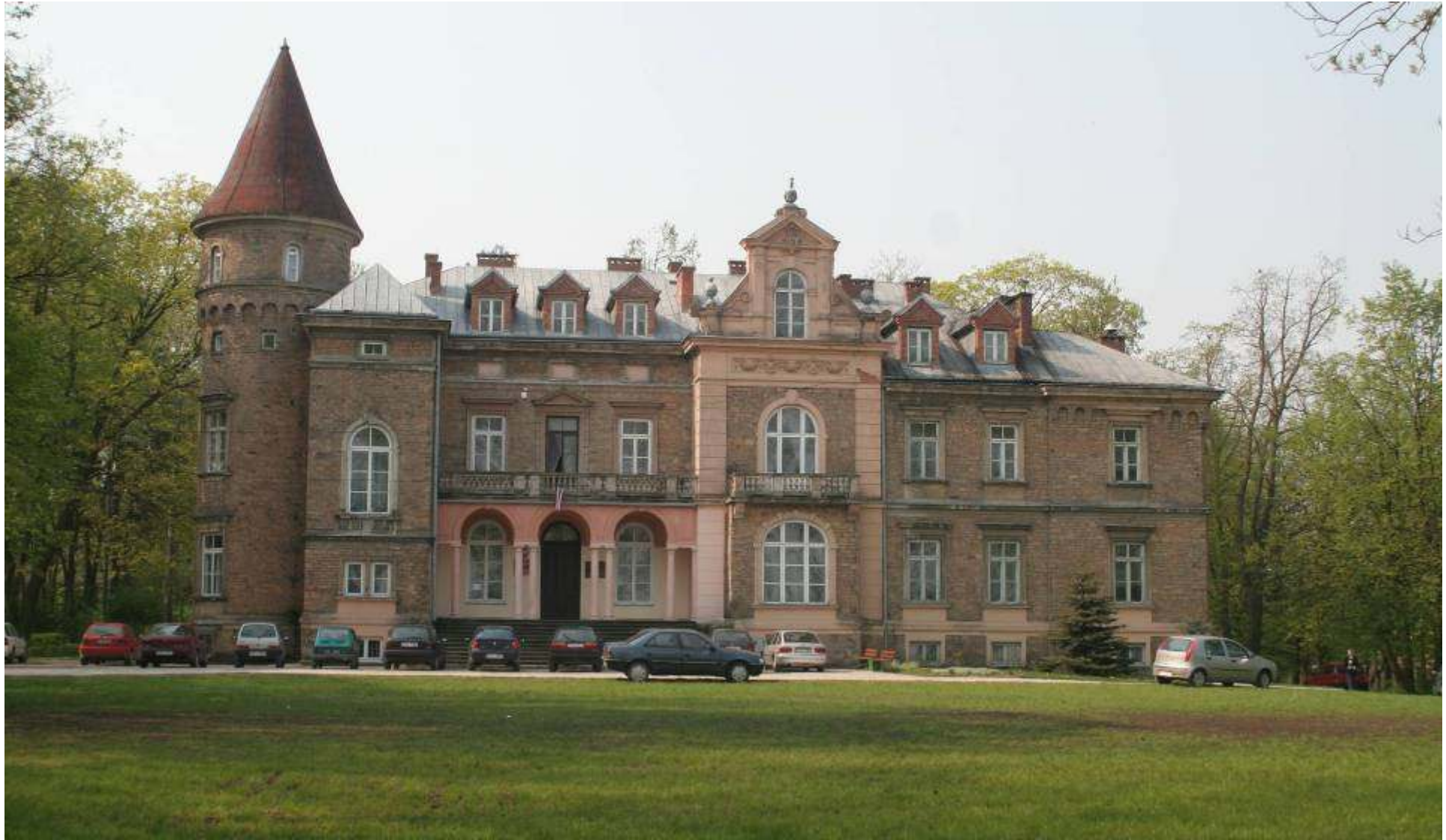
Pałac Dobieckich został wzniesiony w latach 1897 – 1905 wg projektu Marconiego.