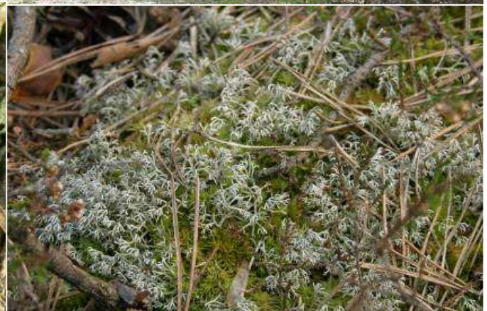
Bory sosnowe porastają różne gatunki chrobotków (porosty) ...