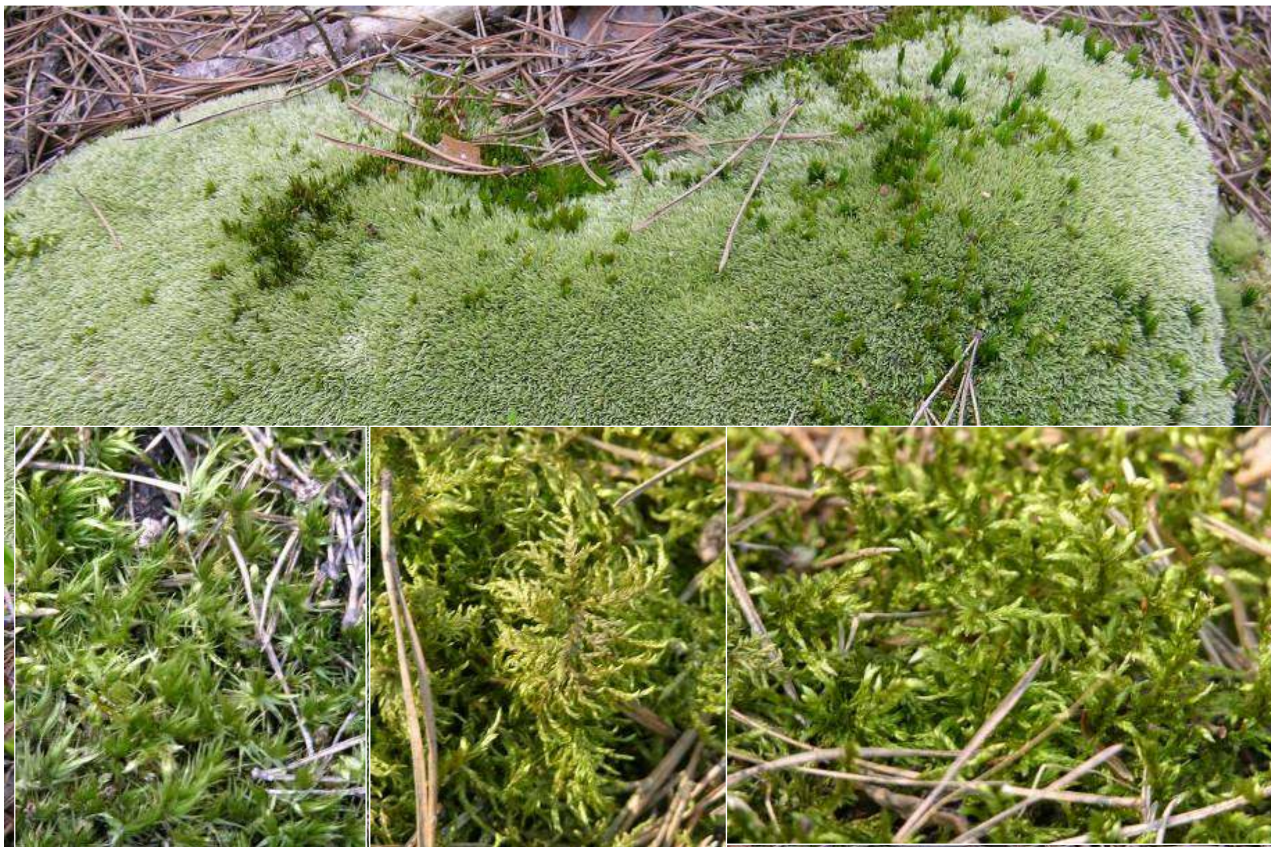
... mchów: bielistka siwa, widłoząb miotłowy, gajnik lśniący, rokiетnik pospolity.