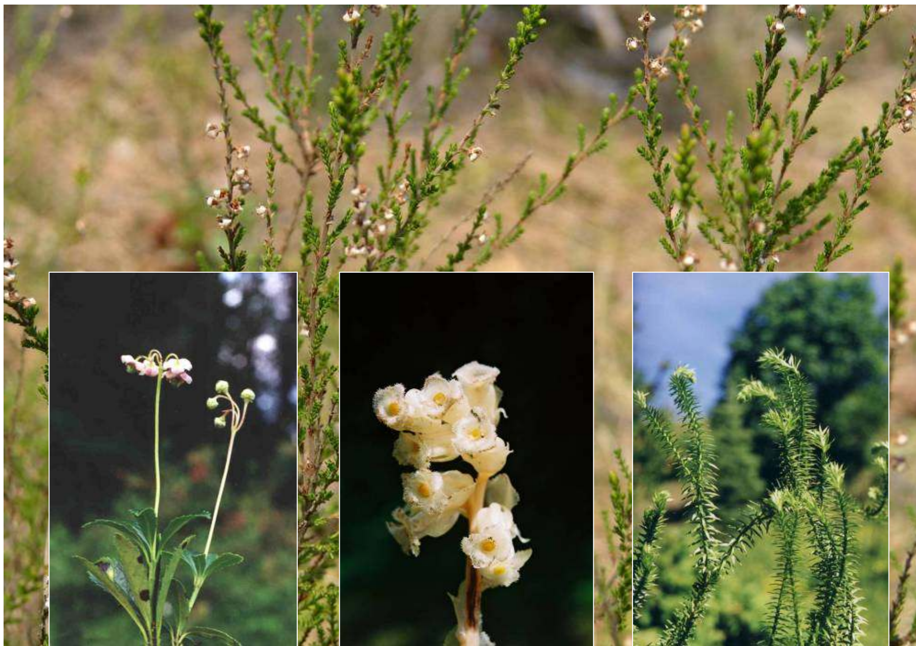
Rośliny boru sosnowego: wrzos pospolity, pomocnik baldaszkowaty, korzeniówka pospolita, widłak jałowcowaty.