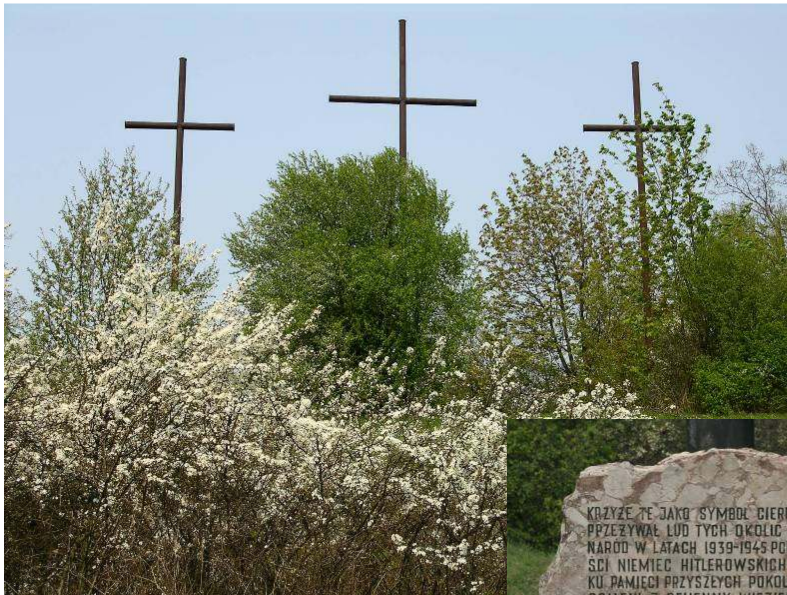
Wzgórze Kościółek – Trzy Krzyże