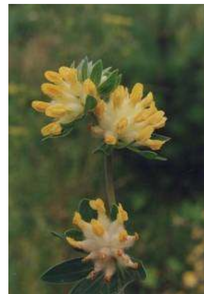
Przetacznik kłosowy, goździk kartuzek, przelot pospolity