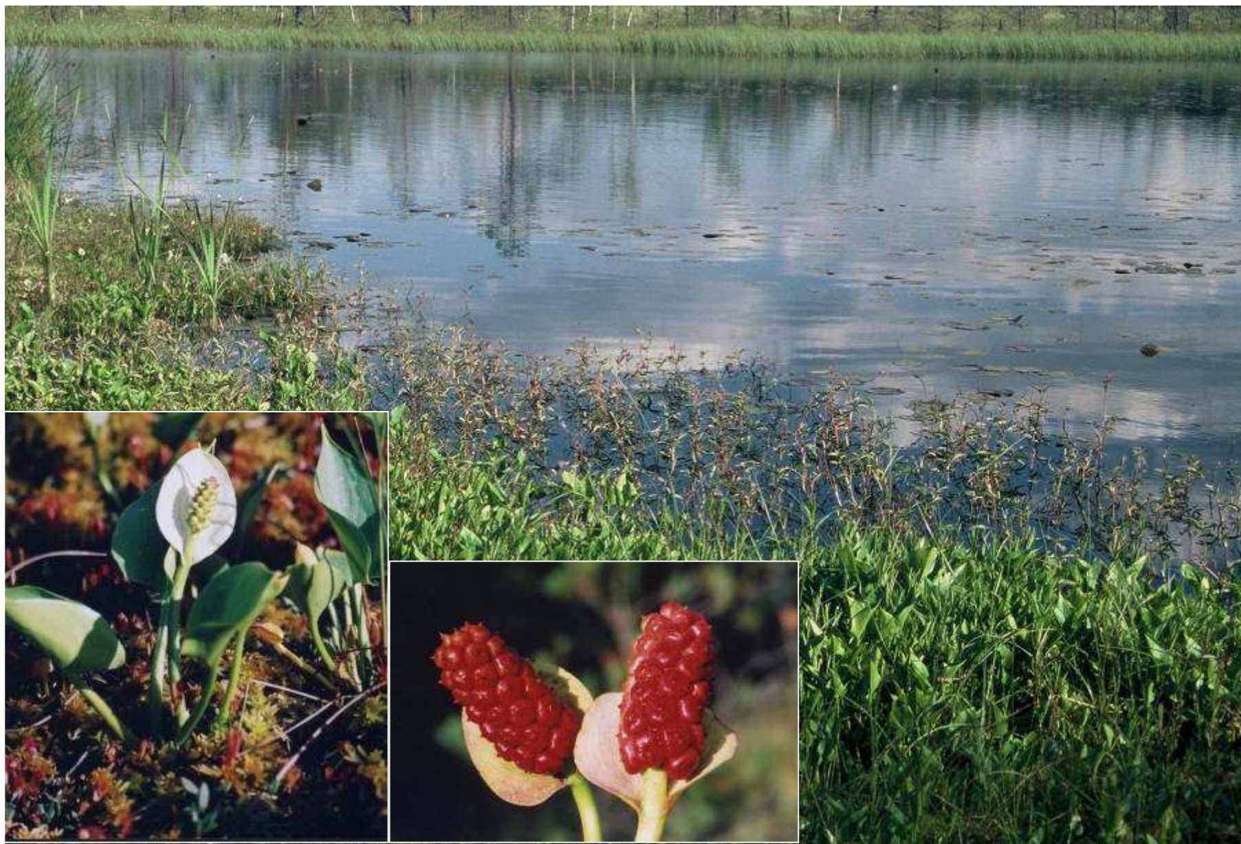
Brzeg jeziora Elżbiety porasta czermień błotna.