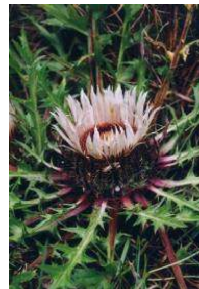
Pierwiosnek lekarski, dzika róża, dziewięcśl bezłodygowy (roślina ściśle chroniona).