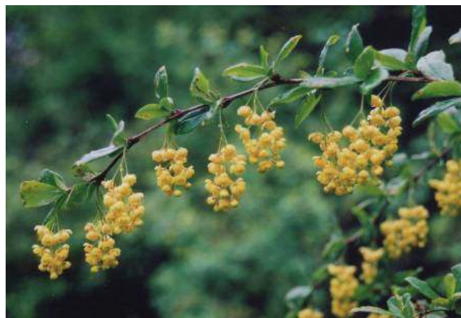
Głóg jednoszyjkowy, berberys zwyczajny