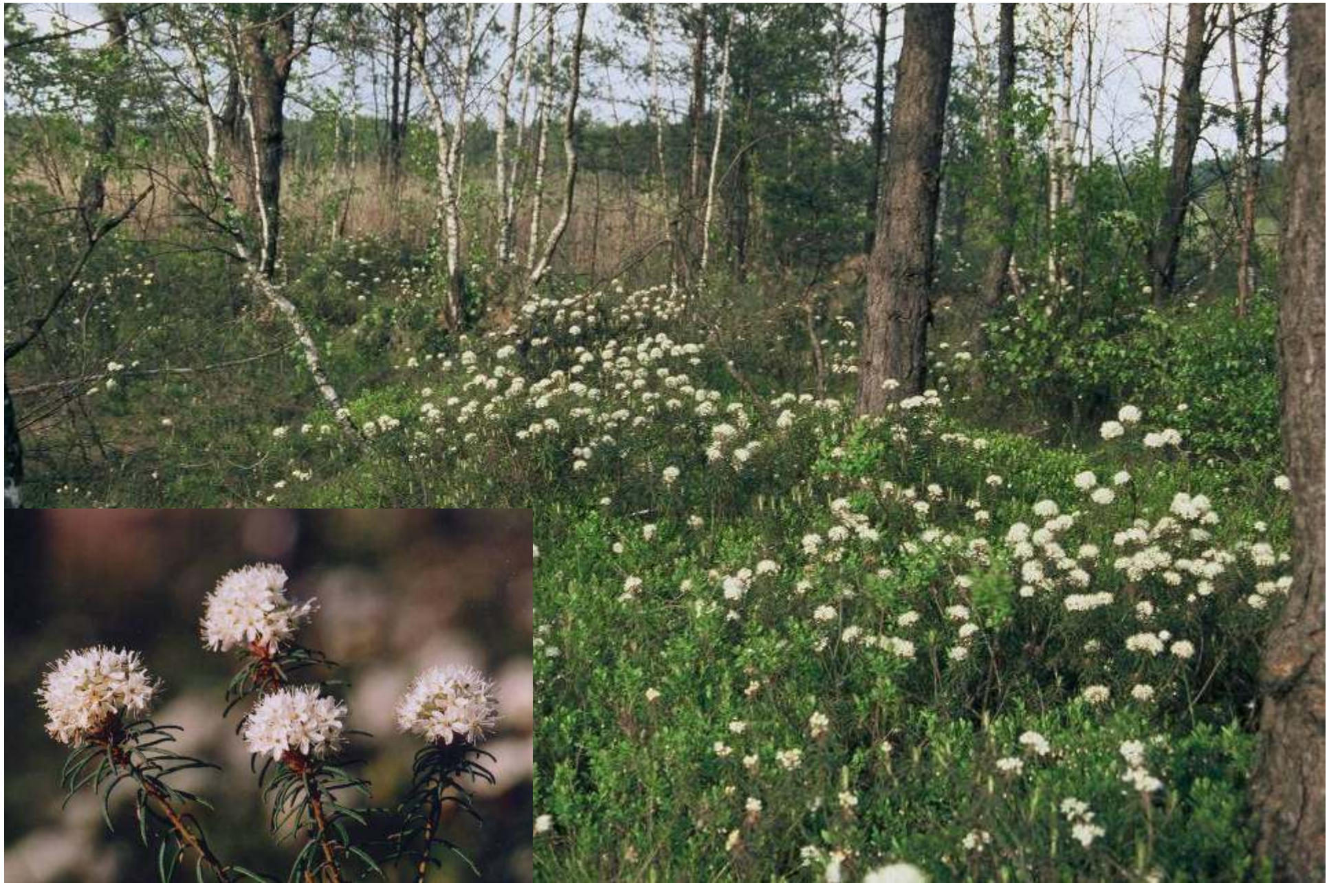
Sosnowy bór bagienny z chronionym bagnem zwyczajnym