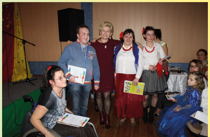
Uczniowie Warsztatów Terapii Zajęciowej z Panią Wójt