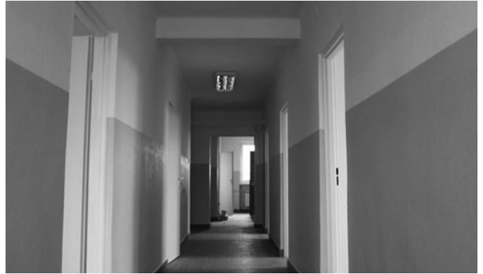
Wnętrze budynku w końcowej fazie remontu