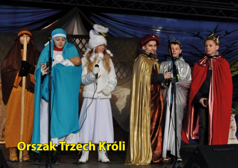
Orszak Trzech Króli