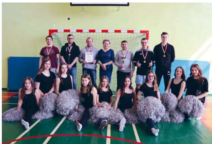
DRUŻYNA EUSTACHOWA - ZWYCIĘZCY TURNIEJU