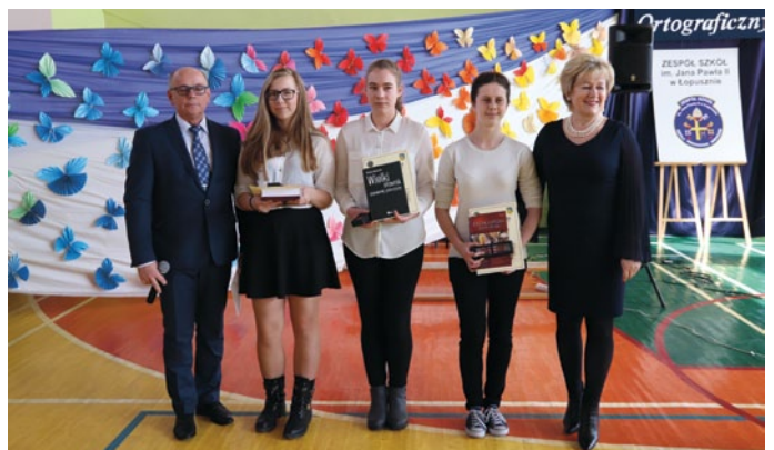
ZWYCIĘZCĄ W 3. KATEGORII WIEKOWEJ