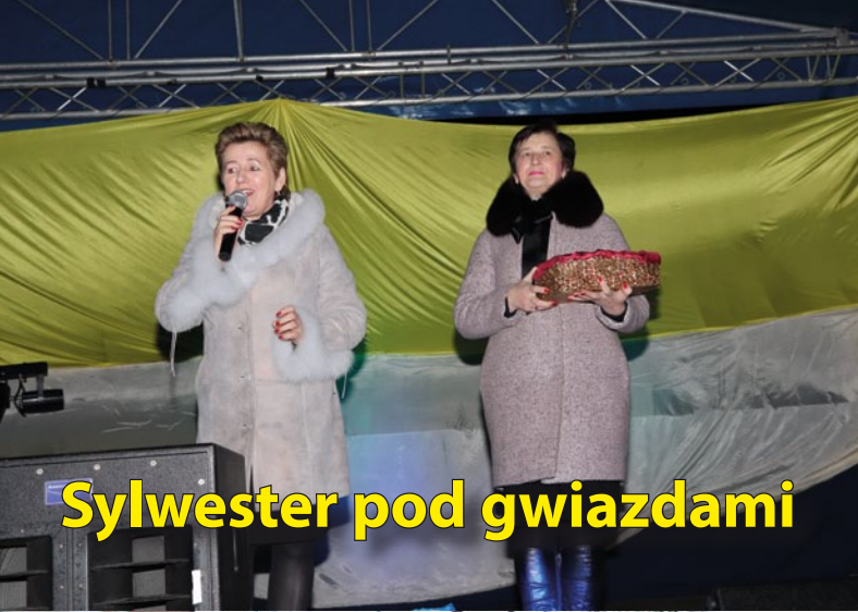
Sylwester pod gwiazdami