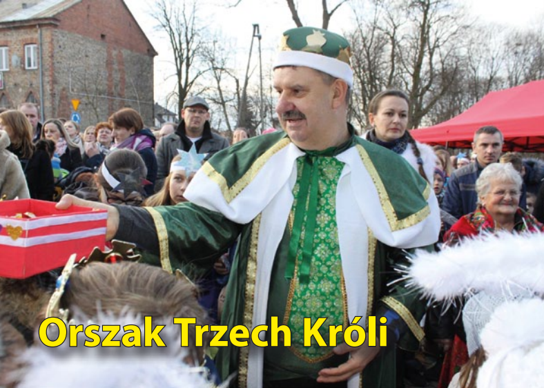
Orszak Trzech Króli