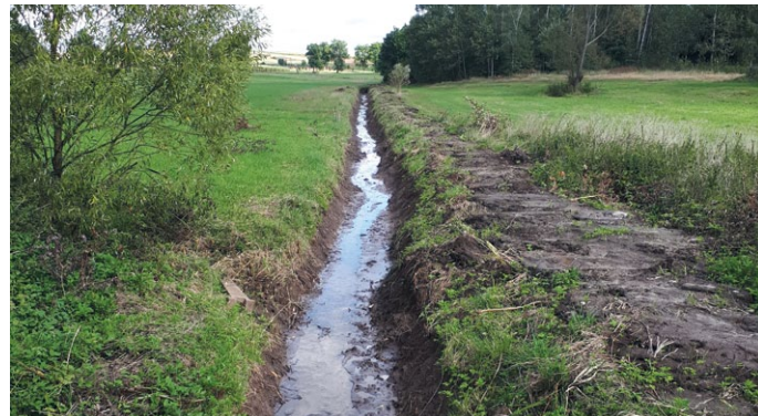
R-3 PO PRZEPROWADZONEJ KONSERWACJI W M. JÓZEFINA

Należy podkreślić, iż przeprowadzone prace melioracyjne w Józefinie na odcinku 1820 mb oraz w Sarbicach Pierwszych - Sarbicach Drugich na odcinku 2140 mb zostały zrealizowane dzięki udzielonej dotacji przez Wojewodę Świętokrzyskiego na konserwację urządzeń melioracji szczegółowej. Przedmiotowe prace polegały na wycince zakrzaczeń, wyka-