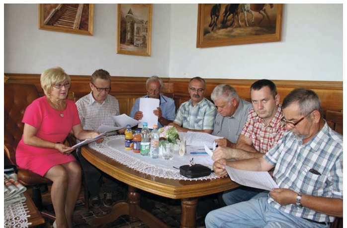
NARADA KOMISJI BUDOWNICTWA, DROGOWNICTWA, GOSPODARKI KOMUNALNEJ ORAZ BEZPIECZEŃSTWA I PORZĄDKU PUBLICZNEGO

Przebudowa drogi w miejscowości Jedle k/boiska (działka Nr 266 oraz część działki Nr 317 – skrzyżowanie) długość 191,00 mb;