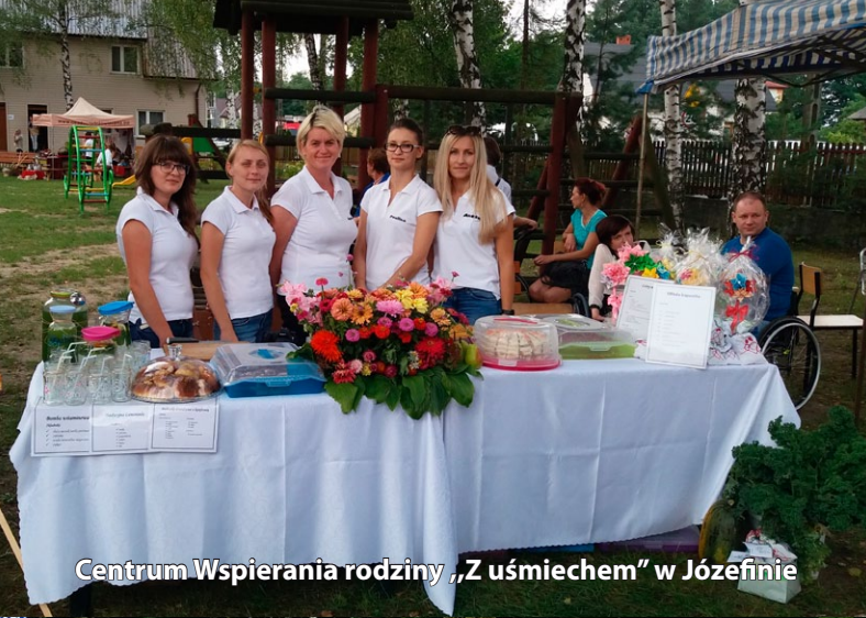
Centrum Wspierania rodziny „Z uśmiechem” w Józefinie