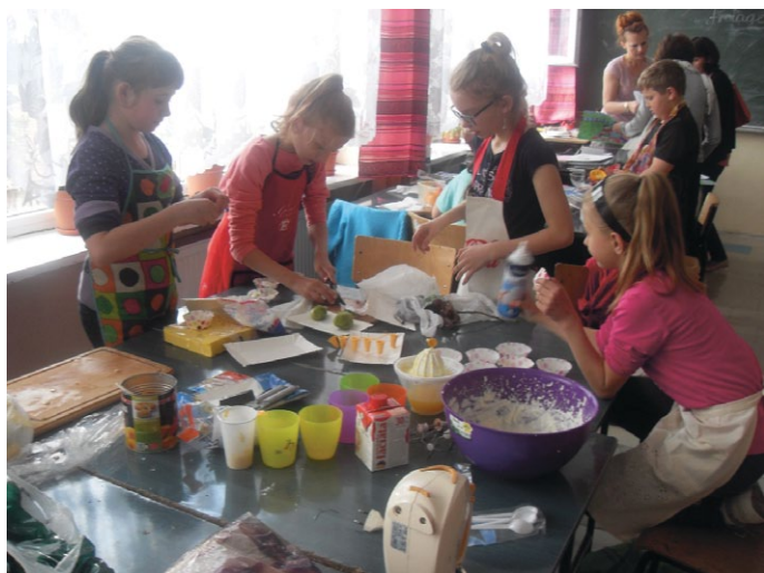
Klasa 4b przygotowuje sałatki