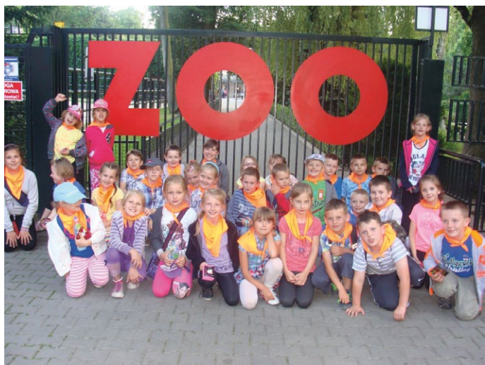
Dzieci lubią ZOO, ZOO lubi dzieci