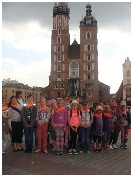
Na krakowskim rynku... Hejnał zawsze słychać

gdzie żyła legendarna bestia. Mieszkanie było ciemne i puste, bo smoczyko (już całkiem niegroźne) stoi sobie na ogromnym głazie pod Wawelem, zionie co jakiś czas ogniem i czeka na turystów, z którymi uwielbia się fotografować. Po trudach wędrówki z przyjem-