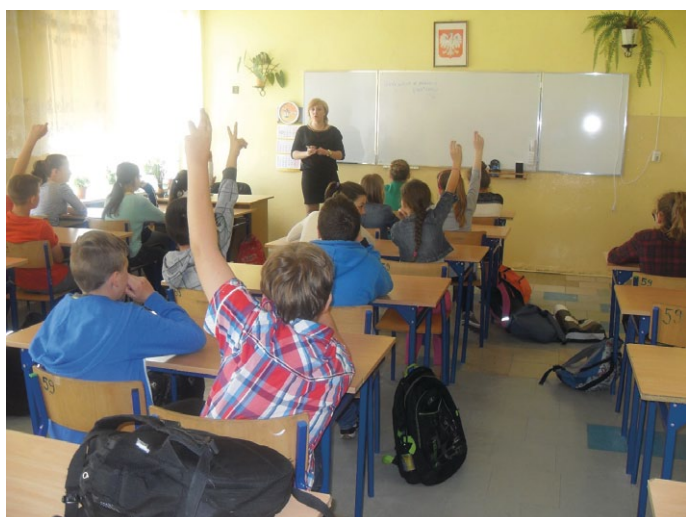
Warsztaty profilaktyczne z terapeutą uzależnień