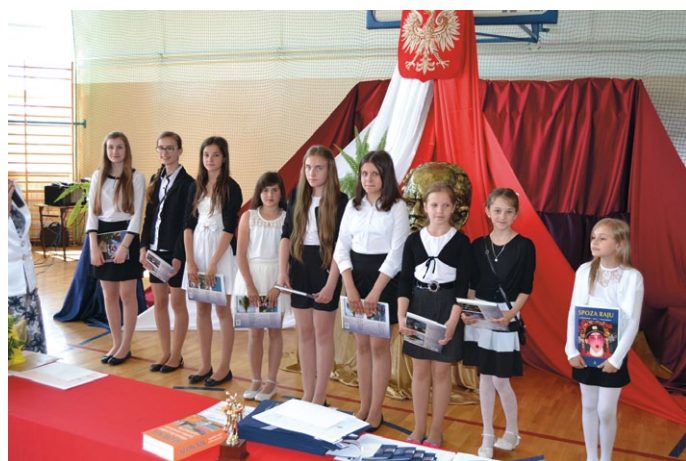
Zadowoleni i niektórzy z wieloma nagrodami