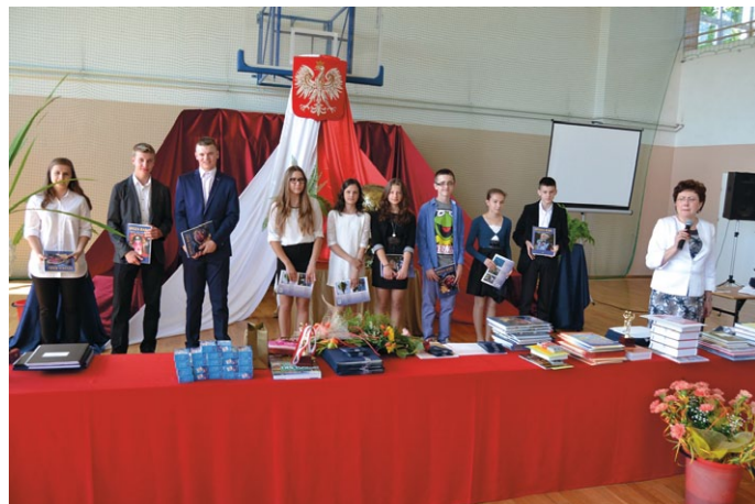
Jedni z nagrodzonych, a nagród do rozdania jeszcze wiele...