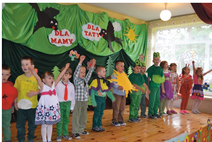
Wiele, wiele radości...