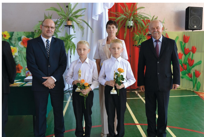
Piotr i Paweł nie opuścili ani jednego dnia w szkole w klasach I - III