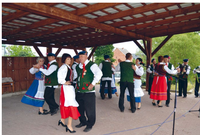
Zespół Gnieździska w swoim programie artystycznym