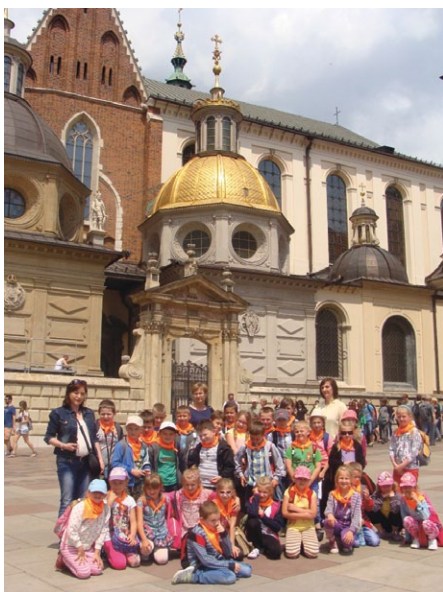
Wawel majestatyczny, królewski

18 czerwca dzieci z klas I – III wraz z wychowawczyniami wyruszyły wczesnym rankiem w podróż do prastarego Krakowa na spotkanie z historią i legendami. Po przybyciu na miejsce, na Placu Matejki powitała nas bardzo sympatyczna pani przewodniczka, która poprowadziła dzieci szlakiem legend krakowskich aż do samego Wawelu. Przeszliśmy więc obok Barbakanu przez bramę Floriańską i przemaszerowaliśmy pod Kościół Mariacki, gdzie wysłuchaliśmy legendy związanej z kościołem Mariackim i legendy o zaczarowanych w gołębie dworzanach, a następnie usłyszeliśmy grany na żywo hejnał. Zobaczyliśmy mały i duży rynek, Sukiennice, pomnik Adama Mickiewicza, wiele ciekawych zabytkowych kamienic i przepiękne krakowskie dorożki. Wędrując na Wawel, zatrzymaliśmy się pod oknem papieskim przy ulicy Franciszkańskiej, weszliśmy do dzielnicy uniwersyteckiej na dziedzińiec Collegium Maius. Na wzgórzu wawelskim zwiedziliśmy Katedrę i wdrapaliśmy się na wieżę, aby dotknąć serca dzwonu Zygmunta. Następnie zeszliśmy do smoczey jamy, aby zobaczyć,