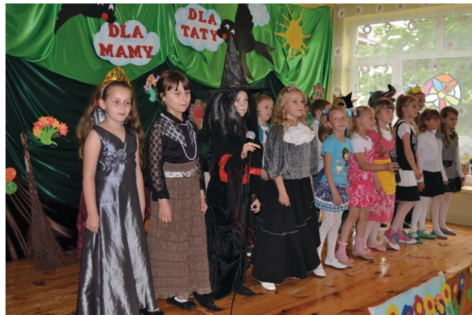
Rodzicom - zupełnie z innej bajki