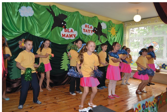
Taniec dla kochanych mam i tatusiów