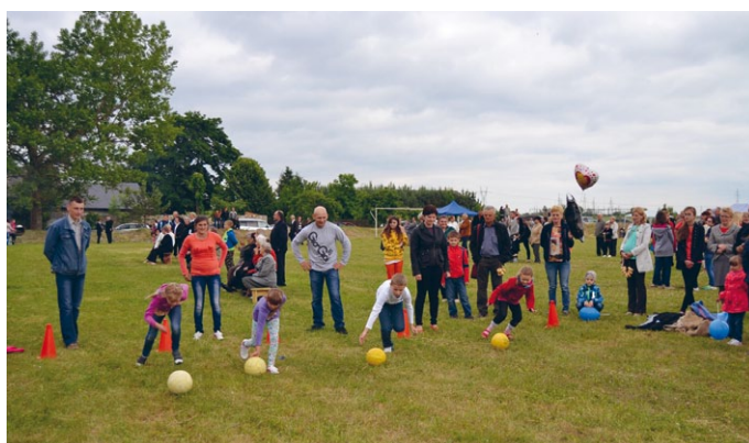
Rywalizacja drużyn Rodzic - Dziecko