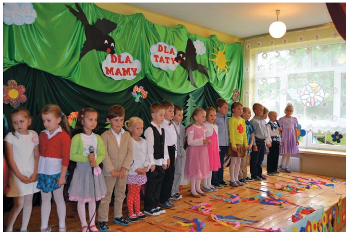
Dla Mamy, dla Taty