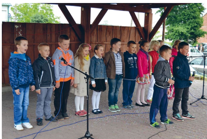
Jak radośnie i wesoło