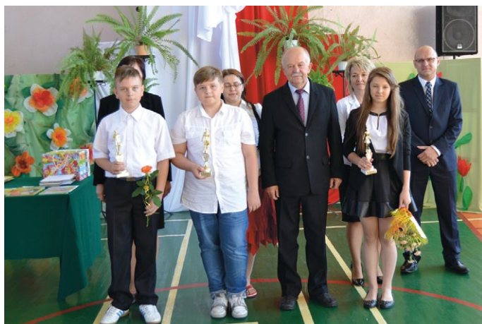
Uczniowie wyróżnieni za 100 % frekwencji w klasach IV - VI