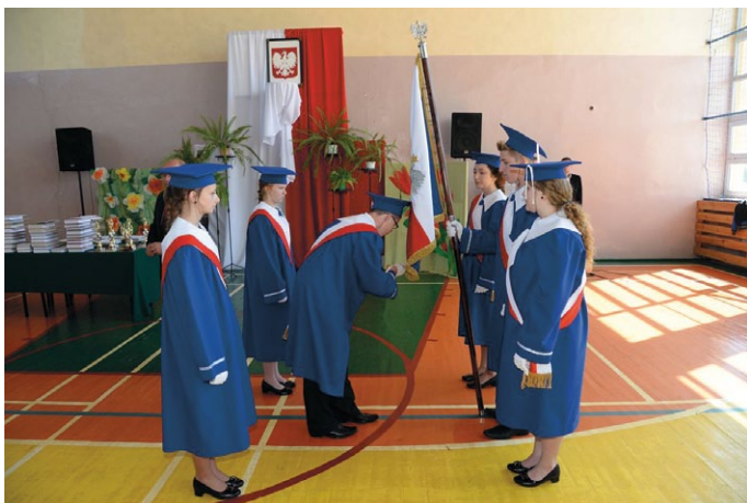
Absolwenci przekazują sztandar szkoły młodszym kolegom

uszowi Jakusikowi. A potem za poczetem sztandarowym podążyliśmy do szkoły na drugą część uroczystości.