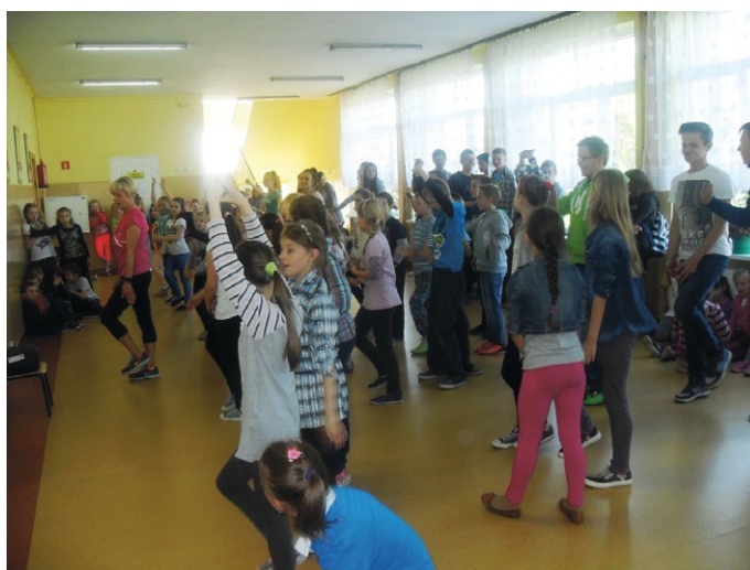
Aktywnie wypoczywamy na przerwie