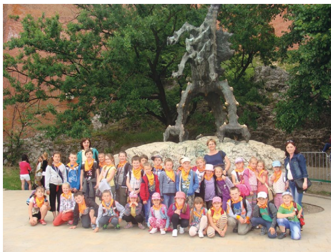
Smok niegroźny, nawet nas polubił