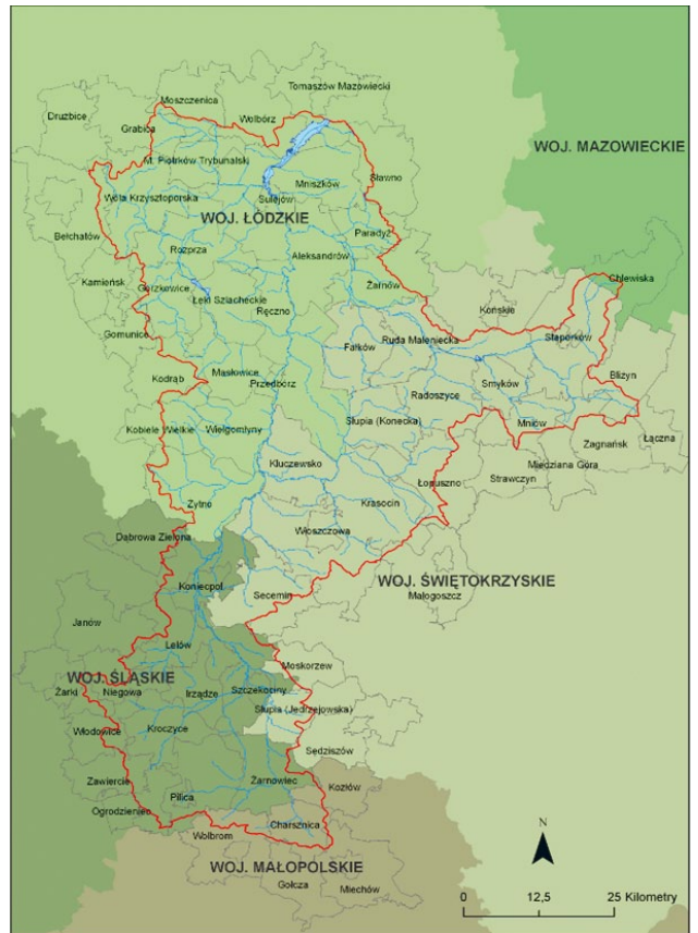
Ryc.2. Obszar zlewni Pilicy objęty projektem.