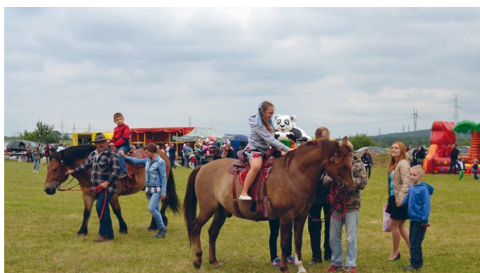
Konie się napracowały, wożąc wszystkich chętnych