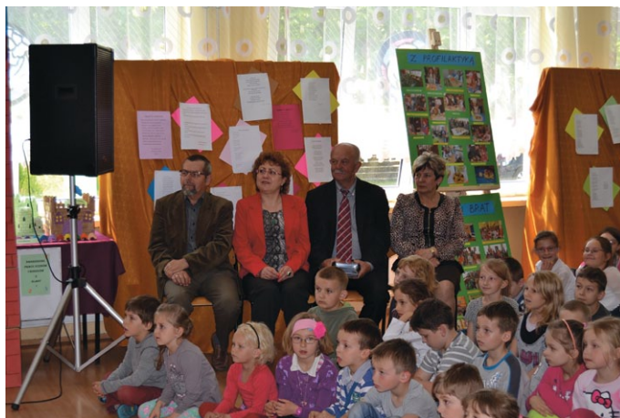
Podsumowanie Tygodnia Profilaktyki