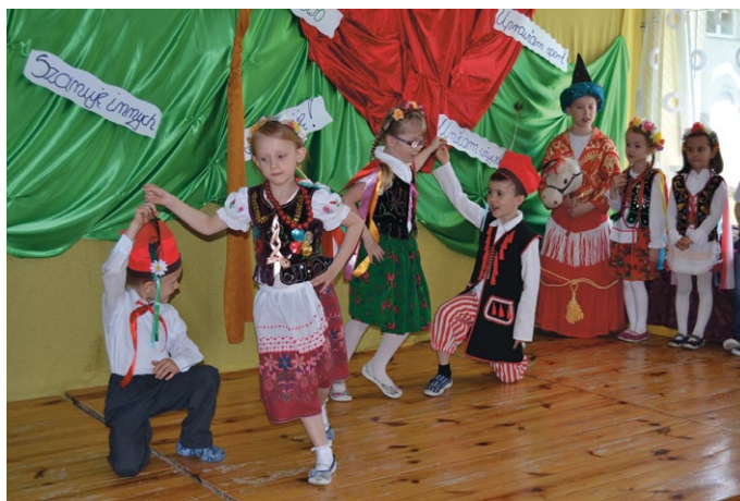
Krakowski występ przedszkolaków