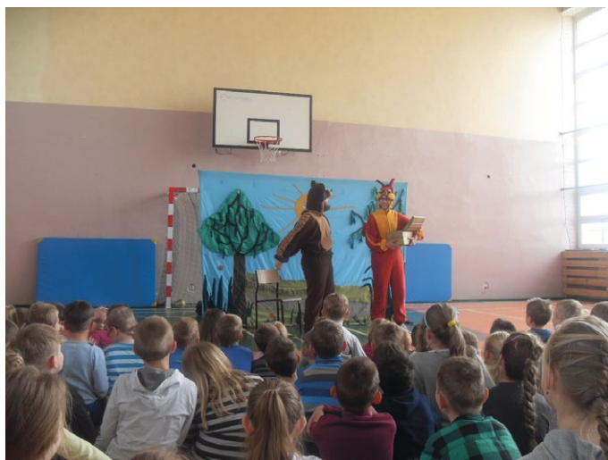
Spektakl profilaktyczny „Dobre rady wiewiórki Majki”