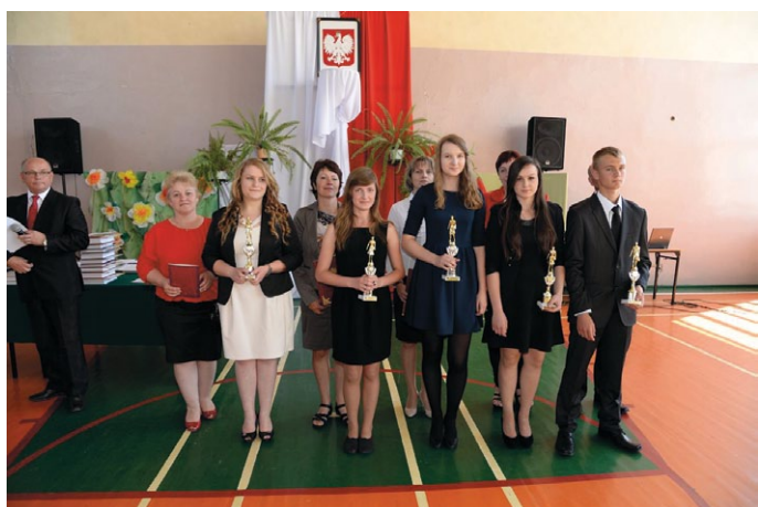
Gimnazjaliści, którzy wzorowo uczęszczali do szkoły