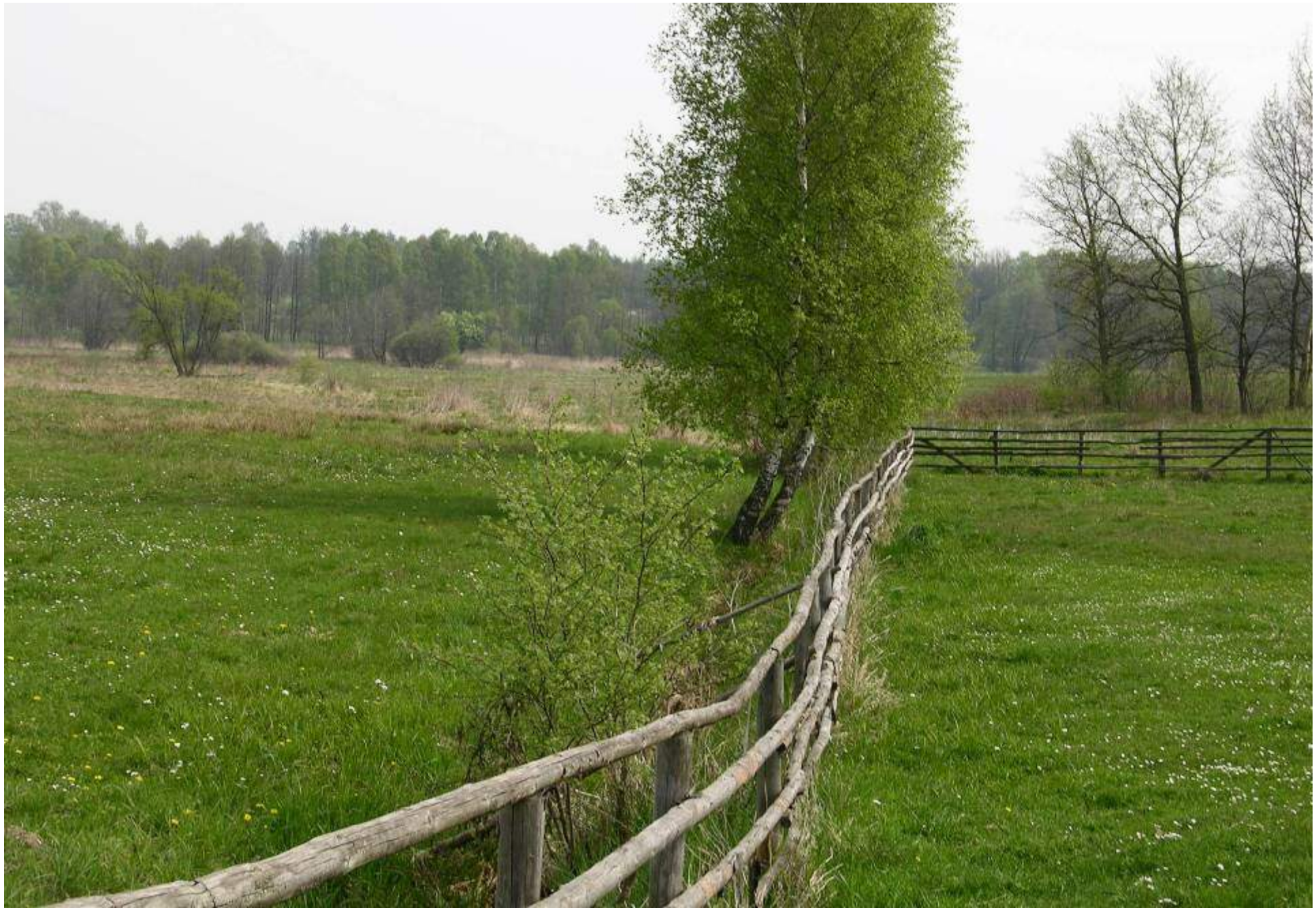
Łąki i pastwiska nad Łososią (Wierną Rzeką)