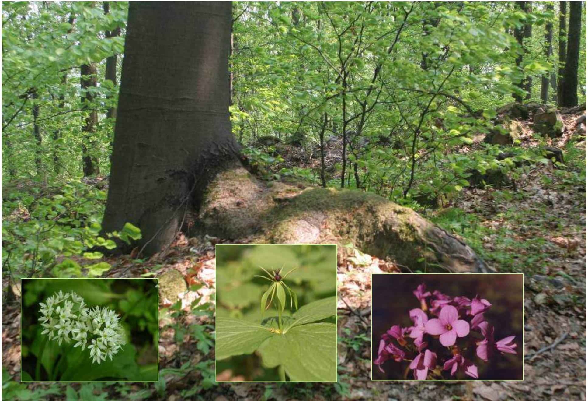
Rezerwat leśny na Górze Dorzeszowskiej. Rosną tu: czosnek niedźwiedzi, czworolist pospolity i żywiec cebulkowy