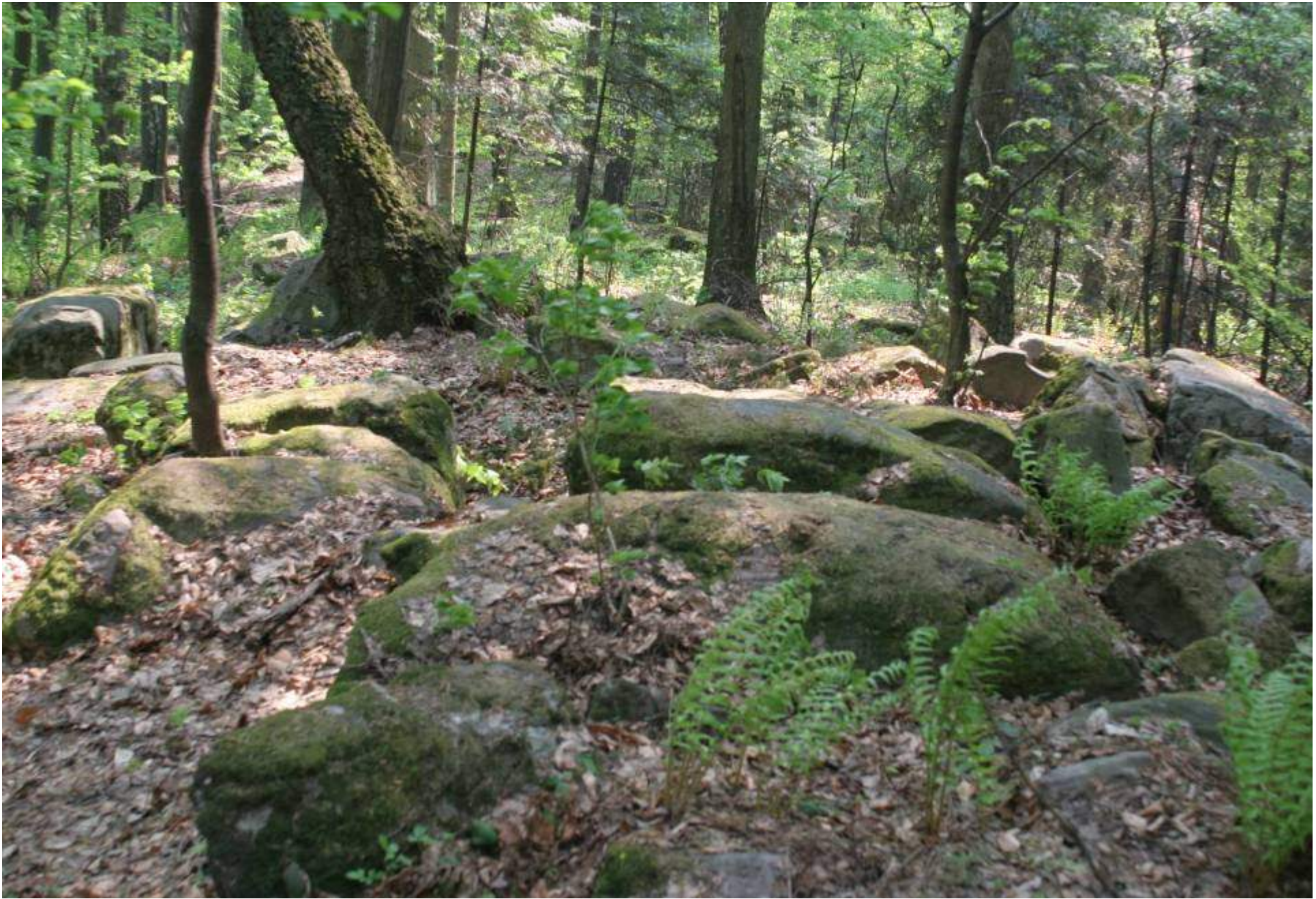
Sanktuarium pogańskie na Górze Dobrzeszowskiej