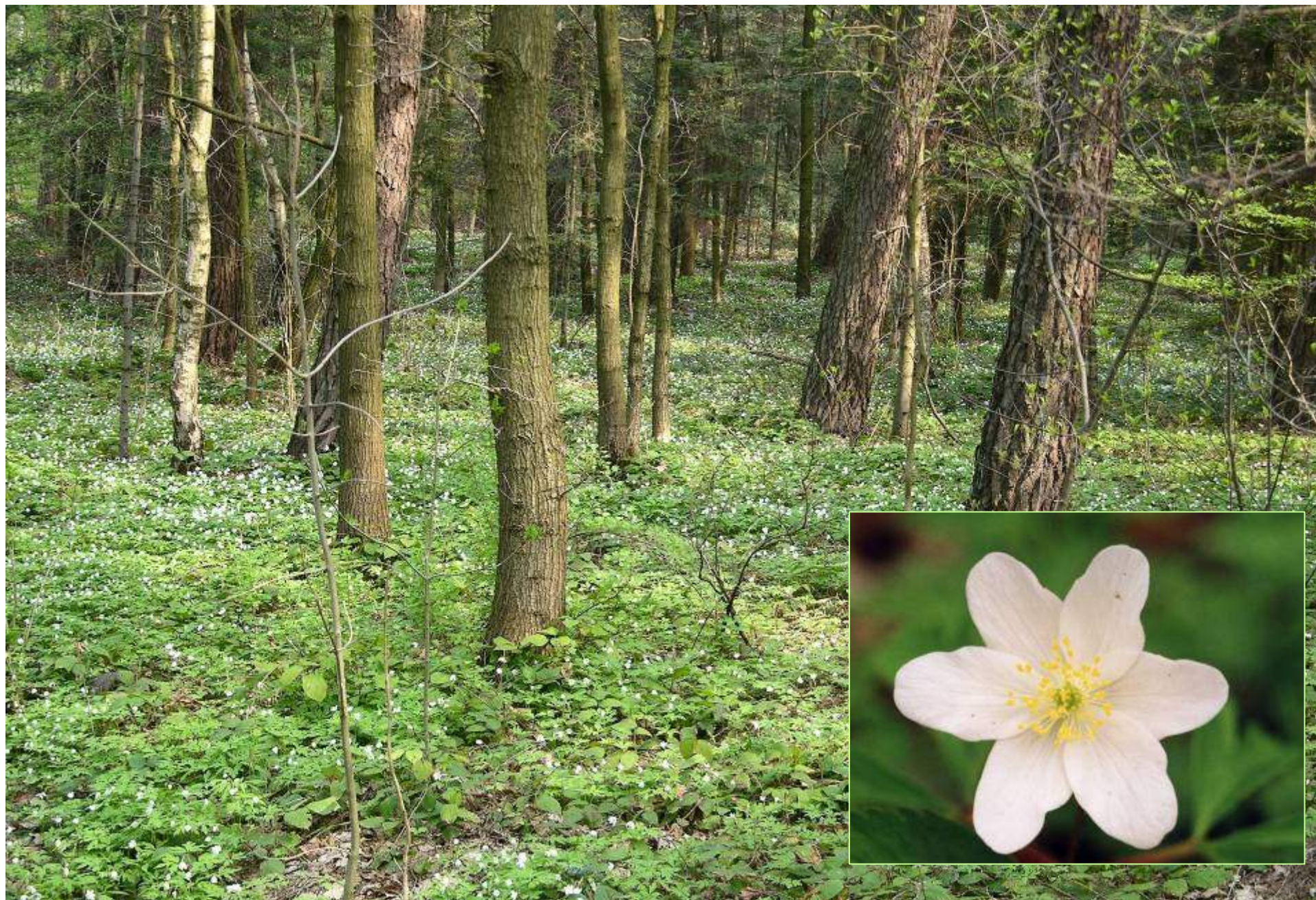
Las mieszany, z kwitnącym wczesną wiosną zawilcem gajowym