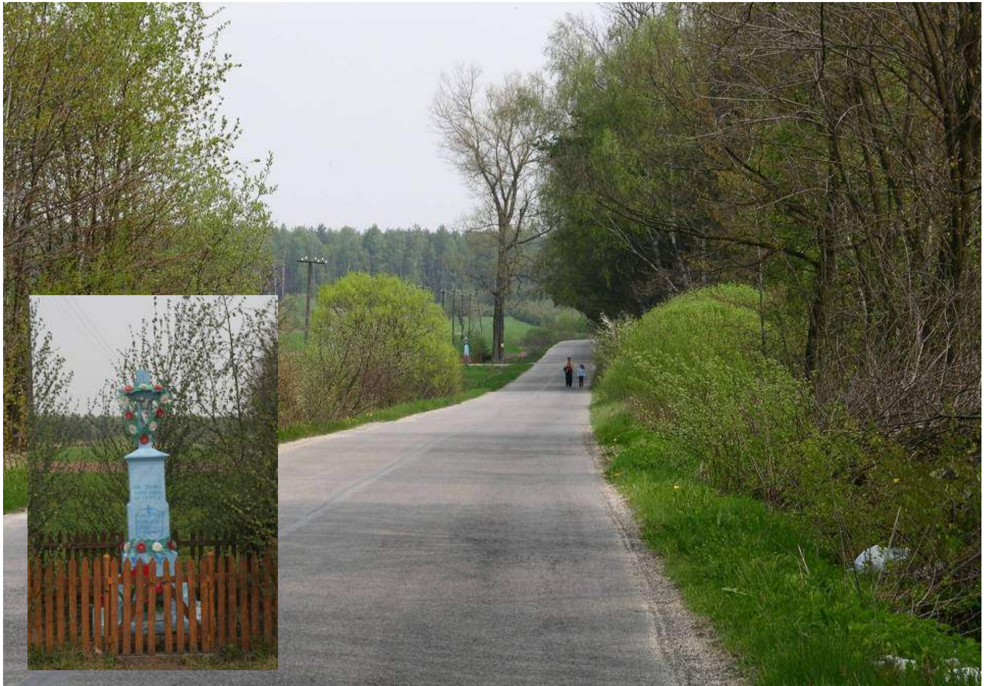
Droga do Dobrzeszowa