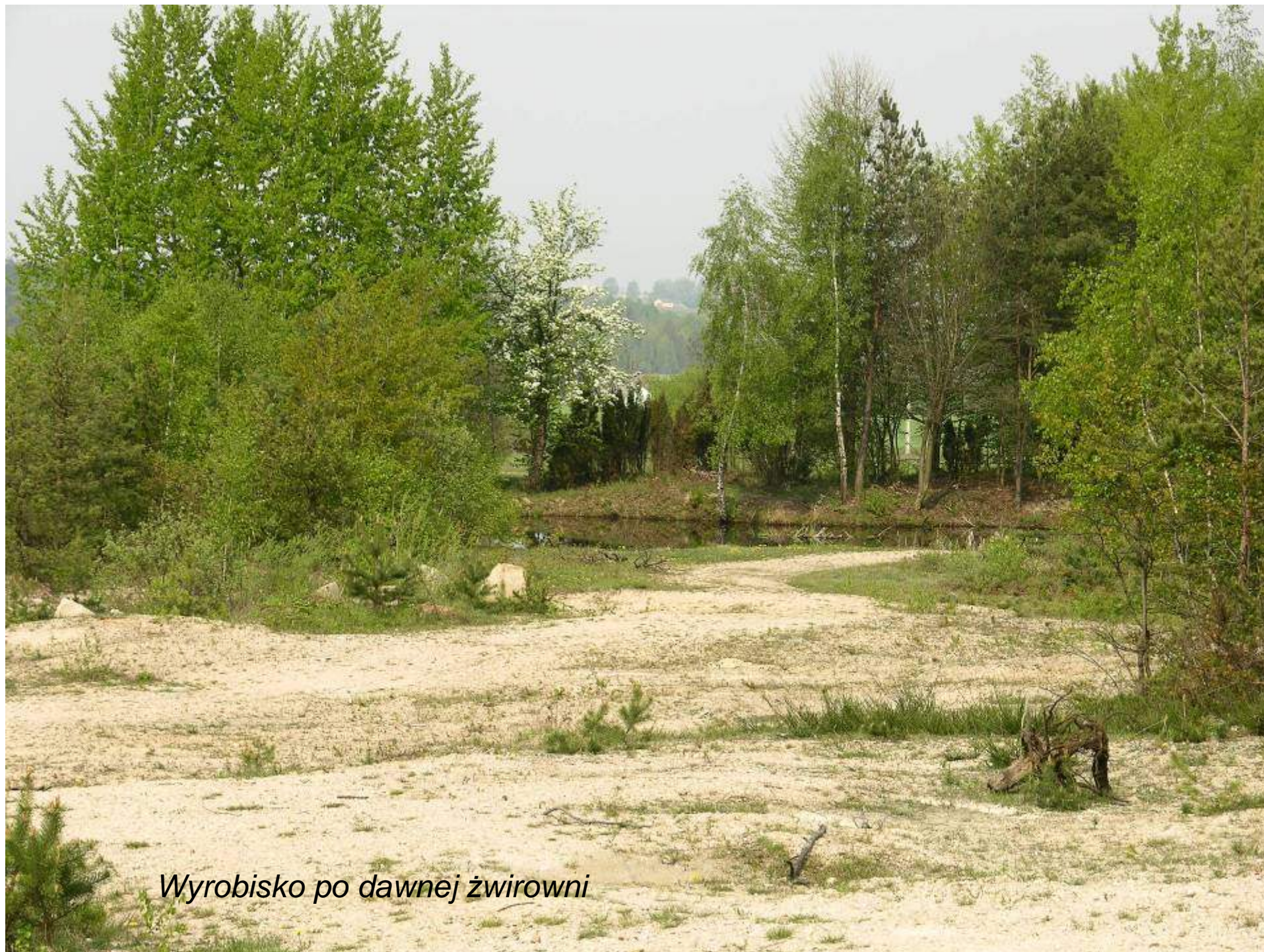
Wyrobisko po dawnej żwirowni