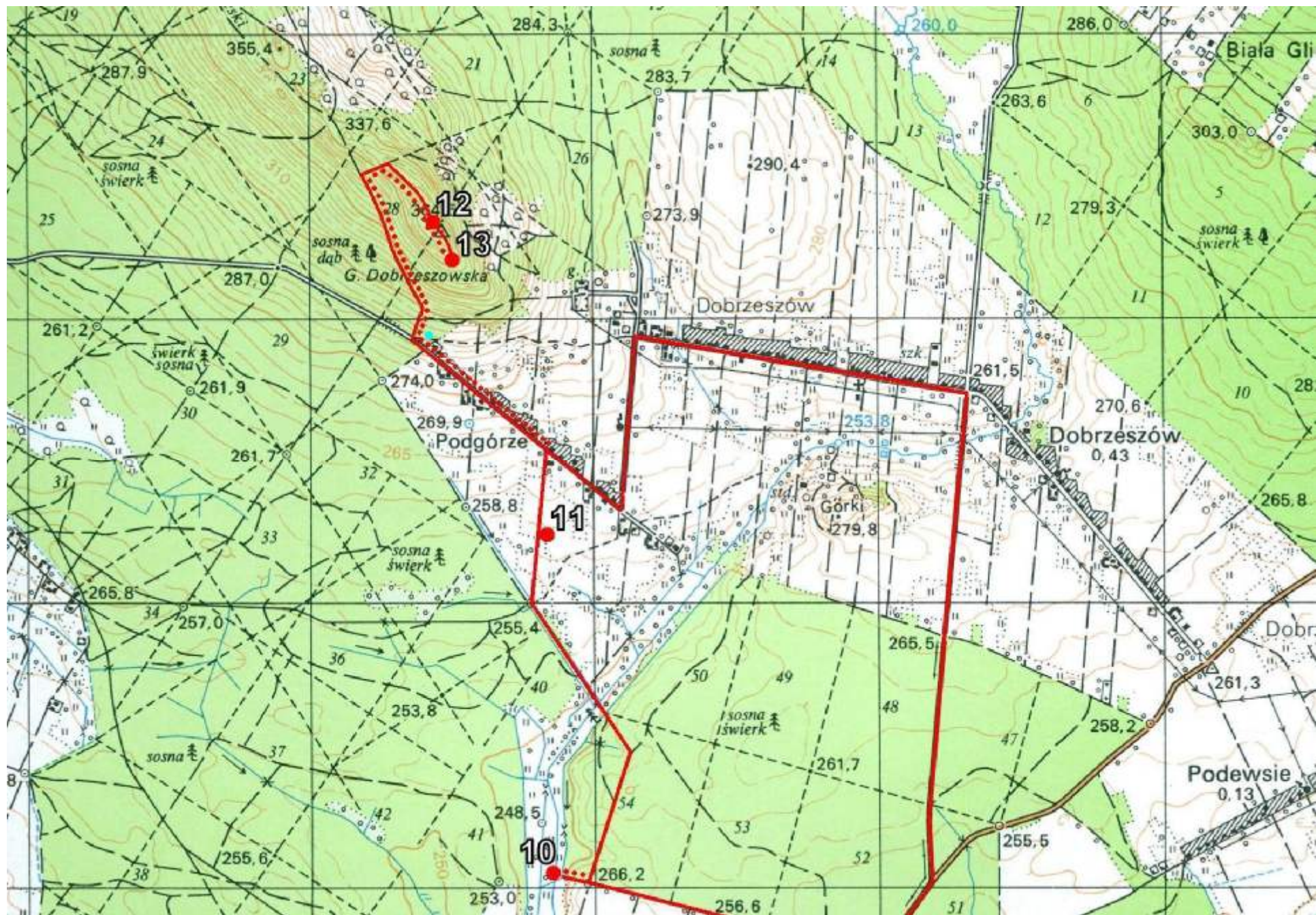
Mapka przebiegu ścieżki od przystanku 10 do przystanku 13.