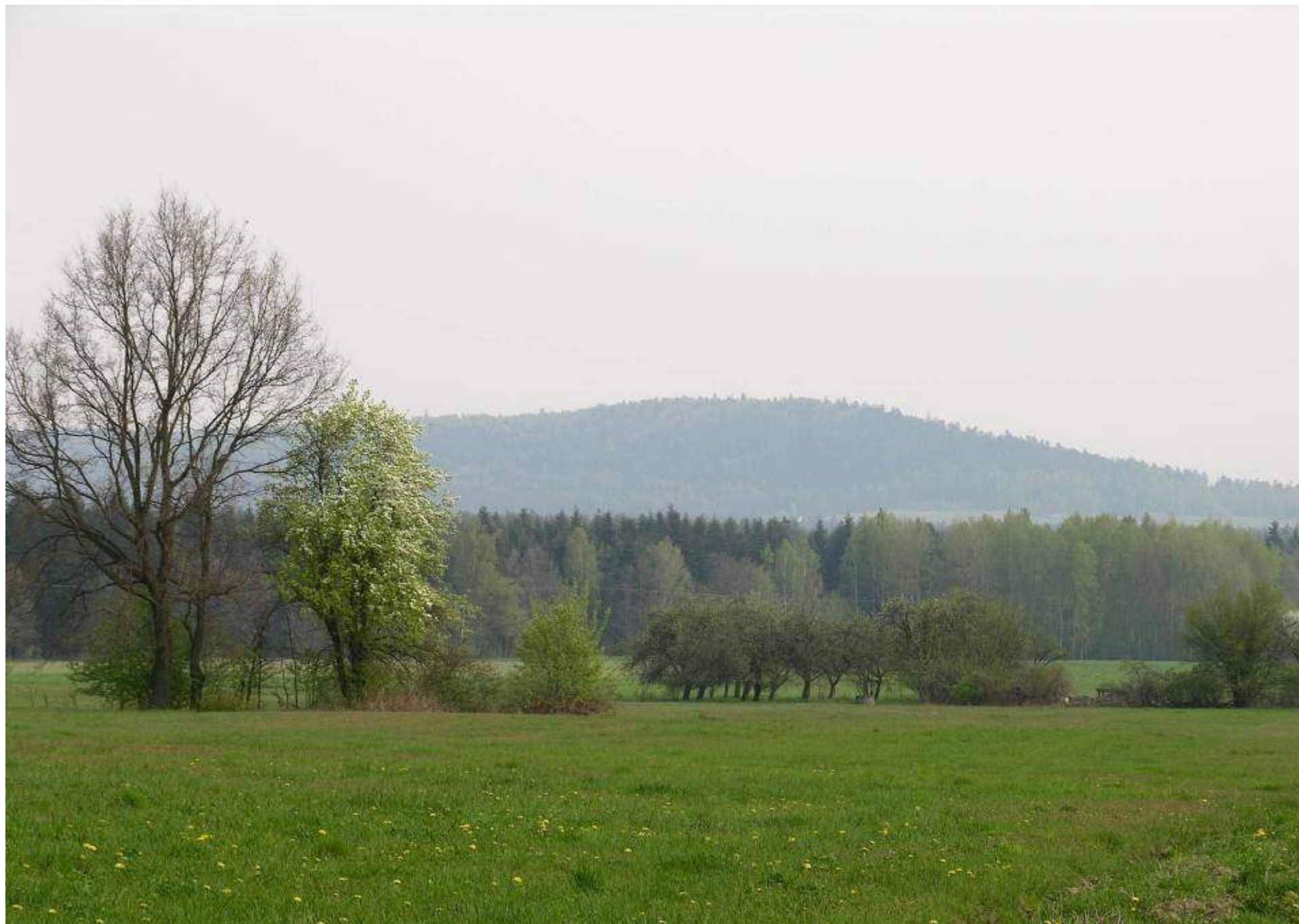
Widok na Górę Dobrzeszowską