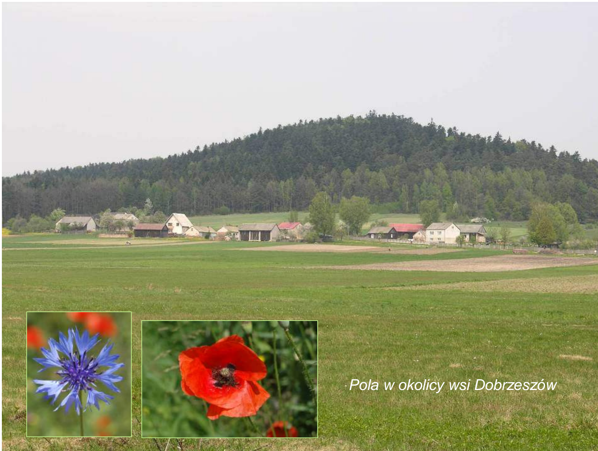
Pola w okolicy wsi Dobrzeszów