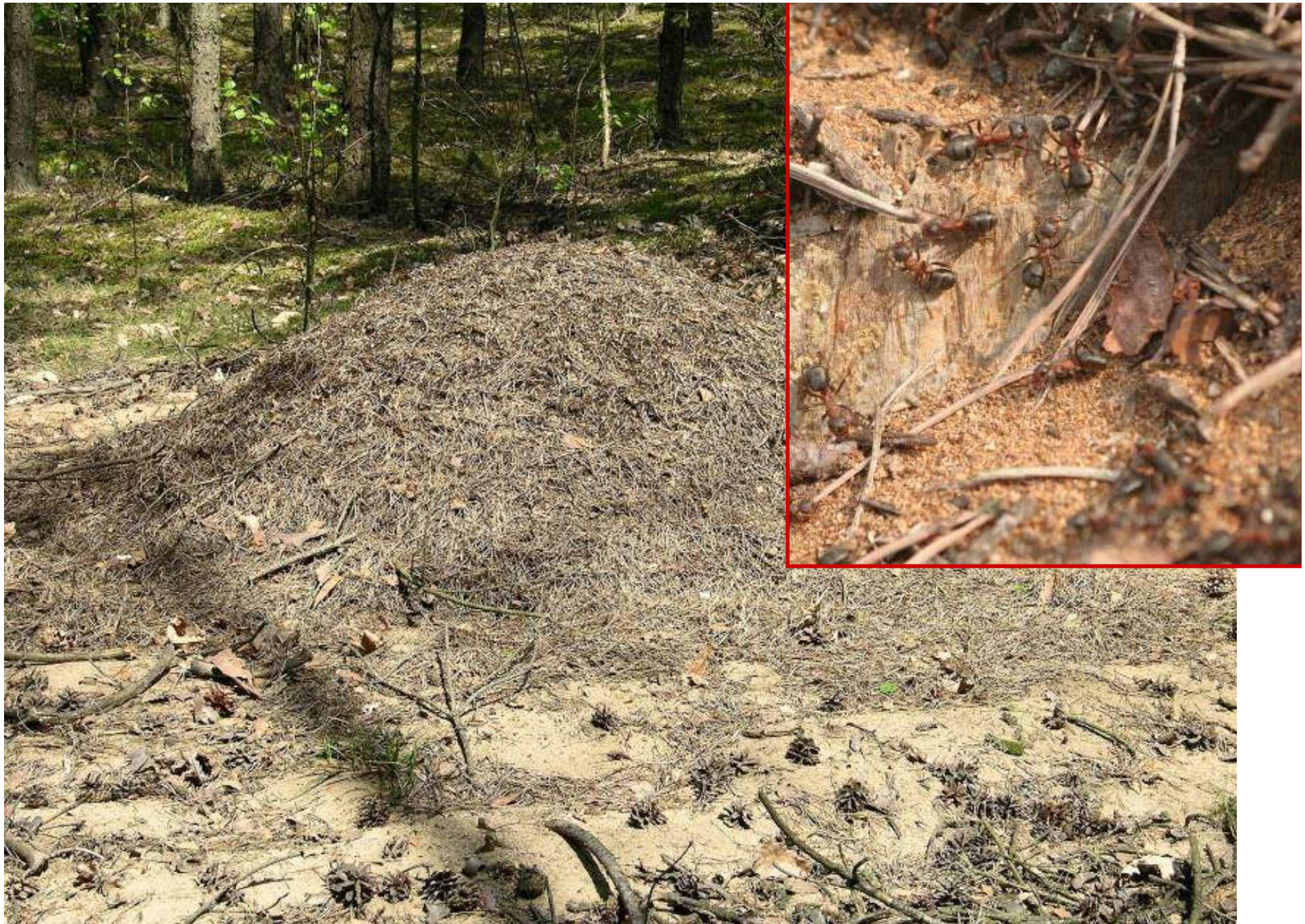
Przy ścieżce znajduje się ogromny kopiec mrowiska rudnicy