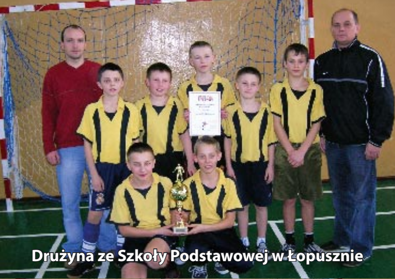
Drużyna ze Szkoły Podstawowej w Łopusznie