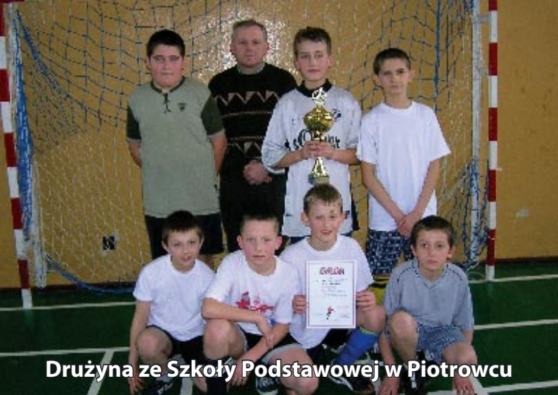
Drużyna ze Szkoły Podstawowej w Piotrowcu