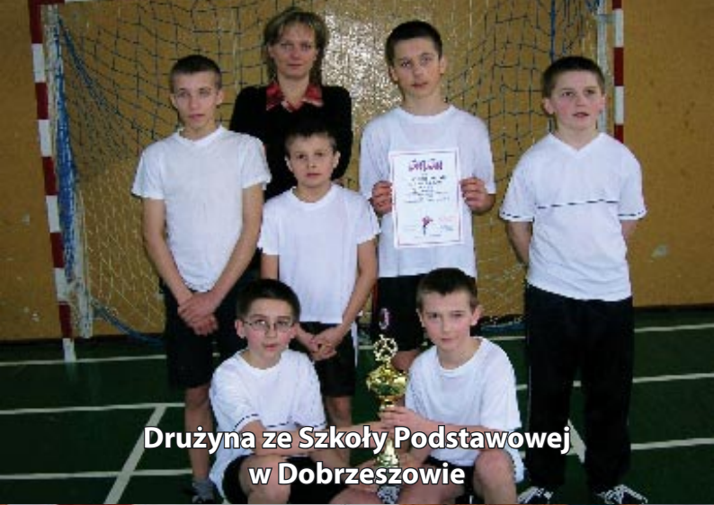
Drużyna ze Szkoły Podstawowej w Dobrzeszowie