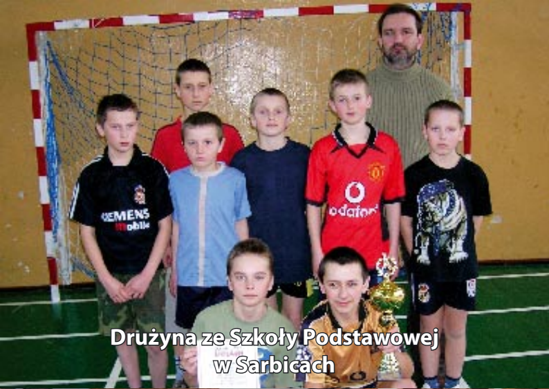
Drużyna ze Szkoły Podstawowej w Sarbicach