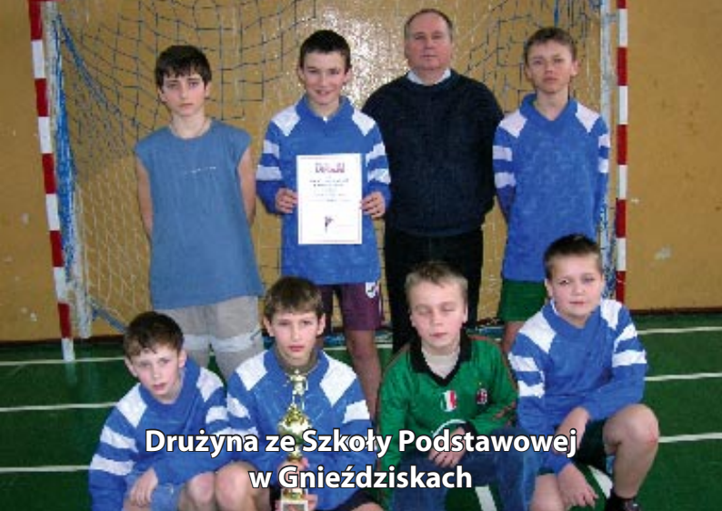
Drużyna ze Szkoły Podstawowej w Gnieździskach