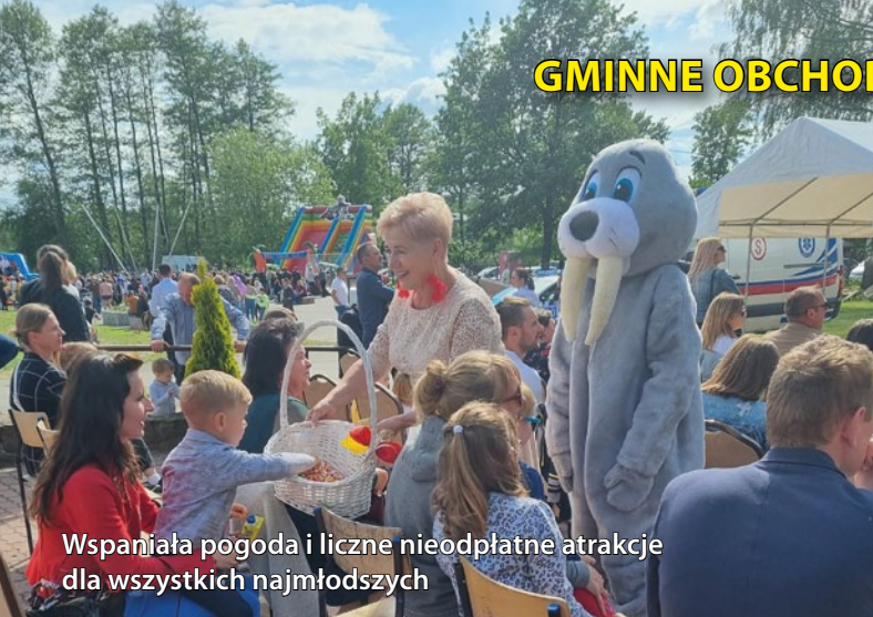
Wspaniała pogoda i liczne nieodpłatne atrakcje dla wszystkich najmłodszych