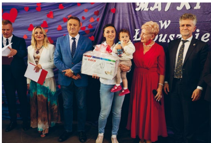
SZCZĘŚLIWI ZWYCIĘZCY LOTERII