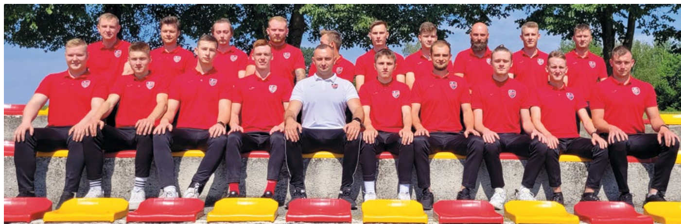
ZNAKOMITY SKŁAD DRUŻYNY PIŁKARSKIEJ „ZRYW ŁOPUSZNO”