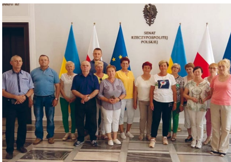
CZŁONKOWIE CHÓRU PARAFIALNEGO WIERNA RZEKA Z WIZYTĄ W SEJMIE RP