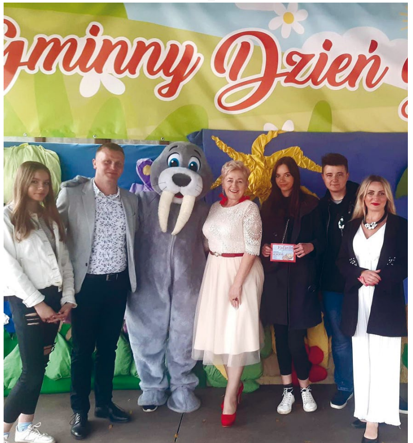
MŁODZIEŻOWA RADA GMINY W ŁOPUSZNIE POMAGAŁA DZIECIOM

Młodzież oraz dzieci mogli poznać zasady bezpiecznego zachowania podczas gier i zabaw prowadzonych przez animatorów z grupy „Kolowersi”.