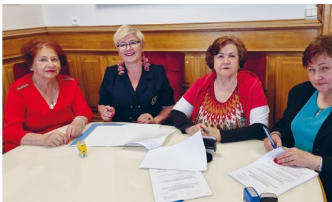
WÓJT GMINY I SKARBNIK PODPISUJĄ UMOWĘ Z ZARZĄDEM STOWARZYSZENIA UNIWERSYTET TRZECIEGO WIEKU W ŁOPUSZNI

Stowarzyszenie Ochotnicza Straż Pożarna z siedzibą w Łopusznie na zakup i naprawę instrumentów muzycznych, które służyć będą dalszemu upowszechnianiu tradycji narodowej i rozwojowi świadomości kulturowej;