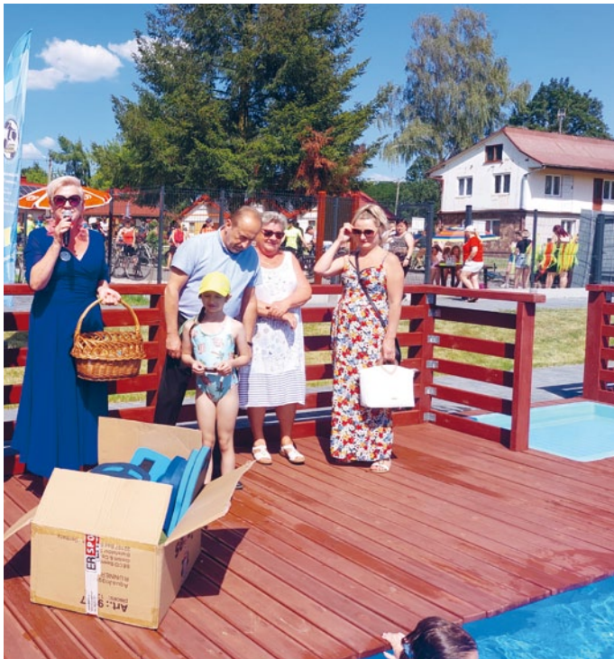
OFICJALNE OTWARCIE KOMPLEKSU LETNICH BASENÓW NA GOSW W ŁOPUSZNIE

25 czerwca 2022 r. uroczyście rozpoczęto sezon letni na łopuszańskich basenach . Bezpłatne atrakcje czekały na gości odwiedzających w tym dniu teren Gminnego Ośrodka Sportowo-Wypoczynkowego, m.in. dmuchaniec, malowanie twarzy, plectenie warkoczków przez Młodzieżową Radę Gminy Łopuszno, wata cukrowa czy bezpłatne wejście na baseny.