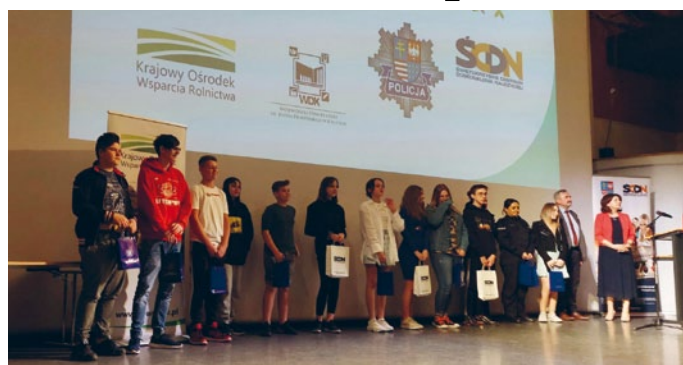
ŚWIĄTOKRZYJSKIE DNI PROFILAKTYKI

Drugą część spotkania stanowiły miniwykłady interaktywne o charakterze psychoedukacyjnym. Młodzi ludzie mieli okazję pozyskać wiele ważnych informacji o zdrowym odżywianiu i zdrowym stylu życia. Spotkanie z paniami policjantkami zwróciło ich uwagę na temat agresywnych zachowań w internecie – hejtu i mowy nienawiści. Słowa przedstawicielek Wydziału Prewencji były ważne nie tylko dlatego, że jeszcze