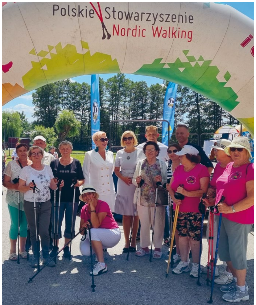
GOŚCINNE ŁOPUSZNO PODEJMOWAŁO ZACZYCH SENIORÓW Z WOJEWÓDZTWA ŚWIĘTOKRZYSKIEGO