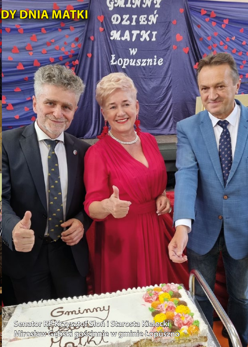
Senator RP Krzysztof Słoń i Starosta Kielecki Mirosław Gębski gościnnie w gminie Łopuszno