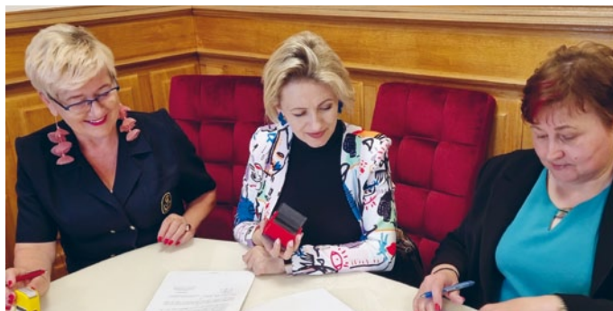
STOWARZYSZENIE „AKTYWNE KOBIETY GNIEŹDZISK” Z DOFINANSOWANIEM NA PRZEPROWADZENIE WARSZTATÓW MUZYCZNYCH I NAGRANIE UTWORU

Stowarzyszenie „Aktywne Kobiety Gnieździsk” z siedzibą w Gnieździskach na przeprowadzenie warsztatów muzyczno – artystycznych w celu rozwoju umiejętności wokalnych i nagranie utworu;