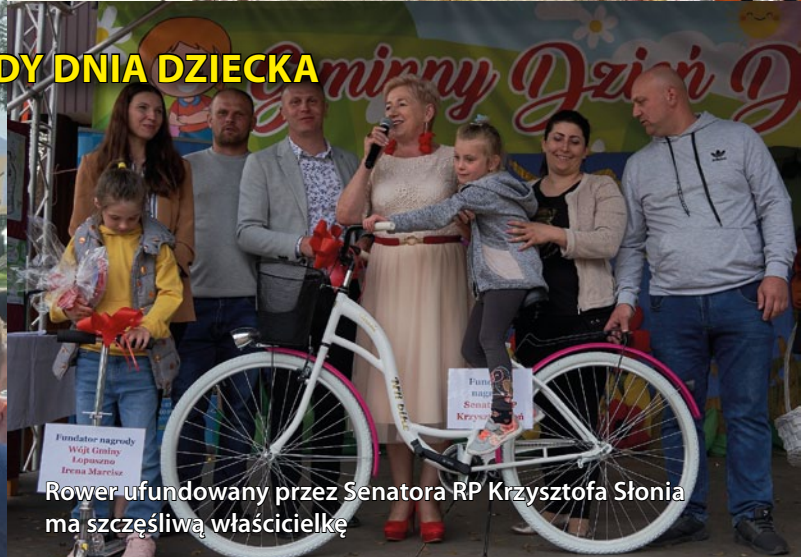
Rower ufundowany przez Senatora RP Krzysztofa Słonia ma szczęśliwą właścicielkę