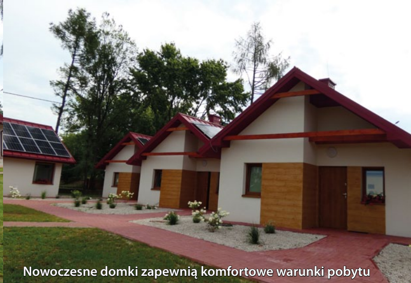
Nowoczesne domki zapewnią komfortowe warunki pobytu