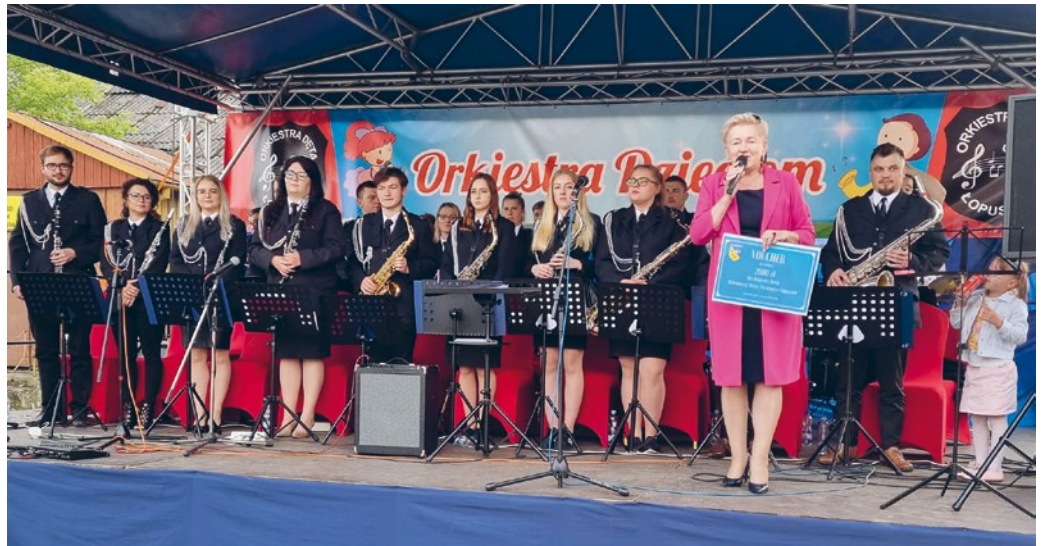
PIĘKNE WYDARZENIE KULTURALNE ORKIESTRA DZIECIOM Z UDZIAŁEM ORKIESTRY DĘTEJ W ŁOPUSZNIE