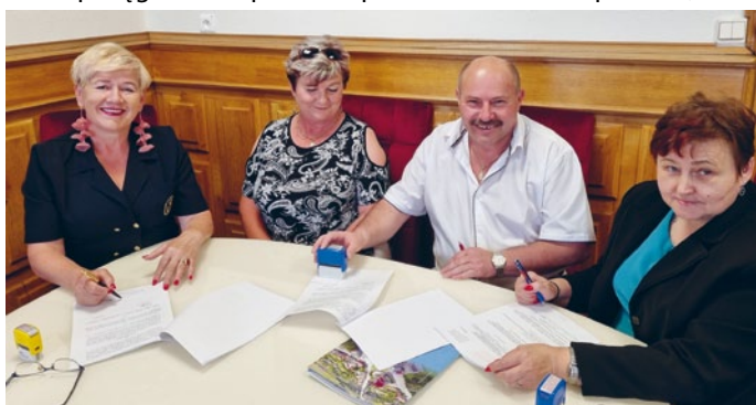
TRADYCJA NARODOWA PIELĘGNOWANA BĘDZIE PRZEZ „ZESPÓŁ PIEŚNI I TAŃCA ŁOPUSZNO”

Stowarzyszenie Przyjaciół, Miłośników Muzyki i Tańca Ludowego z siedzibą w Eustachowie Dużym na zakup instrumentów muzycznych w ramach realizacji zadania pn. „Tradycja narodowa pielęgnowana przez Zespół Pieśni i Tańca Łopuszno”;