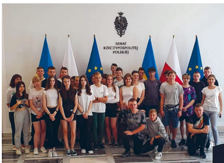
UCZNIOWIE KLAS 8 SZKOŁY PODSTAWOWEJ IM. JANA PAWŁA II W ŁOPUSZNIE UCZESTNICZYLI W WYJEŹDZIE STUDYJNYM DO WARSZAWY