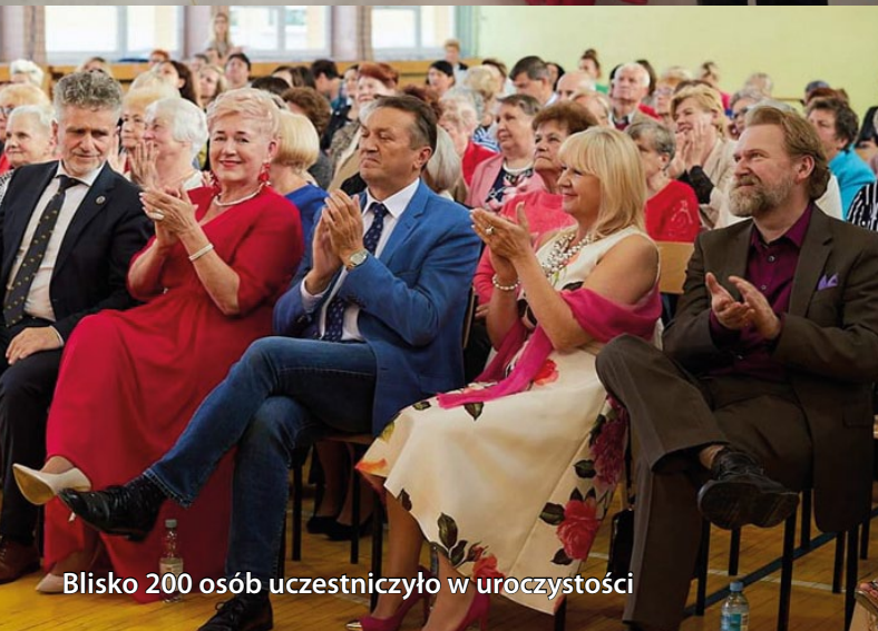
Blisko 200 osób uczestniczyło w uroczystości