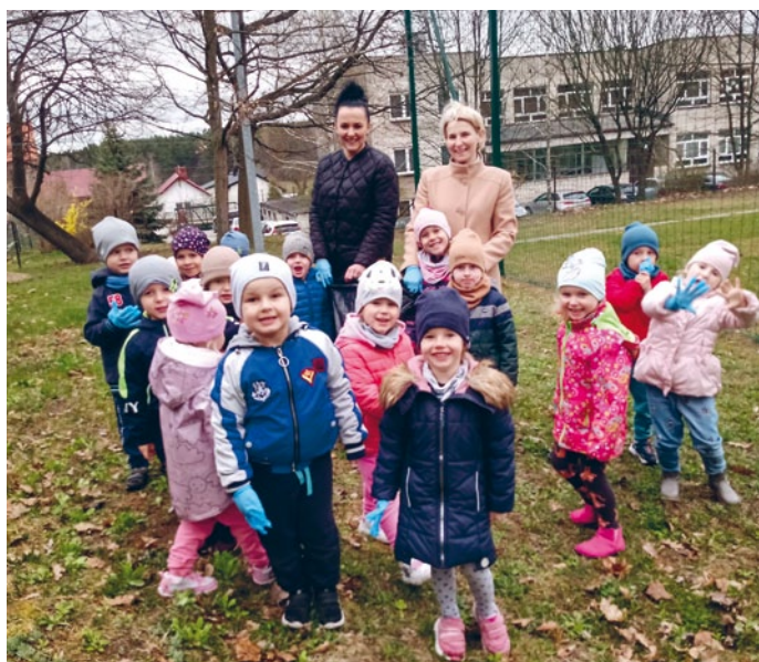
BIEDRONECZKI ZE SP W GNIEŹDZISKACH POSPRAWDZAŁY CZY NA BOISKU SZKOLNYM JEST CZYSTO