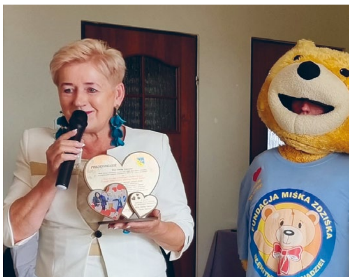
SERCE ZA OKAZYWANE NA CO DZIEŃ W DZIAŁANIACH SERCE DLA FUNDACJI MIŚKA ZDZIŚKA BŁĘKITNY PROMYK NADZIEI