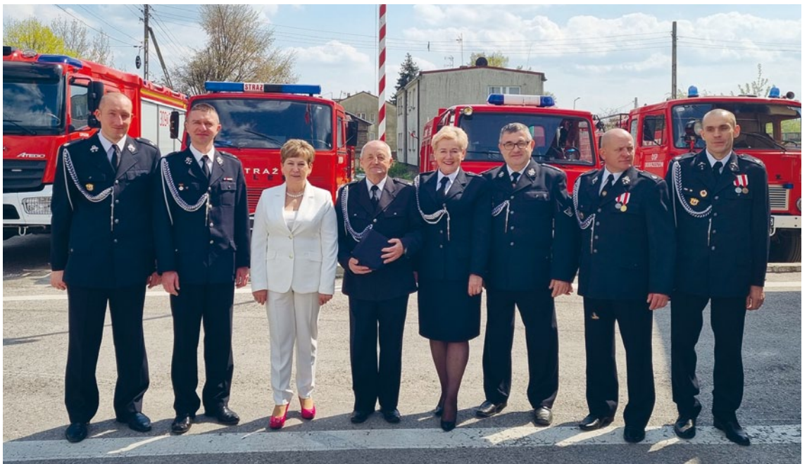
ŚWIĘTO STRAŻAKA W GMINIE ŁOPUSZNO