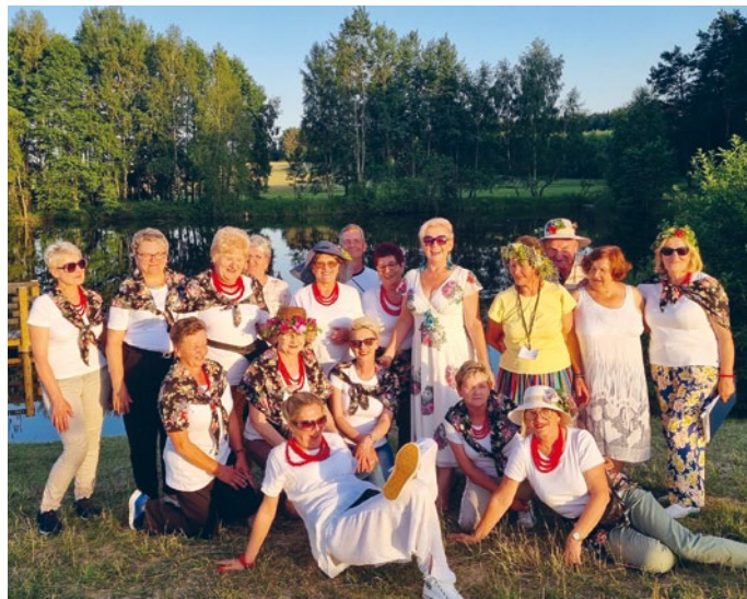
LASOCIŃSKIE WIANKI W GMINIE ŁOPUSZNO LEKCJĄ TRADYCJI NARODOWEJ SŁUŻĄCEJ INTEGRACJI ŚRODOWISKA