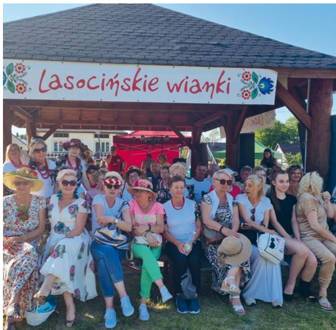
AKTYWNY UDZIAŁ MIESZKAŃCÓW W IMPREZIE

„Skala”. Impreza uwzględniała wspaniały występ, stanowiący lekcję obrzędów ludowych, umożliwiając integrację środowiska lokalnego.