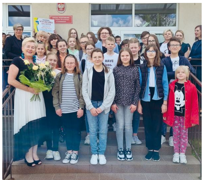
PANI WÓJT PRZYJECHAŁA, ABY OSOBIŚCIE ŻYCZYĆ NAM UDANEGO WYJAZDU