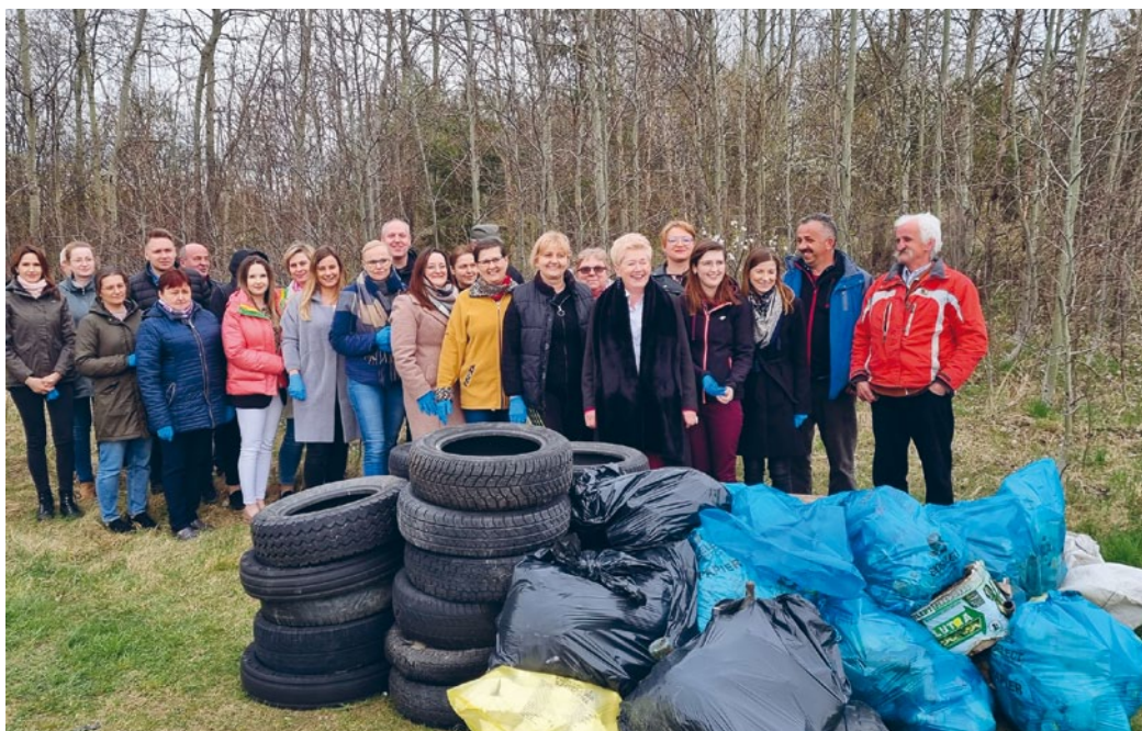
PRACOWNICY URZĘDU GMINY W ŁOPUSZNI WSPARLI INICJATYWĘ PROEKOLOGICZNĄ

Pracownicy Referatu Gospodarczego Urzędu Gminy w Łopusznie postanowili samodzielnie zadbać o teren Wzgórza