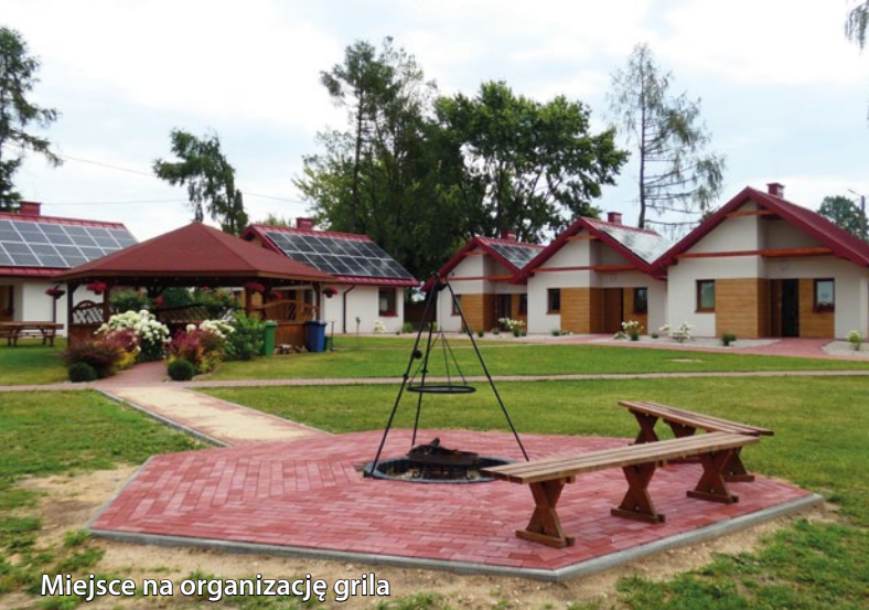
Miejsce na organizację grilla