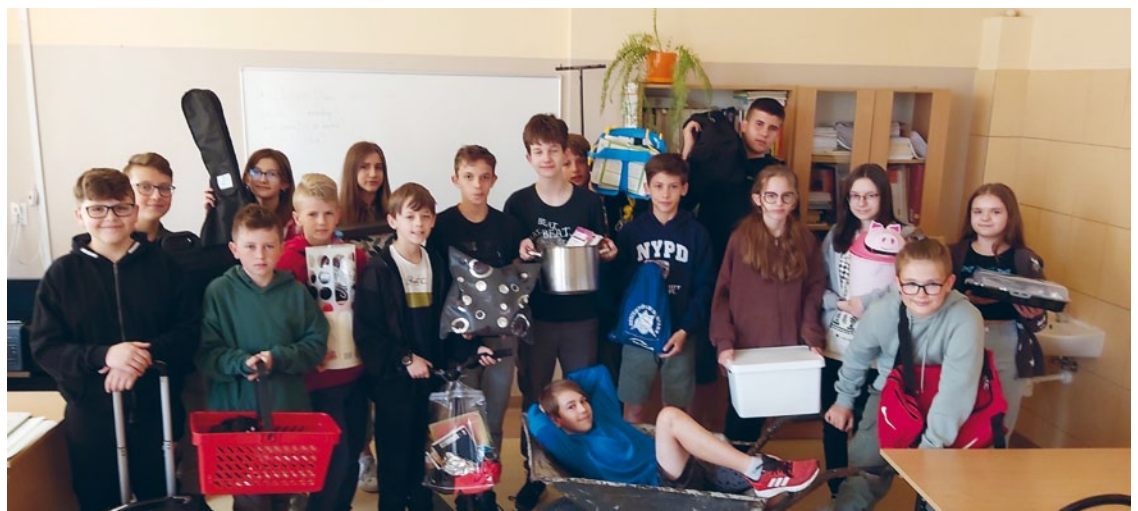
DZIEŃ BEZ PLECACA, POMYSŁY NA NOSIDŁA DLA KSIĄŻEK I ZESZYTÓW W KLASIE VII

Na zajęciach z wychowawcami uczniowie rozmawiali o pozytywnych emocjach, a na zajęciach świetlicowych powstał – łańcuch pozytywnych emocji. Uczniowie kl. III uczestniczyli w warsztatach profilaktycznych: Bądź kumplem – nie dokuczaj! Przedszkolaczki we wtorek obchodziły Dzień Mamy i Taty, z okazji którego przygotowały przepiękne przedstawienie, natomiast w środę uczestniczyły w pikniku z okazji Dnia Dziecka. Starsi uczniowie, z okazji tego święta, brali udział w rozgrywkach sportowych. Podczas długich przerw uczniowie płąsali w rytm Belgijki lub piosenek dla najmłodszych. Ogromną pomysłowością wykazali się wszyscy uczniowie podczas Dnia bez Plecaka , co uwieczniliśmy