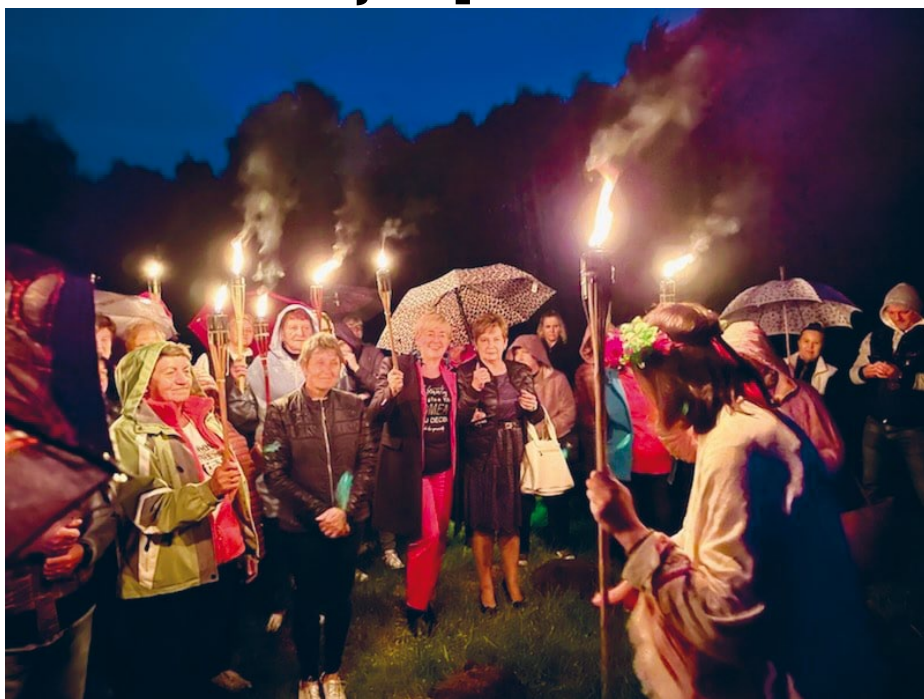
BAJDUŁY SŁOWIAŃSKIE W ŁOPUSZNIE. DZIĘKUJEMY ZA OBECNOŚĆ, INTEGRACJĘ ŚRODOWISKA ŁOPUSZAŃSKIEGO