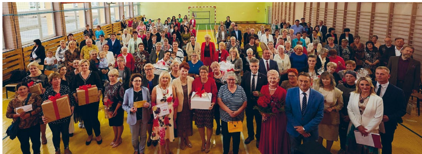
GMINNE ŚWIĘTO ZORGANIZOWANE Z MIŁOŚCI DO WSZYSTKICH MAM