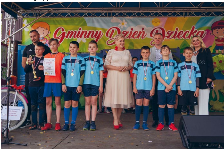
LAUREACI TURNIEJU PIŁKI NOŻNEJ