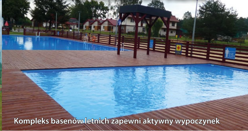
Kompleks basenów letnich zapewni aktywny wypoczynek