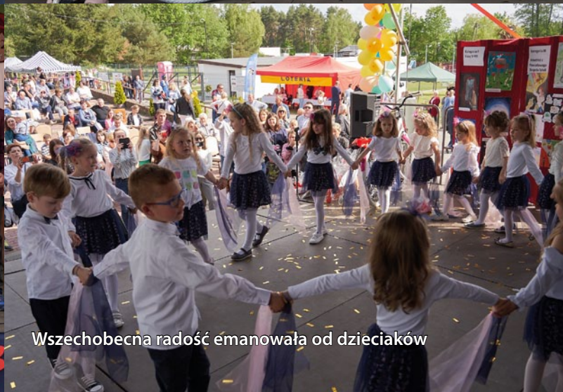
Wszeloboczną radość emanowała od dzieciaków