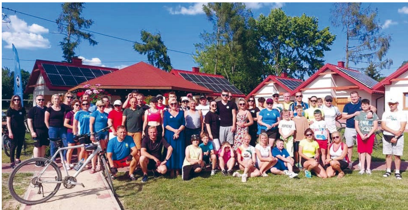
LICZNY UDZIAŁ MIESZKAŃCÓW I GOŚCI W GMINNYM RAJDZIE ROWEROWYM

Łopusznie, Gminny Ośrodek Pomocy Społecznej w Łopusznie, Fundacja „Restart”, Gminny Ośrodek Kultury w Łopusznie, Stowarzyszenie „Czempion”, Fundacja PO-MOST. Mimo wysokiej