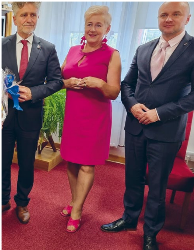
SENATOR RP KRZYSZTOF SŁOŃ WRAZ Z WICEWOJEWODĄ ŚWIĘTOKRZYSKIM RAFAŁEM NOWAK Z WIZYTĄ W URZĘDZIE GMINY ŁOPUSZNO