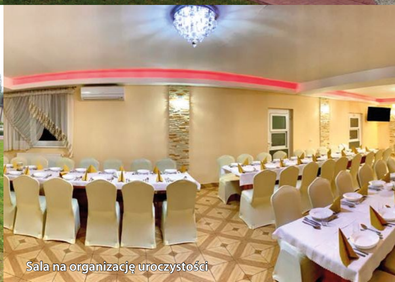
Sala na organizację uroczystości