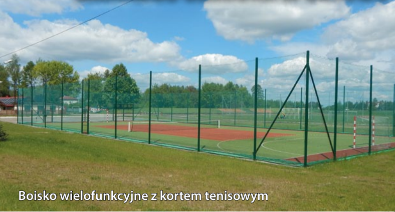
Boisko wielofunkcyjne z kortem tenisowym