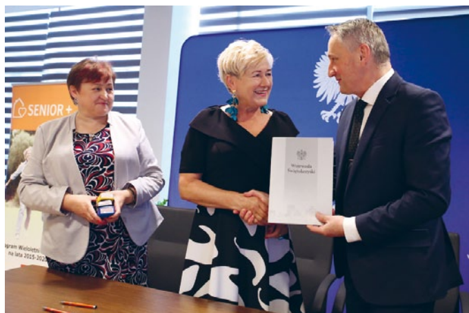
PODPISANIE UMOWY W PROGRAMIE SENIOR PLUS

Dzięki w/w korzyściom wynikającym z uczestnictwa w zajęciach przedłużona zostaje potencjalna możliwość samodzielnego funkcjonowania osób starszych w środowisku i wzmocnienie poczucia własnej wartości.