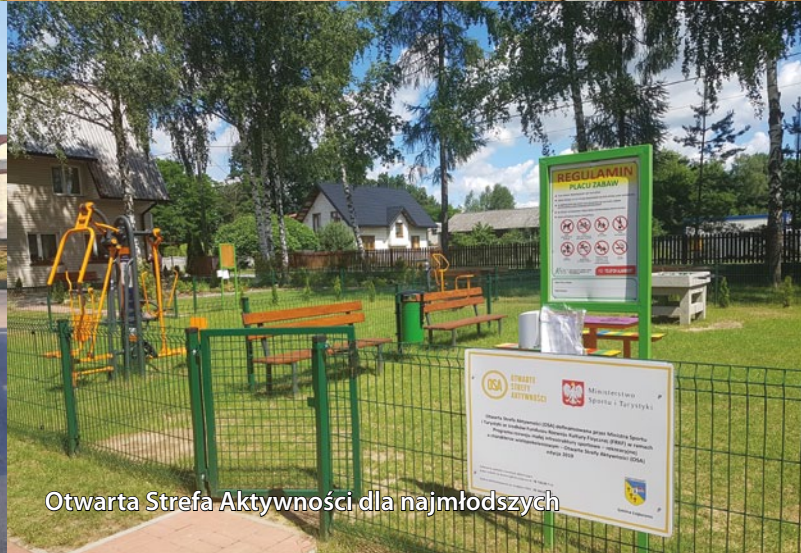
Otwarta Strefa Aktywności dla najmłodszych