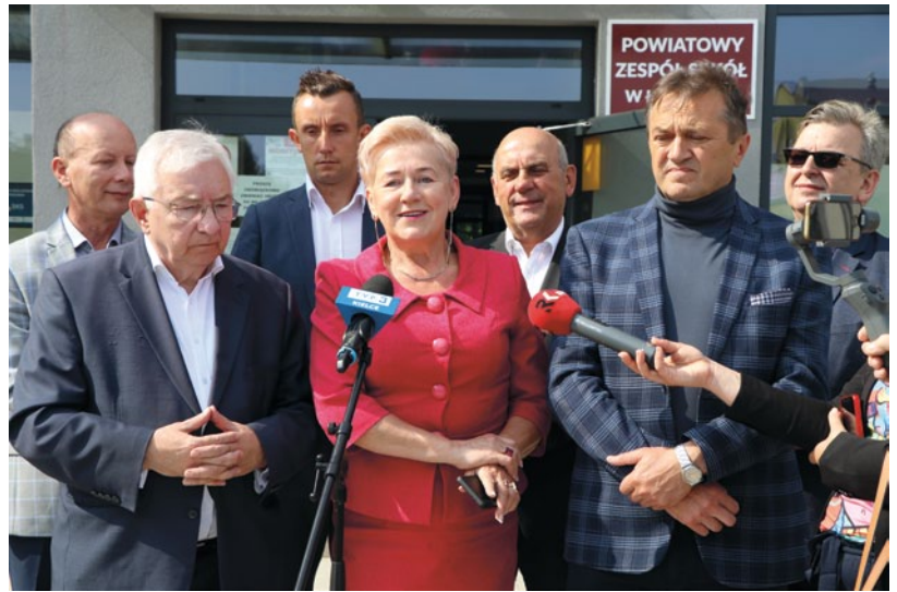
KONFERENCJA PRASOWA PRZEPROWADZONA ZOSTAŁA NA TERENIE GMINY ŁOPUSZNO

Z kolei, projekt pn. „Modernizacja stacji uzdatniania wody w miejscowości Wielebnow” o wartości 3 miliony zł będzie polegał na kompleksowej modernizacji stacji uzdatniania wody w formule zaprojektuj i wybuduj na podstawie opracowanego programu funkcjonalno – użytkowego. W ramach inwestycji wymieniony zostanie układ napowietrzania wody surowej oraz wszystkie rurociągi technologiczne wraz z pompami głębinowymi dystrybuujące wodę w stacji uzdatniania wody. Należy zaznaczyć, że wszystkie prace na jedynej stacji zaopatrującej w wodę mieszkańców gminy Łopuszno będą prowadzone w taki sposób, aby mieszkańcy gminy tego nie zauważali. Głównym celem modernizacji stacji uzdatniania wody jest zapewnienie bezawaryjnej jej pracy na kolejne - co najmniej 30 lat, zapewnienie założonej efektywności uzdatniania wody, a także poprawa automatyki poprzez zastosowanie nowoczesnych technologii.