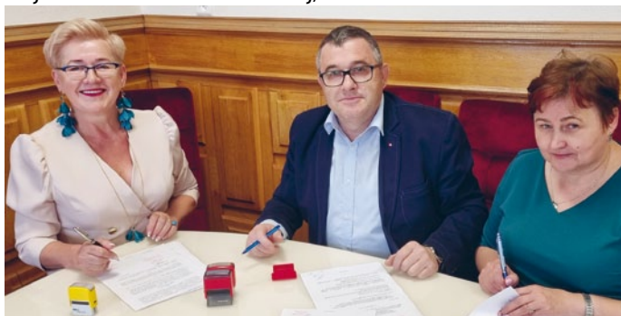
ORKIESTRA DĘTA DZIAŁAJĄCA PRZY OSP W ŁOPUSZNI POZYSKAŁA DOFINANSOWANIE NA ZAKUP I REMONT INSTRUMENTÓW

Stowarzyszenie Ochotnicza Straż Pożarna z siedzibą w Łopusznie na zakup i naprawę instrumentów muzycznych, które służyć będą dalszemu upowszechnianiu tradycji narodowej i rozwojowi świadomości kulturowej;