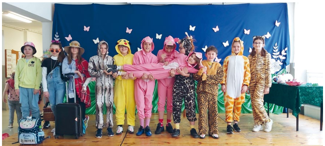
NIETYPOWA MODA NA JEDEN DZIEŃ