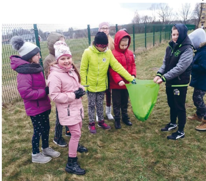
W AKCJĘ WŁĄCZYLI SIĘ UCZNIOWIE SP W DOBRZESZOWIE