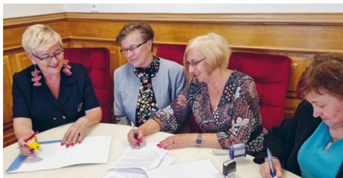
STOWARZYSZENIE KOBIETY ŁOPUSZNA Z DOFINANSOWANIEM NA REALIZACJĘ PROJEKTU PROZDROWOTNEGO

a) Stowarzyszenie „Kobiety Łopuszna” z siedzibą w Łopusznie na realizację zadania prozdrowotnego polegającego, m.in. na przeprowadzeniu spektaklu prozdrowotnego pn. „W kolejce po zdrowie”;