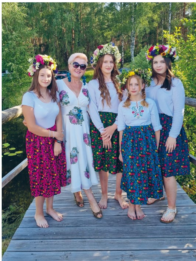
LASOCIŃSKIE WIANKI W GMINIE ŁOPUSZNO