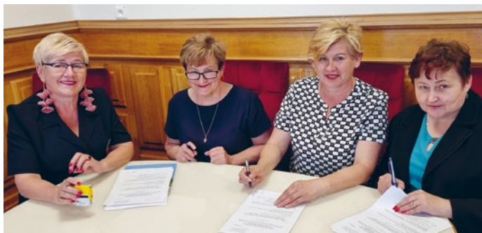
STOWARZYSZENIE NASZE ŁOPUSZNO ZREALIZUJE PROJEKT PN. SZLAKIEM MĘCZENSTWA WSI POLSKIEJ

Stowarzyszenie „NASZE ŁOPUSZNO” z siedzibą w Łopusznie na realizację projektu pn. „Szlakiem męczeństwa wsi polskiej”;