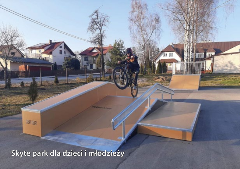
Skyte park dla dzieci i młodzieży