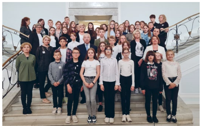
NASZA GRUPA NA SŁYNNYCH SCHODACH W SEJMIE RP