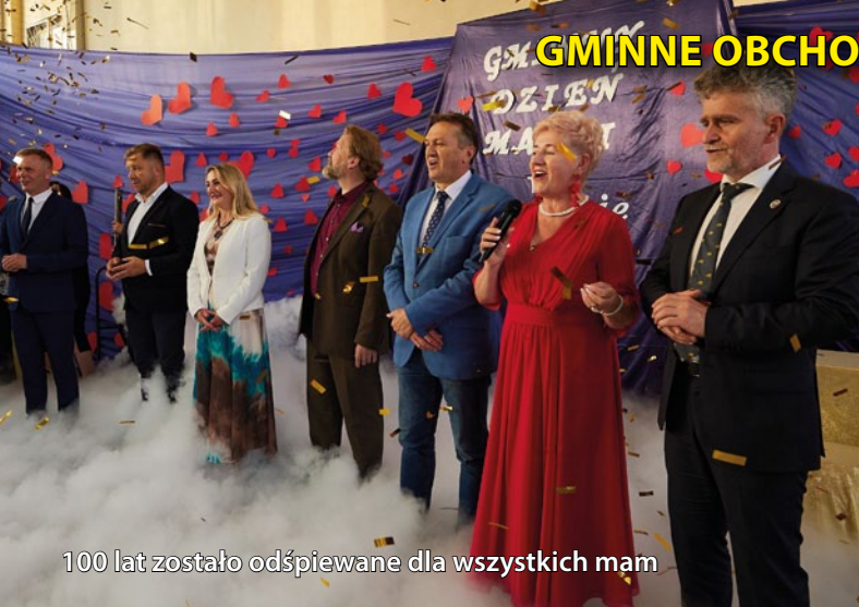
100 lat zostało odśpiewane dla wszystkich mam