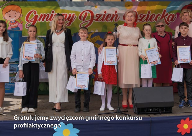
Gratulujemy zwycięzcom gminnego konkursu profilaktycznego