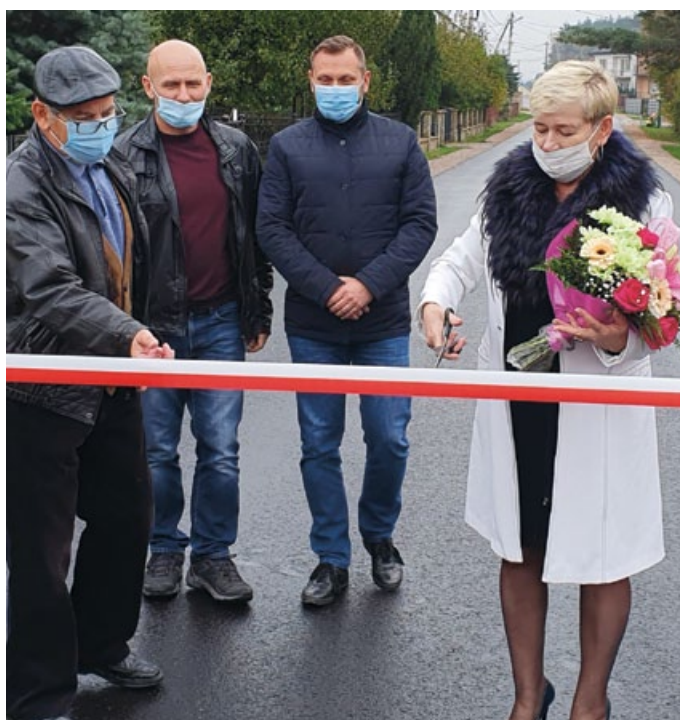
ODBIÓR DROGI W RUDZIE ZAJĄCZKOWSKIEJ W DNIU 23.10.2020 R.