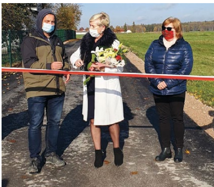
OTWARCIE DROGI W PODEWSIU W DNIU 30.10.2020 R.