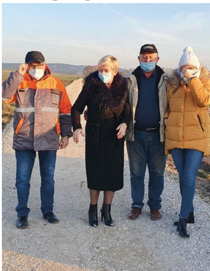
ODBIÓR DROGI W SARBICACH W DNIU 25.11.2020 R.