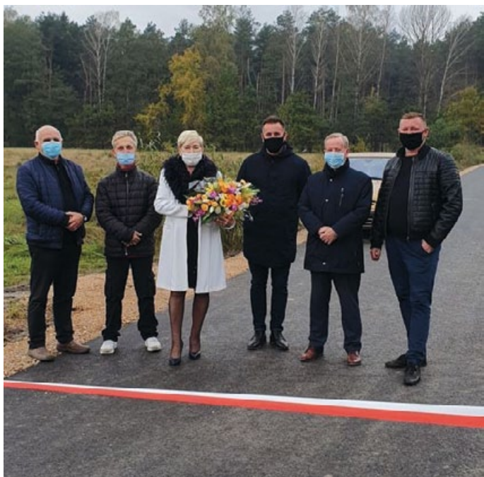
UROCZYSTY ODBIÓR DROGI W FANISŁAWICACH W DNIU 23.10.2020 R. Z UDZIAŁEM WDZIĘCZNYCH MIESZKAŃCÓW